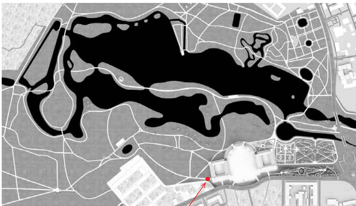
Место предполагаемого размещения информационной надписи