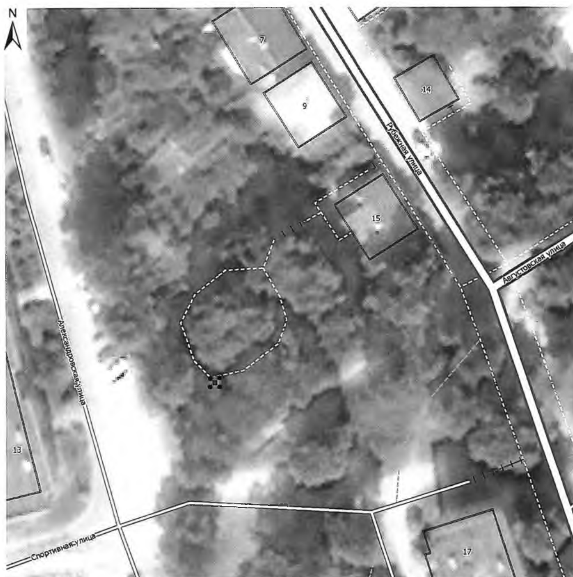
Карта (схема) границ территории объекта культурного наследия

Границы территории объекта культурного наследия регионального значения «Памятник М.И. Калинину (из бронзы и гранита)» по адресу: Ленинградская область, Выборгский муниципальный район, г. Выборг, ул. Рубежная, д. 15