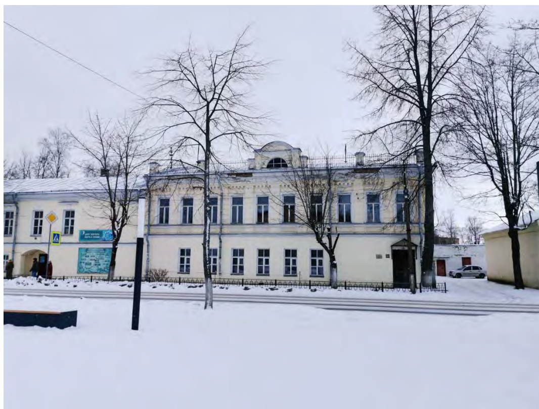
36. Фасад здания, входящего в «Комплекс жилых и хозяйственных зданий купцов Кукиных, кон. XIX в.: жилой дом с лавками, конторой, погребом и пекарней; жилой дом с пекарней и ледником; жилой флигель для рабочих с баней и конюшней», пр. Карла Маркса д. 38, д. 38а. Направление съемки северо-запад.