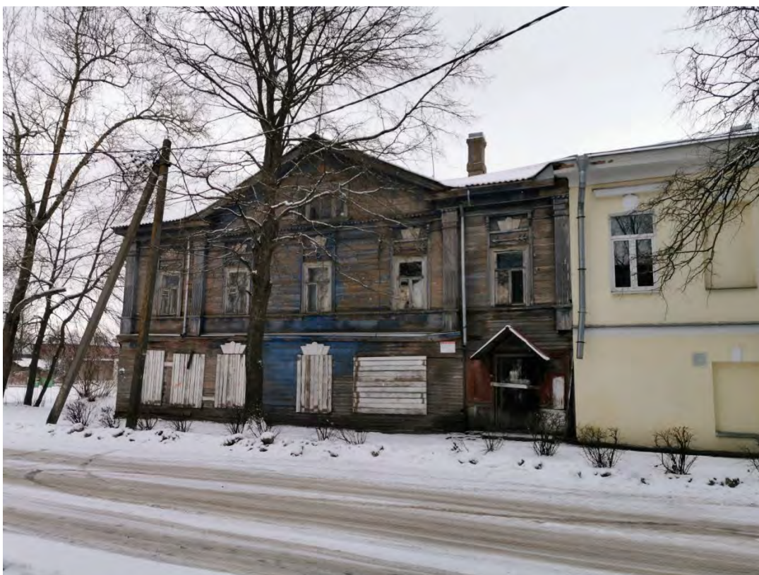
34. Вид на фасад дома, входящего в «Комплекс жилых и хозяйственных зданий купцов Спировых, XIX в.: каменный жилой дом с магазинами, деревянный жилой дом с булочной и пекарней» по стороне ул. М. Горького, пр. Карла Маркса д. 36/1. Направление съемки северо-восток.