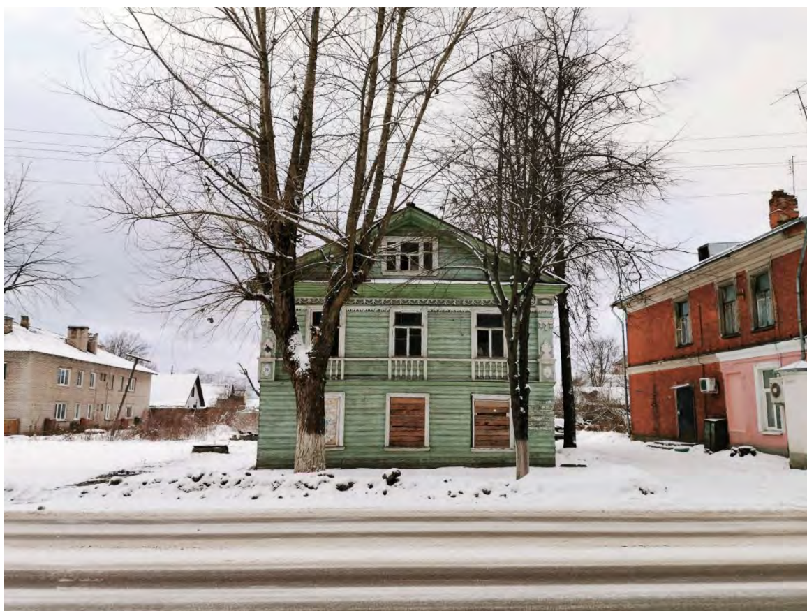
18. Вид на лицевой и торцевой фасады здания, входящего в «Комплекс жилых домов купцов Бартовых, XIX в.: жилой дом деревянный, вт. пол. XIX в.; жилой дом каменный, сер. XIX в.», пр. Карла Маркса д. 20. Направление съемки северо-запад.