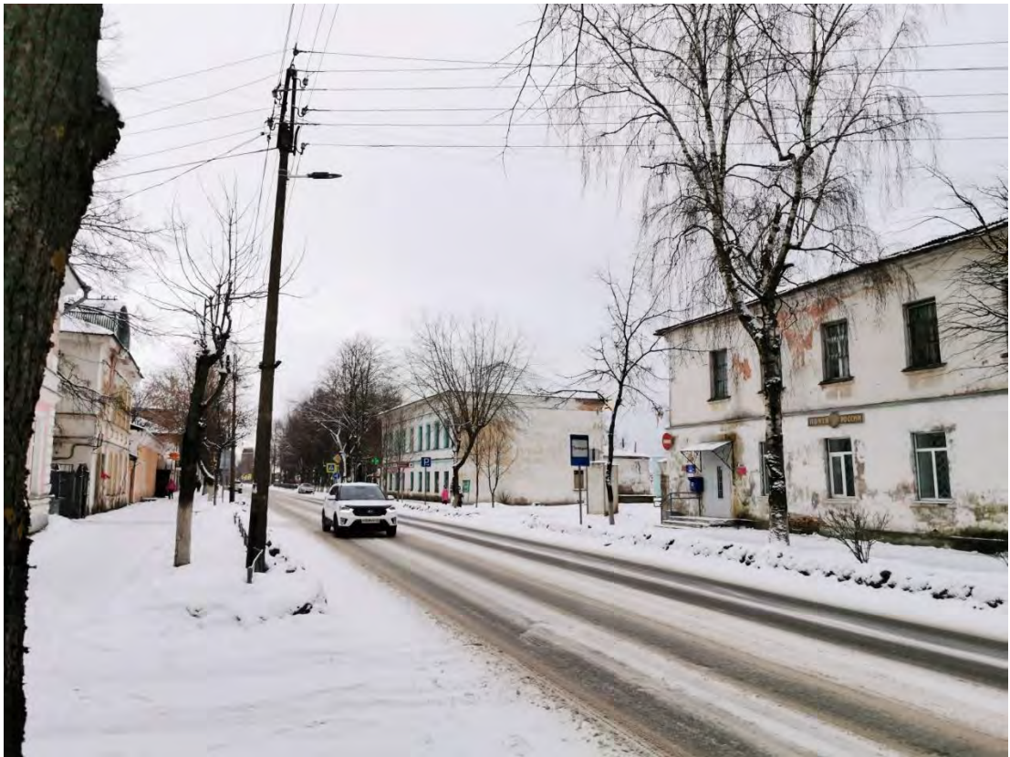
15. Общий вид пр. Карла Маркса. Направление съемки северо-восток.