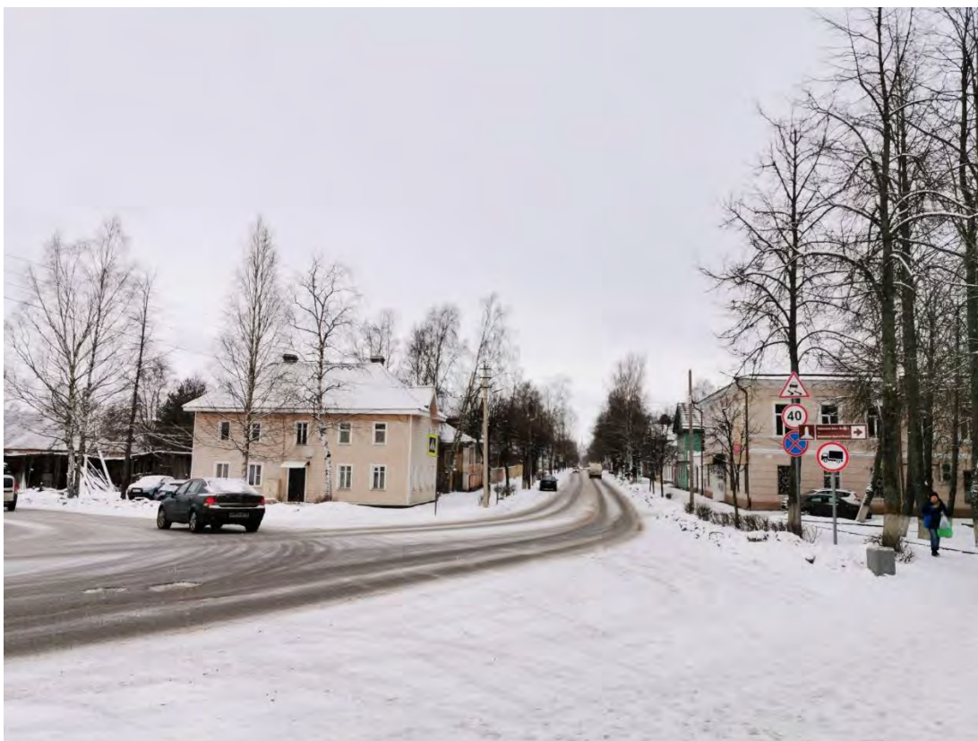
3. Вид на пр. Карла Маркса от пересечения со Староладожским каналом (ул. Пролетарский канал). Направление съемки северо-восток.