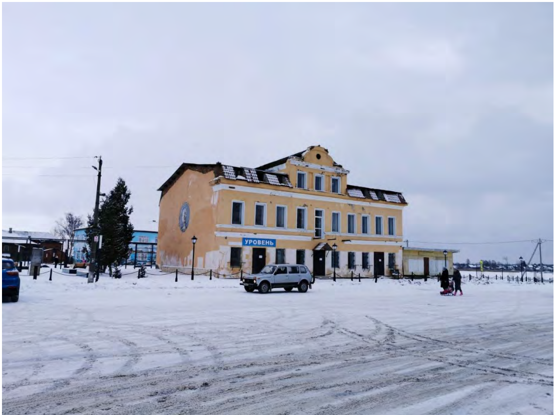
41. Лицевой фасад здания «Жилой дом и гостиница Бельшева, 2-ая пол. XIX вв.», площадь им. Кирова, д. 1/28. Направление съемки восток.