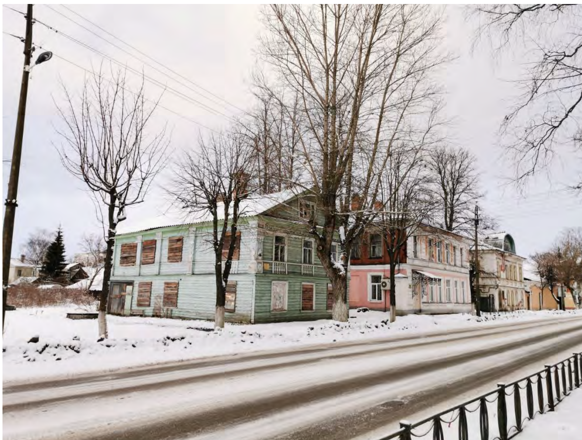
17. Общий вид пр. Карла Маркса. Направление съемки северо-запад.