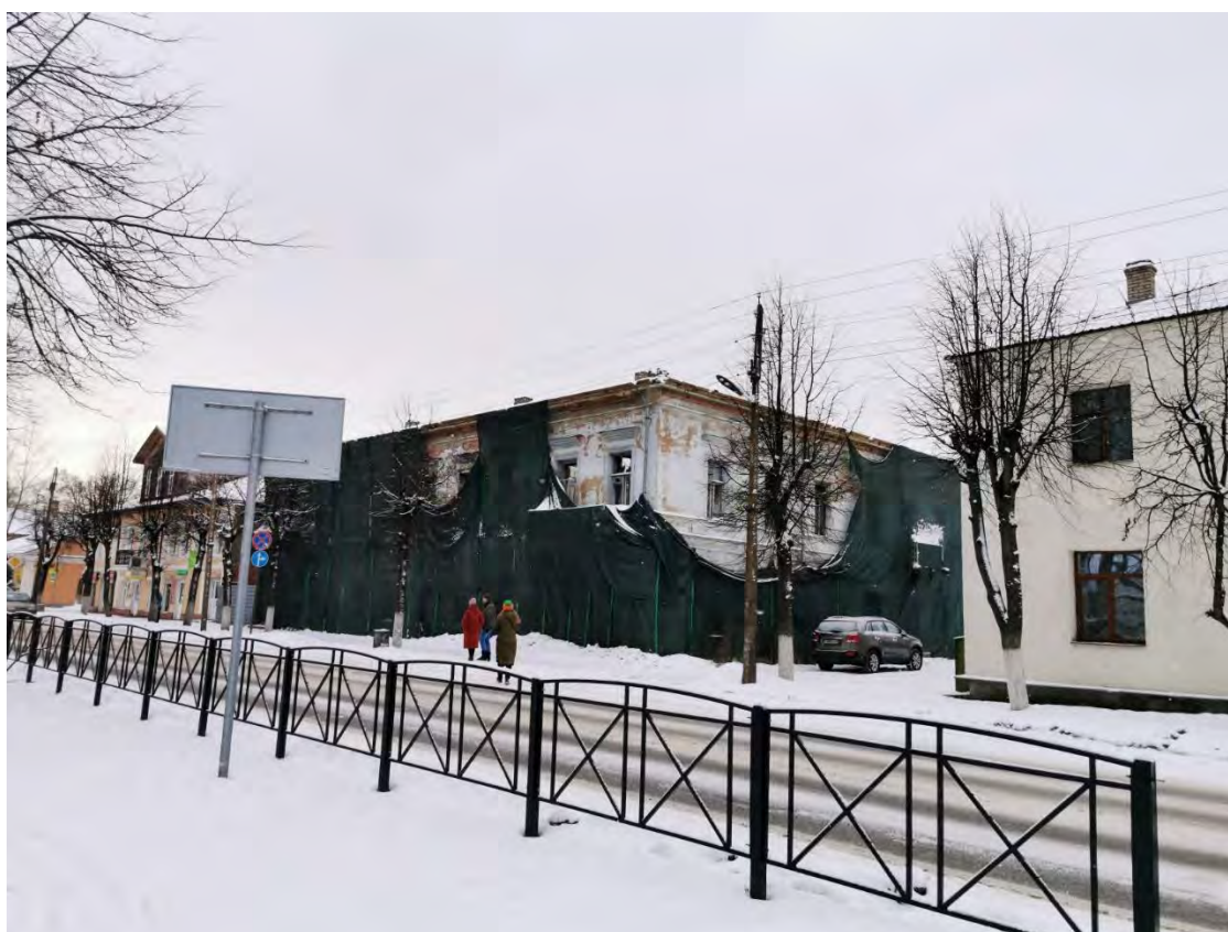
28. Лицевой и торцевой фасады «Дома, в котором в годы Великой Отечественной войны размещался штаб Ладужской военной флотилии» пр. Карла Маркса, д. 30. Направление съемки запад.