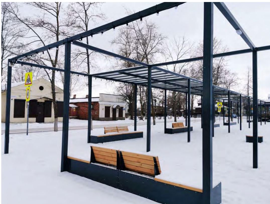
43. Общий вид сквера по пр. Карла Маркса. Направление съемки север.