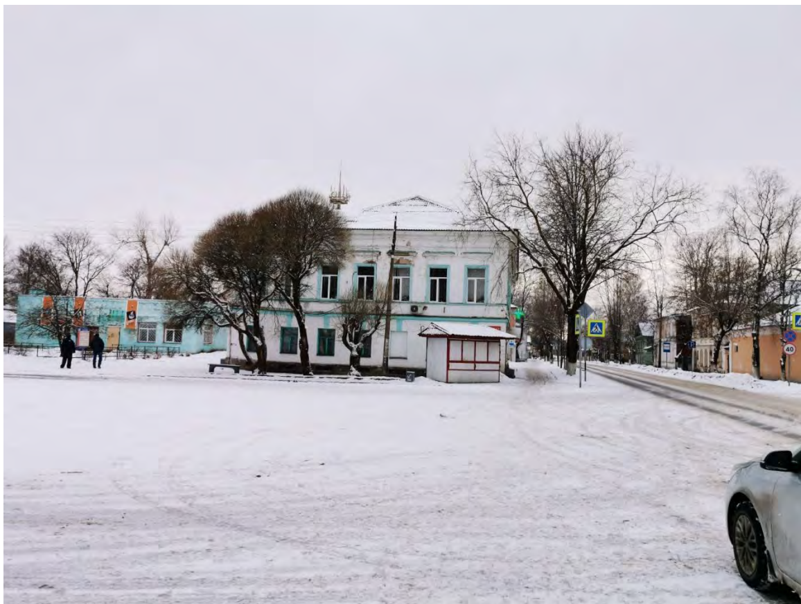
24. Лицевой и торцевой фасады «Здания городского училища, 1841 г.» пр. Карла Маркса, д. 27/10 на пересечении с ул. Пионерской. Направление съемки юго-запад.