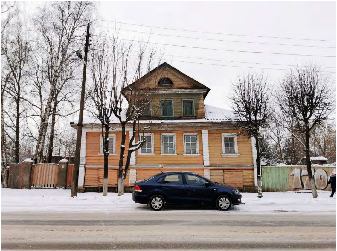
11. Лицевой фасад здания значения «Жилой дом - б. дом купца Бельшева, 1881 г.», пр. Карла Маркса, д.14. Направление съемки северо-запад.