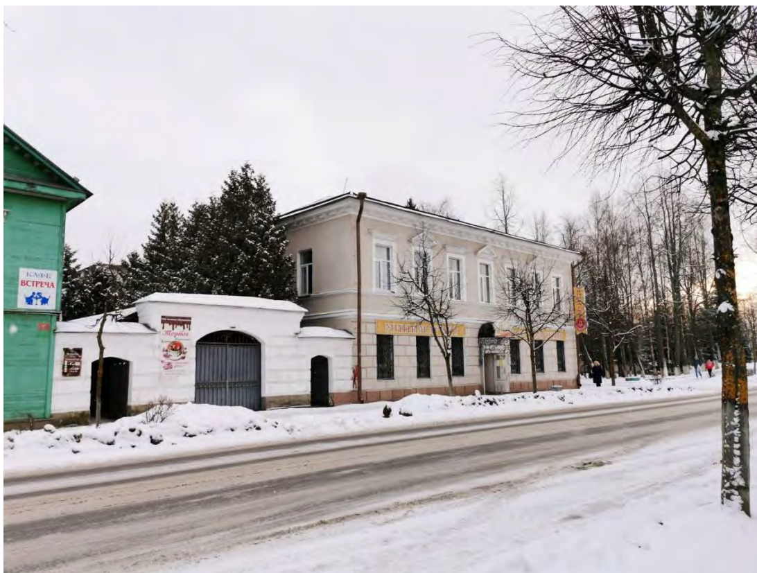
5. Лицевой фасад здания, входящего в «Комплекс жилых домов, впоследствии Земская управа, сер. XIX в: дом жилой, впоследствии - здание Земской управы, сер. XIX в.; жилой дом деревянный, кон. XIX в.; ограда с воротами», пр. Карла Маркса, д. 11. Направление съемки юг.