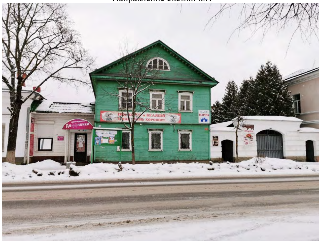
6. Вид на «Комплекс жилых домов, впоследствии Земская управа, сер. XIX в: дом жилой, впоследствии - здание Земской управы, сер. XIX в.; жилой дом деревянный, кон. XIX в.; ограда с воротами», пр. Карла Маркса, д. 11, 13. Направление съемки юго-восток.