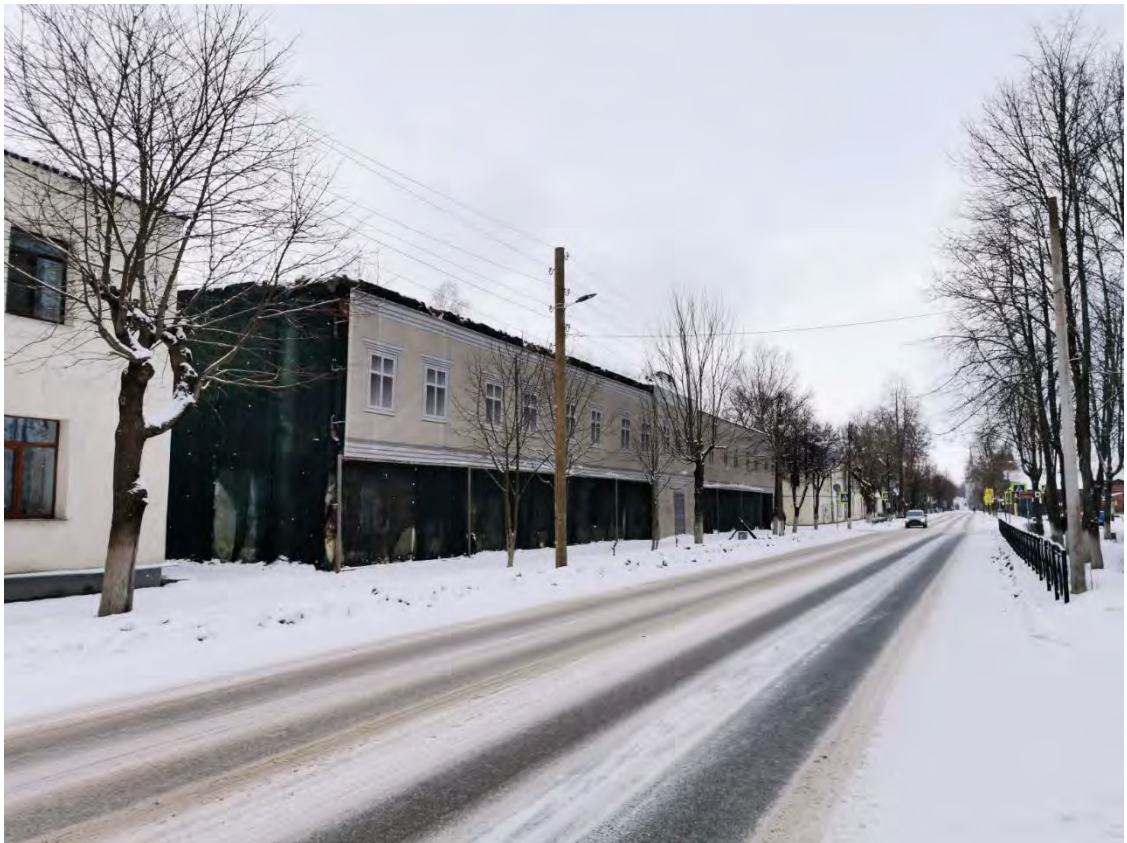
29. Лицевой фасад «Комплекс зданий бывшей городской управы, женской гимназии и училища (перестройка - арх. М.А. Шурупов); здание кладовой и ледника; остатки ограды», пр. К. Маркса, д.34/2. Направление съемки северо-восток.