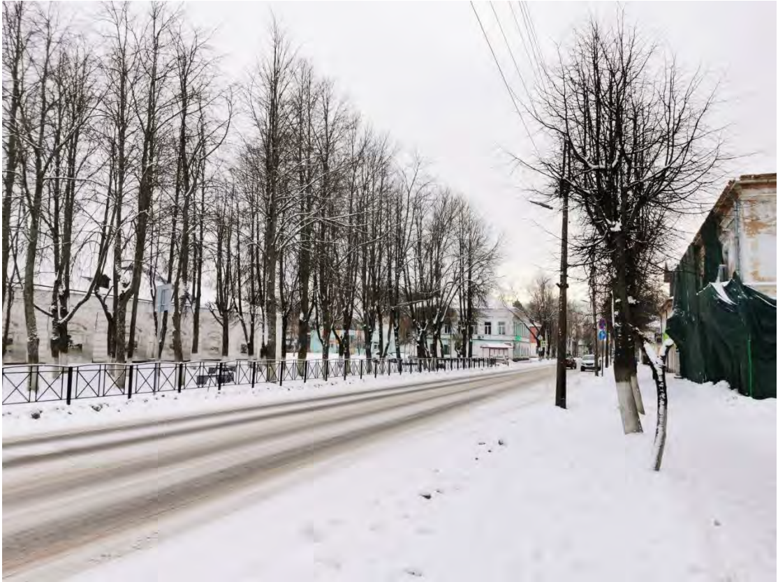
31. Вид на лицевой фасад «Гостиного двора», пр. Карла Маркса, д. № 29 Направление съемки юго-запад.