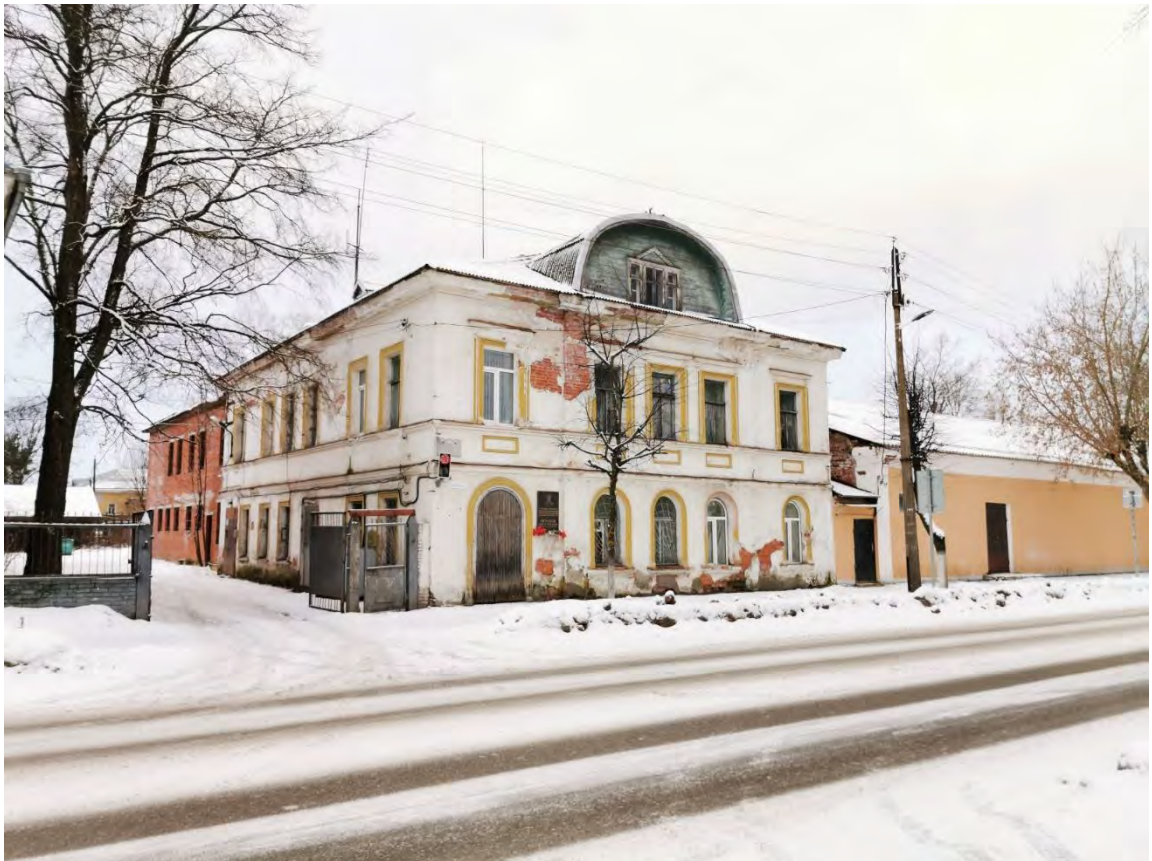
21. Лицевой фасад здания «Бывший дом Марфина, впоследствии богадельня, сер. XIX в.» пр. Карла Маркса, д. 24. Направление съемки север.