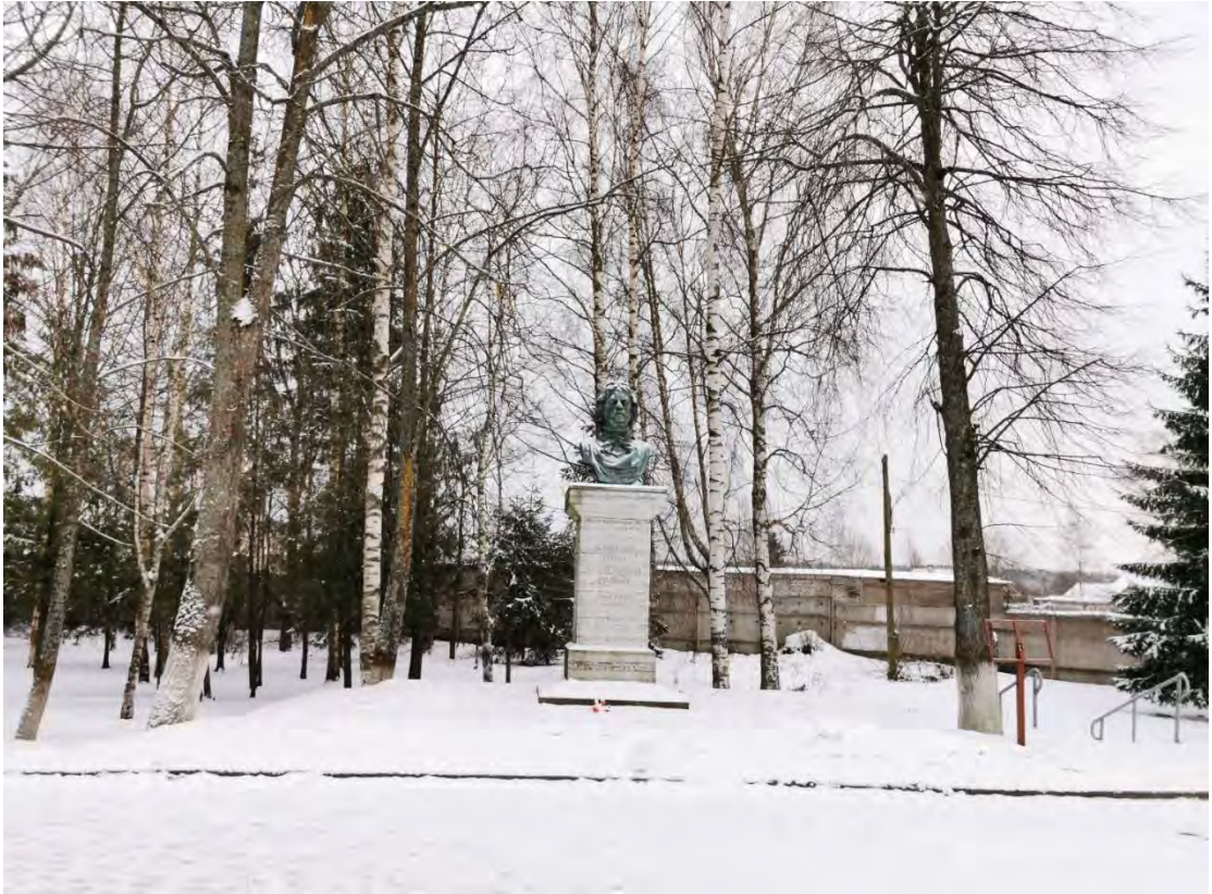
1. Вид на сквер и бюст Петру I на пересечении пр. Карла Маркса и Староладожского канала (ул. Пролетарский канал). Направление съемки юго-восток. Дата съемки январь 2021 г.