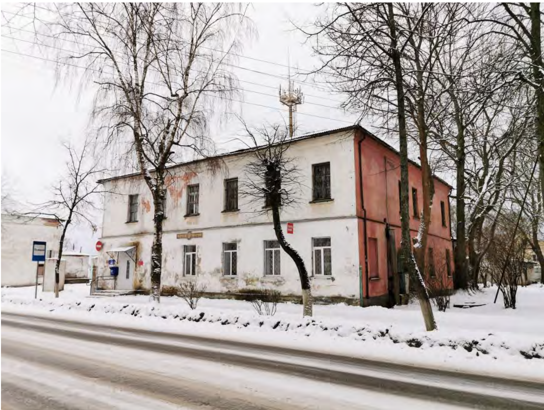
16. Вид на «Комплекс зданий почтово-телеграфной конторы, XVIII - XIX вв.: здание почты, XVIII- нач. XIX вв.; дом служащих почтовой конторы, сер. XIX в.» пр. Карла Маркса, д. 23, д. 23а. Направление съемки восток.