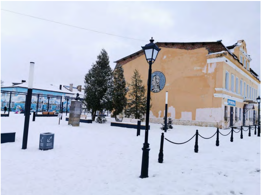
39. «Бюст А.В. Суворова», расположенный на площади им. Кирова, сквер у д. 1/28. Направление съемки юго-восток.