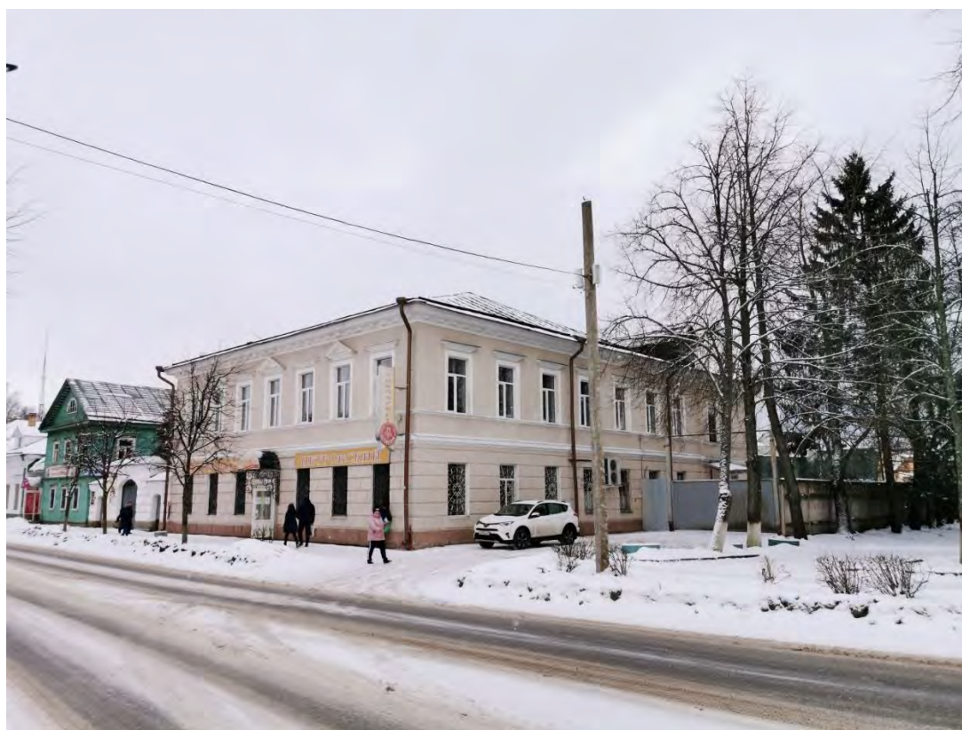
4. Лицевой фасад здания, входящего в «Комплекс жилых домов, впоследствии Земская управа, сер. XIX в: дом жилой, впоследствии - здание Земской управы, сер. XIX в.; жилой дом деревянный, кон. XIX в.; ограда с воротами», пр. Карла Маркса, д. 11. Направление съемки восток.