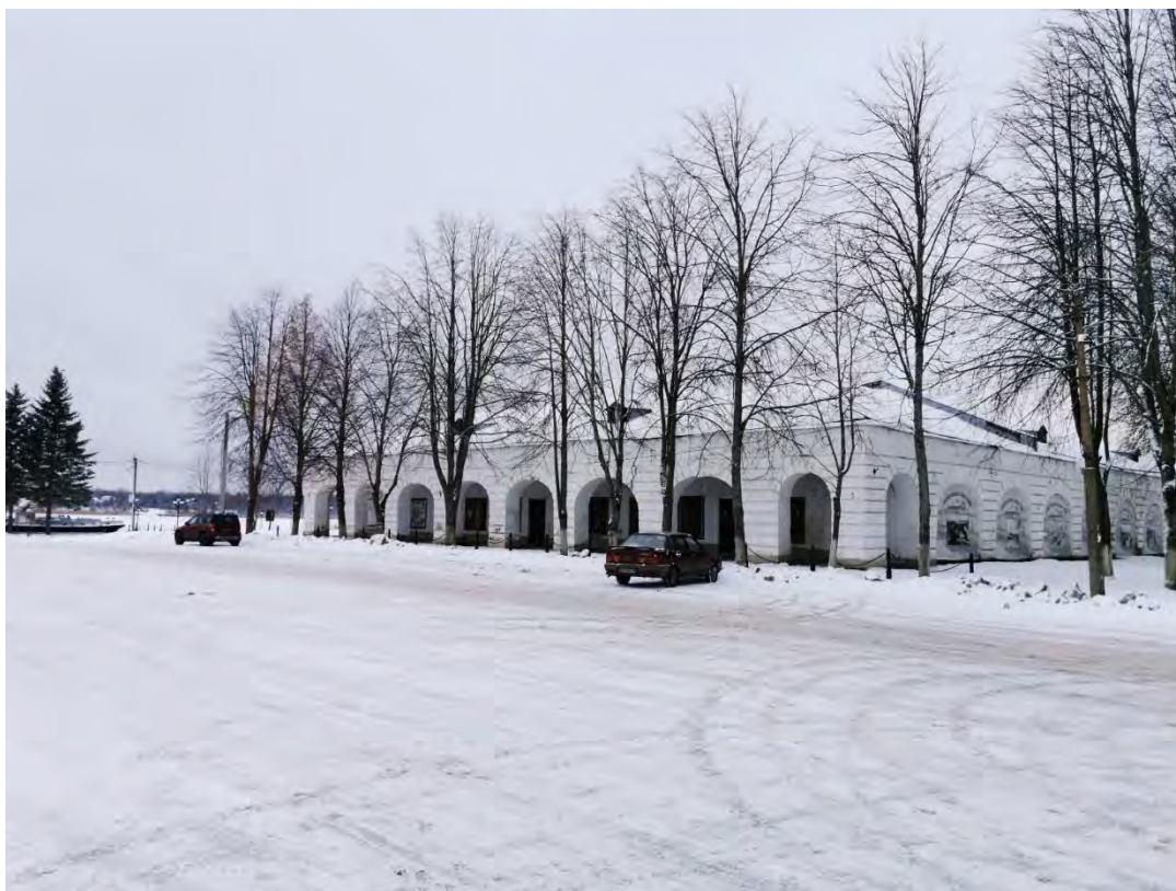
33. Вид на лицевой фасад «Гостиного двора», пр. Карла Маркса, д. № 29. Направление съемки юго-запад.