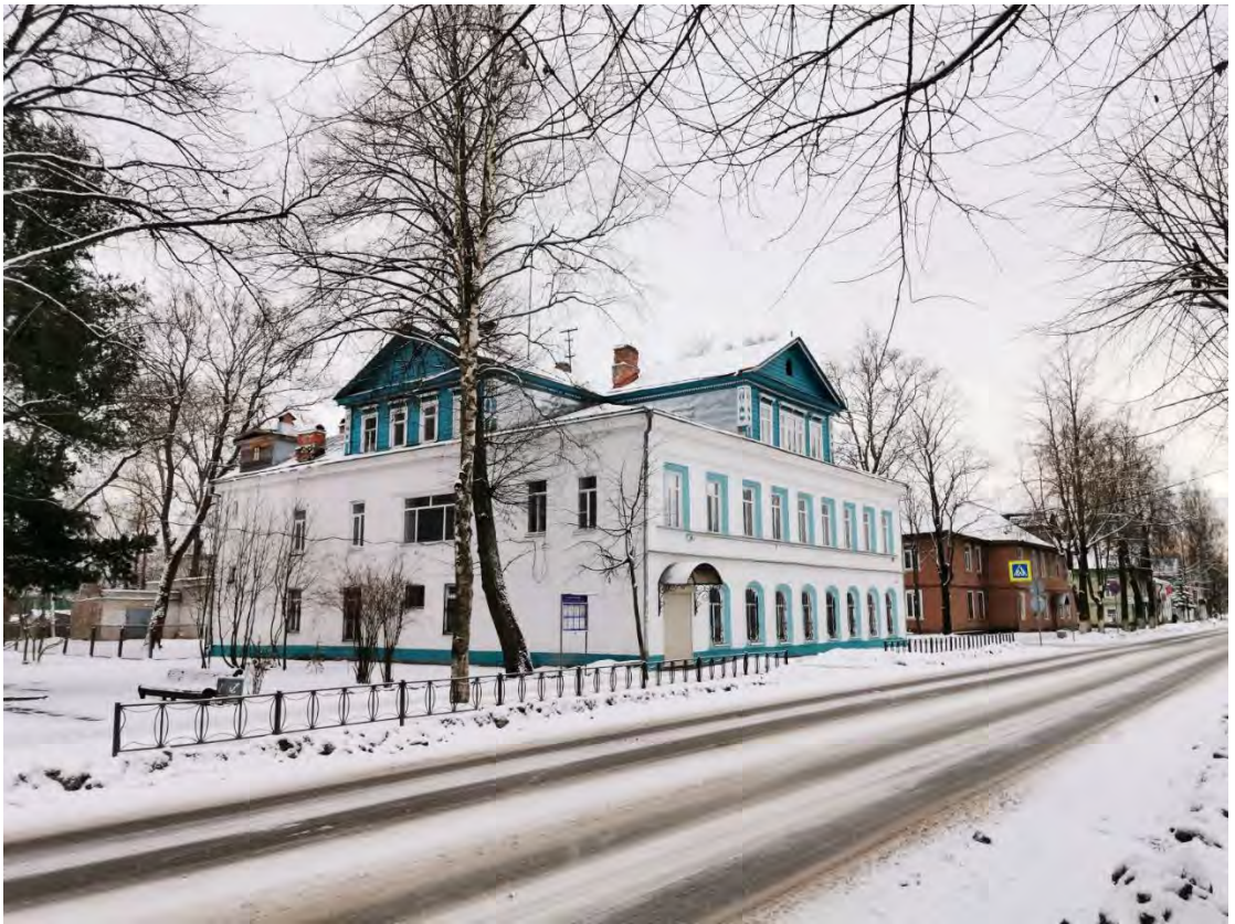
13. Лицевой и торцевой фасады здания «Бывший дом Старикова, впоследствии общественный клуб, 1852 г.» пр. Карла Маркса, д. 21. Направление съемки юг.