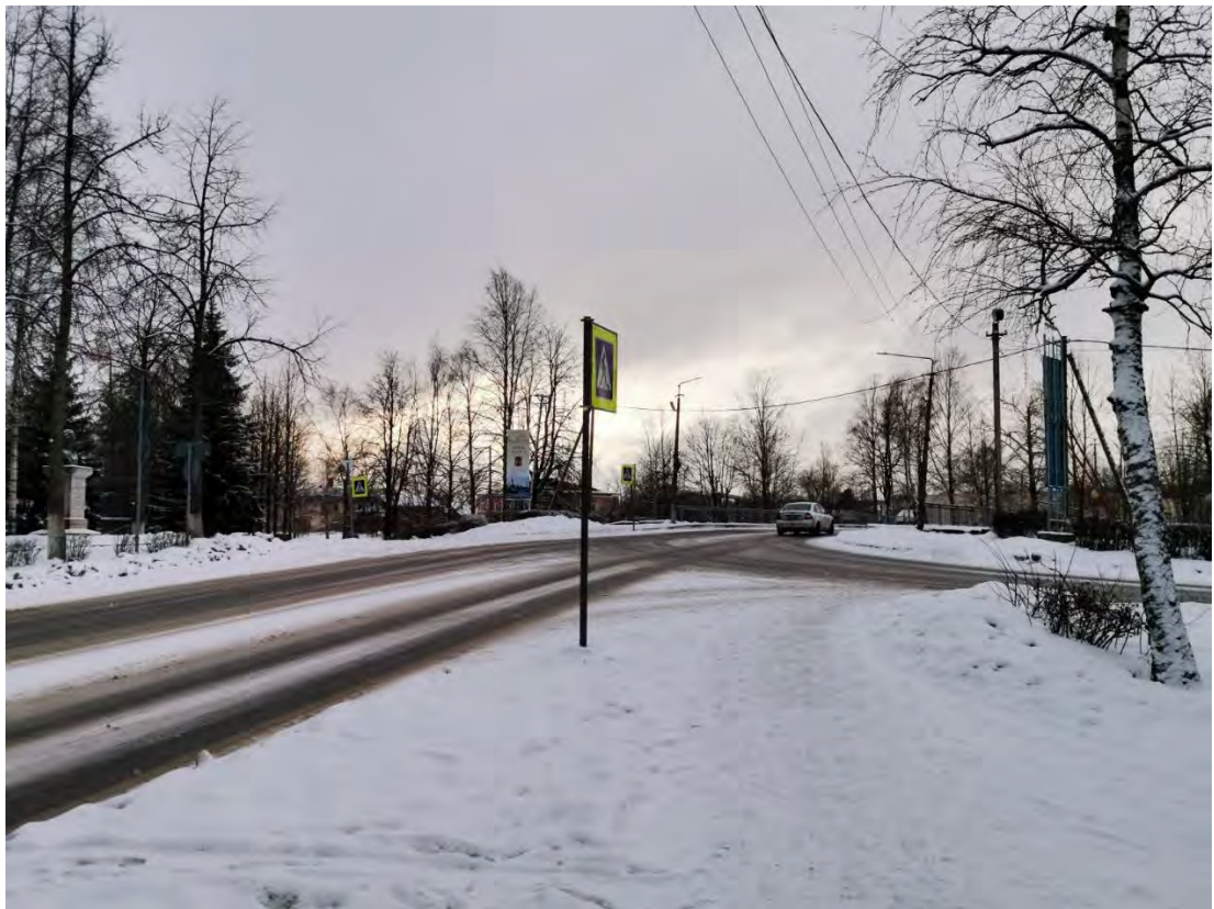
2. Вид на пр. Карла Маркса от пересечения со Староладожским каналом (ул. Пролетарский канал). Направление съемки юго-запад.