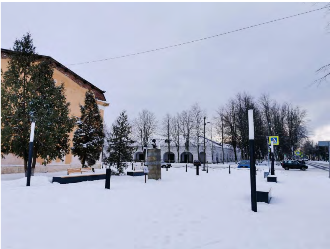
40. «Бюст А.В. Суворова», расположенный на площади им. Кирова, сквер у д. 1/28. Направление съемки юго-запад.