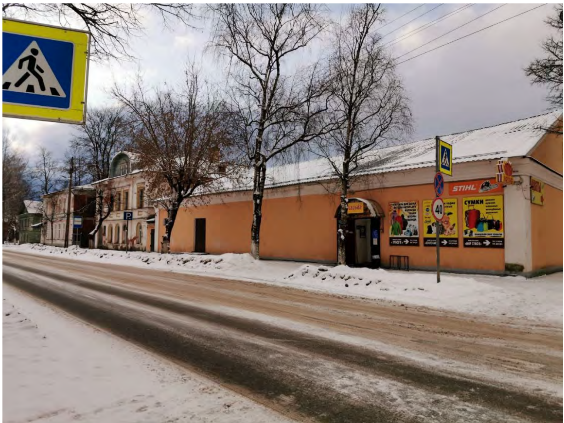
22. Общий вид пр. Карла Маркса. Направление съемки запад.