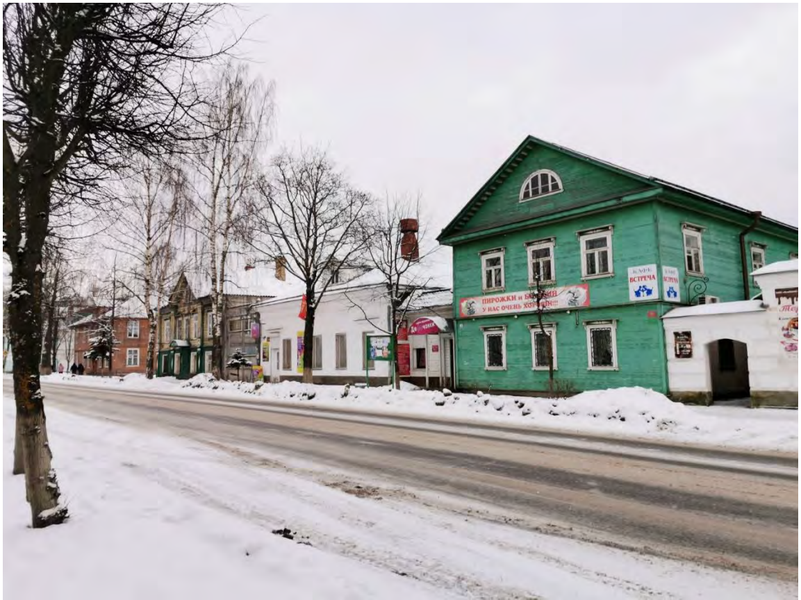
7. Общий вид на пр. Карла Маркса. Направление съемки северо-восток.