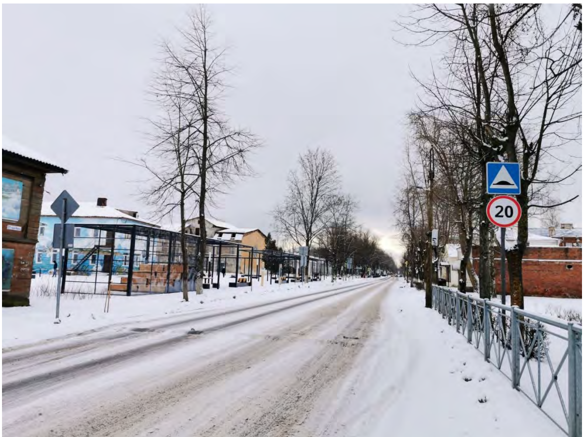
42. Общий вид пр. Карла Маркс. Направление съемки юго-запад.