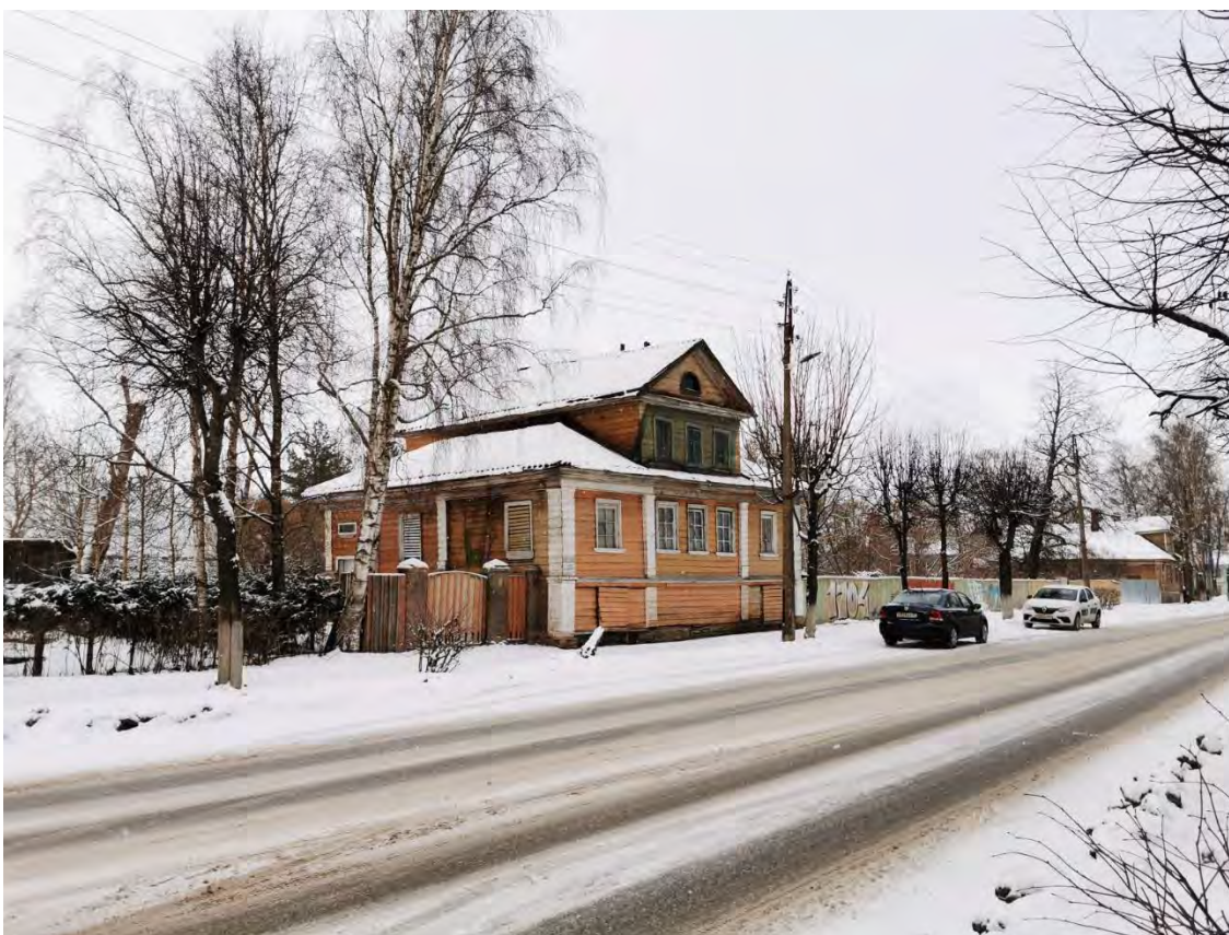
10. Общий вид пр. Карла Маркса. Направление съемки север.