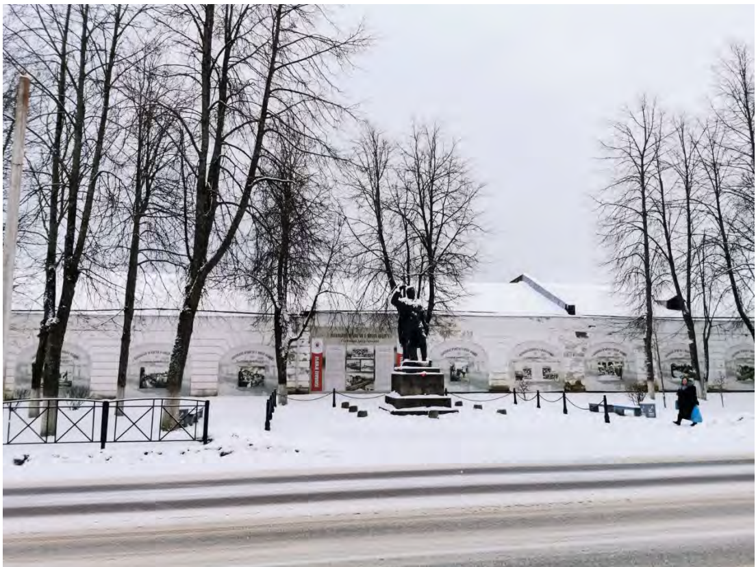
32. Вид на памятник С.М. Кирову около Гостиного двора пр. Карла Маркса, д. № 29 Направление съемки юго-восток.