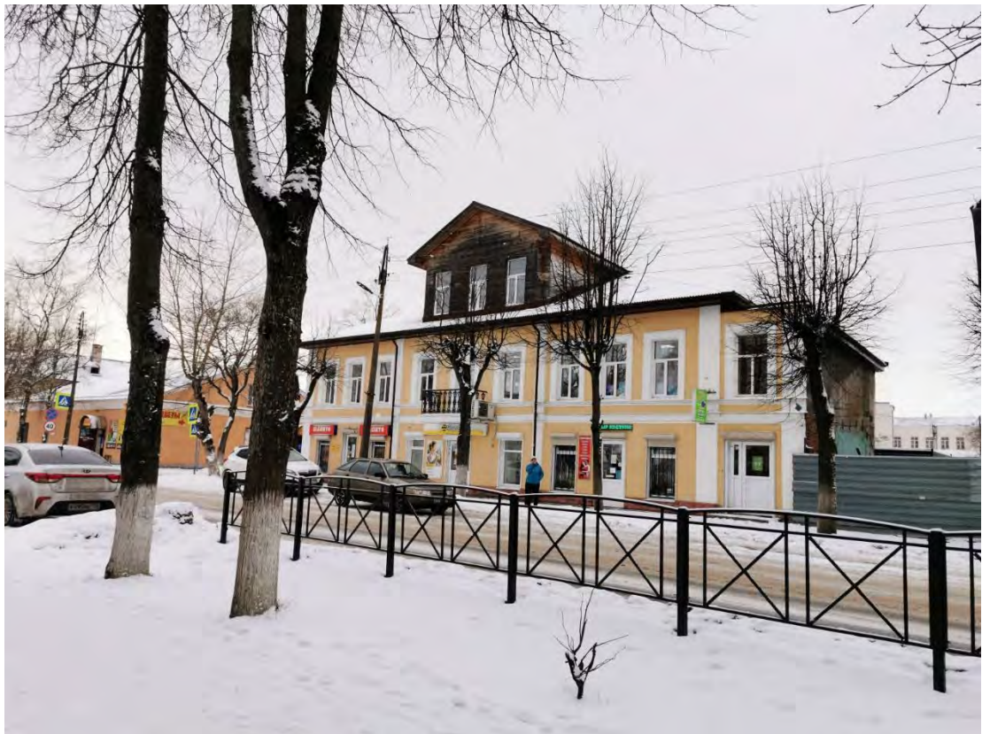
26. Лицевой фасад «Жилого дома с лавками и гостиницей, XVIII - XIX вв.», пр. Карла Маркса, д. 28/1. Направление съемки запад.