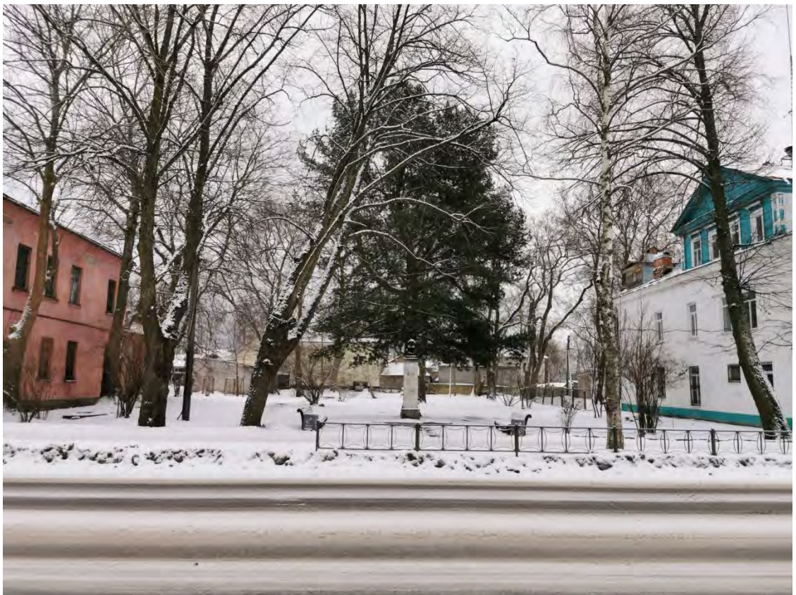
14. «Памятник-бюст К. Марксу» расположенный в сквере у д. 21. по пр. Карла Маркса. Направление съемки юго-восток.