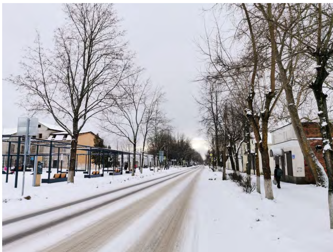
38. Общий вид пр. Карла Маркса. Направление съемки юго-запад.