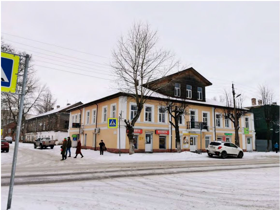
25. Лицевой и торцевой фасады «Жилого дома с лавками и гостиницей, XVIII - XIX вв.», пр. Карла Маркса, д. 28/1. Направление съемки север.