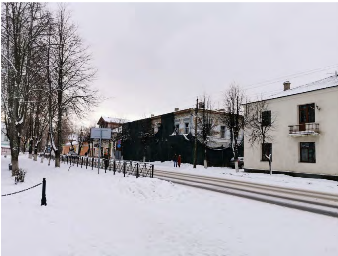
27. Общий вид на пр. Карла Маркса в сторону ул. Ворошилова. Направление съемки запад.