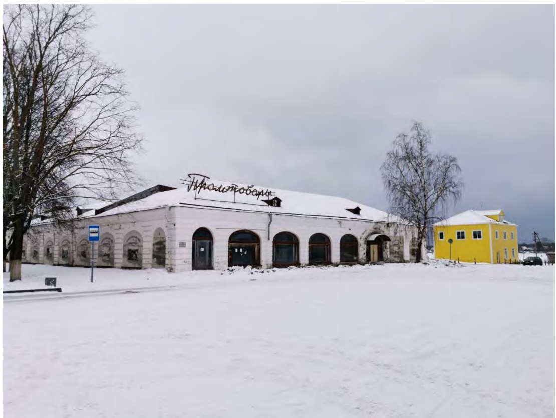
30. Вид на фасад «Гостиного двора» с ул. Пионерской, пр. Карла Маркса, д. № 29 Направление съемки северо-запад.