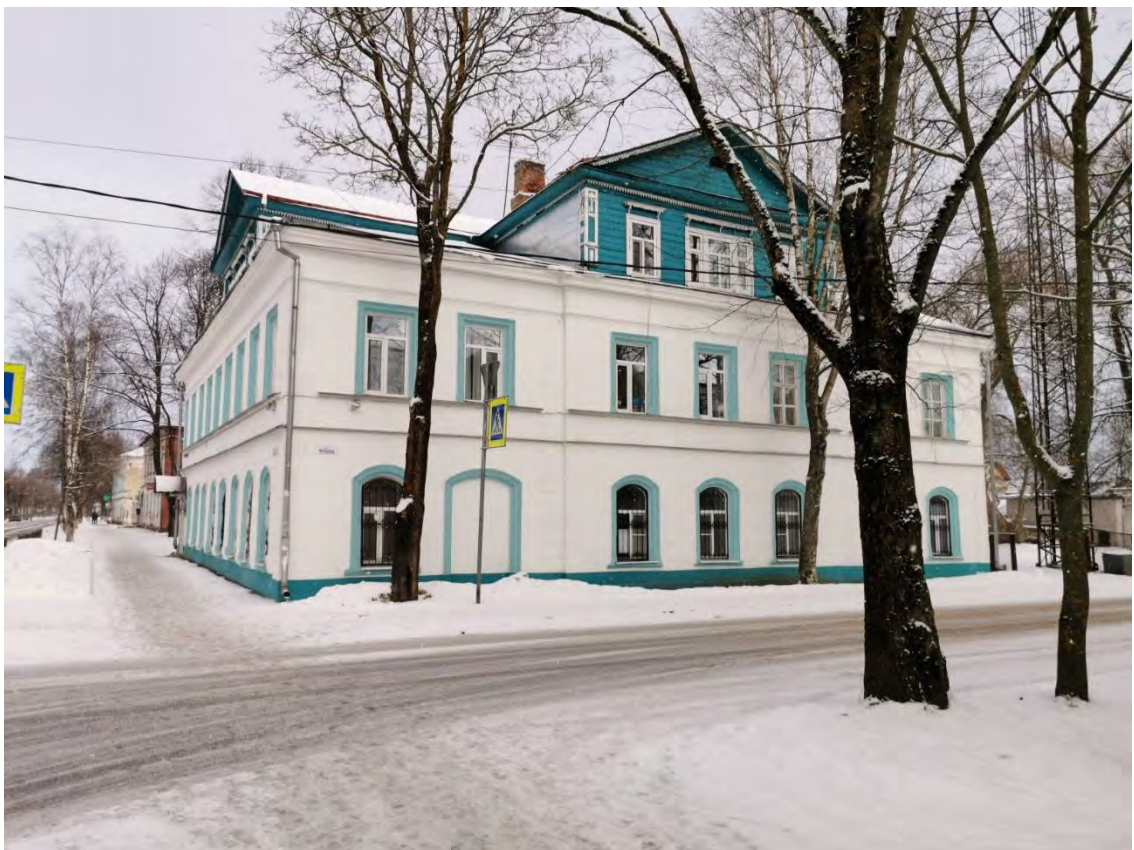
12. Лицевой фасад с ул. Черокова здания «Бывший дом Старикова, впоследствии общественный клуб, 1852 г.» пр. Карла Маркса, д. 21. Направление съемки восток.