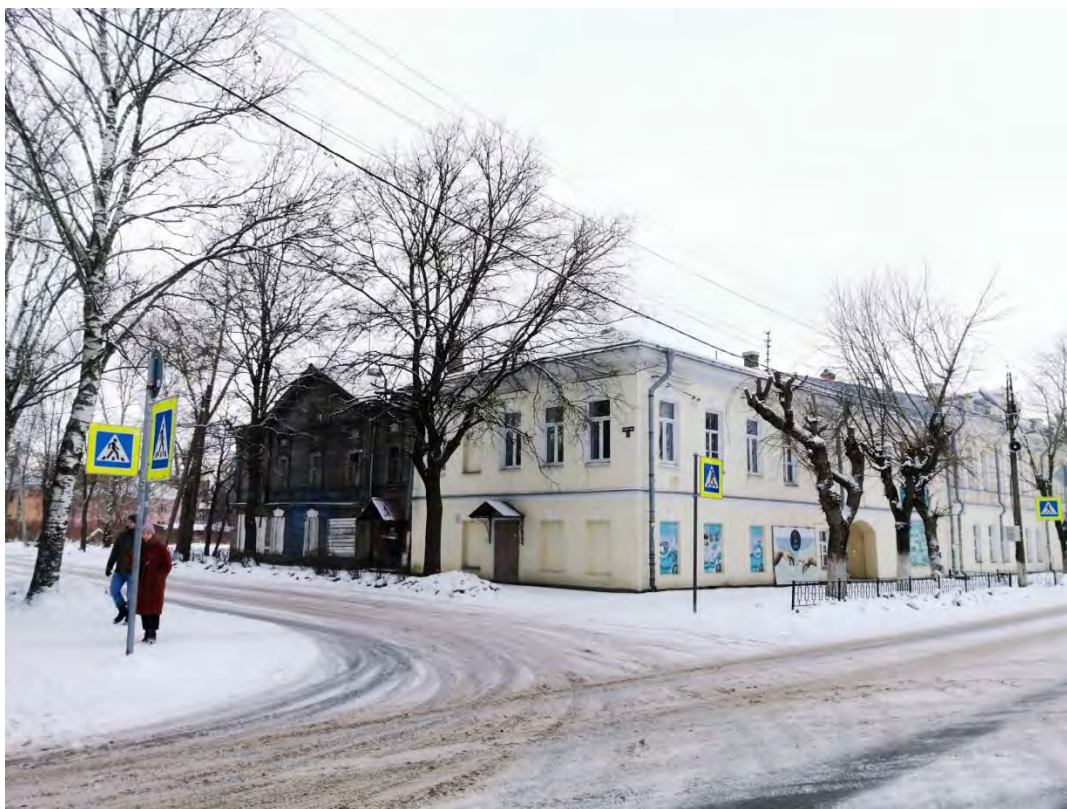
35. Вид на фасад дома, входящего в «Комплекс жилых и хозяйственных зданий купцов Спириных, XIX в.: каменный жилой дом с магазинами, деревянный жилой дом с булочной и пекарней», пр. Карла Маркса д. 36/1 Направление съемки север.