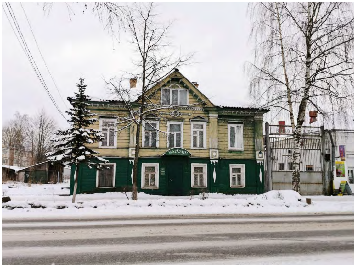
8. Лицевой фасад здания «Жилой дом, б. дом купцов Кулагиных, XIX в.» пр. Карла Маркса, д. 15. Направление съемки юго-восток.