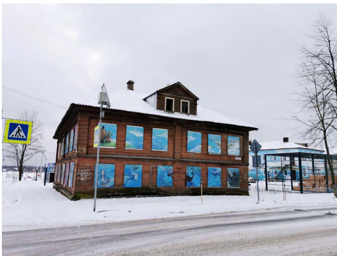
44. Фасад здания «Жилой дом - бывший дом Г.С. Сироткиной, сер. XIX в.», пр. К. Маркса, д. 31/4. Направление съемки юго-восток.