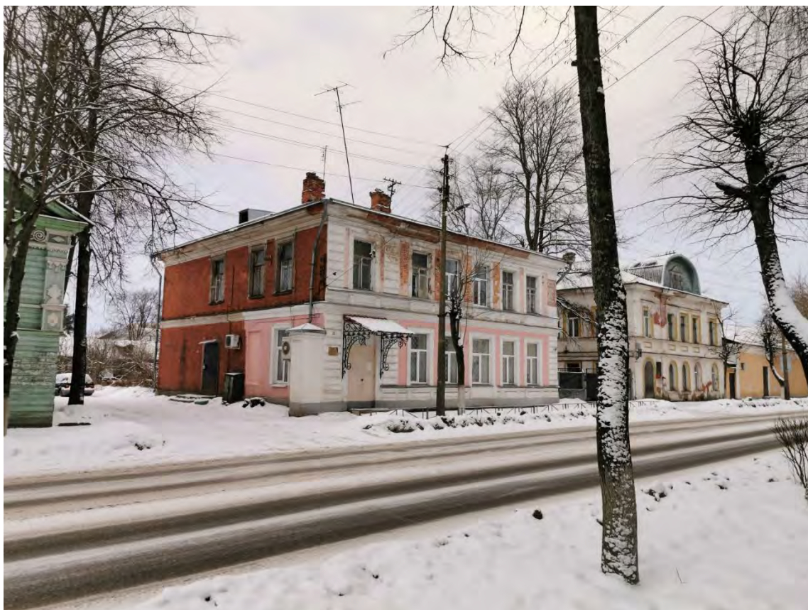
20. Общий вид на здания по пр. Карла Маркса, д. № 22 и №24. Направление съемки север.