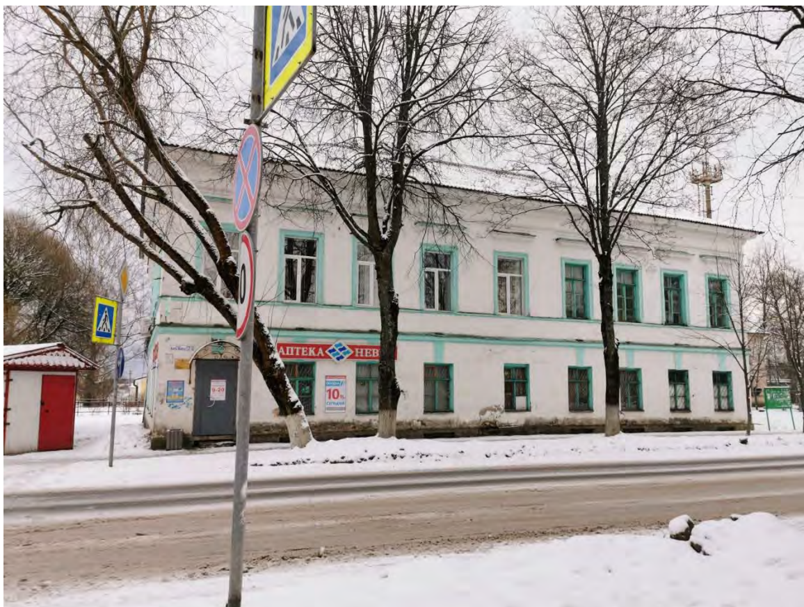
23. Лицевой фасад «Здания городского училища, 1841 г.» пр. Карла Маркса, д. 27/10. Направление съемки юго-восток.