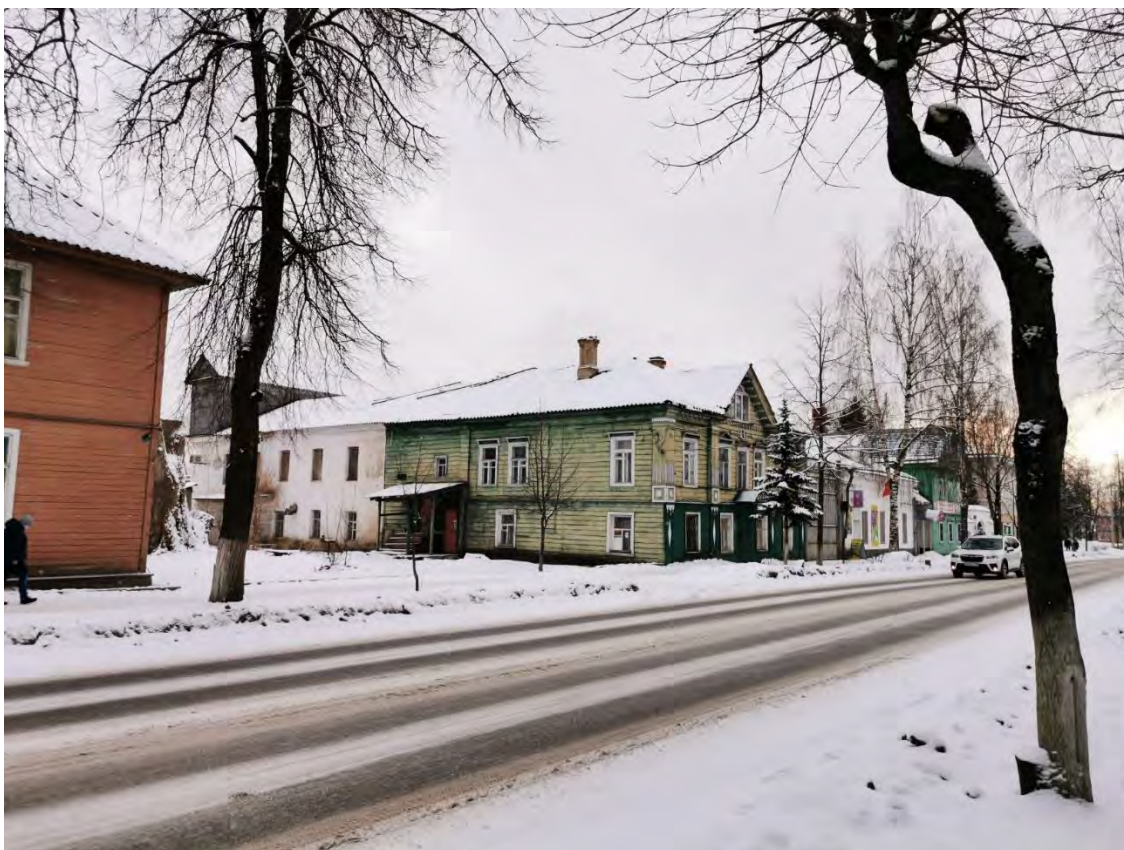
9. Общий вид пр. Карла Маркса. Направление съемки юго-запад.