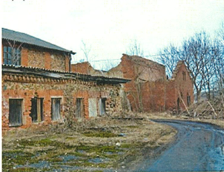
Вид на производственный корпус на заднем плане с запада (на переднем плане здание мастерских). Фото 28.03.2021 года.

1. На с. 146—150 представлены фотографии 2017 года, на которых зафиксировано историческое здание, отмеченное как Производственный корпус (винокуренный завод) и которое в Акте ГИКЭ по данному объекту от 31.07. 2017 года показано разрушенным, а в акте от 26.02.2021 года на стр.57 утраченным, а на стр.240 - отсутствующим. При этом указанное здание (в частично руинированном виде) существует, о чем свидетельствуют фотографии этого здания, выполненные лично мною в марте 2021 года: