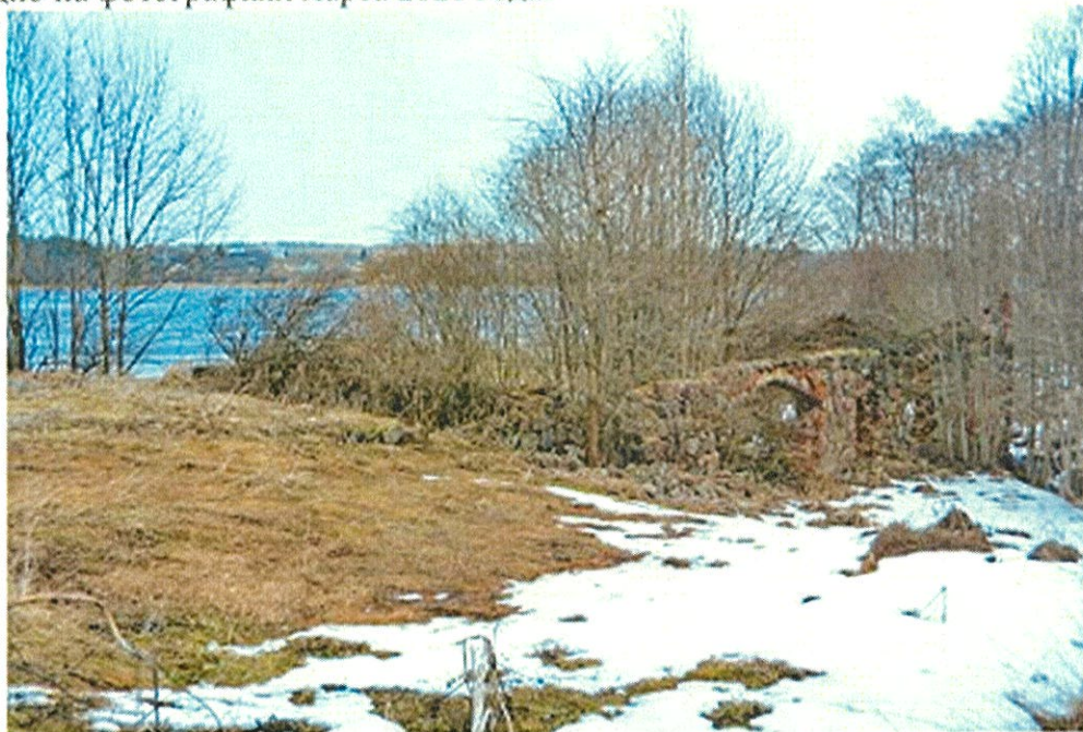
Вид на мельницу с запада. На заднем плане озеро Врево. Фото 28.03.2021 г.

Более того, исходя из личных обследований, я могу утверждать, что здание мельницы фактически существует, хотя и в частично рунированном виде, что хорошо видно на фотографиях марта 2021 года: