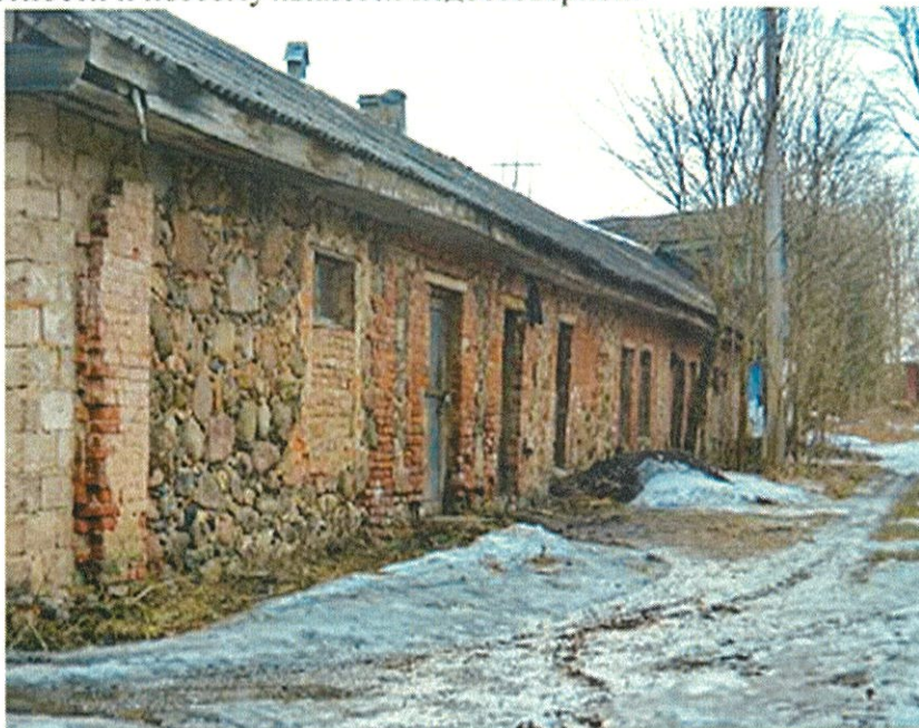
Хозяйственная постройка рядом со зданием мастерских. Вид с востока. Фото 28.03.2021 года.

3. На с. 240 (Схема проекта границ объекта культурного наследия регионального значения "Усадьба "Заполье" Билльдерлинга") здание мельницы не отмечено. Кроме того, на этой же схеме не отмечены и указанные на историко-культурном опорном плане (с. 51) и сохранившиеся на местности к марту 2021 года: производственный корпус (винокуренный завод) (п.1 настоящего отзыва), расположенные рядом исторические хозяйственные постройки (отмеченные в Акте ГИКЭ 2017 года), а также иные исторические объекты на территории парка: мост, гроты и т.д. Исходя из этого, Схема проекта границ объекта культурного наследия регионального значения "Усадьба Заполье Билльдерлинга", представленная в Акте ГИКЭ на с. 240, не отражает реально сложившейся ситуации на местности и поэтому является недостоверной.