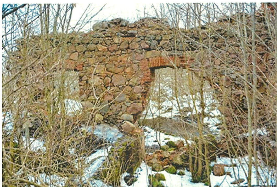
Вид внутри мельницы. Фото 28.03.2021 года