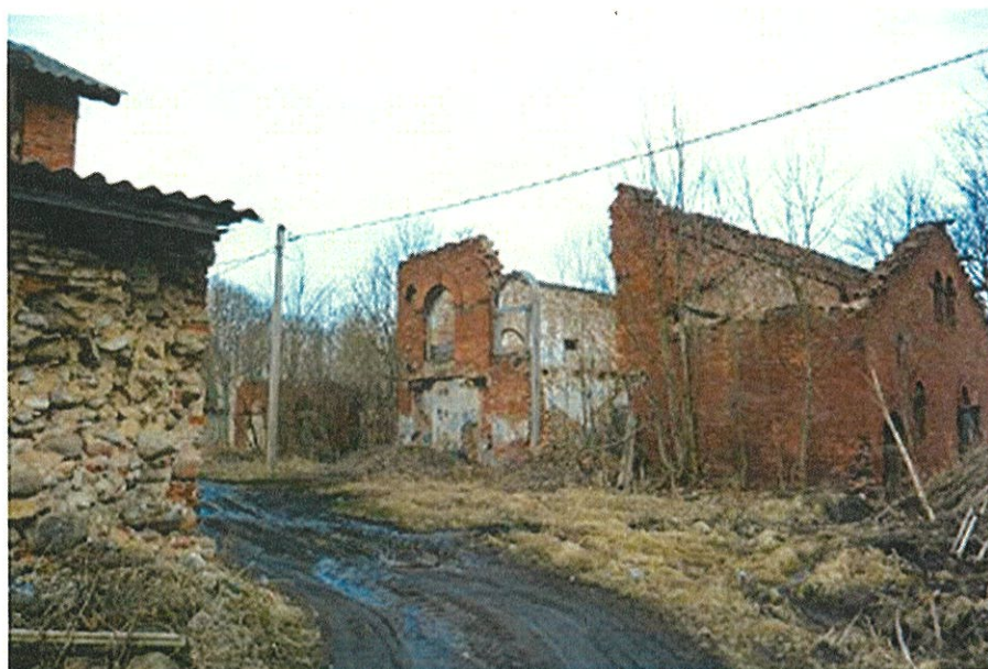
Вид на производственный корпус. Фото 28.03.2021 года.