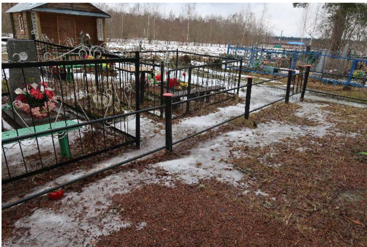
Илл. 6. Металлическое ограждение