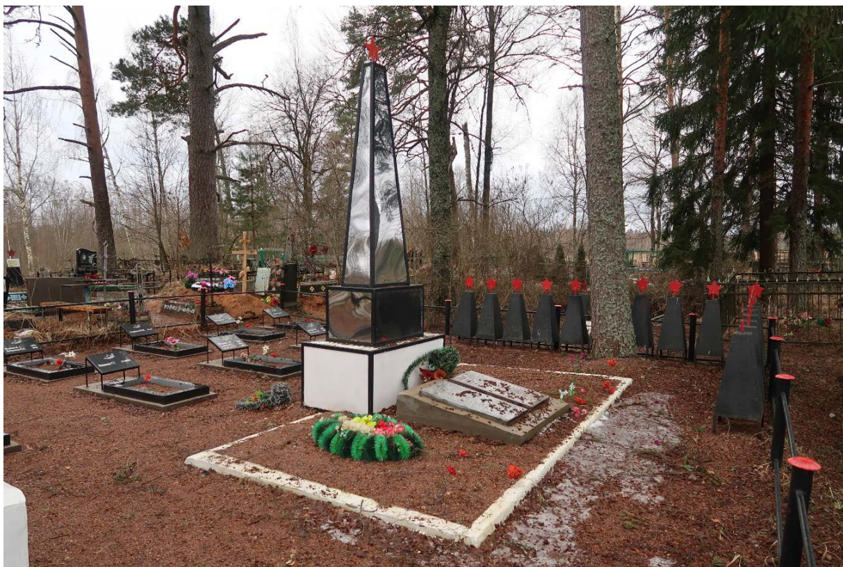
Илл. 3. Стела с облицовкой листами нержавеющей стали, общий вид