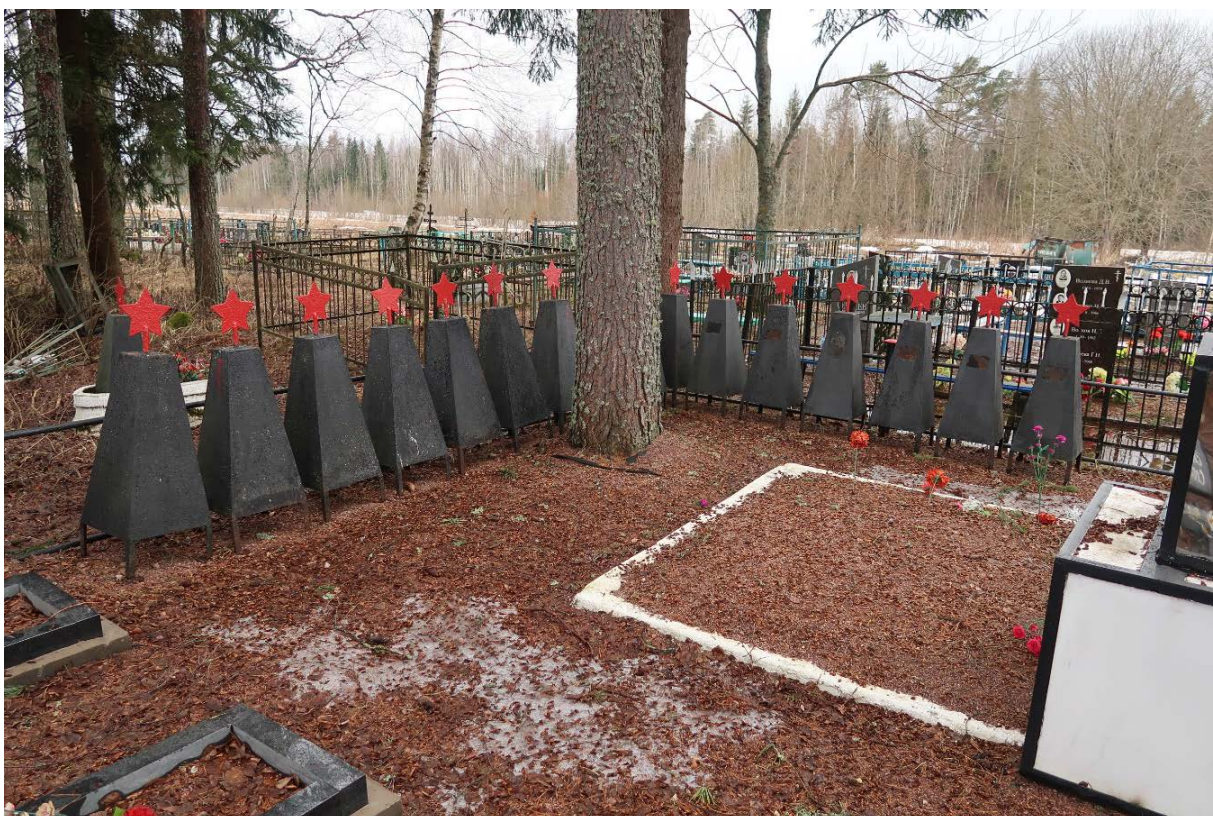
Илл. 4. Малые стелы, увенчанные красной звездой, демонтированы, складированы в углу участка, общий вид