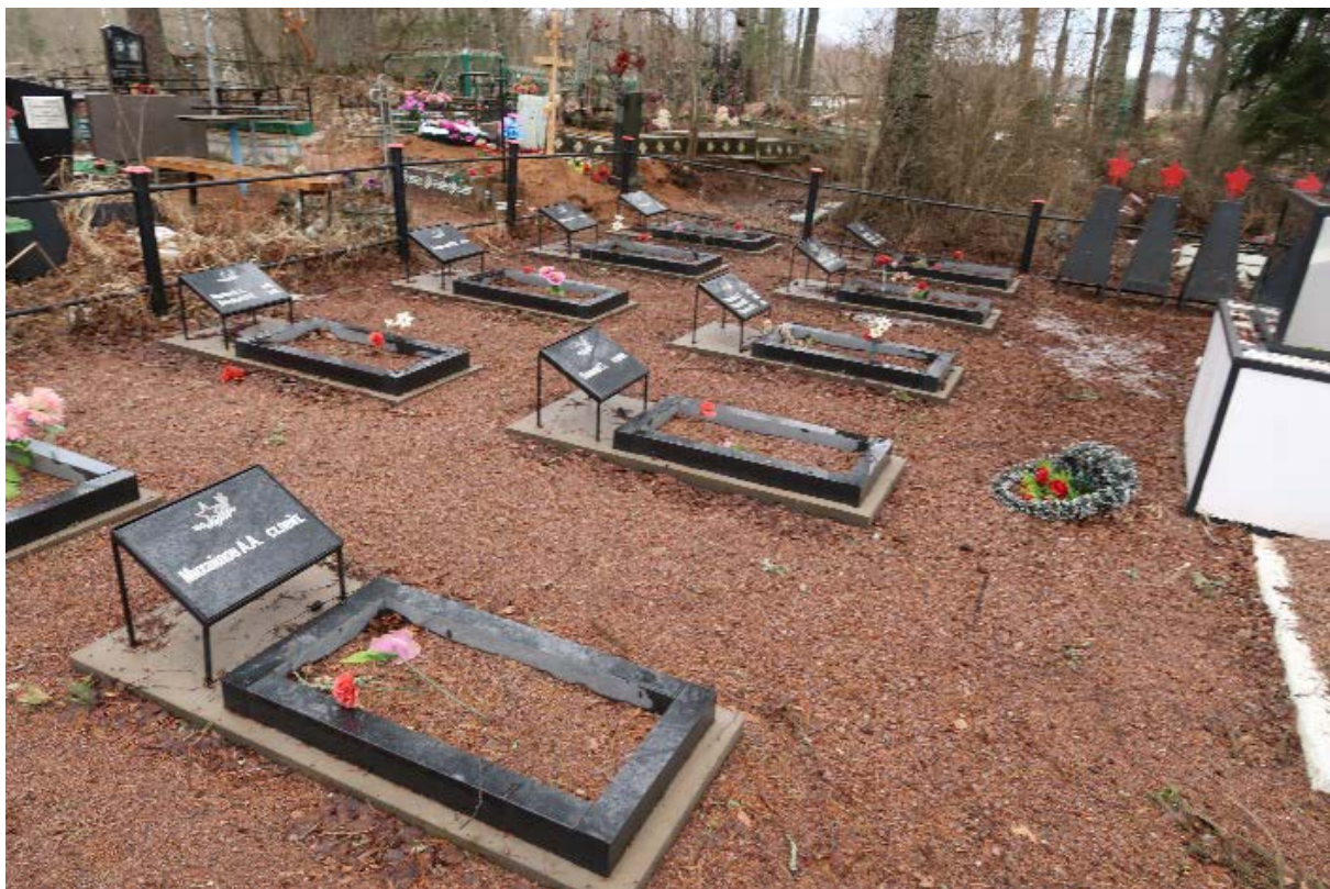
Илл. 5. Современные надгробия, общий вид