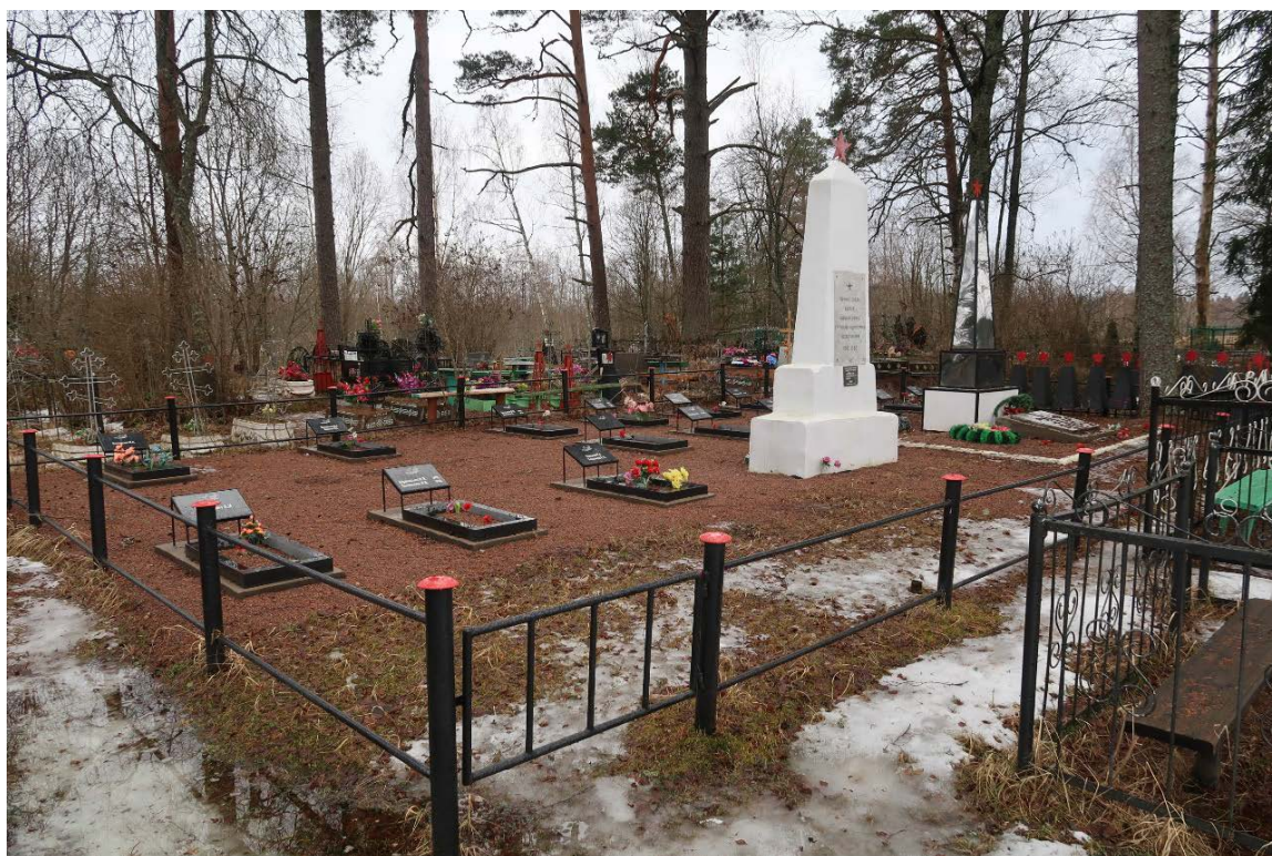
Илл. 1. Общий вид