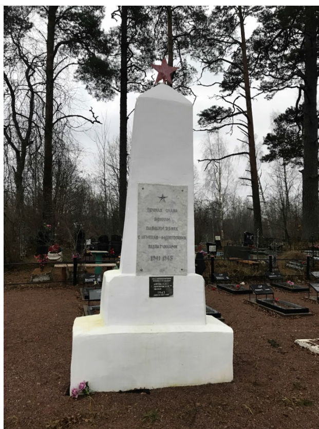
Илл. 2. Бетонная стела, общий вид