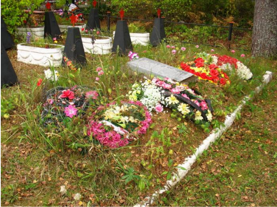
8. Фотография. д.Большие Сабицы, кладбище, братская могила Дата съемки 01.10.2011 г.