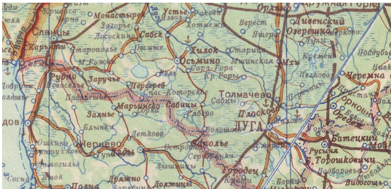
4. Фрагмент карты СССР 1946 г. послевоенных лет. // Источник: http://www.etomesto.ru/view.php?map=atlas_ussr-1946&key=1&x=28.983584&y=58.883670 .

//Источник: http://retromap.ru/1419363_z12_59.477871,29.788742&rightgrid=1&leftroutes=1 .