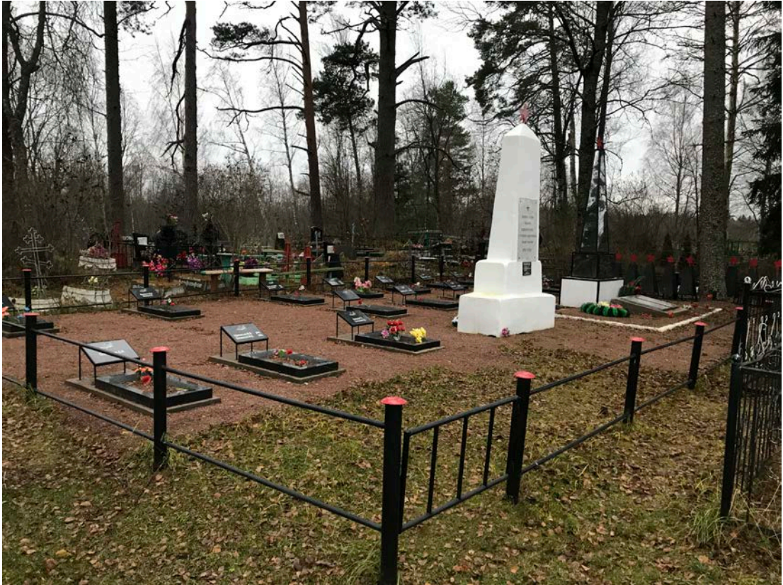
10. Фотография. Общий вид на братское захоронение советских воином в д. Большие Сабицы Лужского района. Дата съемки: 19.11.2020 г.