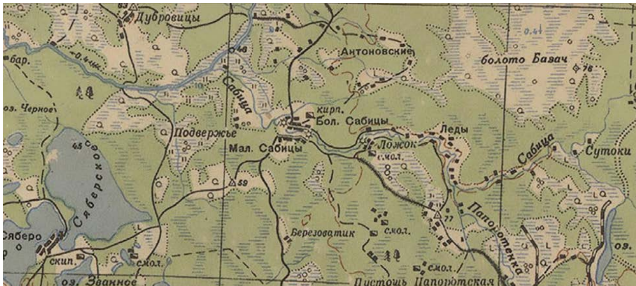
3. Фрагмент карты западной части СССР Управления Военных Топографов РККА. РСФСР. Издание 1932-1936 годов.

//Источник: http://retromap.ru/1419363_z12_59.477871,29.788742&rightgrid=1&leftroutes=1 .