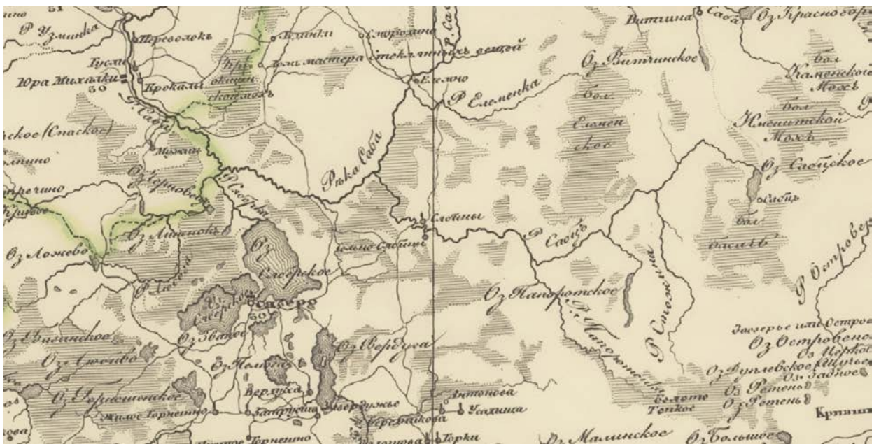
2. Фрагмент специальной карты Западной части России. Шуберта 1826-1840 годов. // Источник: http://www.etomesto.ru/map-shubert-10-verst/ .