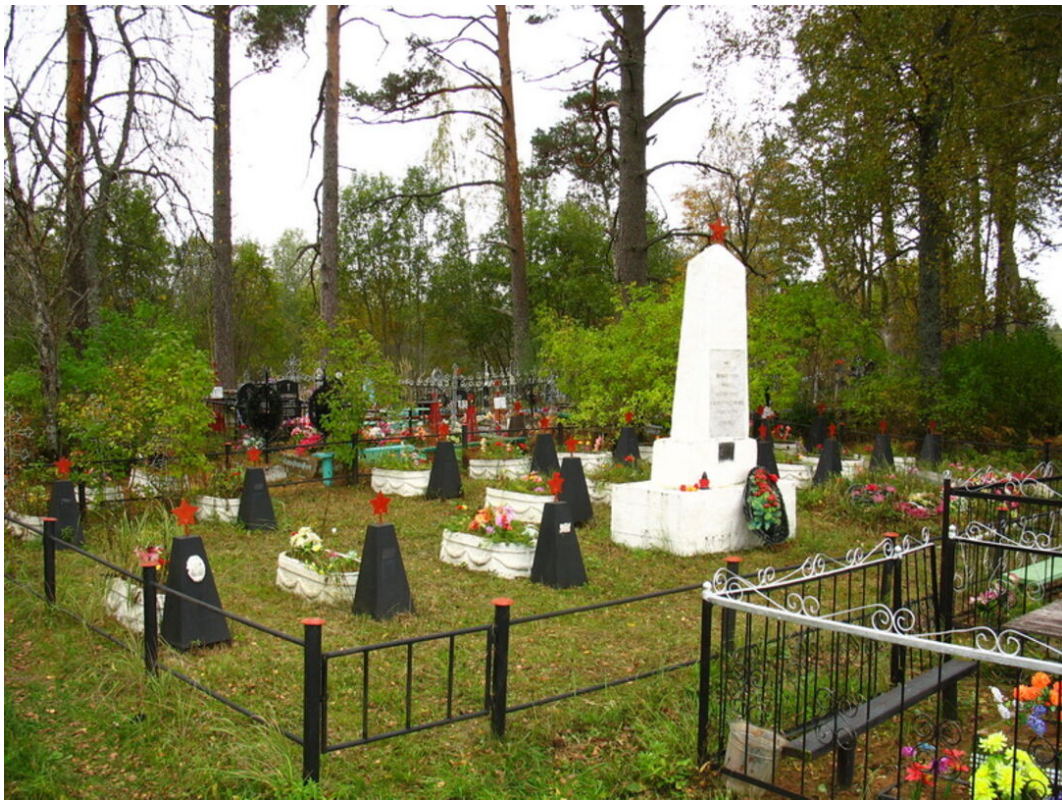
9. Фотография. д.Большие Сабицы, кладбище, братская могила Дата съемки 01.10.2011 г.