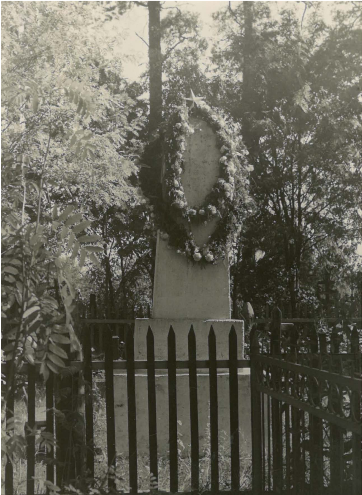
6. Фотография. Лужский район Большие Сабицы. Без даты.