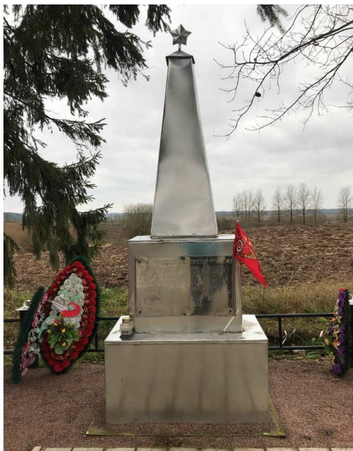
Илл. 3. Обелиск, общий вид спереди