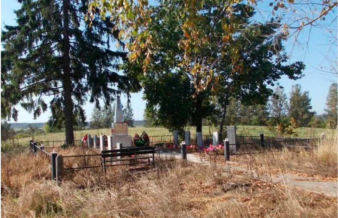
Илл. 1. Общий вид, восточная сторона