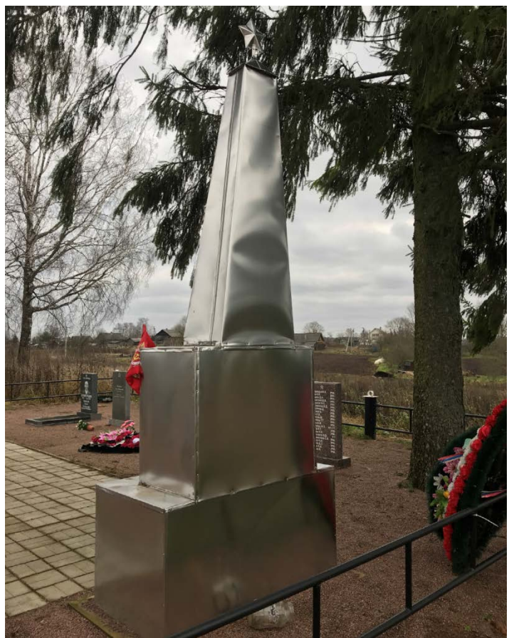
Илл. 4. Обелиск, общий вид сзади