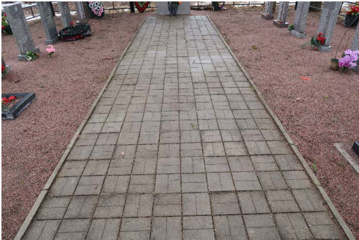
Илл. 5. Мощение площадки