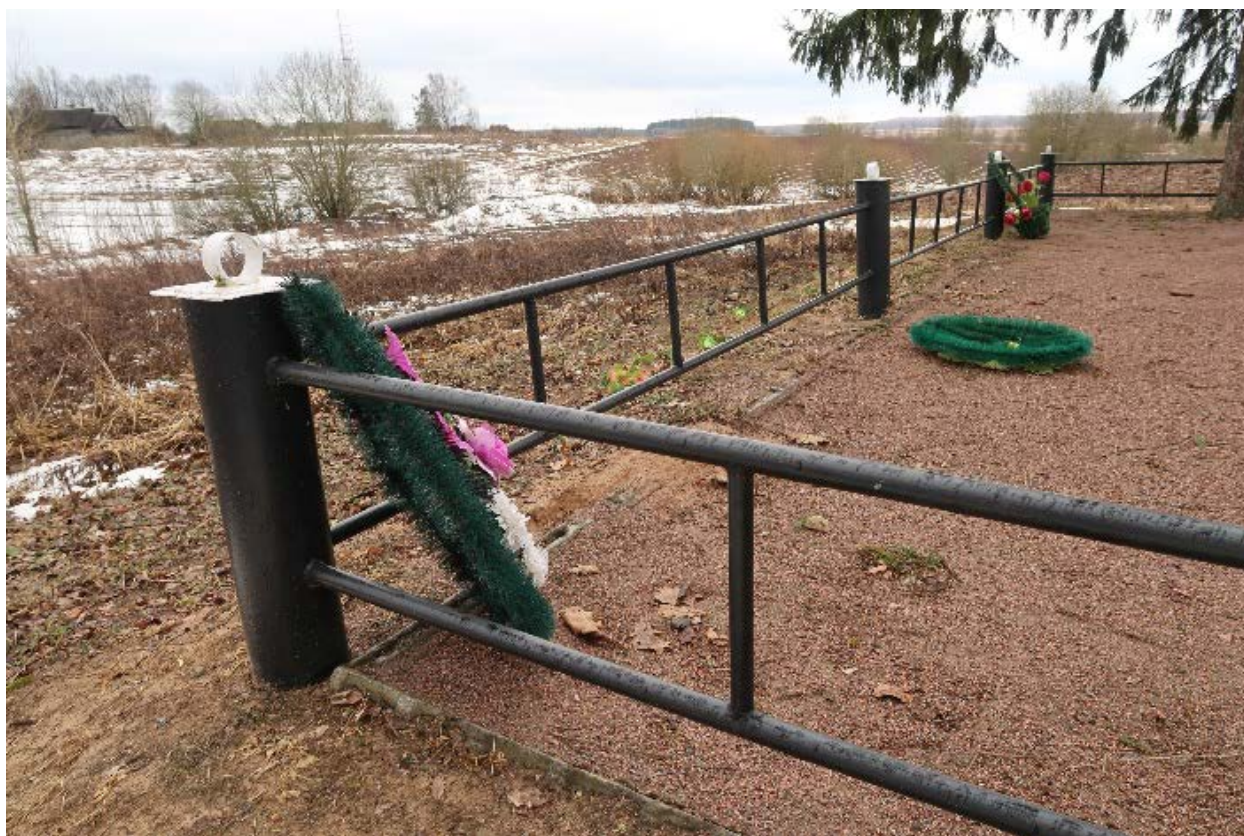
Илл. 6. Металлическое ограждение