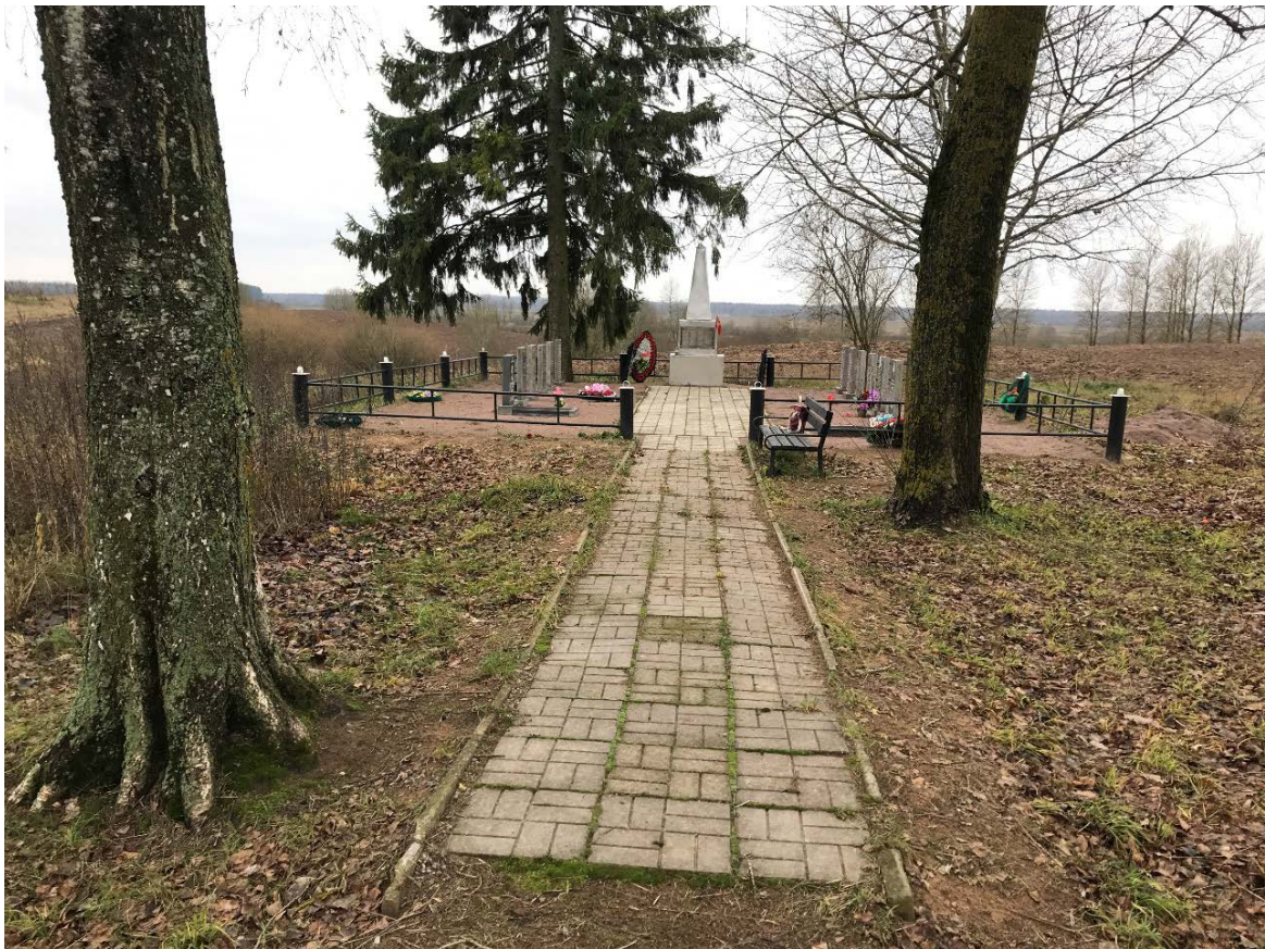
Илл. 2. Общий вид, северо-восточная сторона