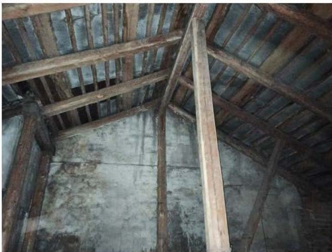
Фото 6. Чердачное пространство. Часть стропильной системы..