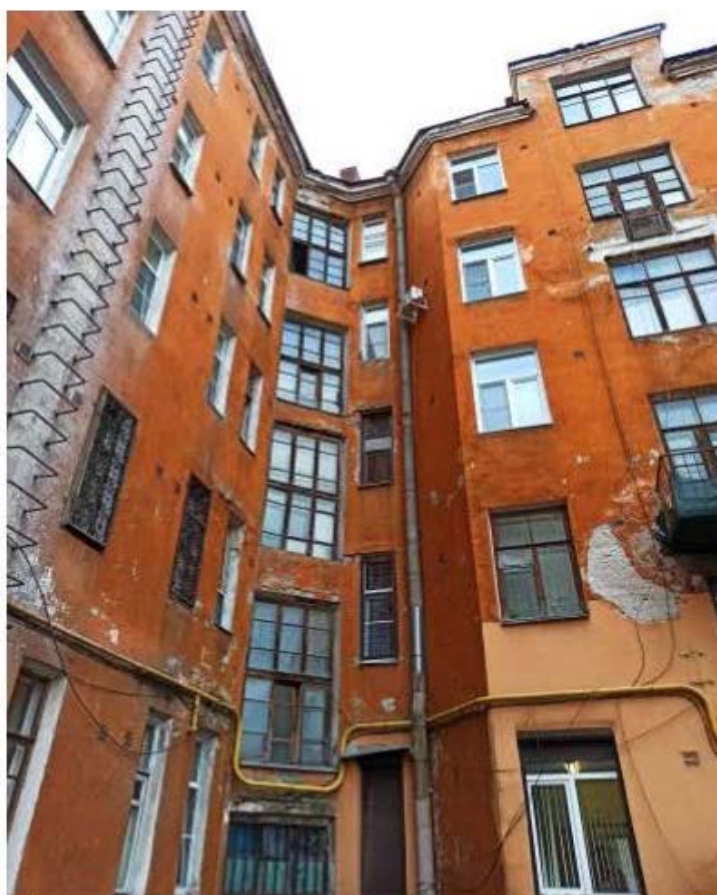
Фото 4. Фрагмент дворового фасада. Центральная часть здания.