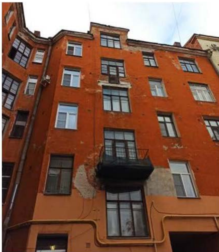
Фото 3. Фрагмент дворового фасада. Правое крыло.