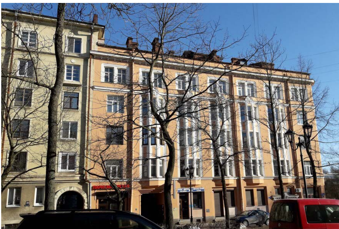
Фото 2. Вид на Объект со стороны бульвара им. М.И. Кутузова.