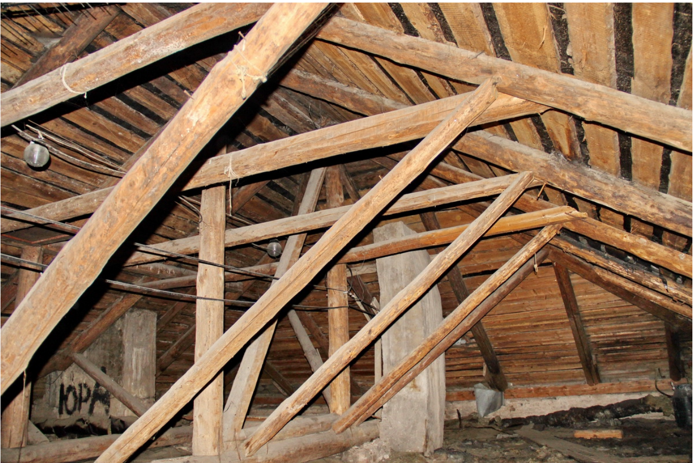
26 ОКН регионального значения “Жилой дом” Ленинградская область, Кингисеппский муниципальный район, г. Кингисепп, ул. Жукова, д. 14. Чердак. Дата съемки: 08.06.2022 г.