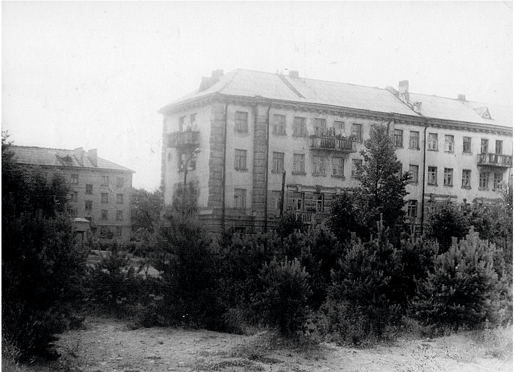
Ил. 8. Кингисепп. Ул. Жукова, д. 12. 1970-е гг.