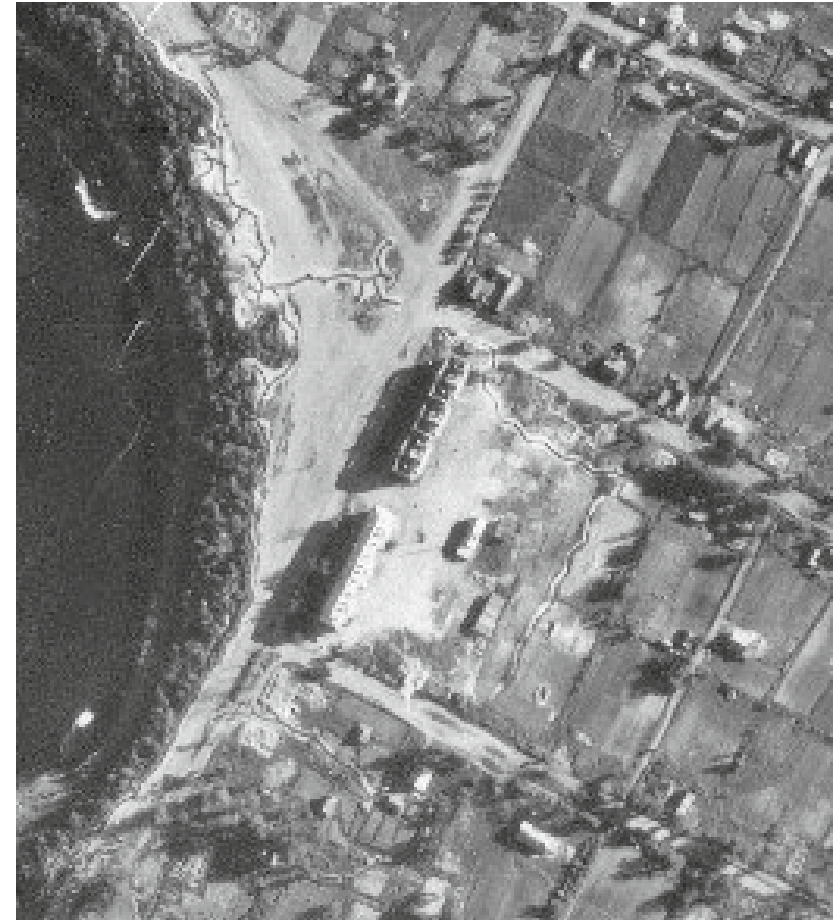
Ил. 1. Кингисепп. Аэрофотосъемка. 1944 г.