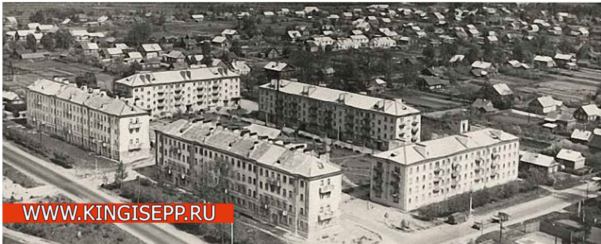
Ил. 10. Кингисепп. Ул. Жукова, д. 12 и 14. 1980-е гг.