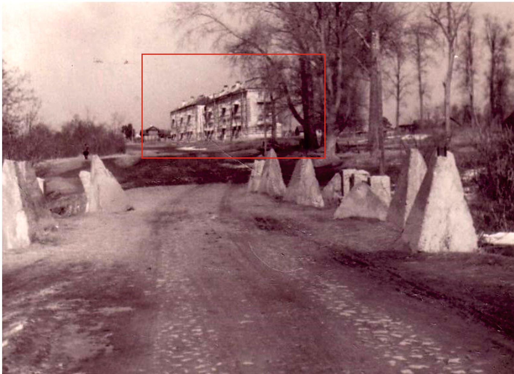
Ил. 4. Кингисепп. Противотанковые надолбы. 1950-е гг. Кингисеппский историко-краеведческий музей. № Ф-269