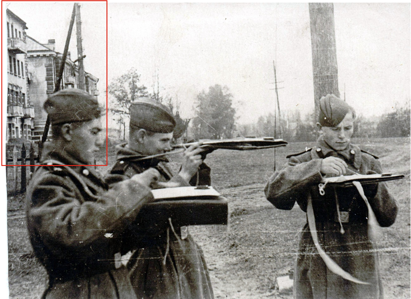
Ил. 3. Курсанты школы на занятиях по топоподготовке. 1949 г.