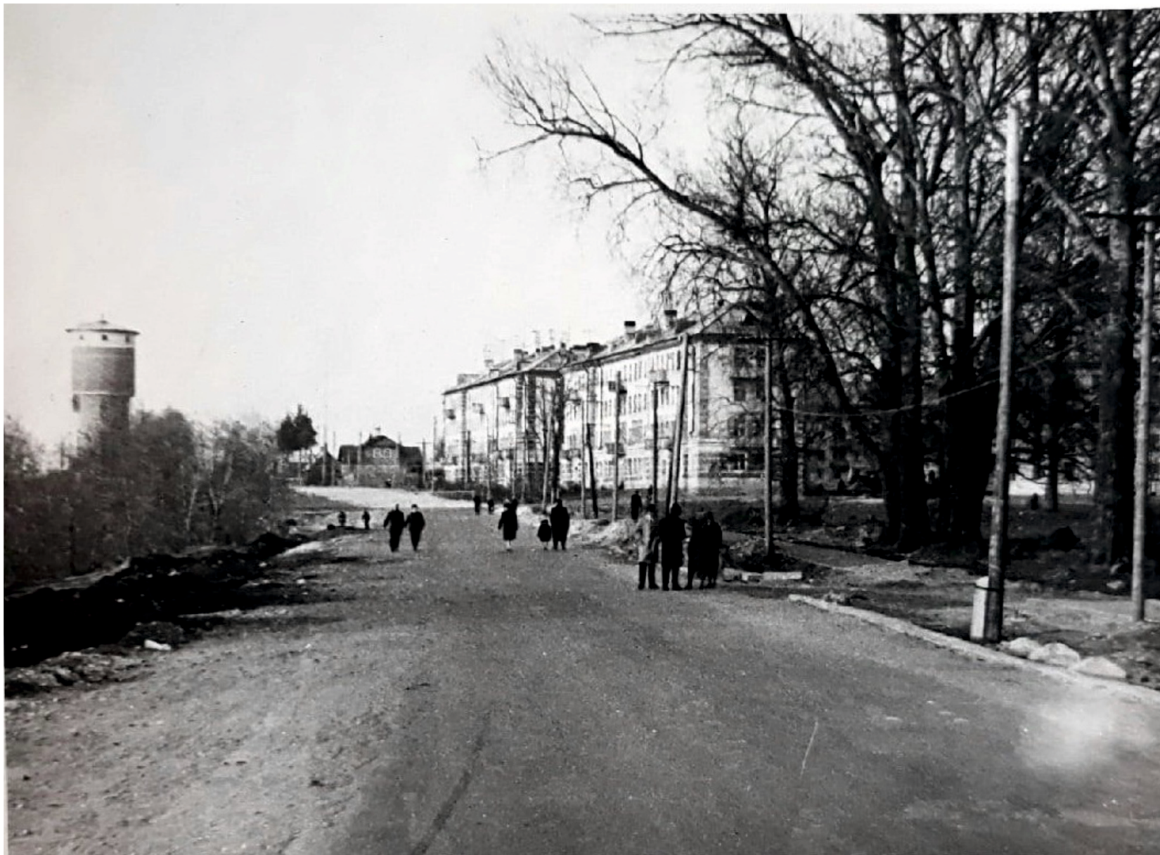
Ил. 5. Кингисепп. Ул. Жукова, д. 12 и 14. 1965 г. https://vk.com/wall-5873044_43846?z=photo-5873044_457282323%2Fwall-5873044_43846