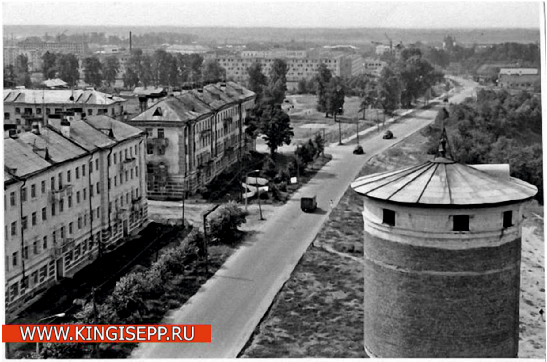
Ил. 9. Кингисепп. Ул. Жукова, д. 12 и 14. 1980-е гг.