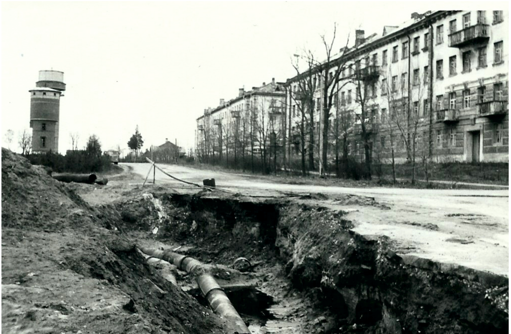
Ил. 6. Кингисепп. Ул. Жукова, д. 12 и 14. 1969 г. https://vk.com/wall-5873044_19710?z=photo-5873044_456253806%2Fwall-5873044_19710