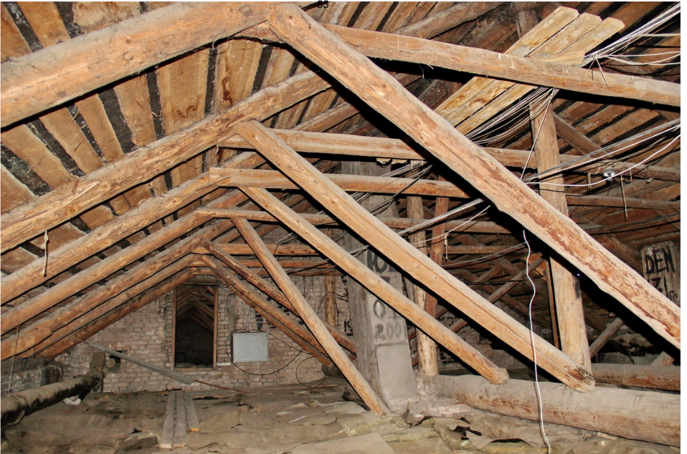
25 ОКН регионального значения “Жилой дом” Ленинградская область, Кингисеппский муниципальный район, г. Кингисепп, ул. Жукова, д. 14. Чердак. Дата съемки: 08.06.2022 г.