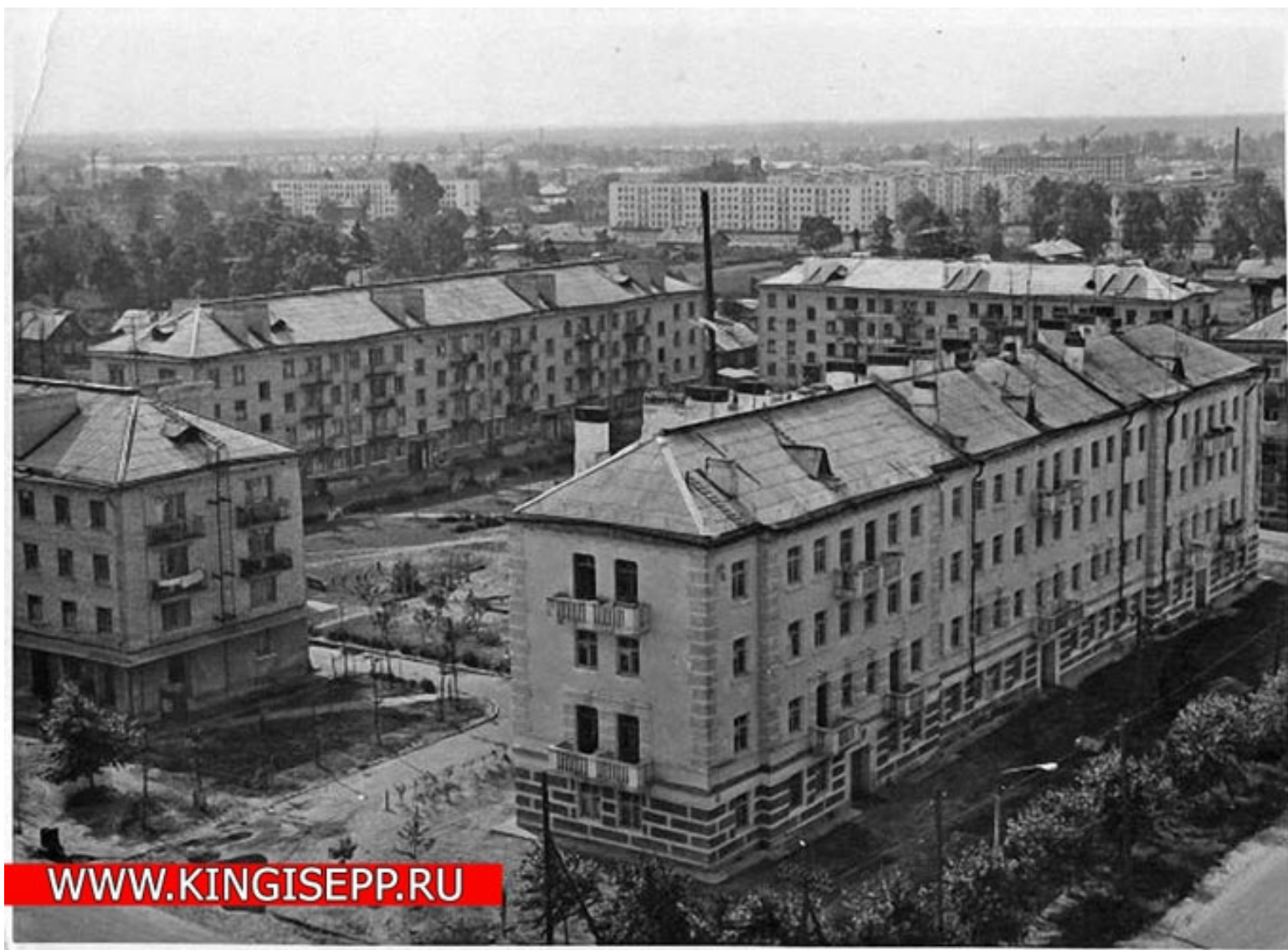
Ил. 11. Кингисепп. Ул. Жукова, д. 14. 1980-е гг.