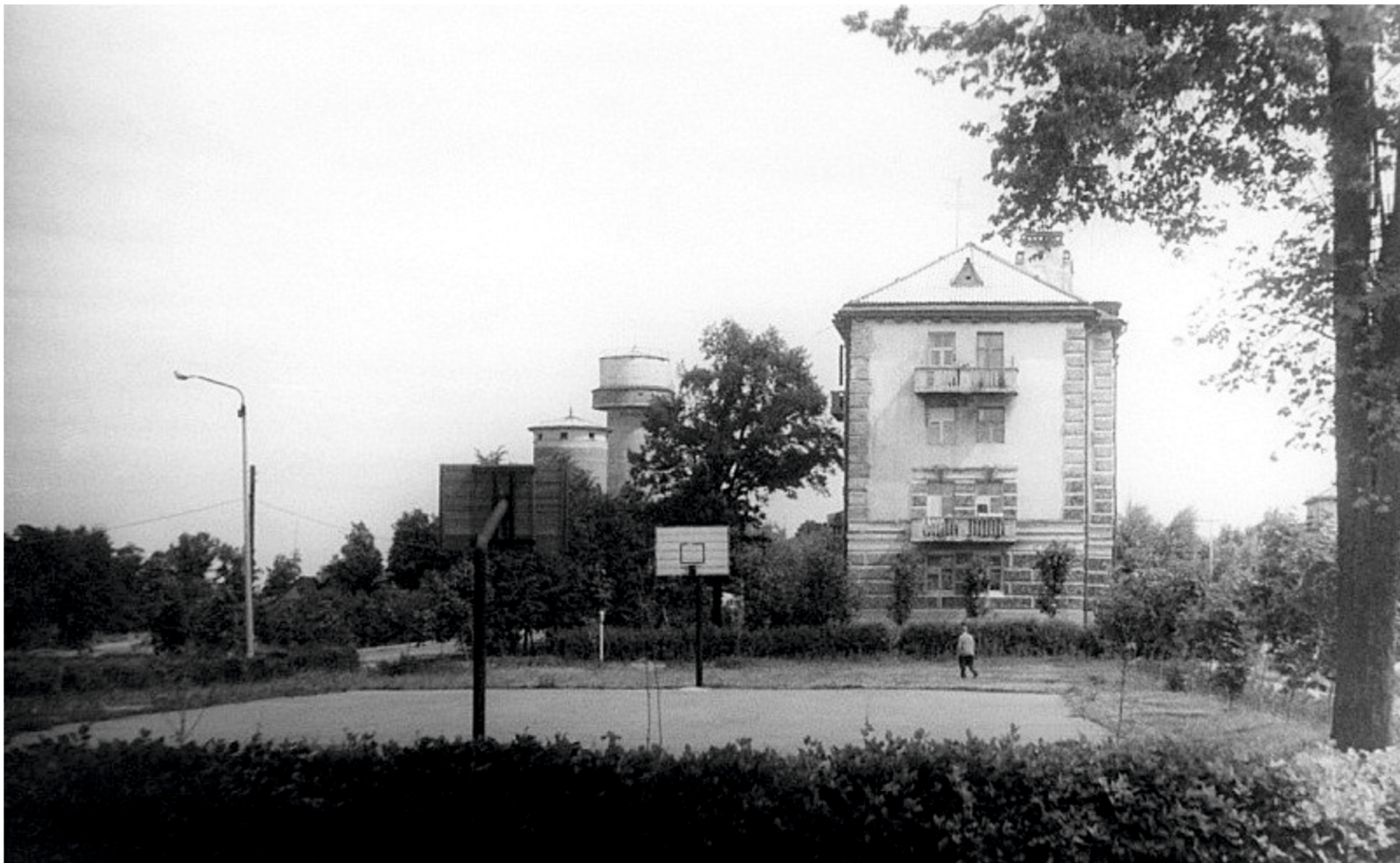
Ил. 7. Кингисепп. Ул. Жукова, д. 12. 1975 г.