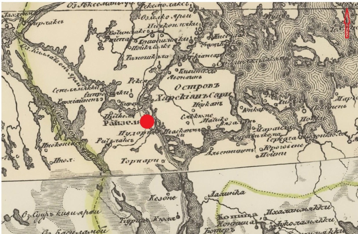
Рис. 3. Трасса обследования на фрагменте специальной карты Западной части России Шуберта 1826-1840 годов.