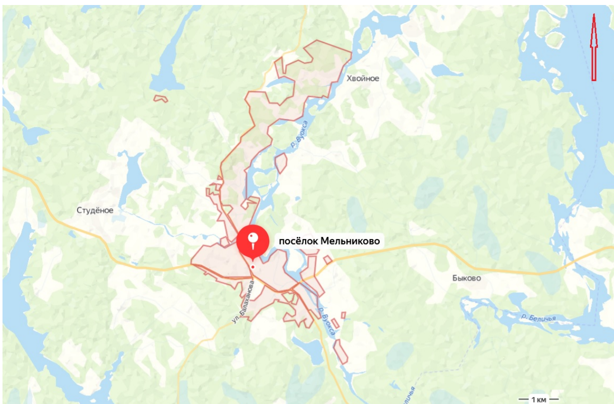
Рис. 2. Посёлок Мельниково Приозерского района на фрагменте карты Ленинградской области.