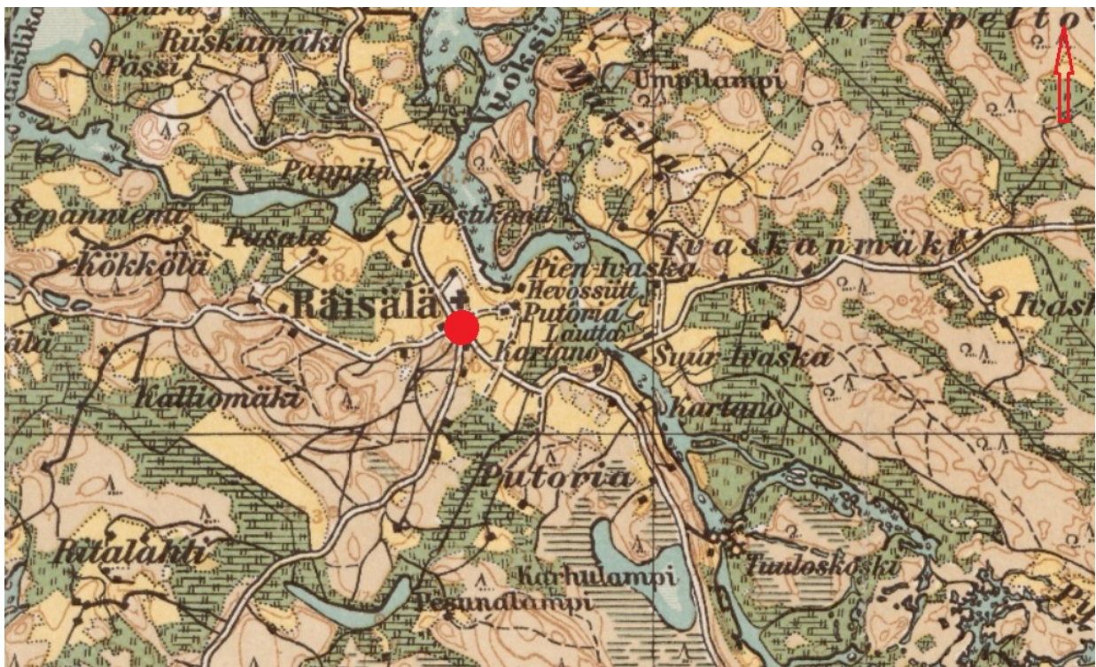
Рис. 4. Трасса обследования на фрагменте Финской довоенной карте Карельского перешейка.