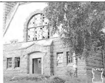
Фото 21.08.1941 года.

Оригинальный рисунок расстекловки оконных заполнений (девятичастный - в прямоугольных окнах, двенадцатичастный для шести секций в каждом центральном арочном проёме).