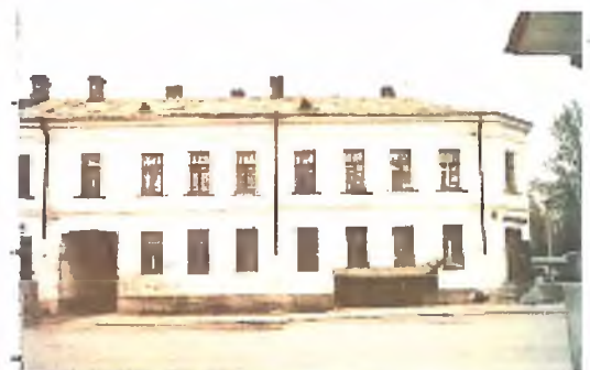
Фотография 1988 г.

сквозная арка проезда. местонахождение, габариты, конфигурация (лучковая),