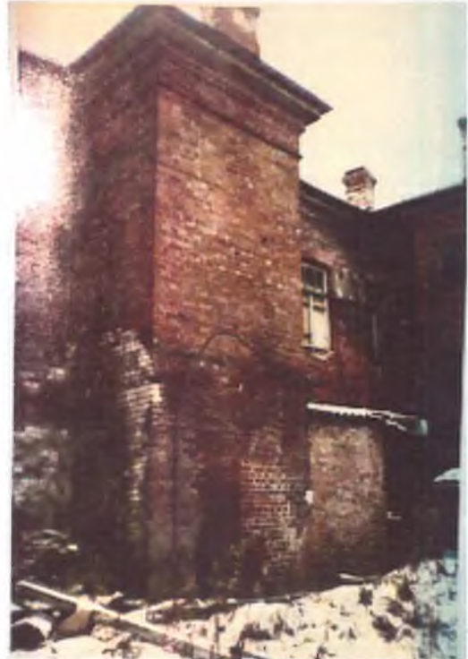
Фотография 2000 г.

венчающий карниз дворовых фасадов – на выносных известняковых плитах, дощатенных в основании поясом с каблучком и нижней полочкой (валником),