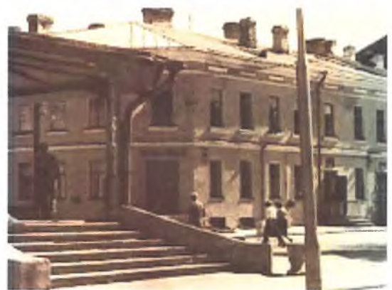
Фотография 1963 г.

междуетажная штукатурная тяга на лицевых фасадах (профилировка утрачена),