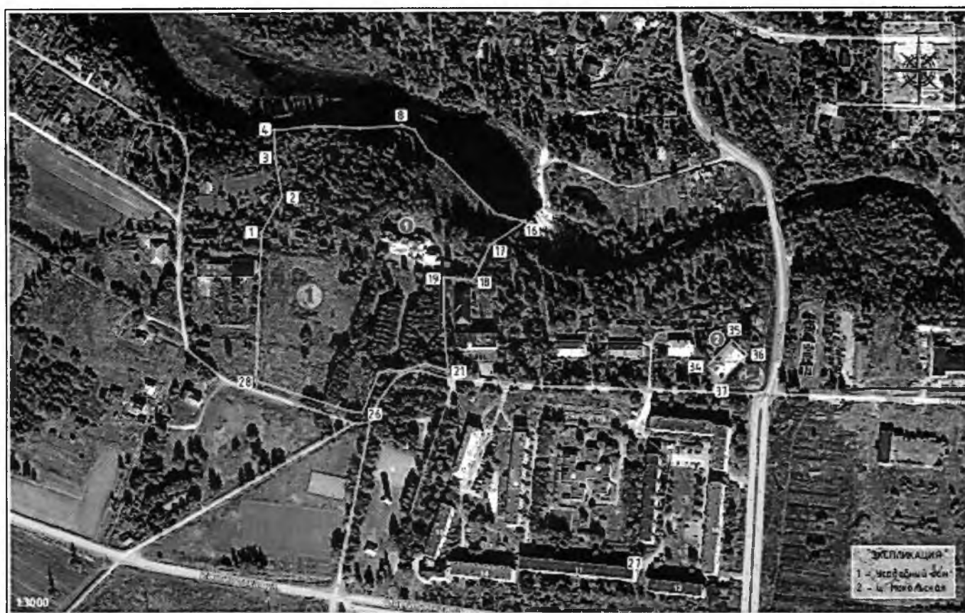
Карта (схема) границ территории объекта культурного наследия

Границы территории объекта культурного наследия регионального значения «Усадьба Елисеева» в составе: «Усадебный дом», «Церковь», «Парк» по адресу: Ленинградская область, Гатчинский муниципальный район, Сиверское городское поселение, д. Белогорка, ул. Институтская, д. 1, д. 3