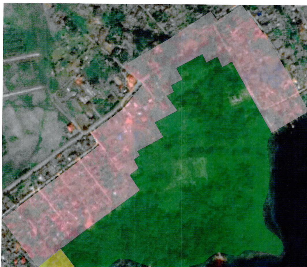
СХЕМА ГРАНИЦ ЗОН ОХРАНЫ объекта культурного наследия регионального значения «Усадьба Фредерихса -Васильчиковых - Строгановых», XVIII-XIXвв., расположенного по адресу: Ленинградская область, Гатчинский муниципальный район, Дружнорогское городское поселение, с. Орлино, ул. Центральная, 82.

Приложение № 1 к приказу комитета по сохранению культурного наследия Ленинградской области от «23» 12 2021 г. № 01-03/21-233