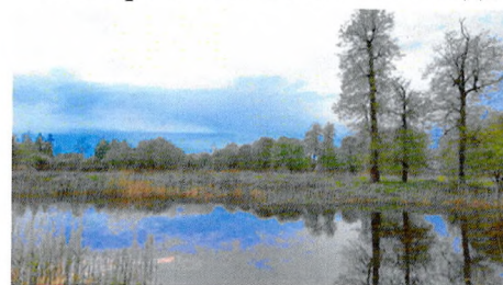
юго-восточная часть пруда