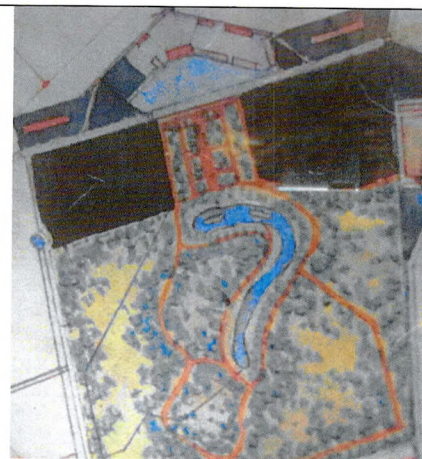
геометрический план 1857 года

историческими зданиями (в усадебной части);