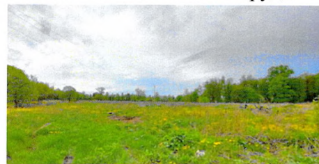
северо-восточная часть парка