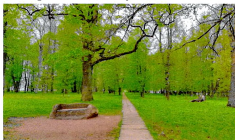
каменный диван в липовом парке (перенесен в 1970-е годы)