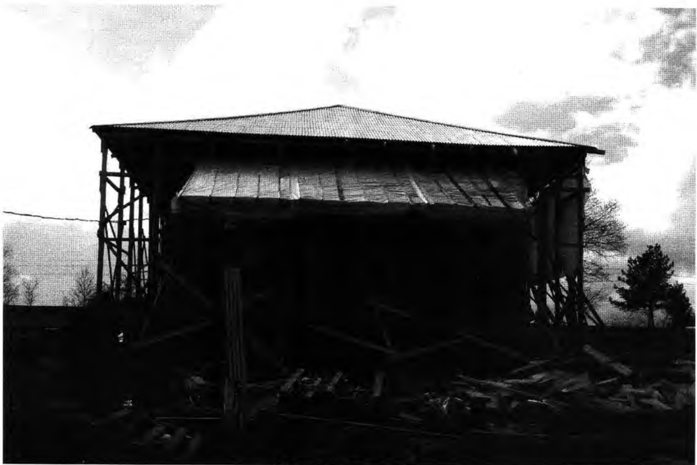
Общий вид с востока