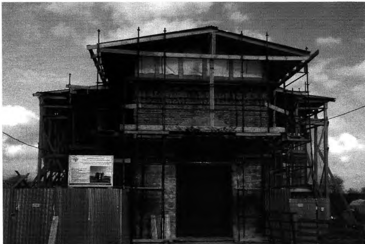
Общий вид с запада