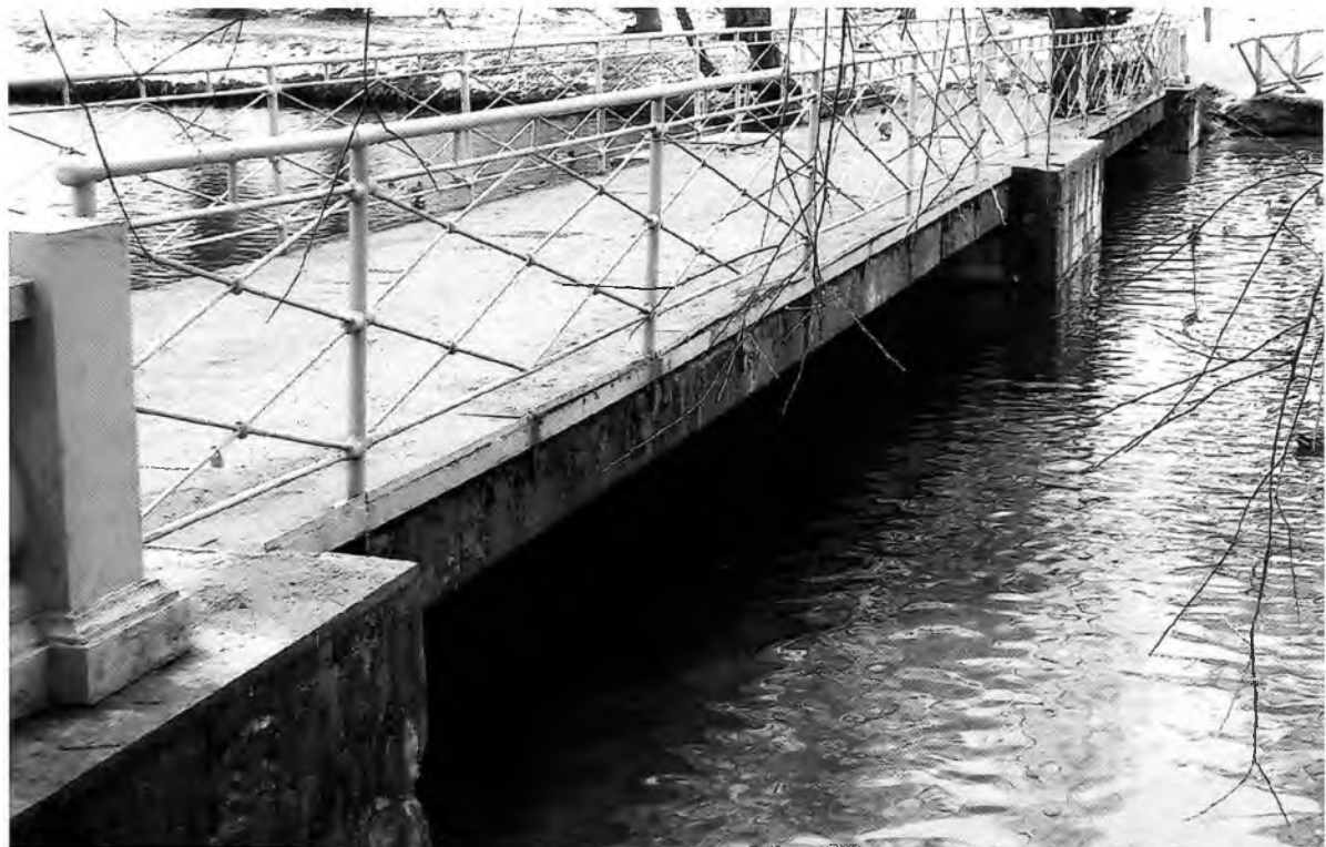
Паромные пристани на Белом озере. В южной части Белого озера