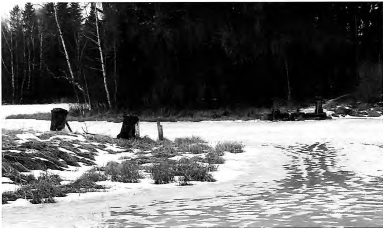
Паромные пристани на Белом озере Слева остров березовый, справа остров Пихтовый