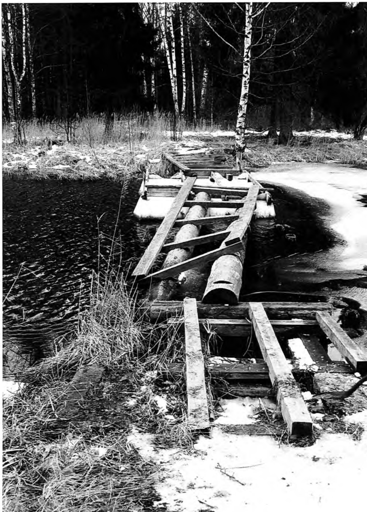
Паромные пристани на Белом озере Пристань на Длинном острове