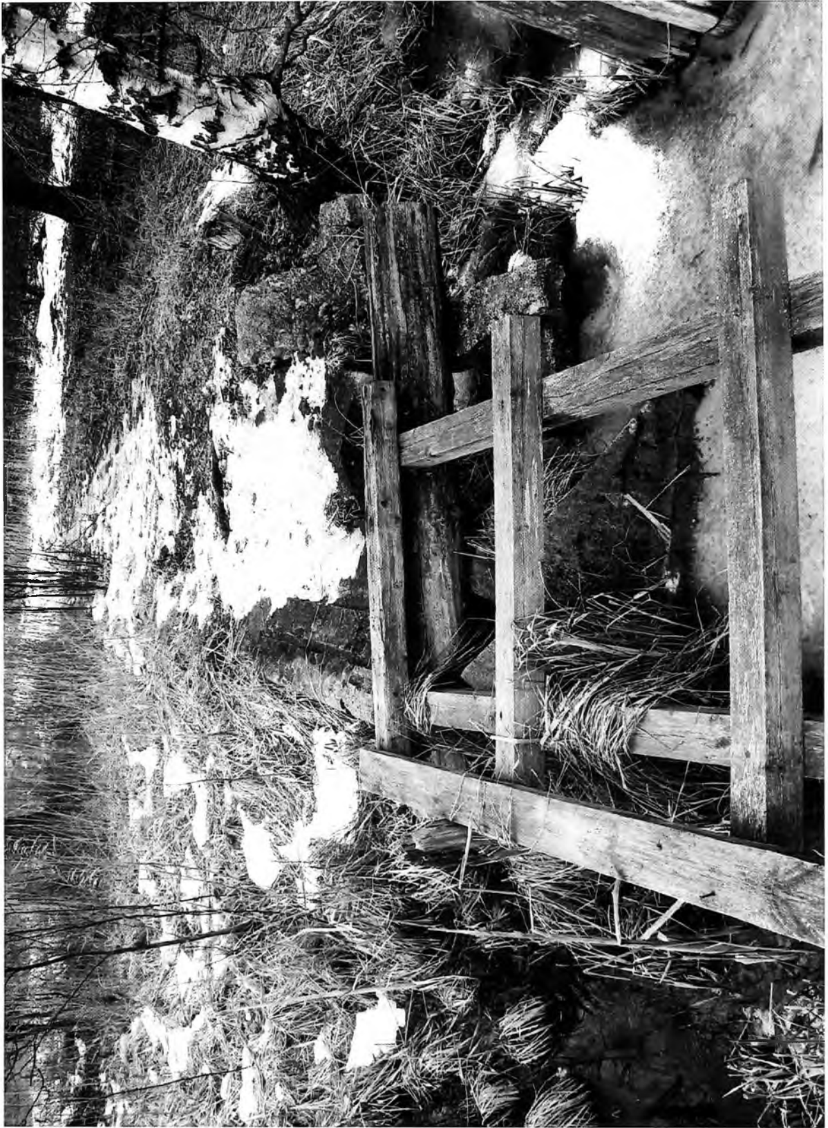
Пристань на Безымянном острове