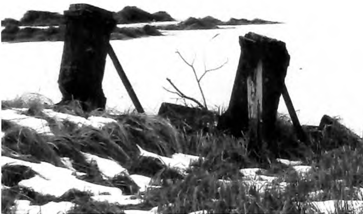
Причал на острове Березовом