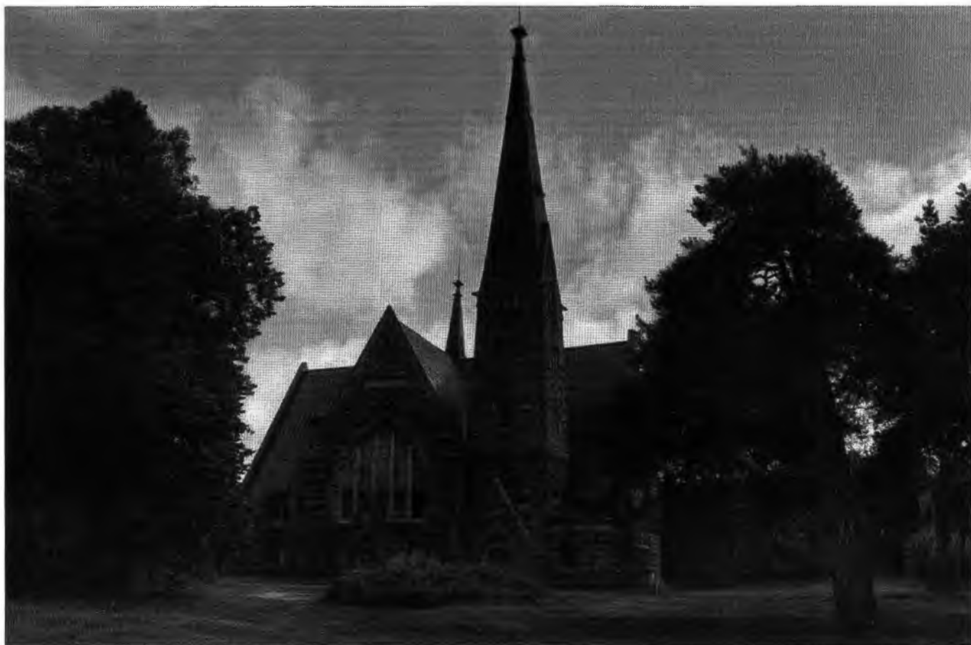
Фото 1. Общий вид объекта культурного наследия