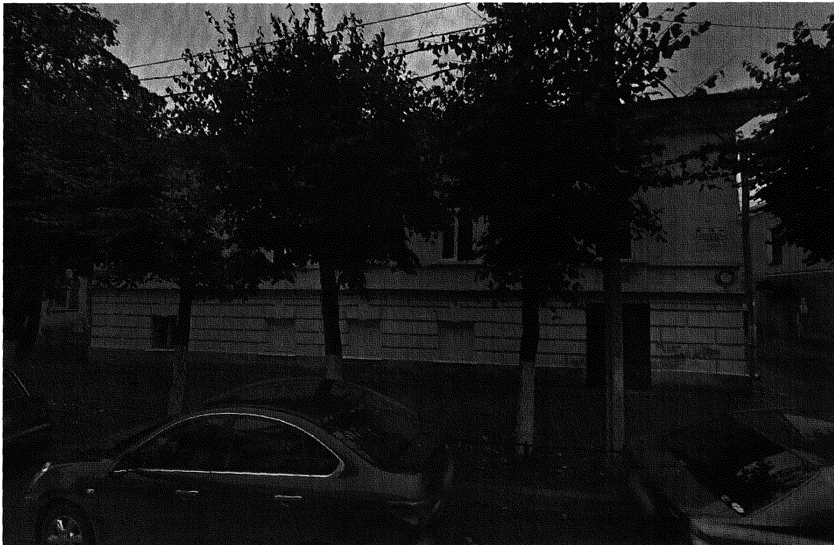
Восточный фасад, вид с востока (Красная ул.)