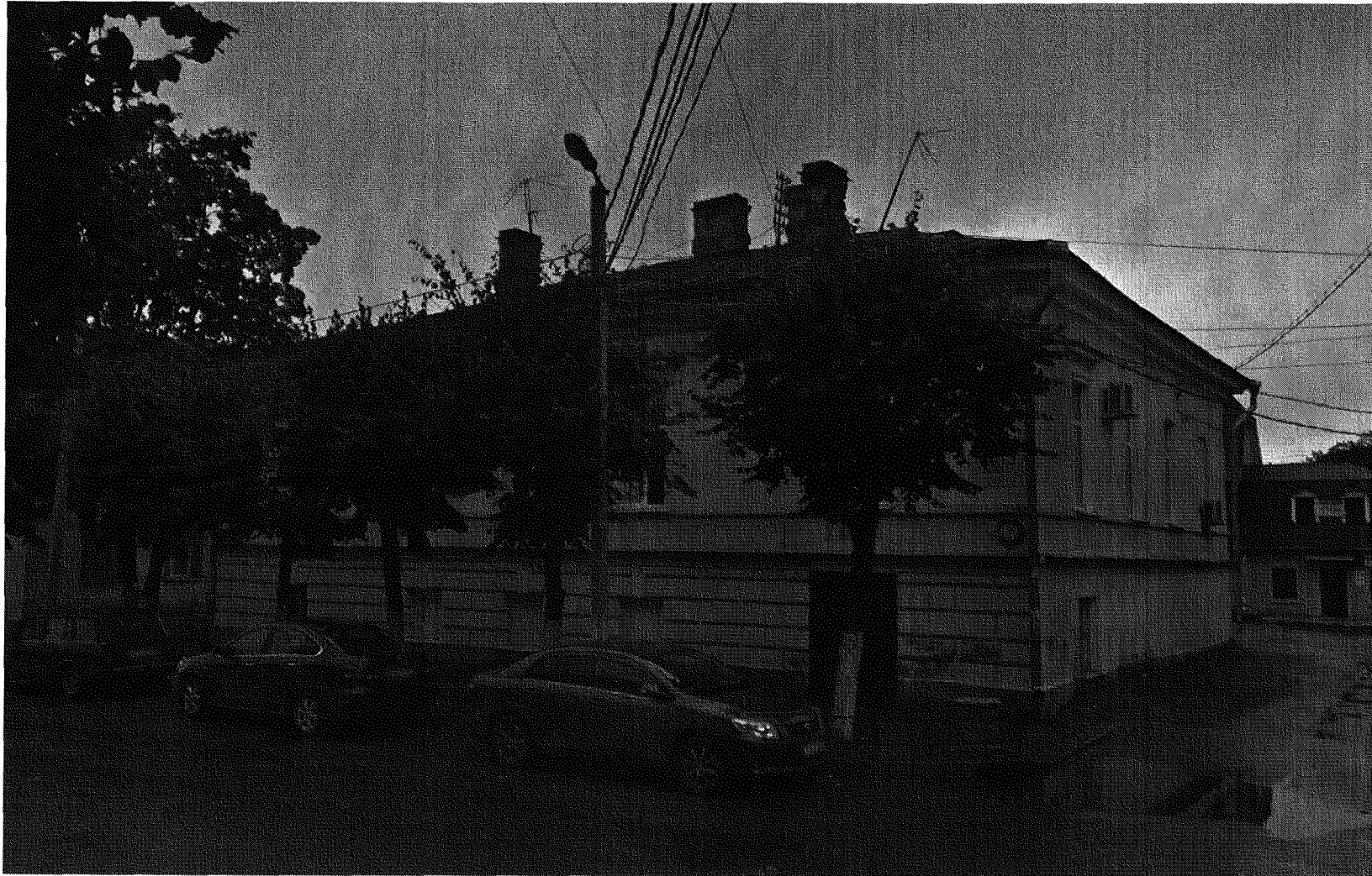
Восточный и северный фасады, вид с северо-востока (Красная ул.)