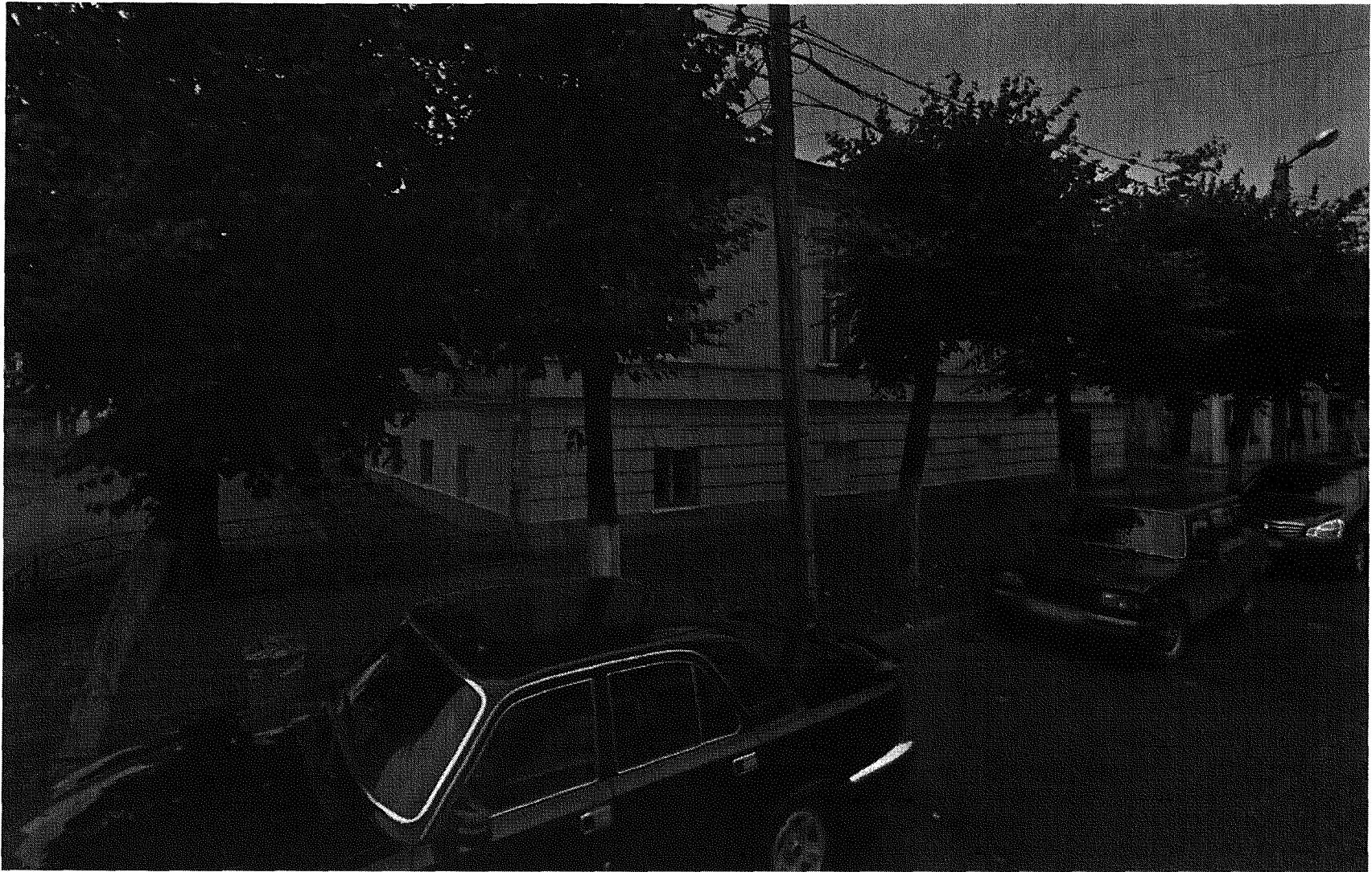
Южный и восточный фасады, вид с юго-востока (Красная ул.)