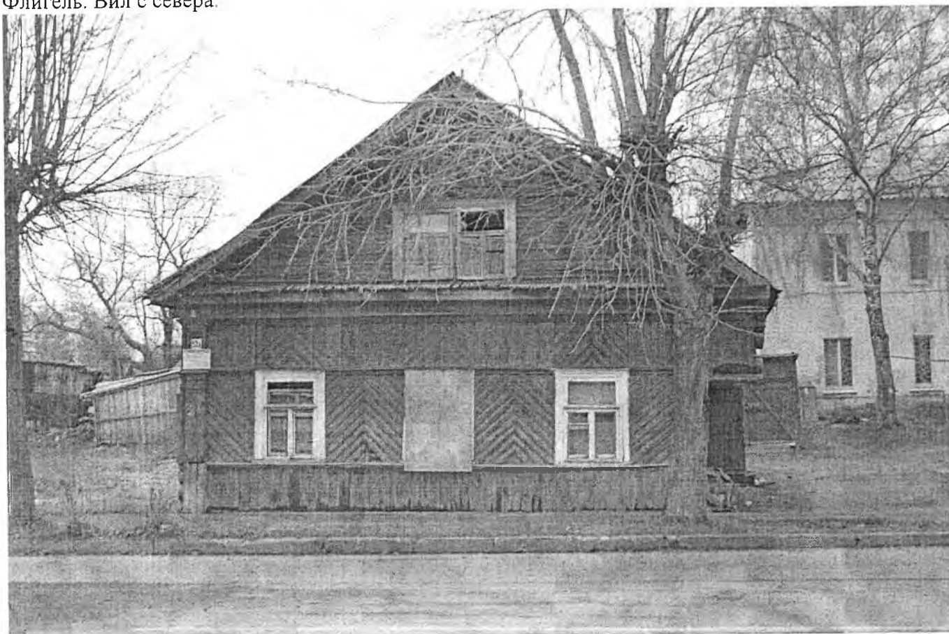
Флигель. Восточный фасад здания.