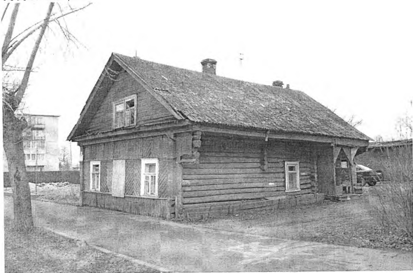
Флигель. Вил с севера.