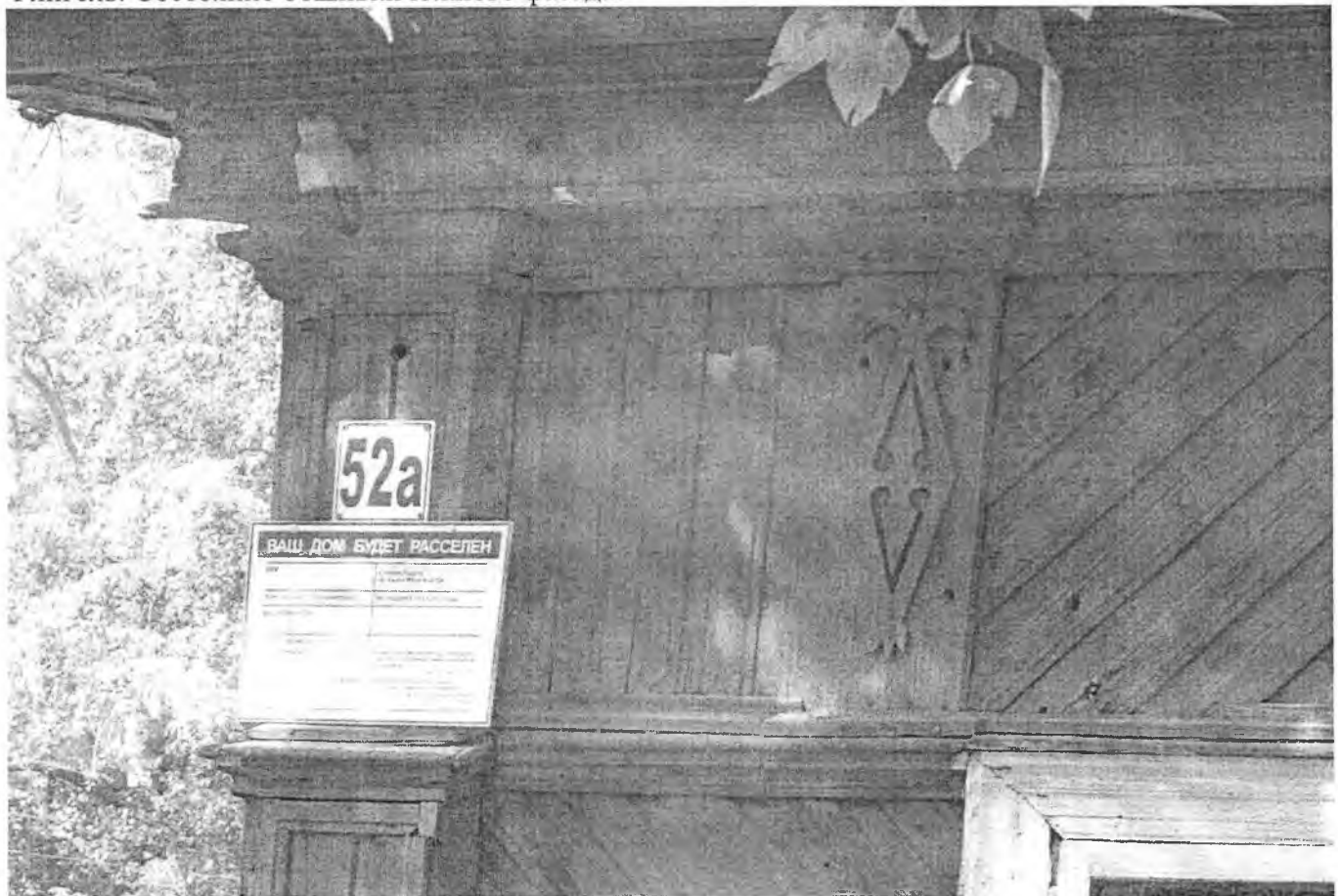
Флигель. Декор восточного фасада.