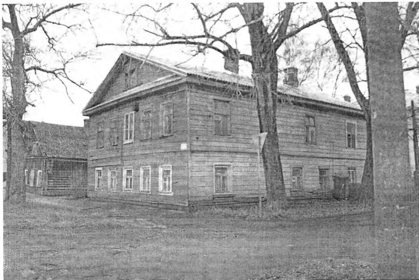
Общий вид объекта культурного наследия «Комплекс жилых домов Мухиных, вт. пол. XIX в.» Вид с юго-востока.