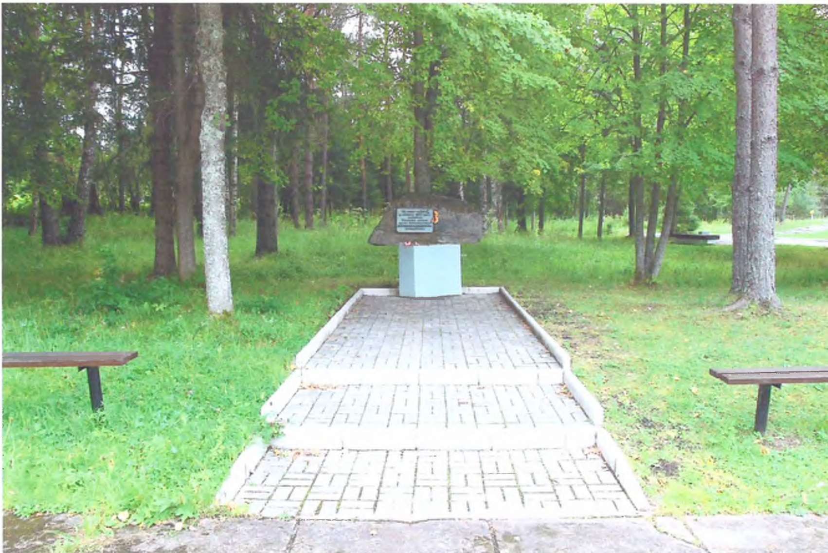
Фото 5. «Мемориальный комплекс, сооруженный на рубеже обороны советских войск в период боев за г. Тихвин в 1941 г.». Памятный рубежный камень. Вид с севера.