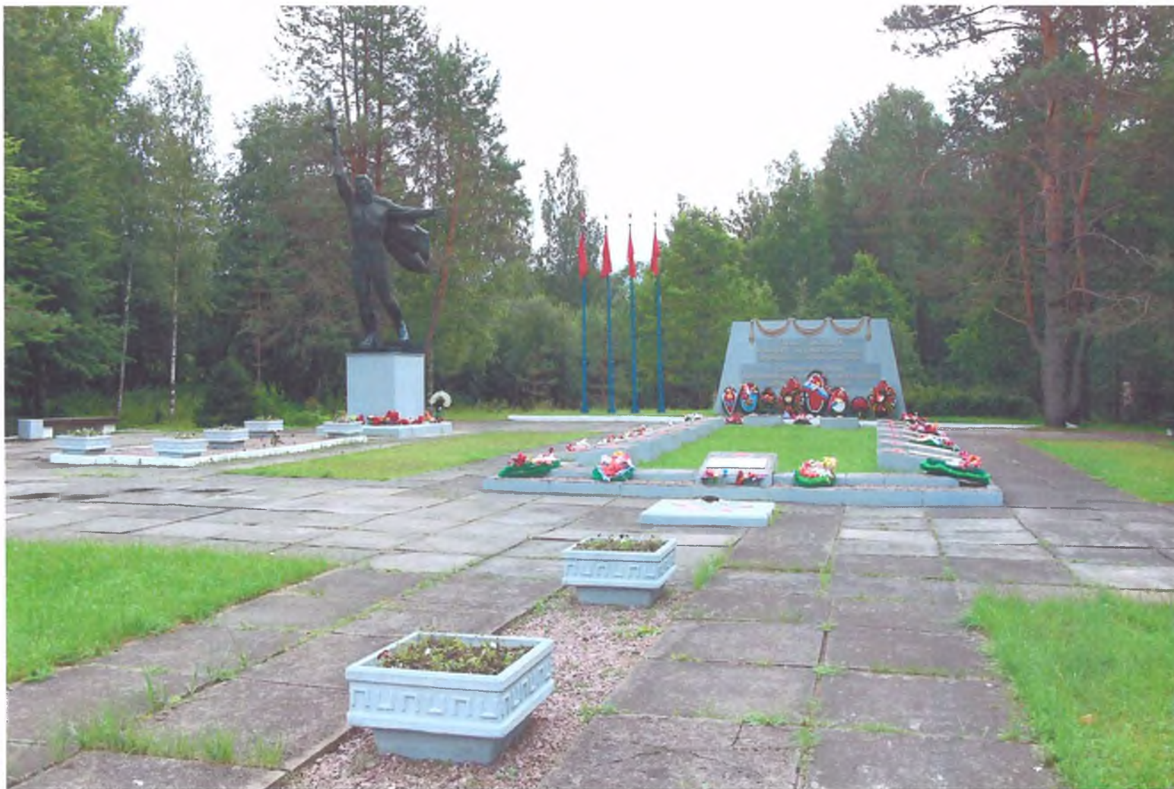
Фото 2. «Мемориальный комплекс, сооруженный на рубеже обороны советских войск в период боев за г. Тихвин в 1941 г.». Площадка мемориала, братские захоронения. Вид с севера.