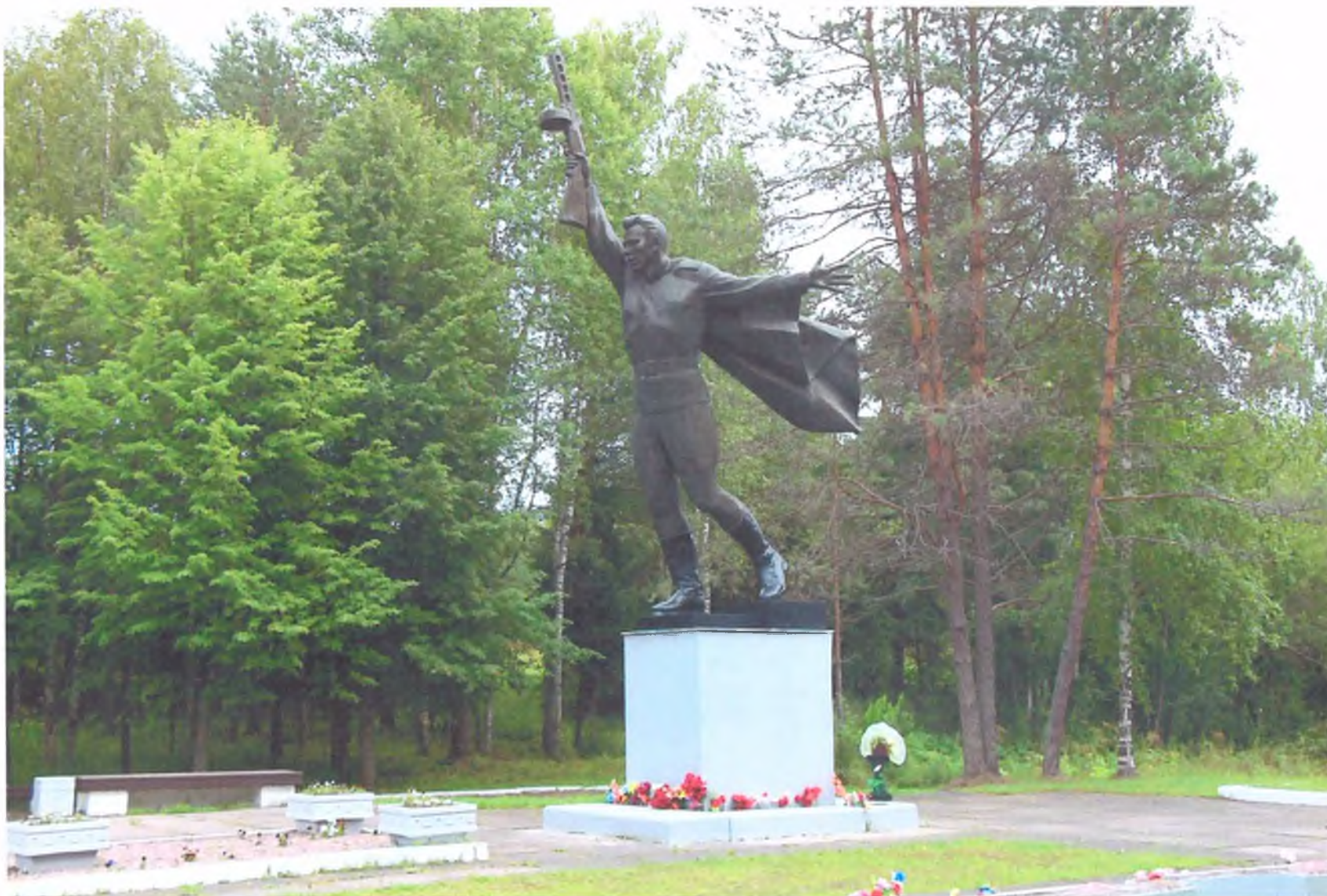
Фото 3. «Мемориальный комплекс, сооруженный на рубеже обороны советских войск в период боев за г. Тихвин в 1941 г.». Бронзовая скульптура «Солдат атакующий». Вид с запада.