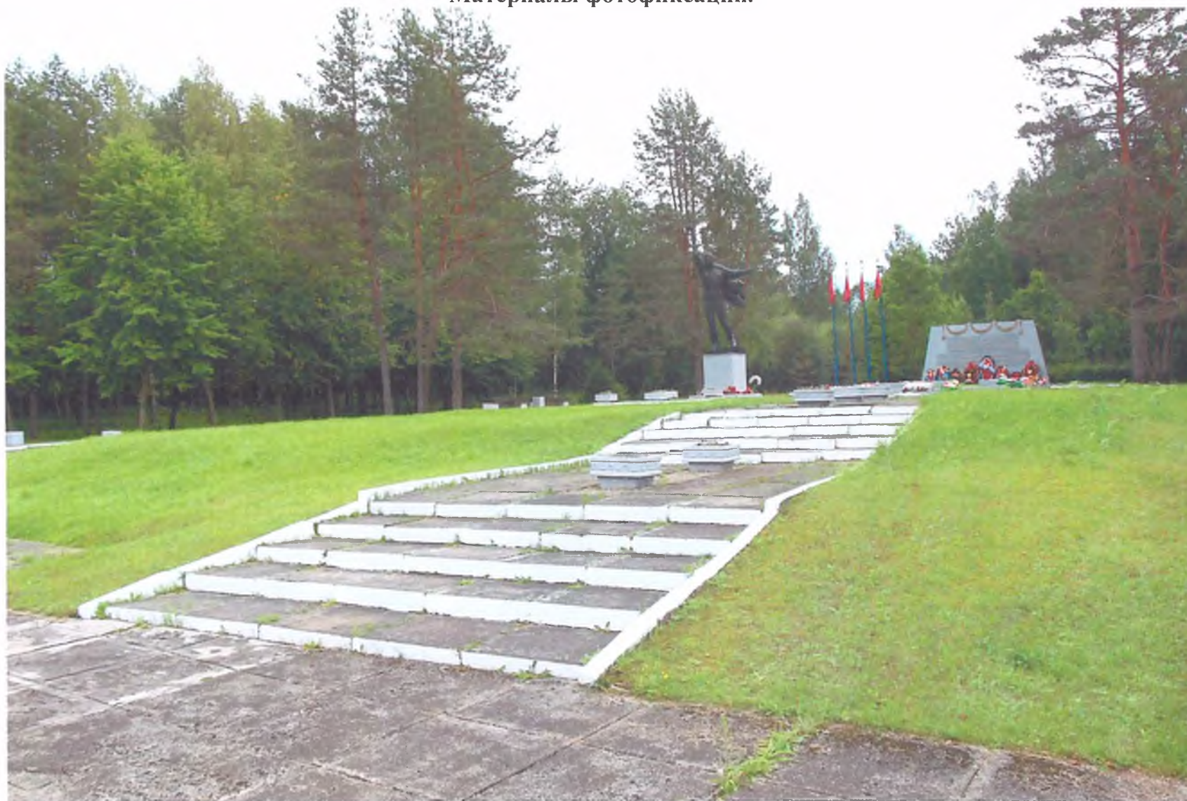
Фото 1. «Мемориальный комплекс, сооруженный на рубеже обороны советских войск в период боев за г. Тихвин в 1941 г.». Общий вид комплекса. Вид с северо-запада.