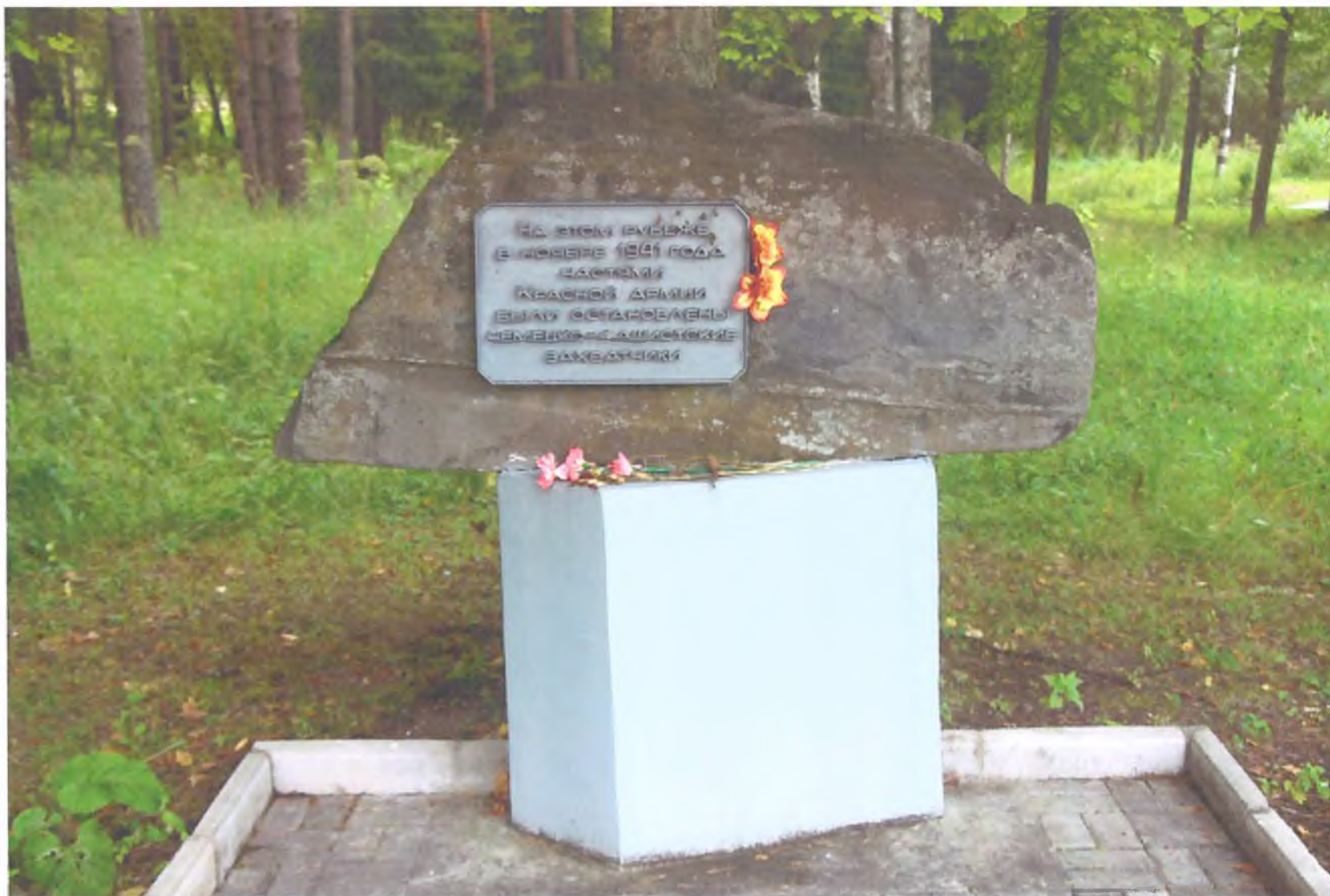
Фото 6. «Мемориальный комплекс, сооруженный на рубеже обороны советских войск в период боев за г. Тихвин в 1941 г.». Памятный рубежный камень крупным планом. Вид с севера.