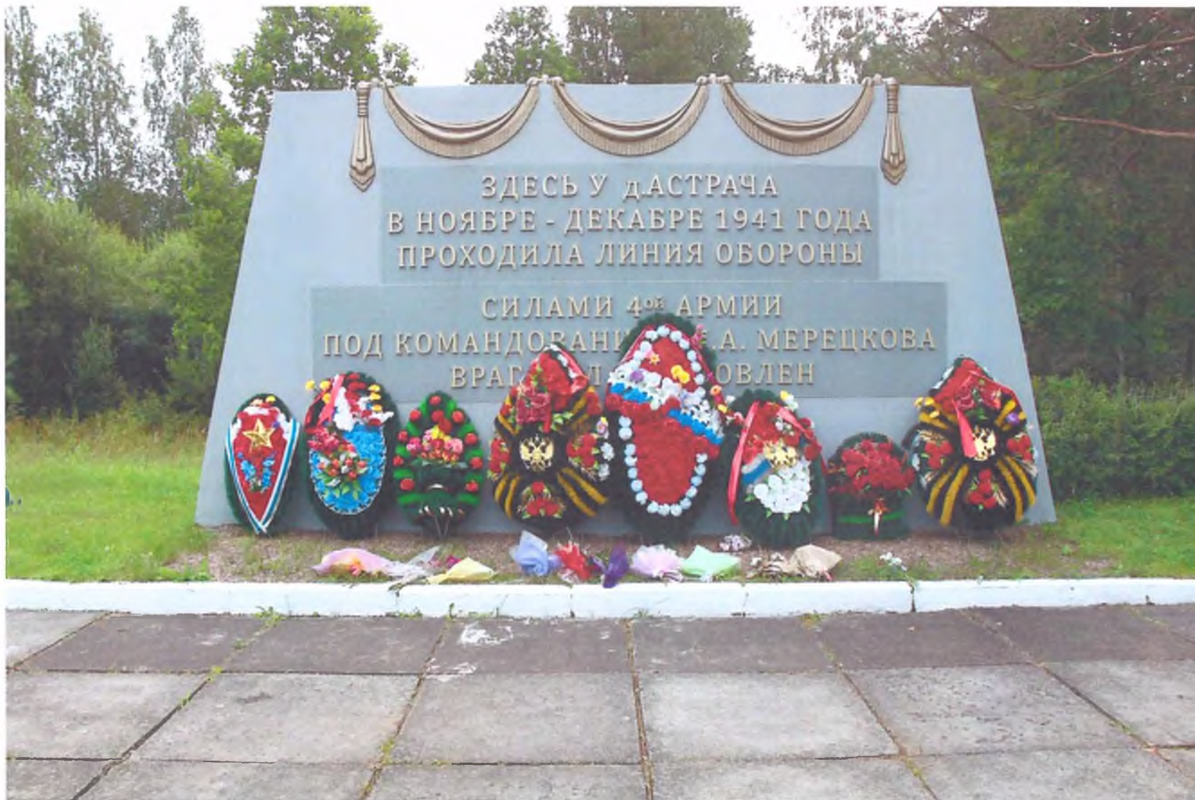
Фото 4. «Мемориальный комплекс, сооруженный на рубеже обороны советских войск в период боев за г. Тихвин в 1941 г.». Мемориальная стела. Вид с севера.