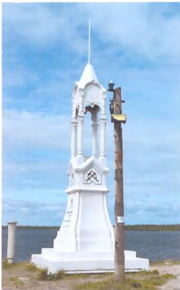
Фото 1. Белый маяк

Фотографическое изображение объекта культурного наследия федерального значения «Два памятника-маяка, сооруженные в честь строительства Ладожского канала» по адресу: Ленинградская область, Волховский муниципальный район, Свирицкое сельское поселение, пос. Свирица, ул. Новая Свирица - белый маяк, ул. Озерная - красный маяк