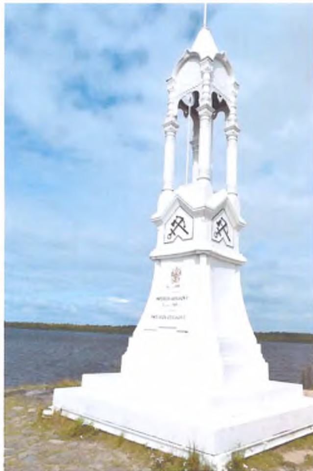
Фото 2. Белый маяк