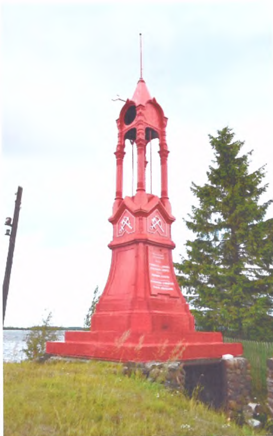
Фото 5. Красный маяк