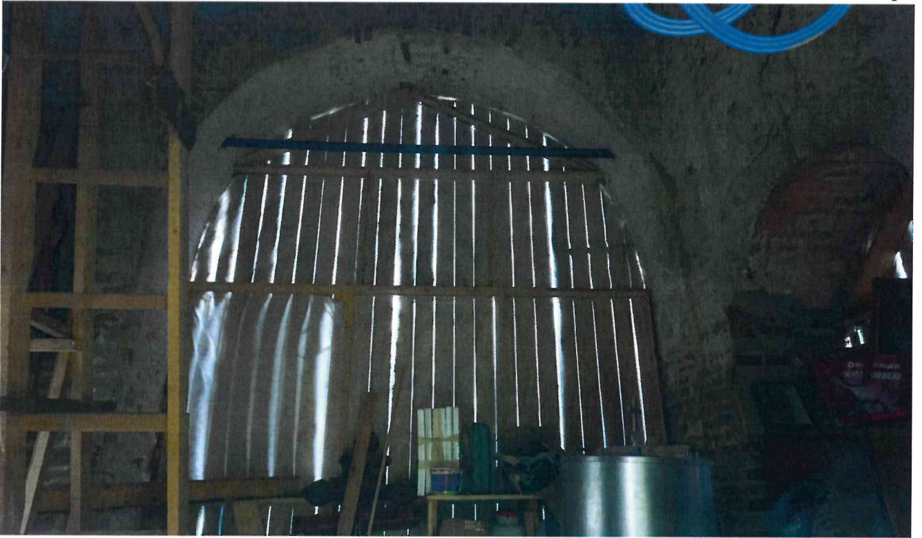
Фото 11. Помещение колокольни