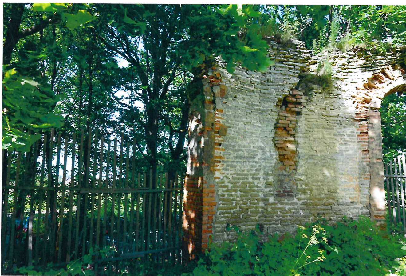
Фото 10. Внутренняя стена апсиды, примыкающая к северо-западному фасаду