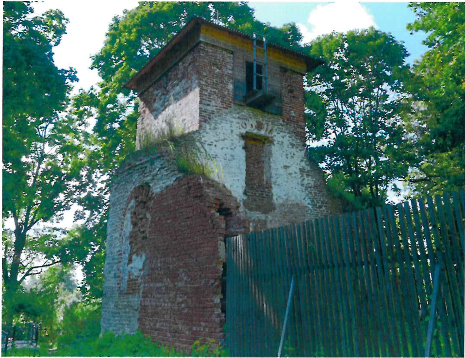
Фото 3. Вид на колокольню с востока. Фрагмент поздней кирпичной кладки на юго-восточном фасаде