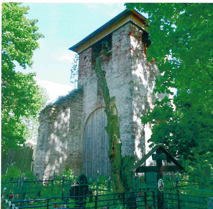
Фото 6. Угол юго-западного и северо-западного фасадов колокольни. Вид с запада