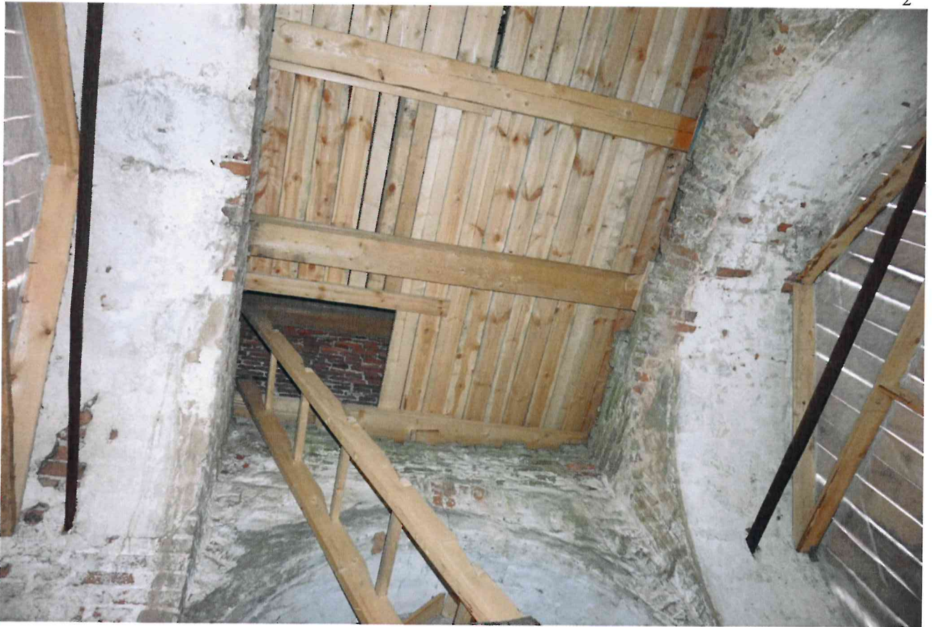
Фото 13. Помещение колокольни