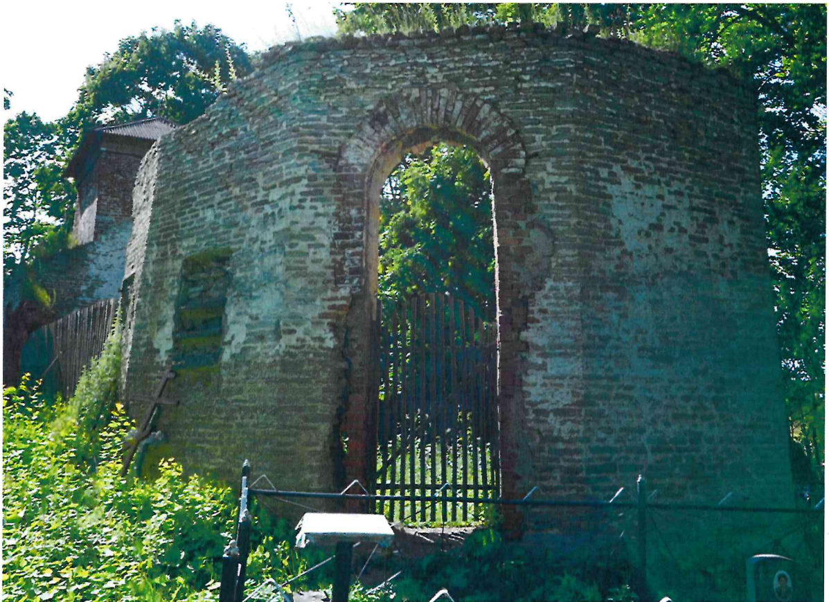
Фото 2. Сохранившиеся стены апсиды. Вид с северо-востока