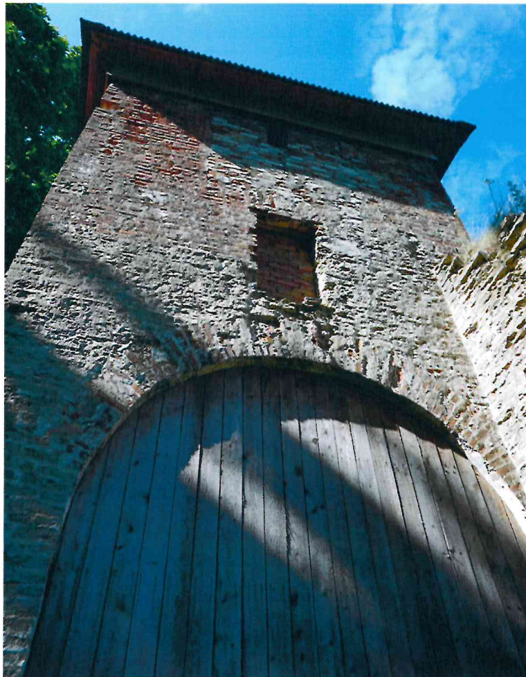
Фото 4. Юго-восточный фасад колокольни. Вид с юго-востока