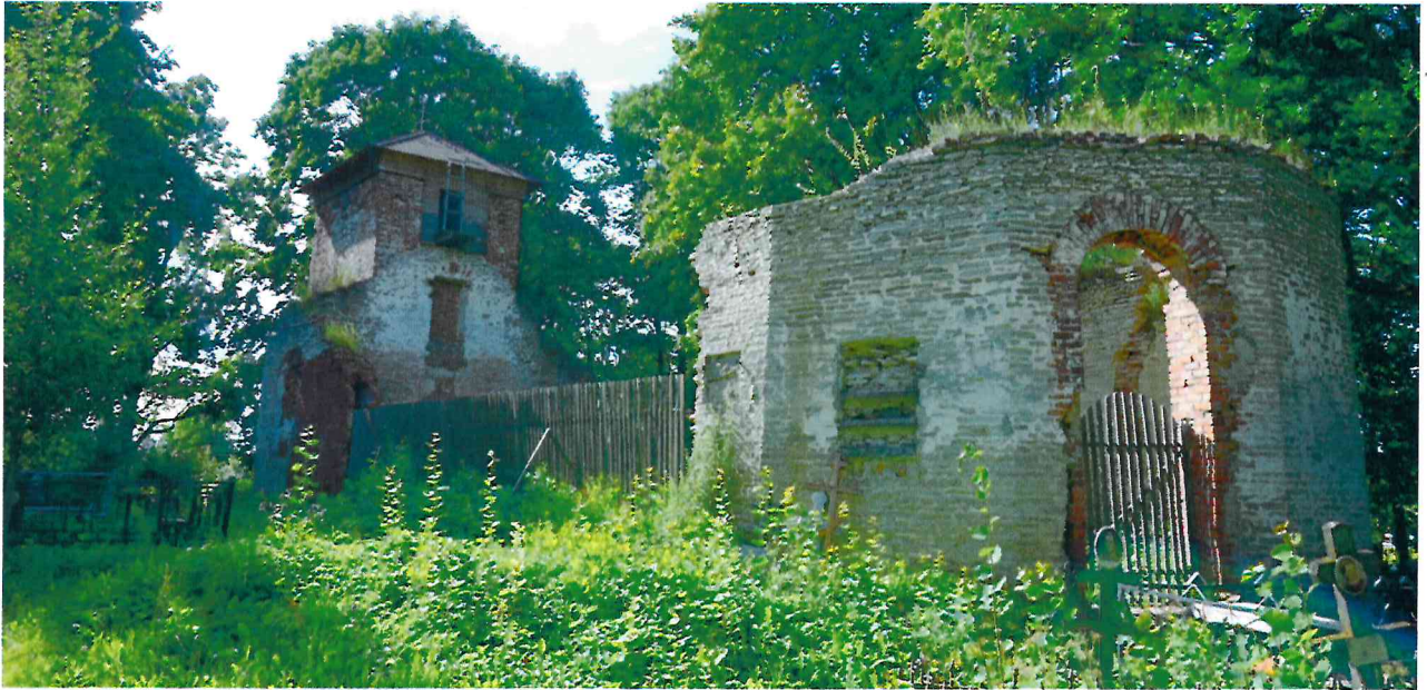
Фото 1. Общий вид с востока