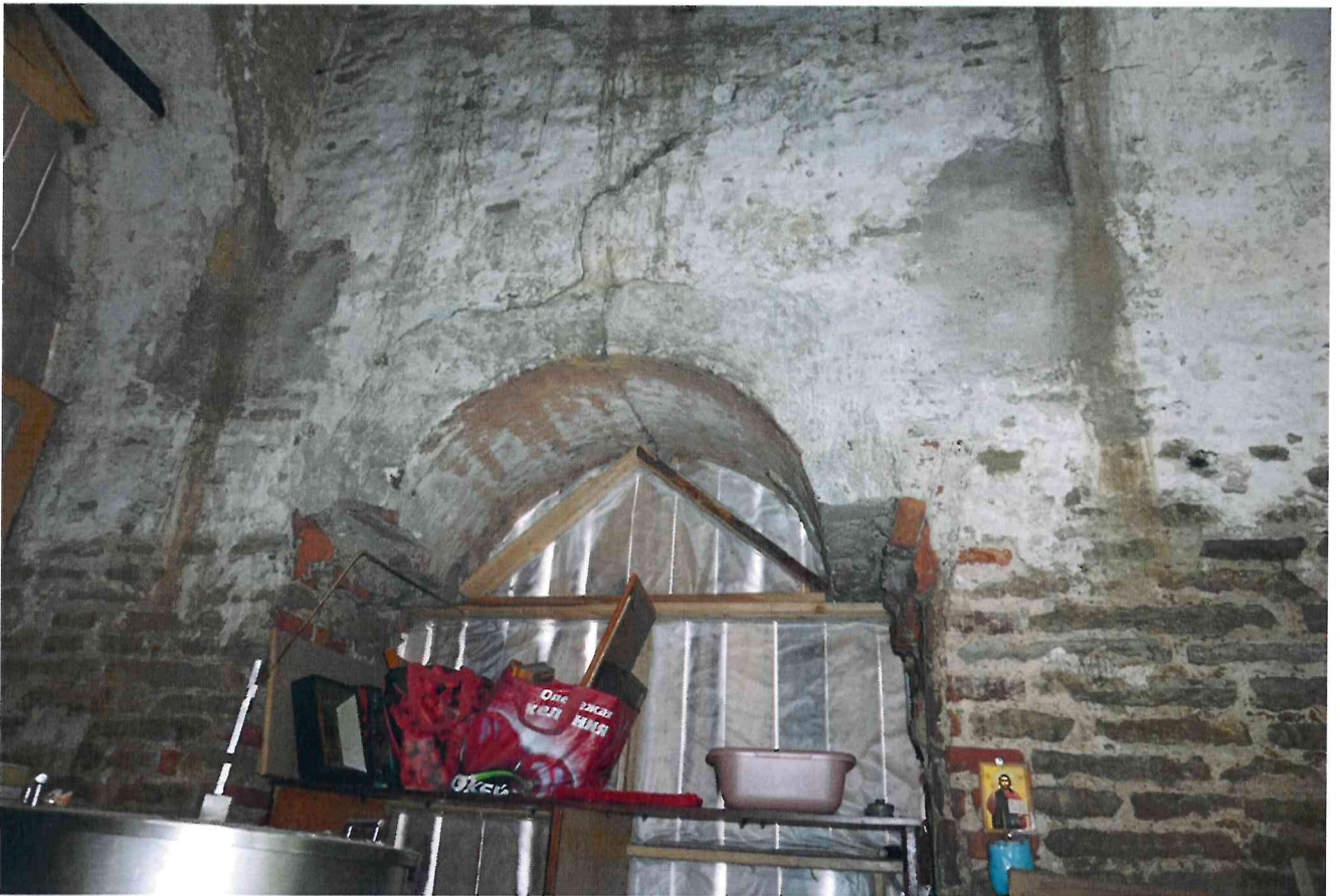
Фото 12. Помещение колокольни. Вид на проем в основное помещение церкви