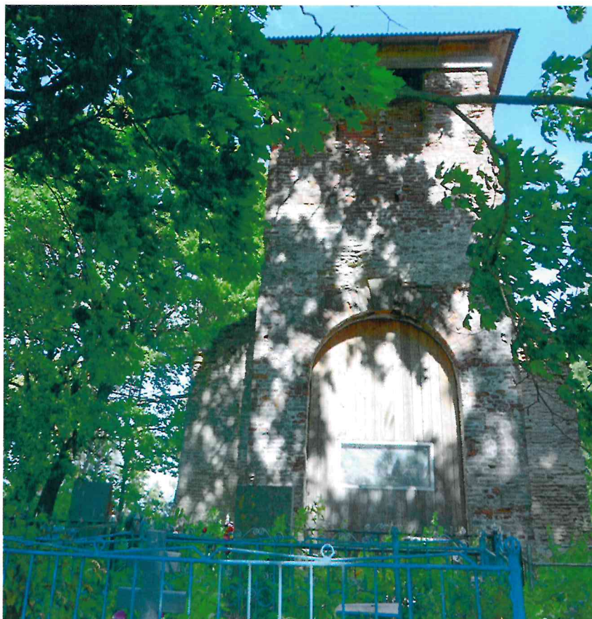
Фото 5. Юго-западный фасад колокольни. Вид с юго-запада