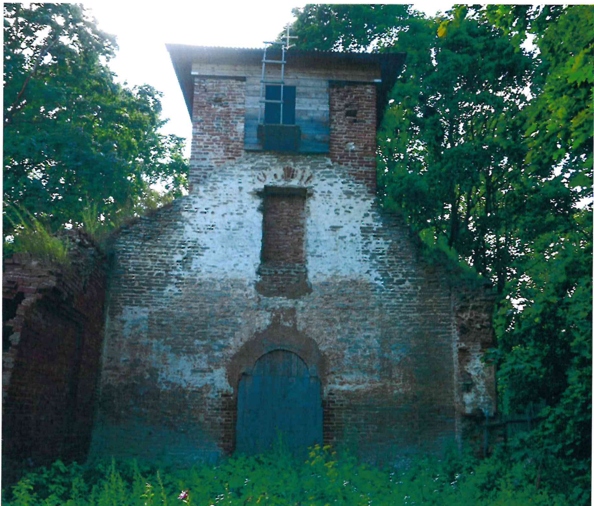
Фото 8. Внутренняя стена церкви, примыкающая к колокольне