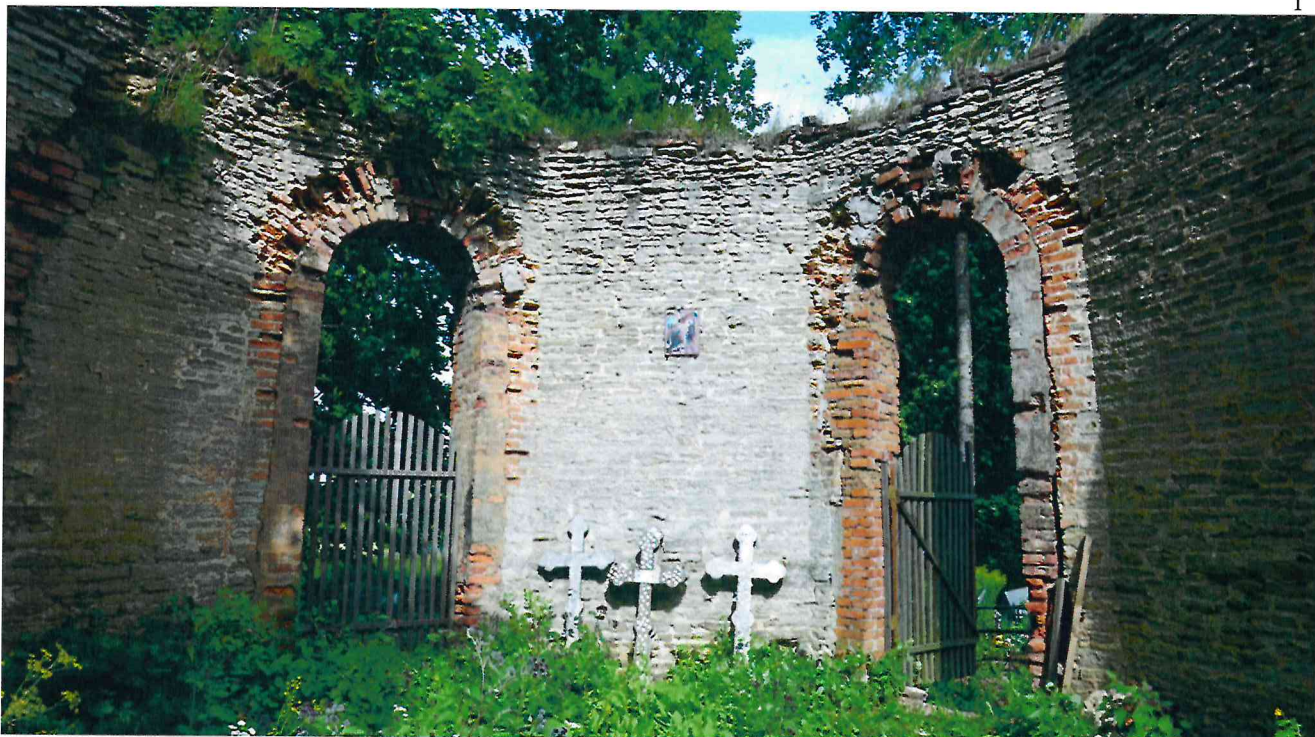
Фото 9. Внутренние стены апсиды