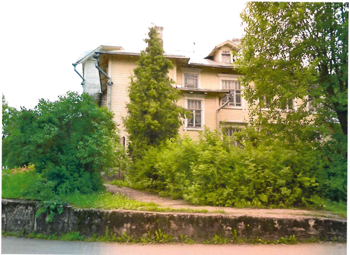
Фото 4. Общий вид с севера.