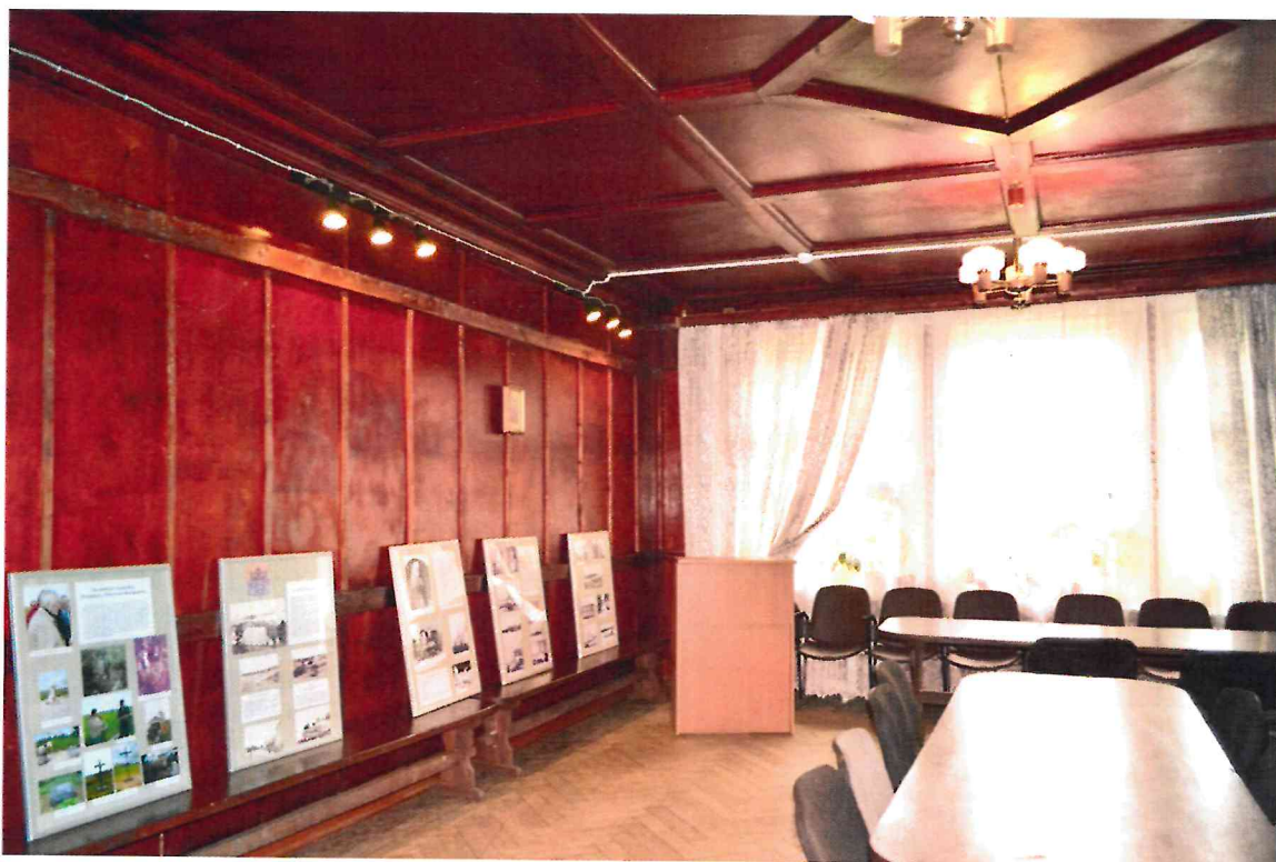
Фото 13. Помещения второго этажа.