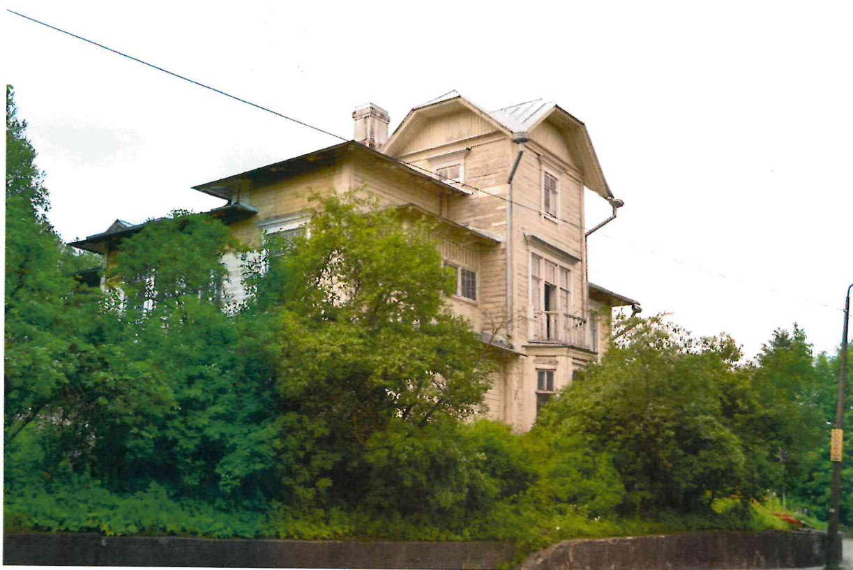
Фото 2. Общий вид с юго-востока.