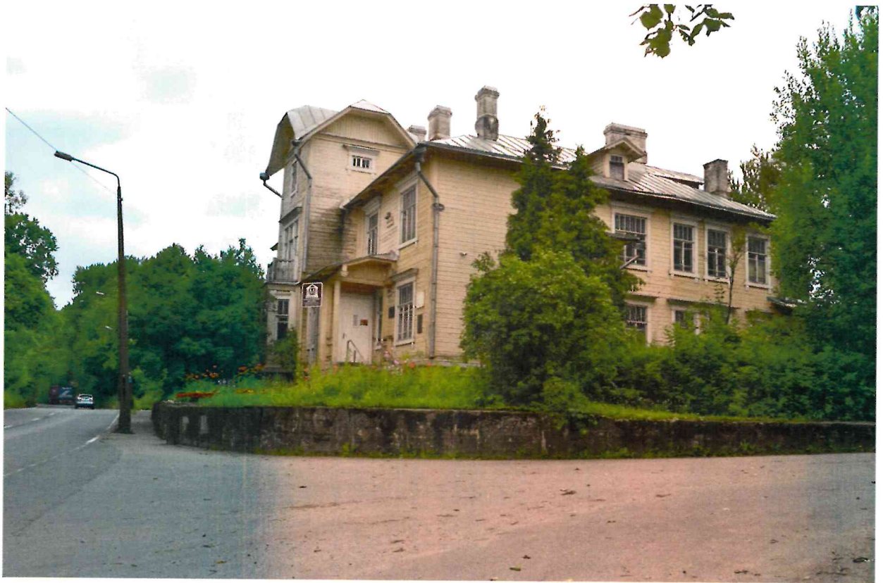
Фото 3. Общий вид с северо-востока.