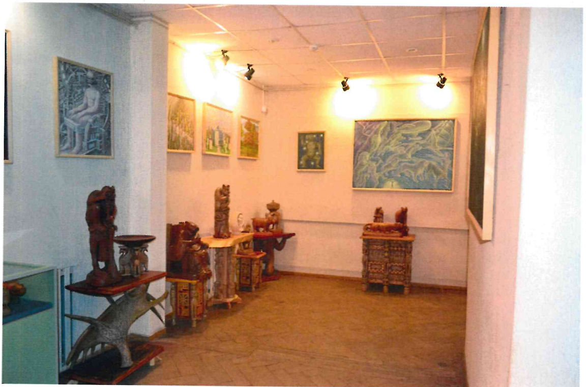
Фото 10. Помещения первого этажа.