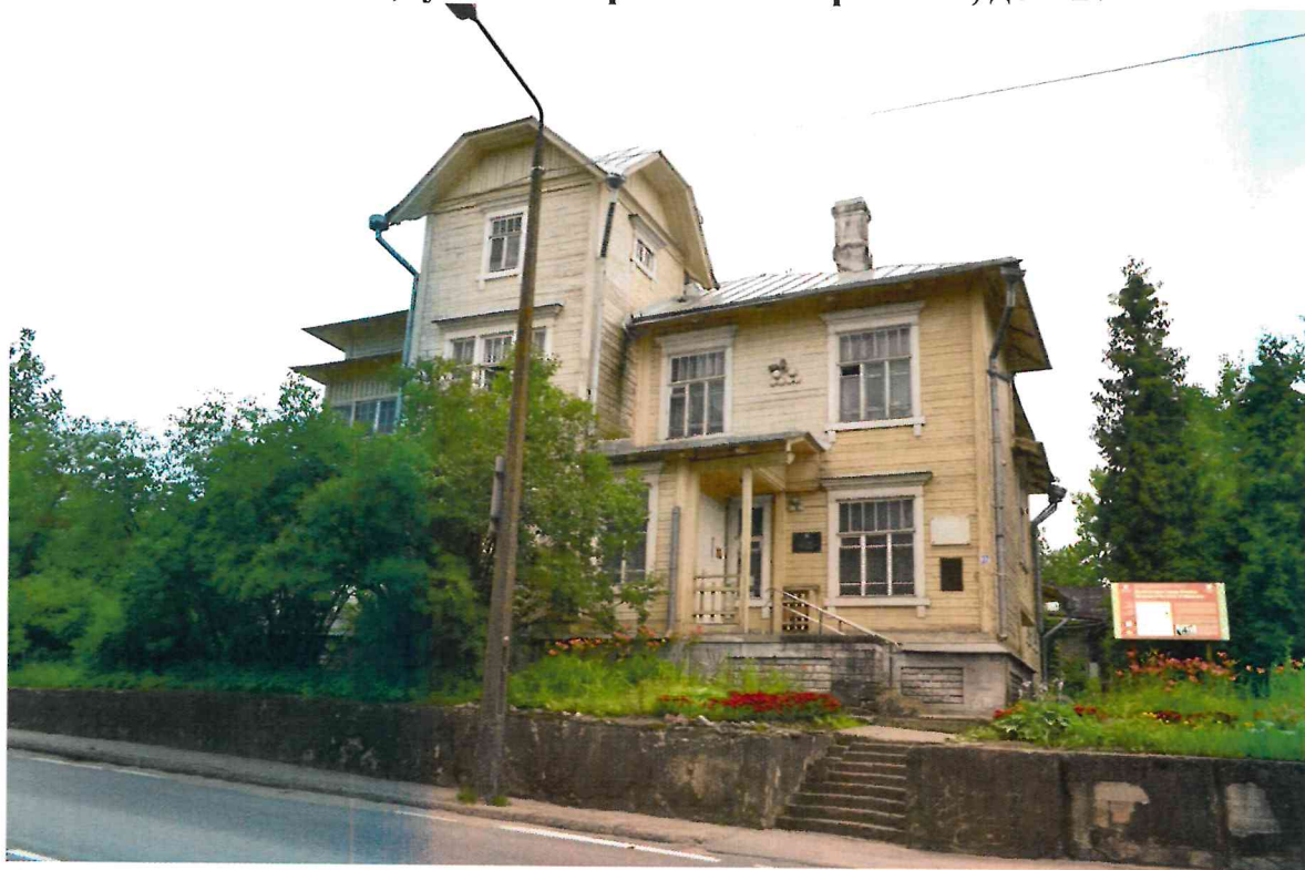
Фото 1. Общий вид с востока.

Фотографическое изображение объекта культурного наследия федерального значения «Дом, где жил и работал выдающийся советский энергетик Графтио Генрих Осипович, руководивший строительством Волховской ГЭС» по адресу: Ленинградская область, г. Волхов, ул. Октябрьская набережная, дом 27