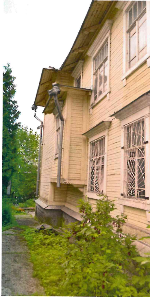
Фото 6. Общий вид с запада.