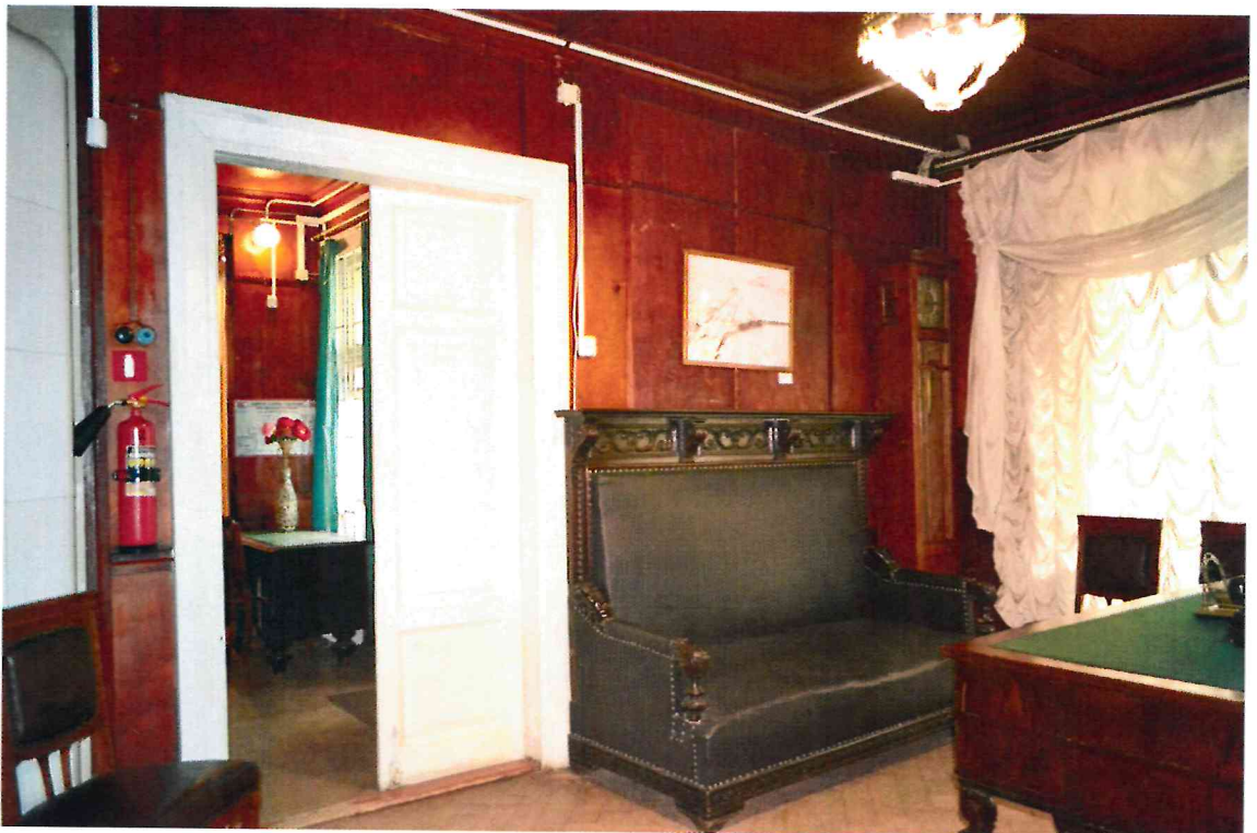
Фото 8. Помещения первого этажа