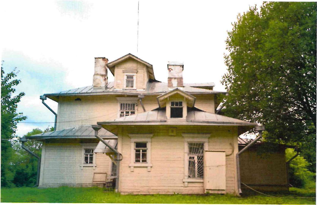
Фото 5. Общий вид с запада.