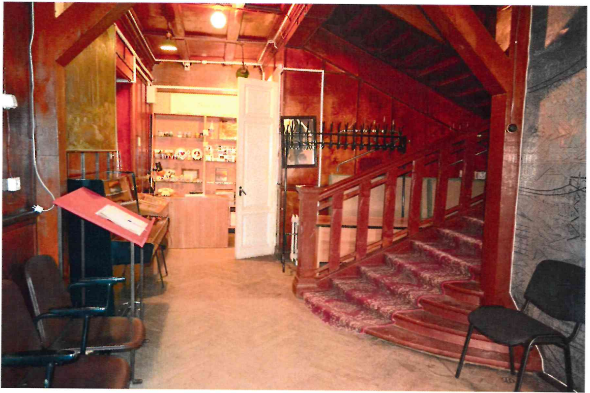
Фото 7. Помещения первого этажа