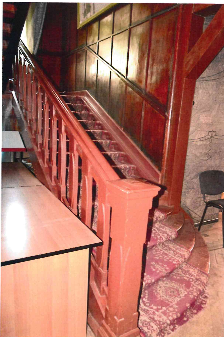
Фото 12. Лестница с первого на второй этаж.