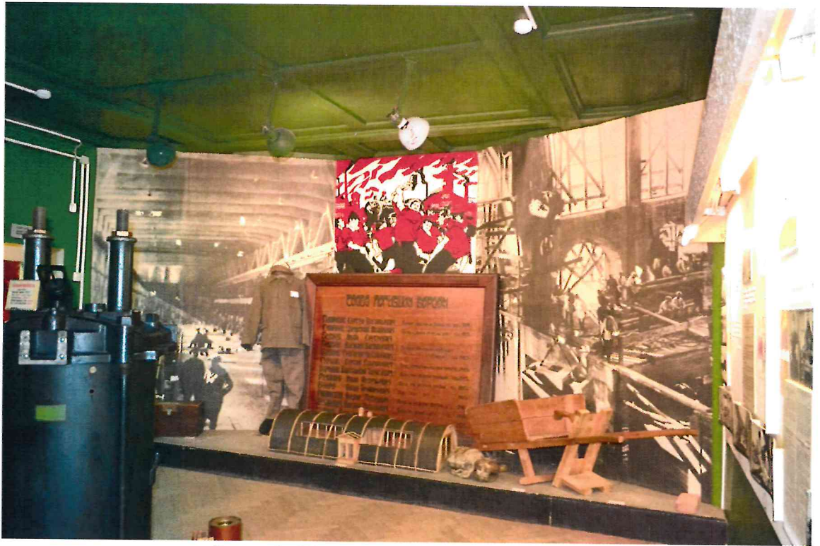
Фото 9. Помещения первого этажа.