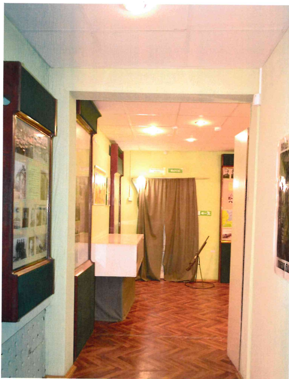
Фото 11. Помещения первого этажа.