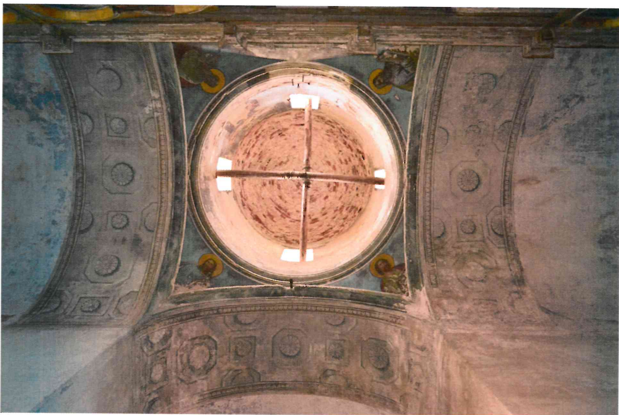
Фото 11. Роспись подкупольного пространства. Вид с востока на запад.