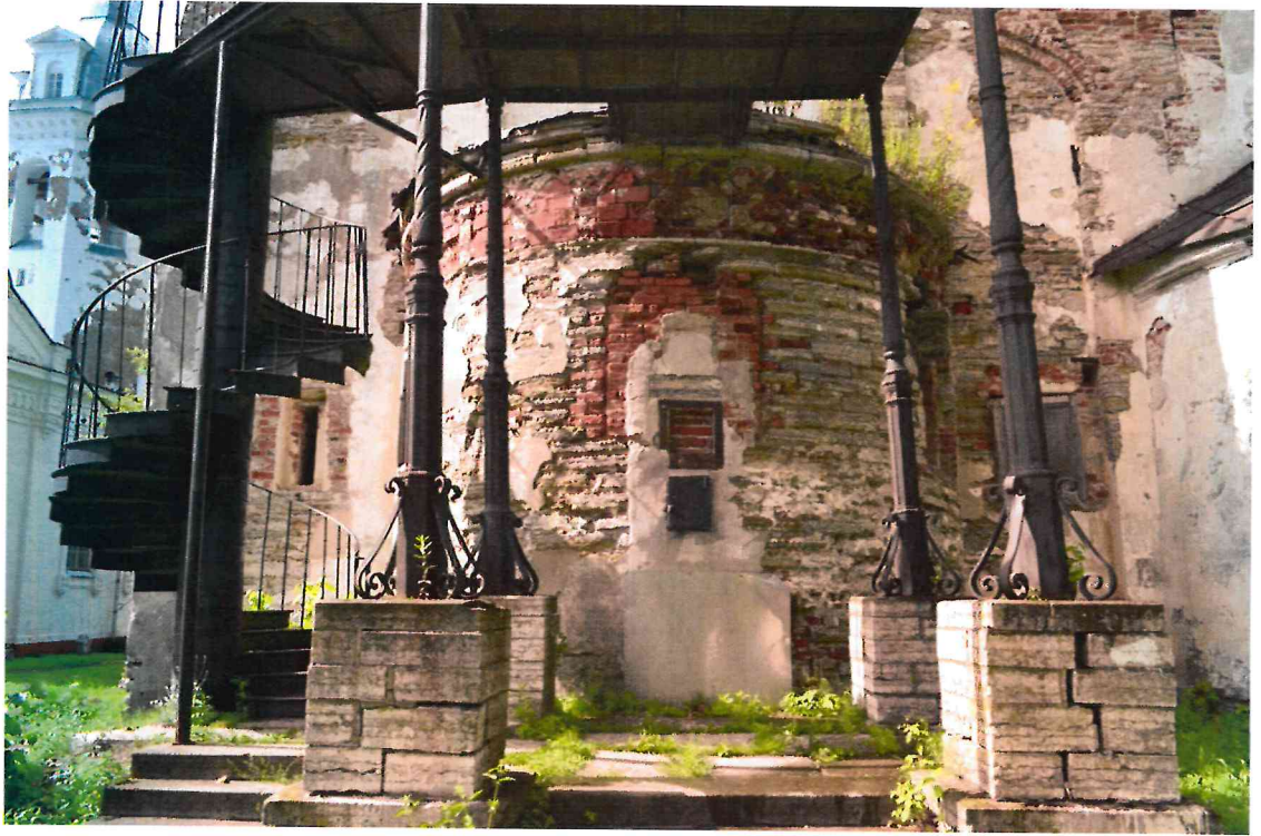
Фото 7. Южная апсида с крыльцом. Вид востока.