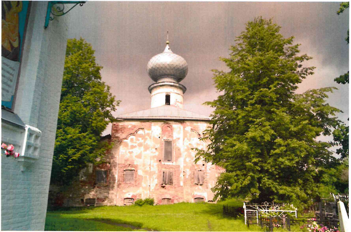
Фото 3. Вид на южный фасад.