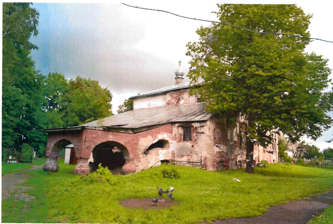
Фото 1. Общий вид с юго-запада.

Фотографическое изображение объекта культурного наследия федерального значения «Никольская церковь быв. Медведского монастыря, XVI в.» по адресу: Ленинградская область, Волховский район, г. Новая Ладога, проспект Карла Маркса, д. 49а