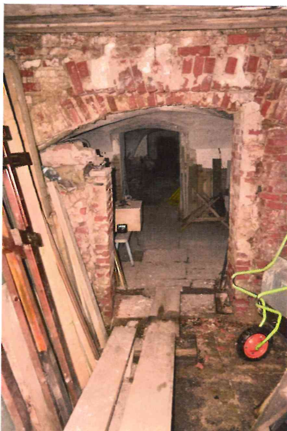
Фото 12. Вход в Нижний храм. Вид с запад.