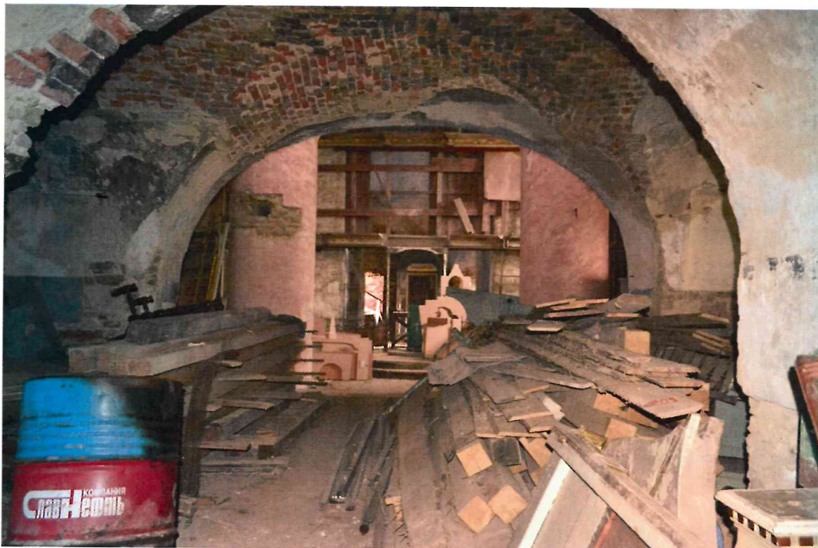
Фото 9. Интерьер Никольской церкви. Вид на алтарь с запада.