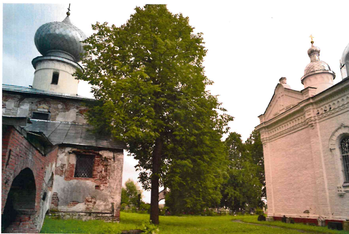
Фото 2. Общий вид с запада.