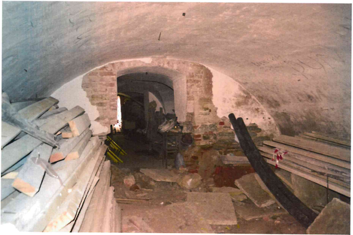
Фото 13. Вид с востока в сторону входа.