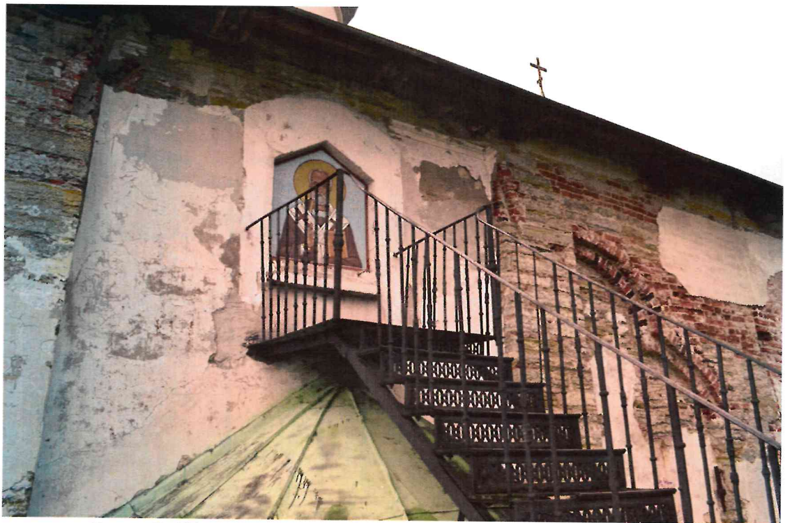
Фото 8. Икона Николая Чудотворца. Вид юго-востока.