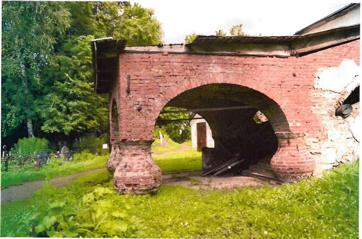
Фото 6. Общий вид территории. Вид с севера.