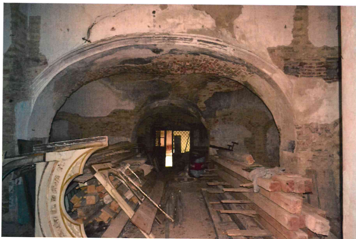
Фото 10. Сени. Вид с востока на запад.