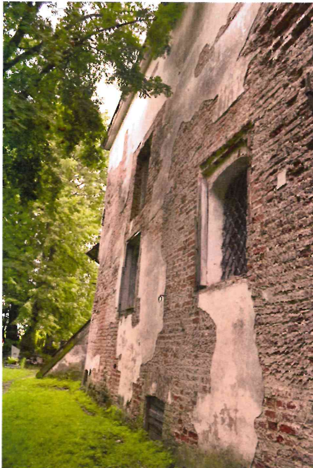
Фото 4. Фрагмент северного фасада. Вид с северо-запада.