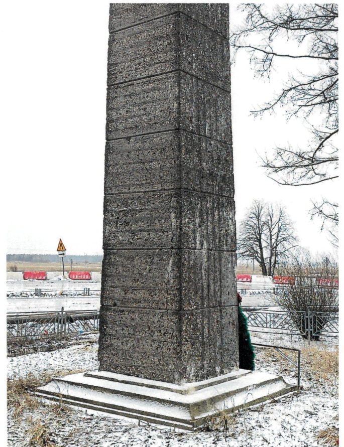
Рис. 8, 9. Фрагменты бокового северо-западного и заднего северо-восточного фасадов.