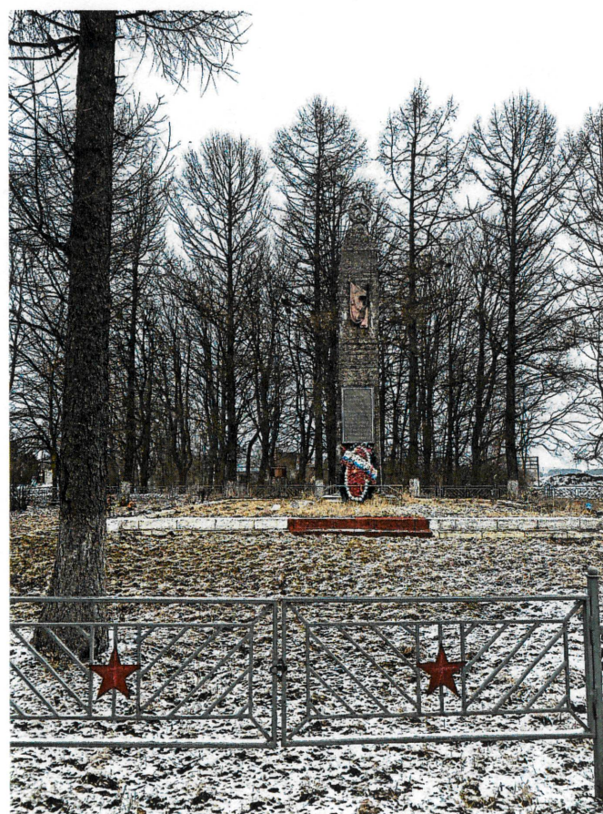
Рис. 4, 5. Обелиск. Вид с юга. Фрагмент ограждения территории