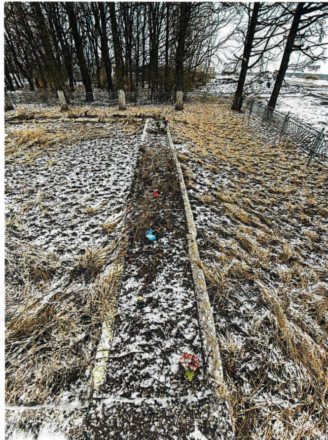
Рис. 10, 11. Фрагменты территории. Цветник