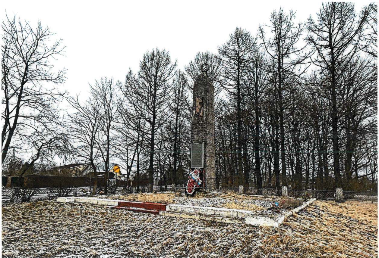
Рис. 1. Общий вид с юга