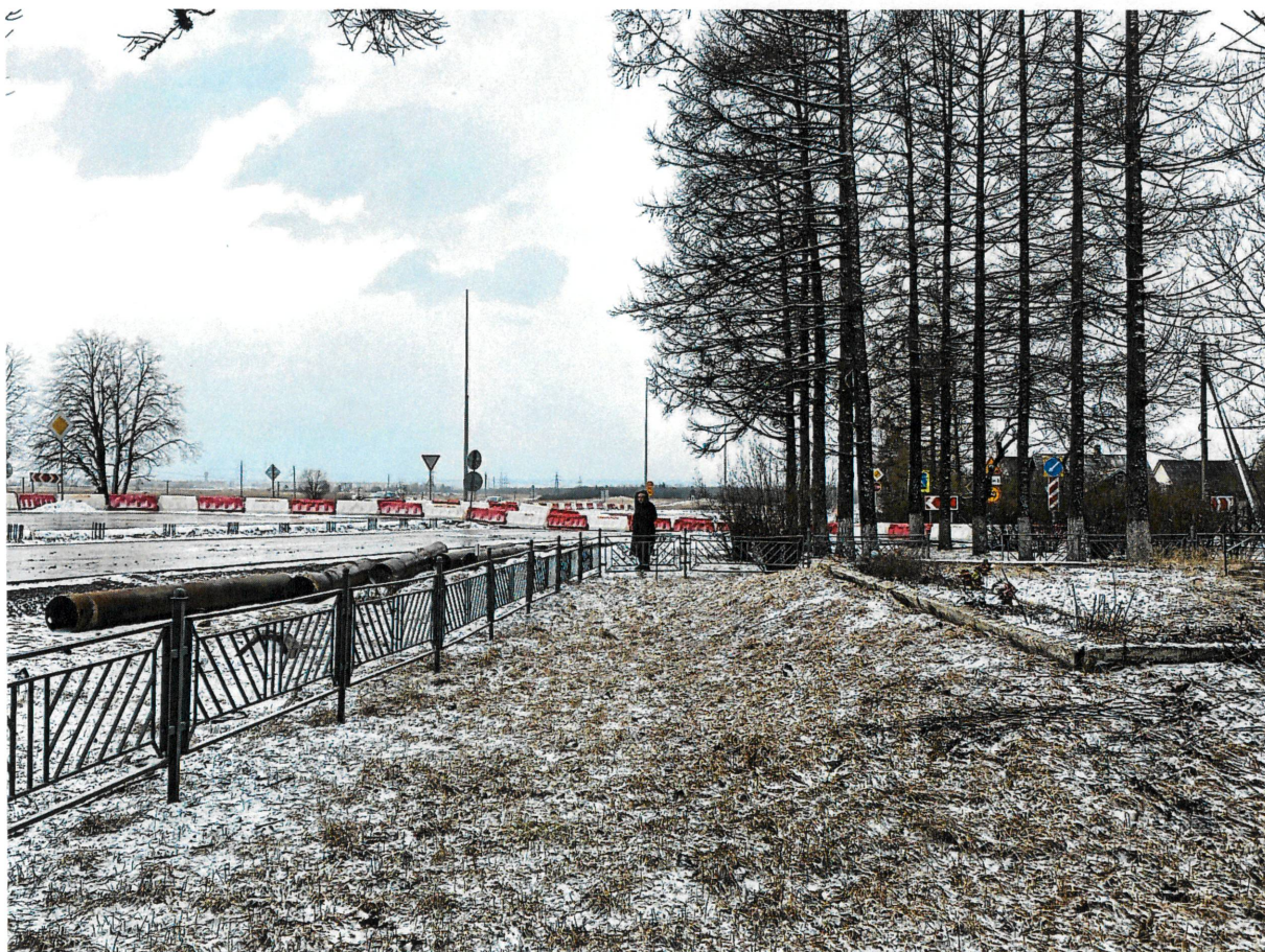
Рис. 12. Фрагмент юго-восточной части территории