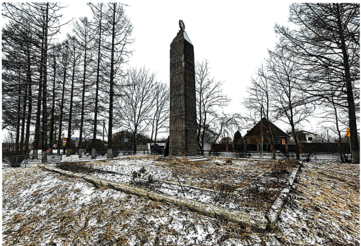
Рис. 2. Общий вид с востока