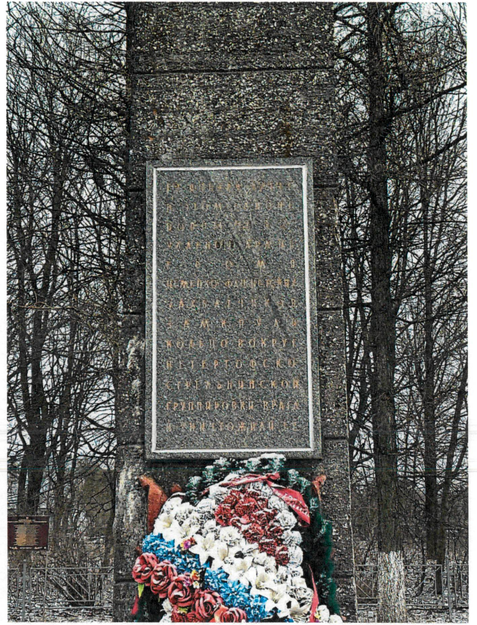
Рис. 6, 7. Фрагменты главного юго-западного фасада