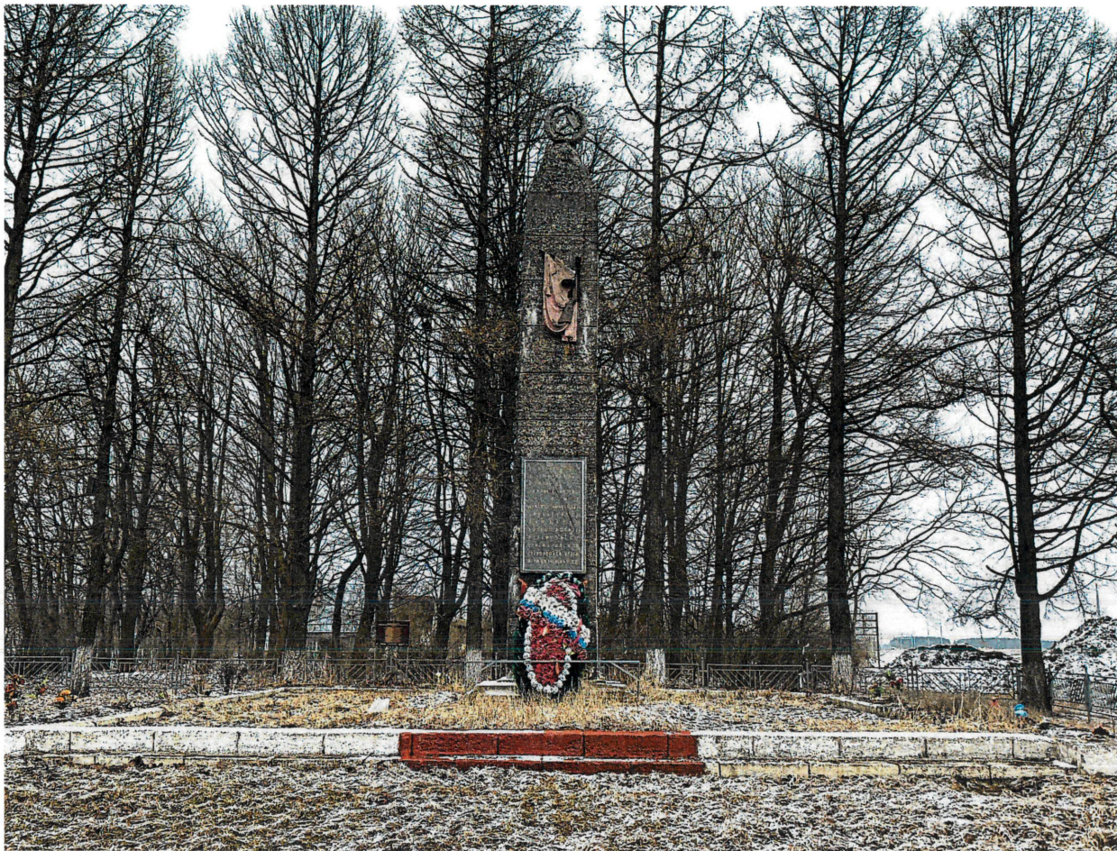
Рис. 3. Главный юго-западный фасад