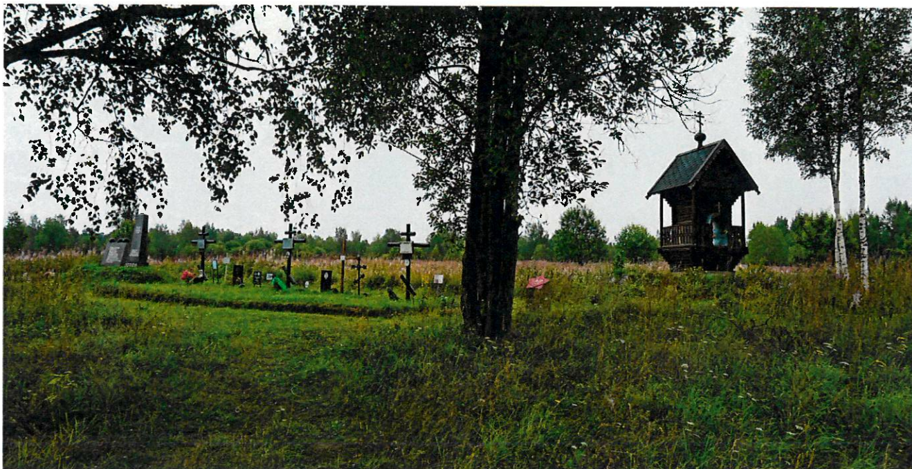
Фото 5. Вид на стелу и обелиск, братское захоронение, часовню с запада