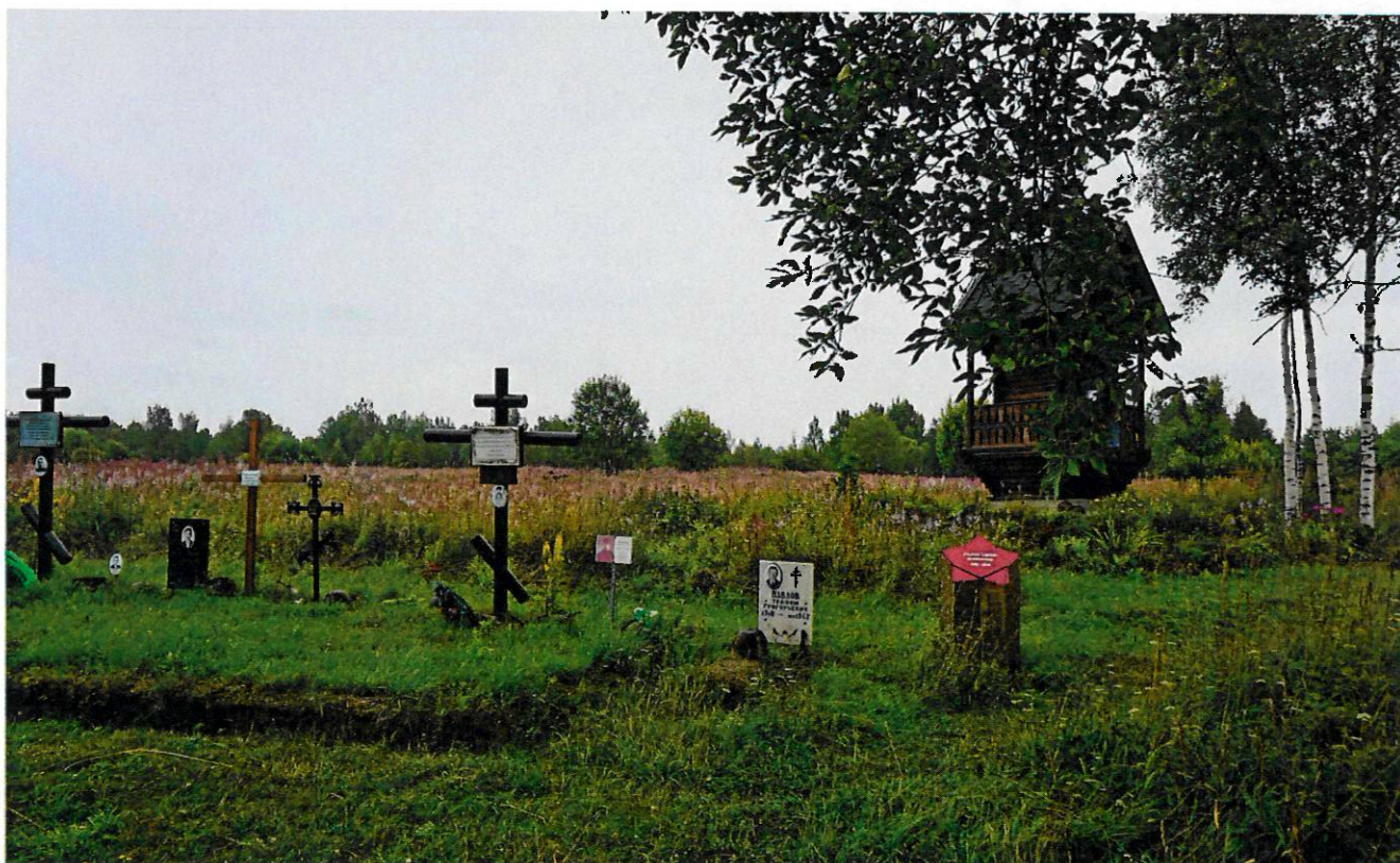
Фото 6. Вид на братское захоронение и памятник казахстанцам-акмолинцам 310-й стрелковой дивизии с запада