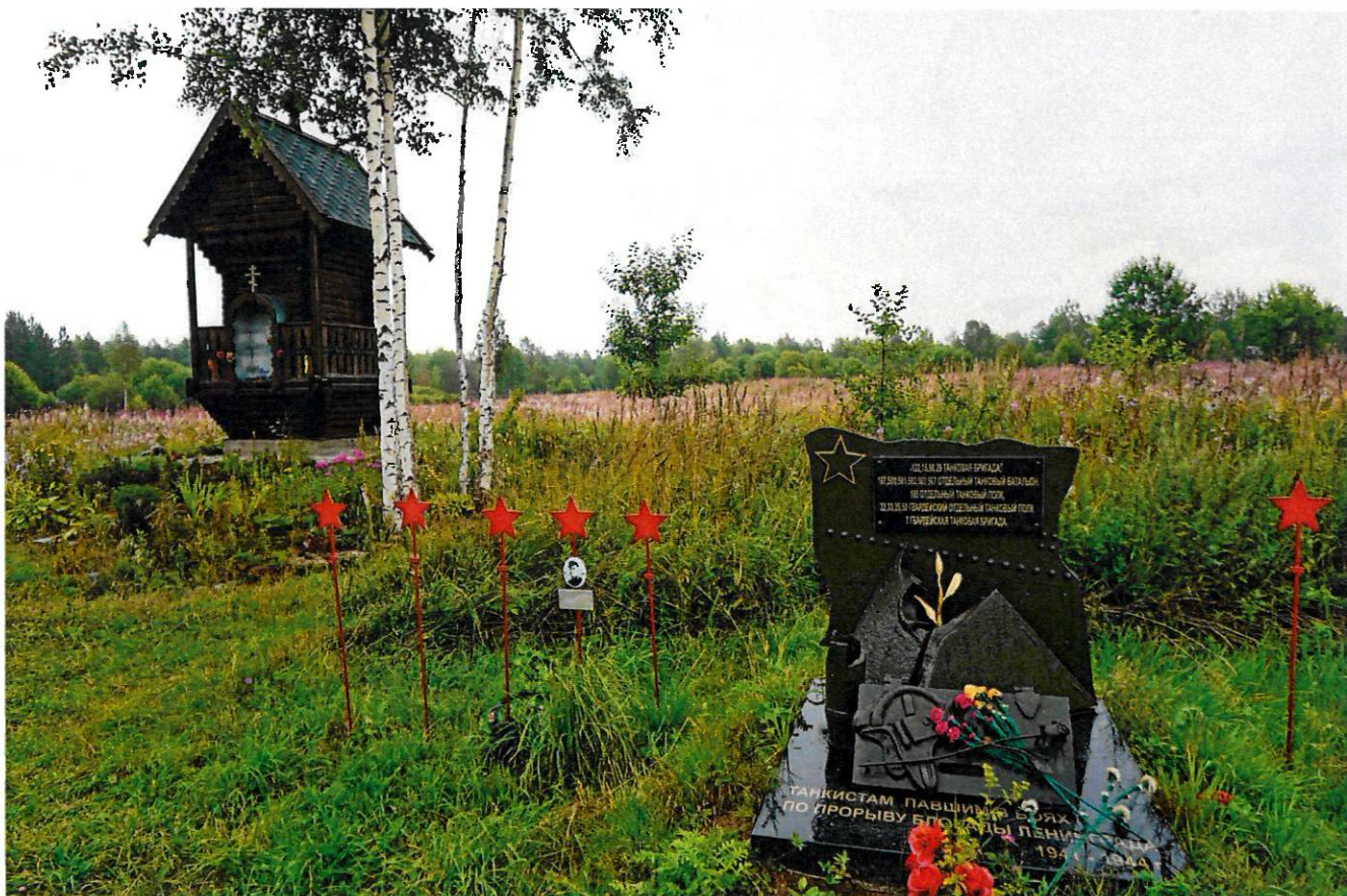
Фото 8. Вид на братское захоронение. Вид с юго-запада