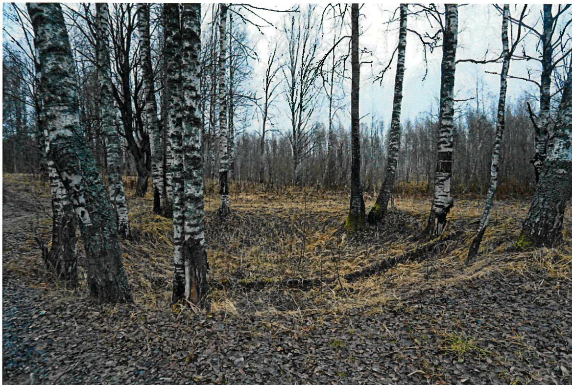
Фото 3. Воронка от взрыва снаряда. Вид с северо-запада