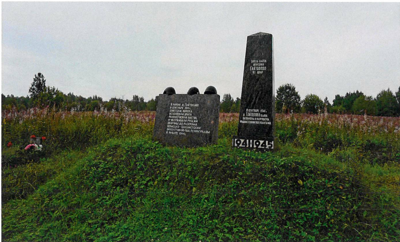
Фото 7. Стела и обелиск. Вид с северо-запада