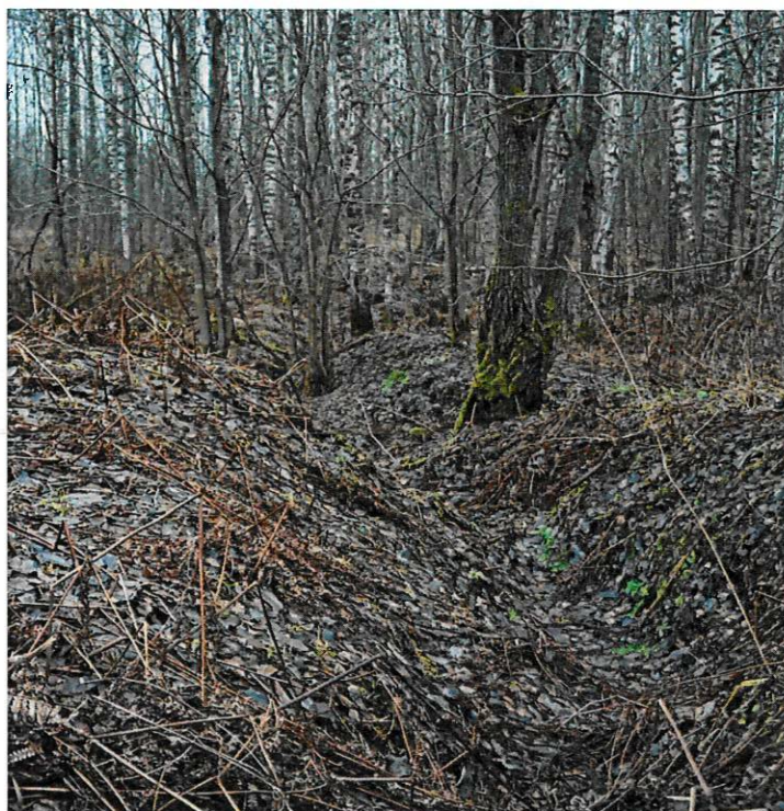
Фото 1. Траншеи в районе урочища Гайтолово. Вид с северо-востока

Фотографическое изображение объекта культурного наследия федерального значения «Оборонительные сооружения войск Волховского фронта в районе ожесточенных боев с немецко-фашистскими оккупантами в августе-сентябре 1942 г.» по адресу: Ленинградская область, Кировский район, Кировский район, в 4 км к северо - востоку ж/д станции Апраксин, на месте бывшей деревни Гайтолово