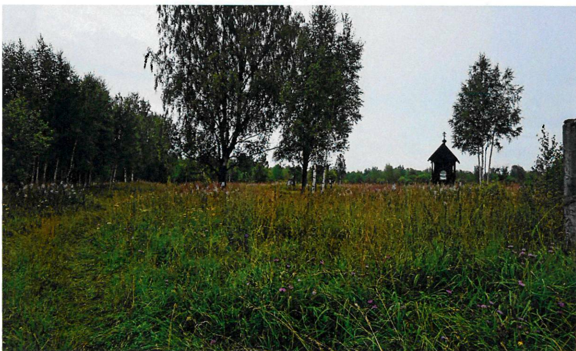
Фото 4. Общий вид на мемориальную зону с запада