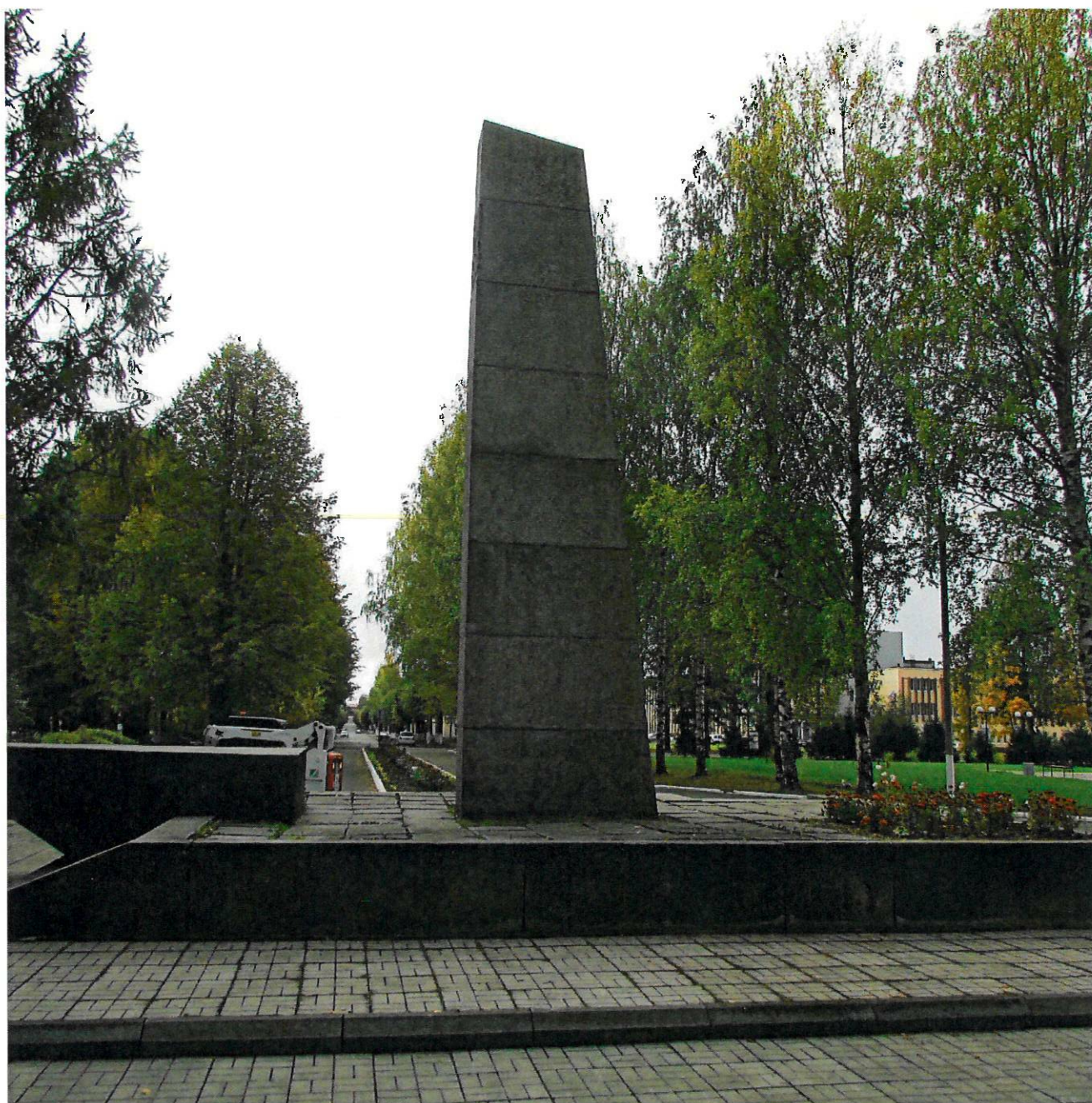
Фото 4. Общий вид с севера.