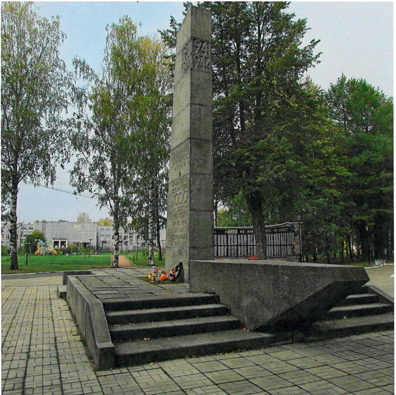
Фото 2. Общий вид с юго-востока.