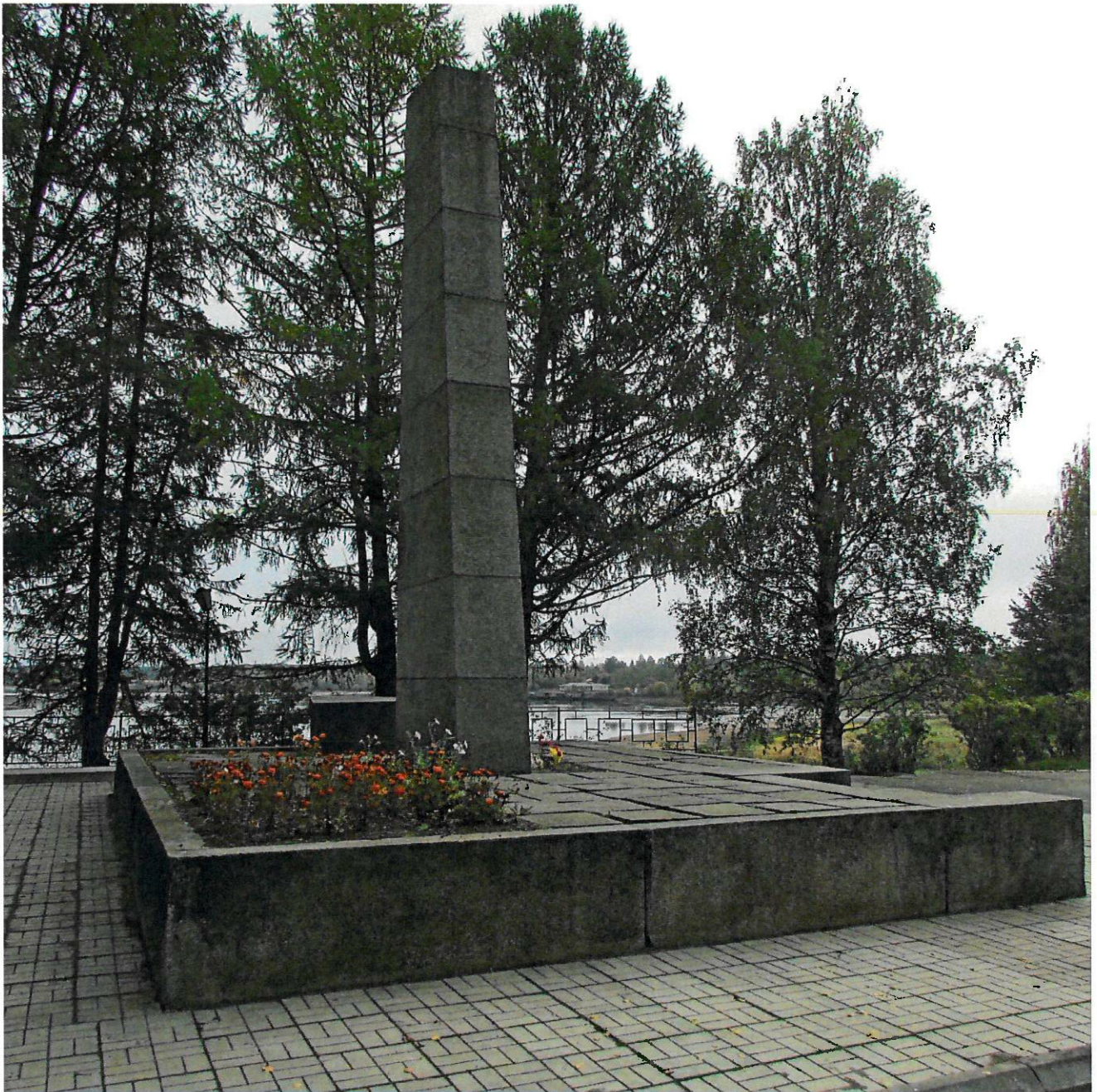
Фото 5. Общий вид с северо-запада.