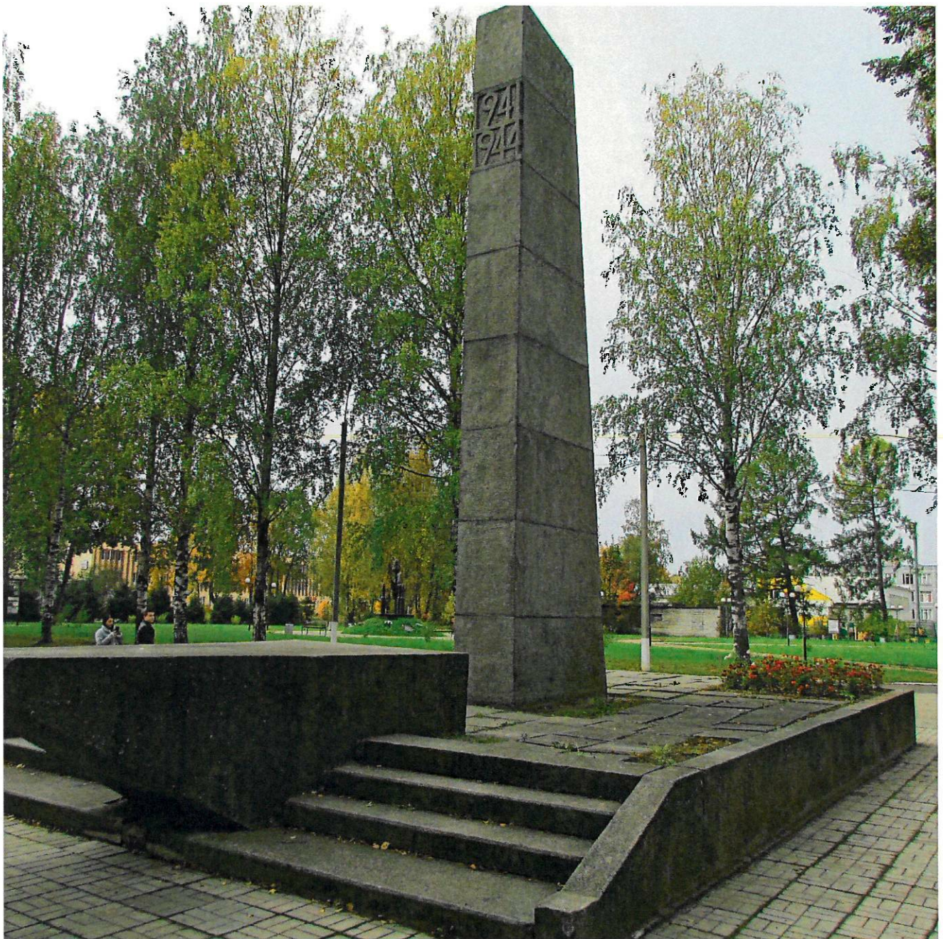
Фото 3. Общий вид с северо-востока.