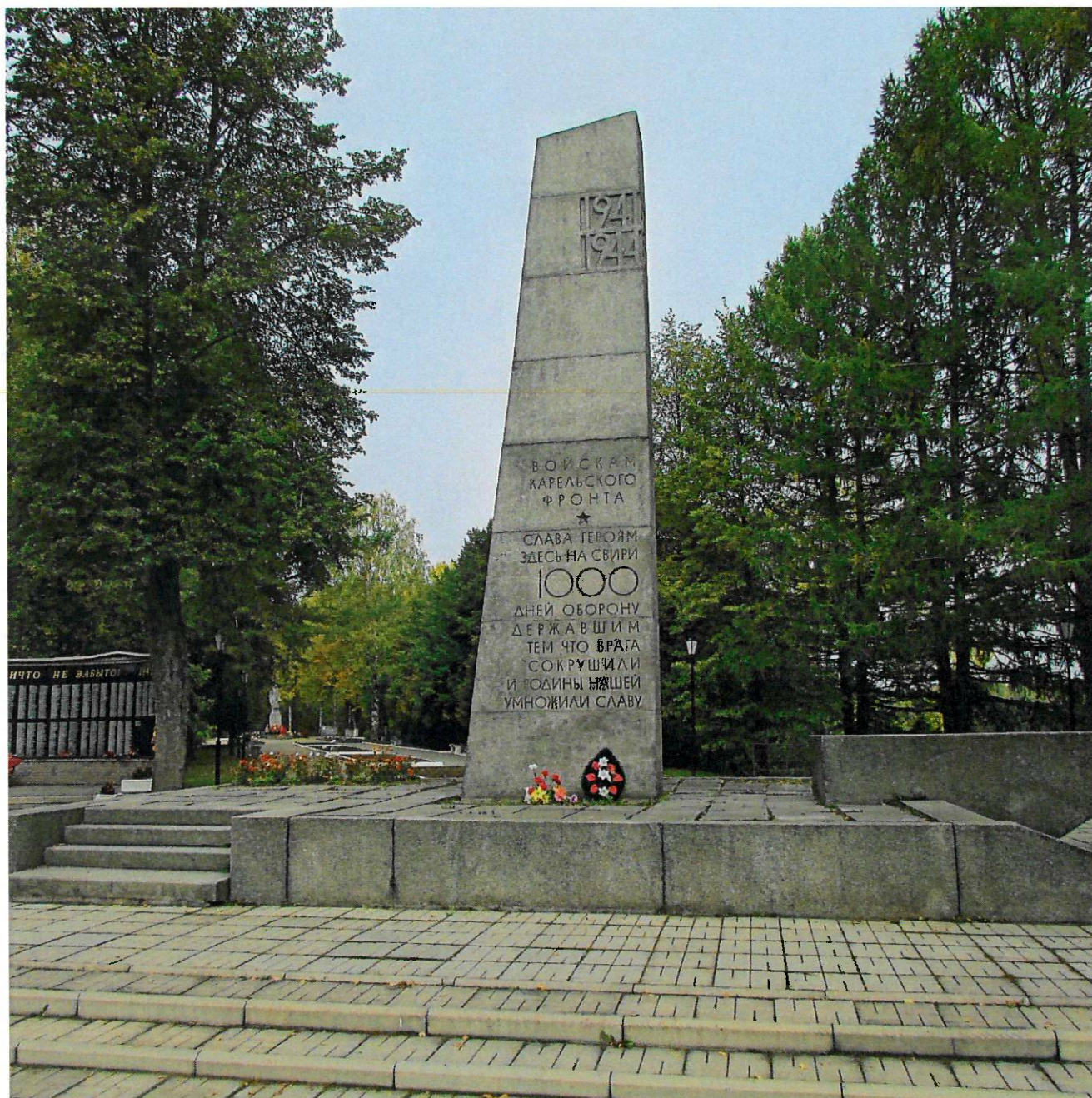
Фото 1. Общий вид с юга.