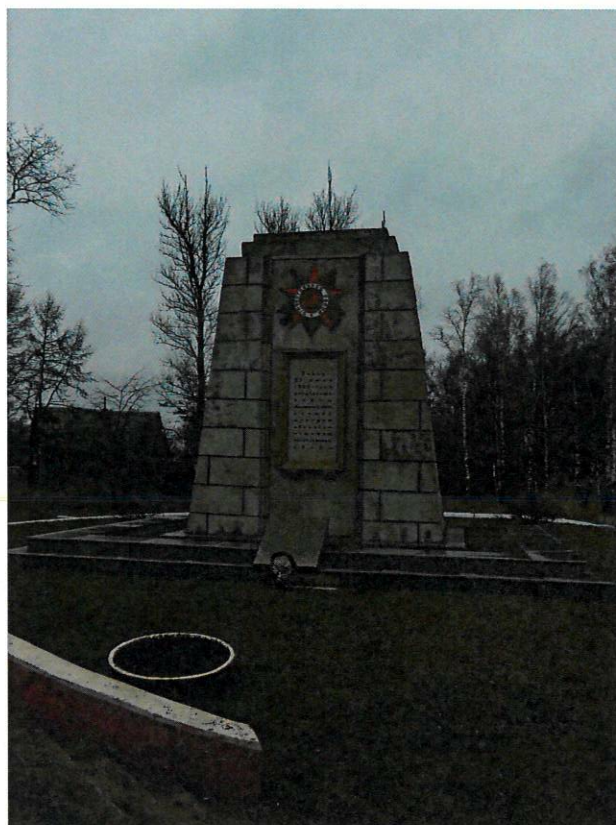
Фото 1. Общий вид Объекта