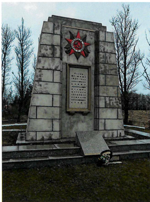
Фото 2. Крупный план объекта