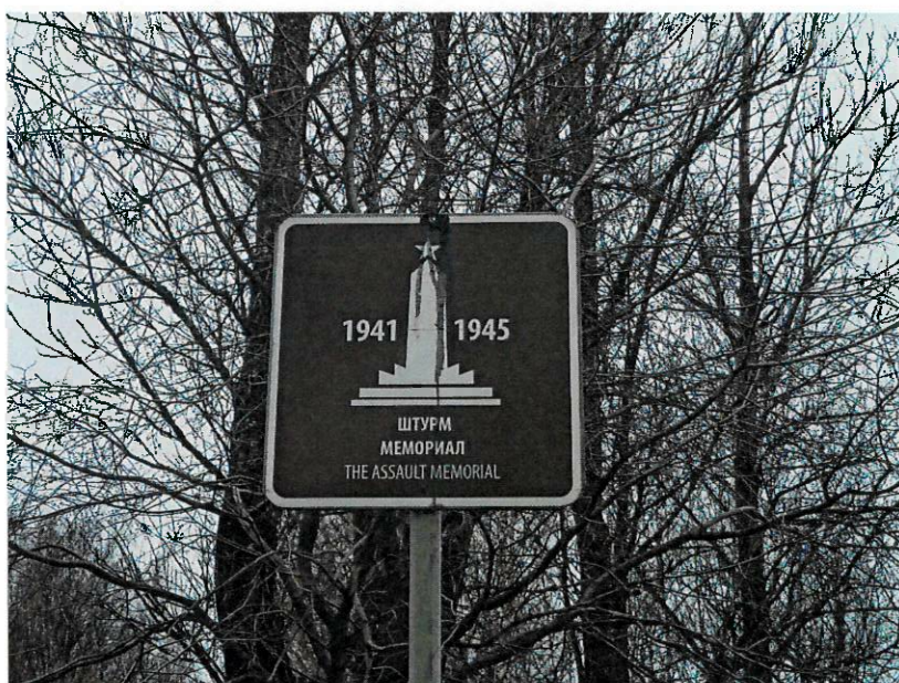
Фото 4. Информационная надпись