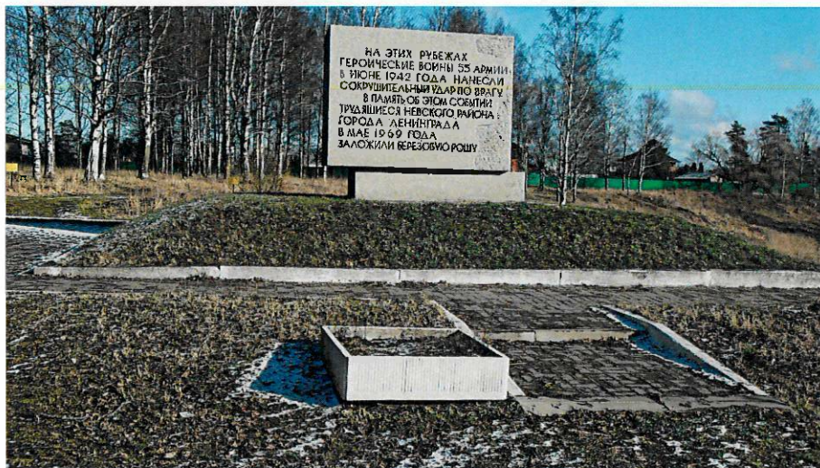
Фото 9-10. Вид на памятную надпись