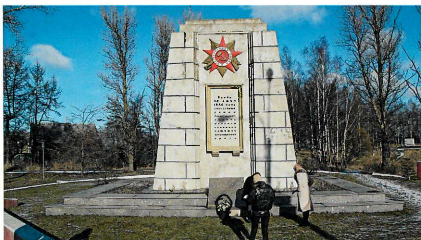
Фото 8. Общий вид памятника с территорией