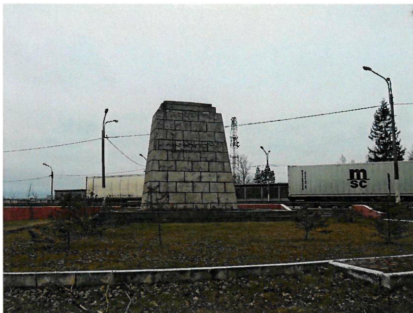
Фото 3. Общий план объекта с тыльного фасада