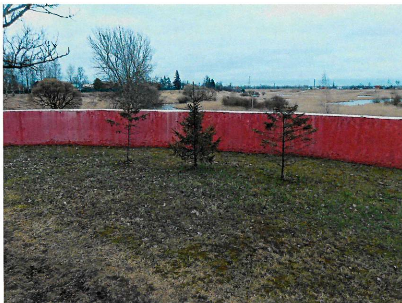
Фото 5-6. Ограждение вокруг памятника