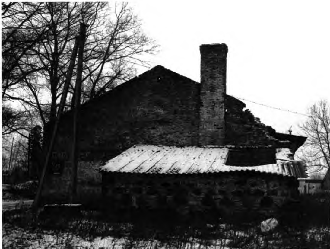
Усадебно-парковый комплекс Н.И.Корфа. Амбар (лит. Г). Северный фасад.