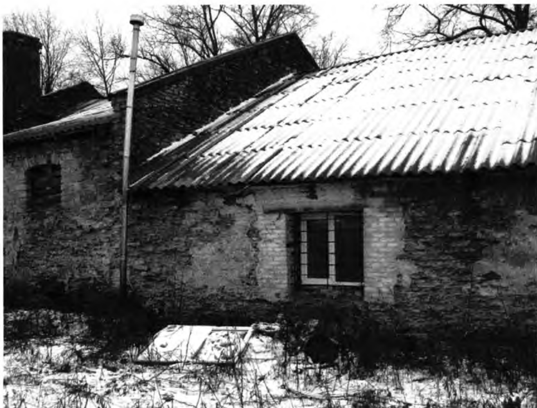
Усадебно-парковый комплекс Н.И.Корфа. Амбар (лит. Г). Западный фасад, фрагмент.