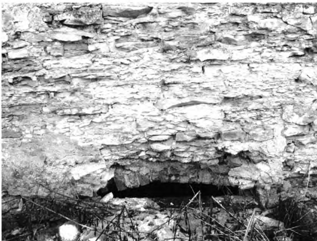
Усадебно-парковый комплекс Н.И.Корфа. Амбар (лит. Г). Западный фасад, центральная часть. Проём в подвальное помещение.