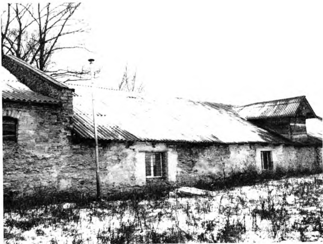
Усадебно-парковый комплекс Н.И.Корфа. Амбар (лит. Г). Западный фасад, центральная часть.