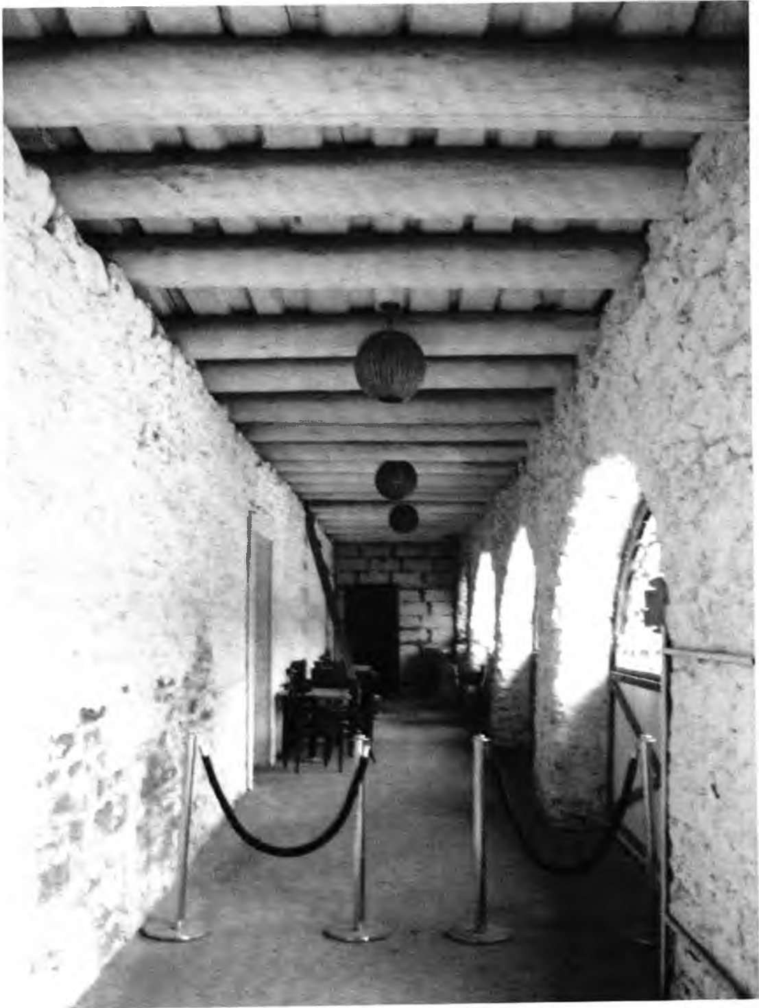
Усадебно-парковый комплекс Н.И.Корфа. Амбар (лит. Г). галерея.