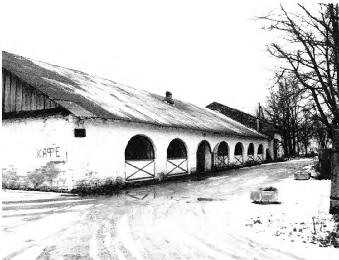
Усадебно-парковый комплекс Н.И.Корфа. Амбар (лит. Г). Восточный фасад, вид с юга.