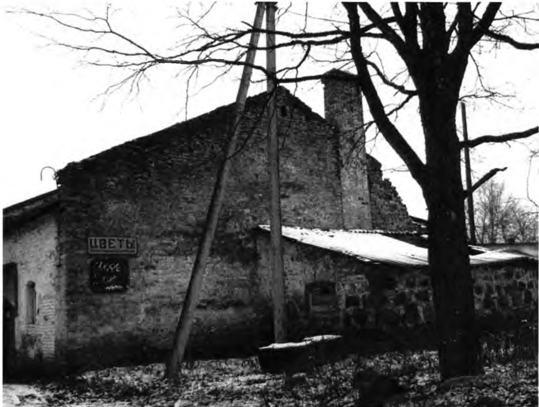
Усадебно-парковый комплекс Н.И.Корфа. Амбар (лит. Г). Северный фасад. Пристройка из валунной кладки, примыкающая к брандмауэру из известняка.