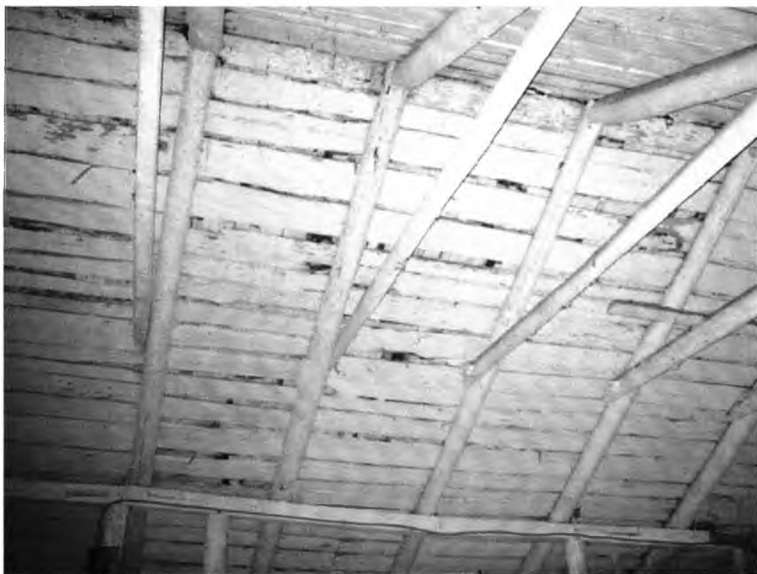
Амбар (лит. Г). Стропильная система.