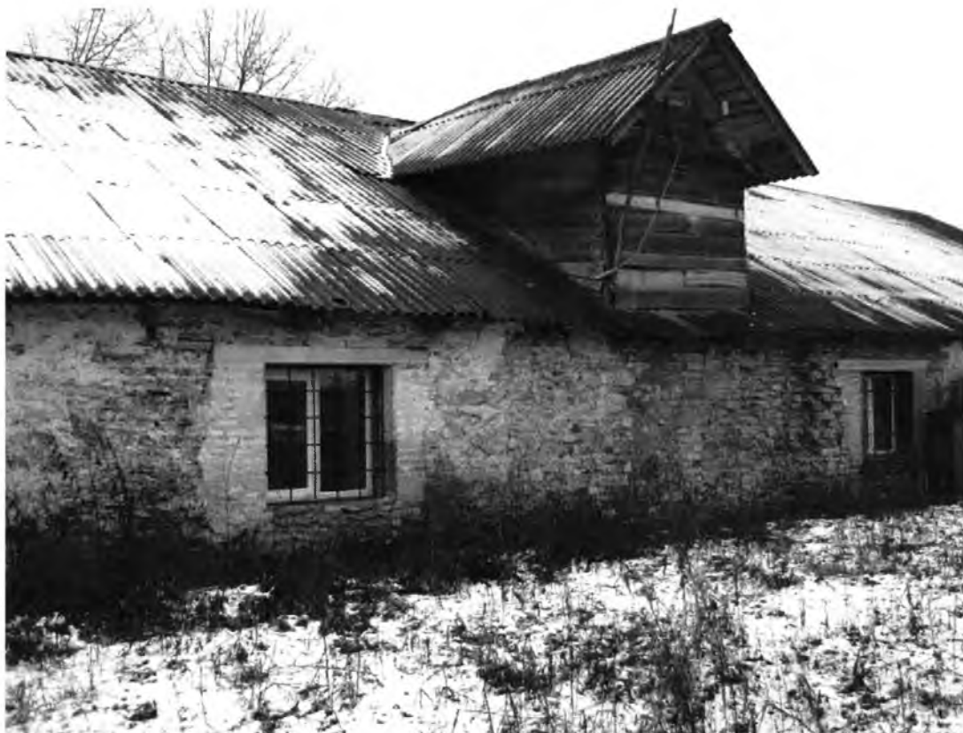
Усадебно-парковый комплекс Н.И.Корфа. Амбар (лит. Г). Западный фасад, центральная часть.