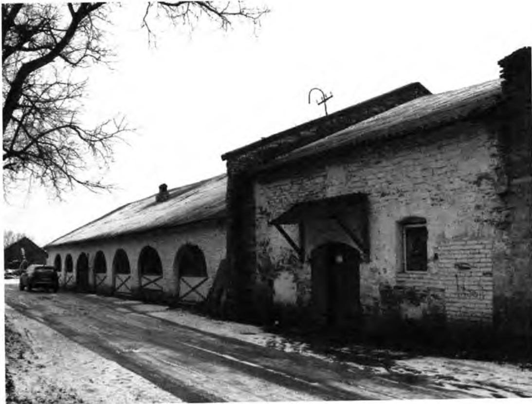
Усадебно-парковый комплекс Н.И.Корфа. Амбар (лит. Г). Восточный фасад, вид с севера.