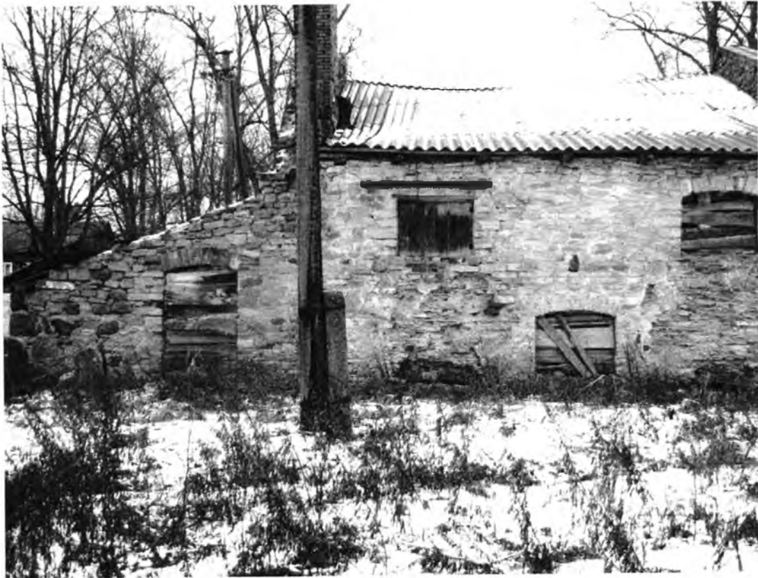
Усадебно-парковый комплекс Н.И.Корфа. Амбар (лит. Г). Западный фасад, северная часть.