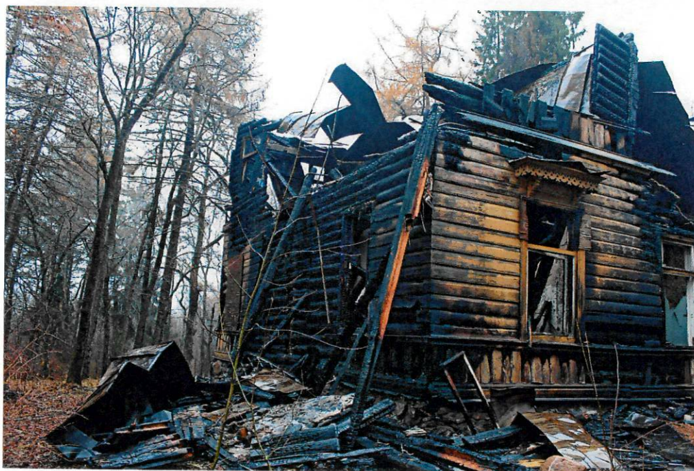
Фото 5-6. Южный фасад.