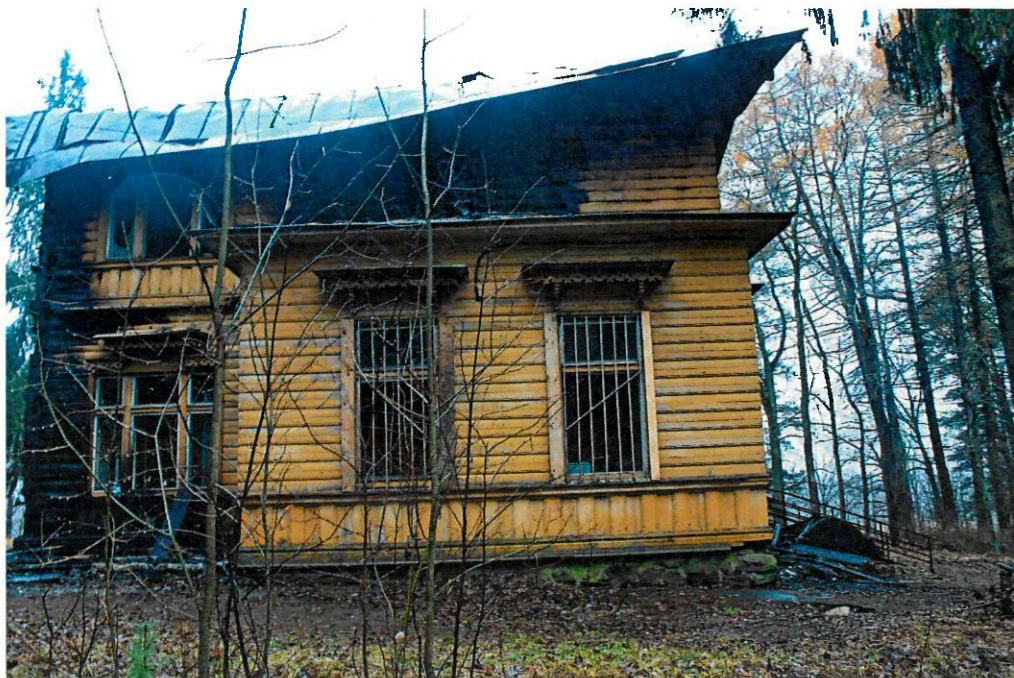
Фото 3. Сохранившийся карнизный пояс с орнаментальной сквозной резьбой. Северный фасад.