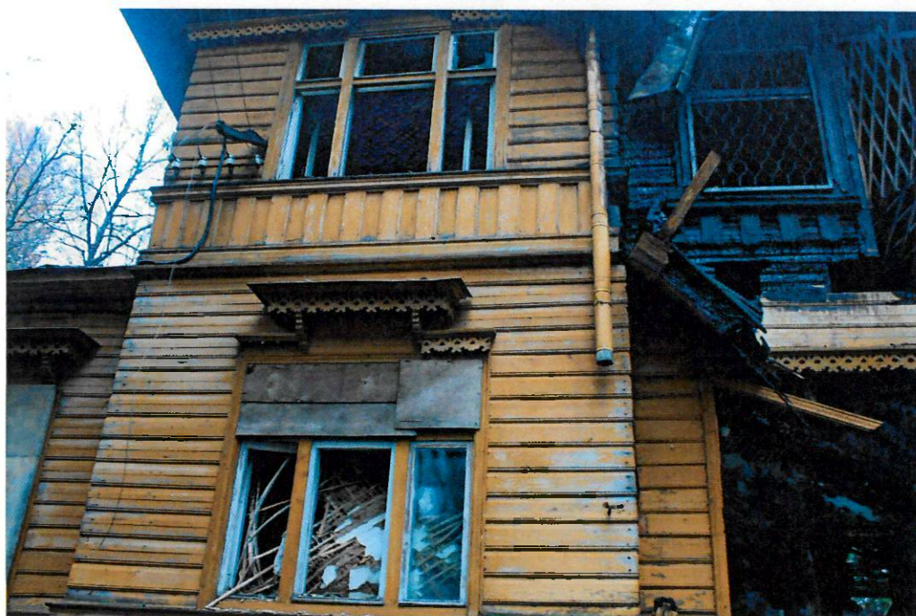
Фото 2. Сохранившийся карнизный пояс с орнаментальной сквозной резьбой. Западный фасад.