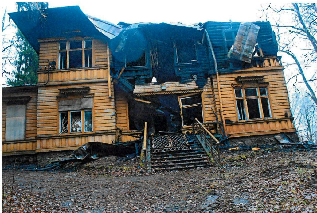
Фото. 1 Западный фасад.