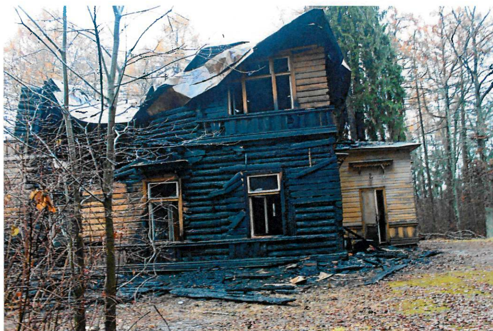
Фото 4. Восточный фасад.