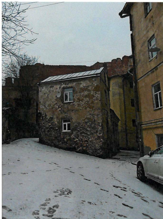
Фото 2. Вид на внутренний фасад