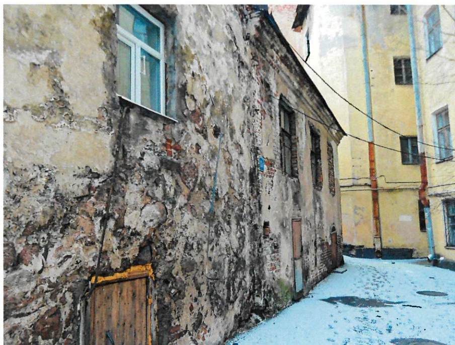
Фото 4. Фасад со стороны двора (парадный вход)