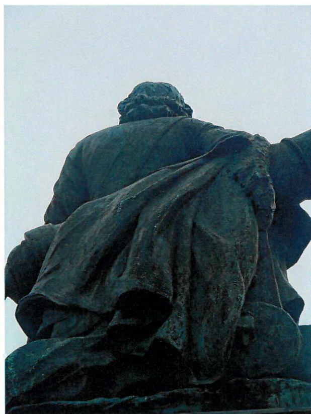
Фото 4. Крупный план фигуры сзади (с тыла).