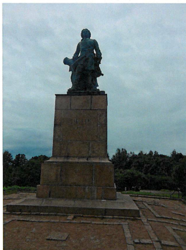
Фото 2. Общий план без лестницы