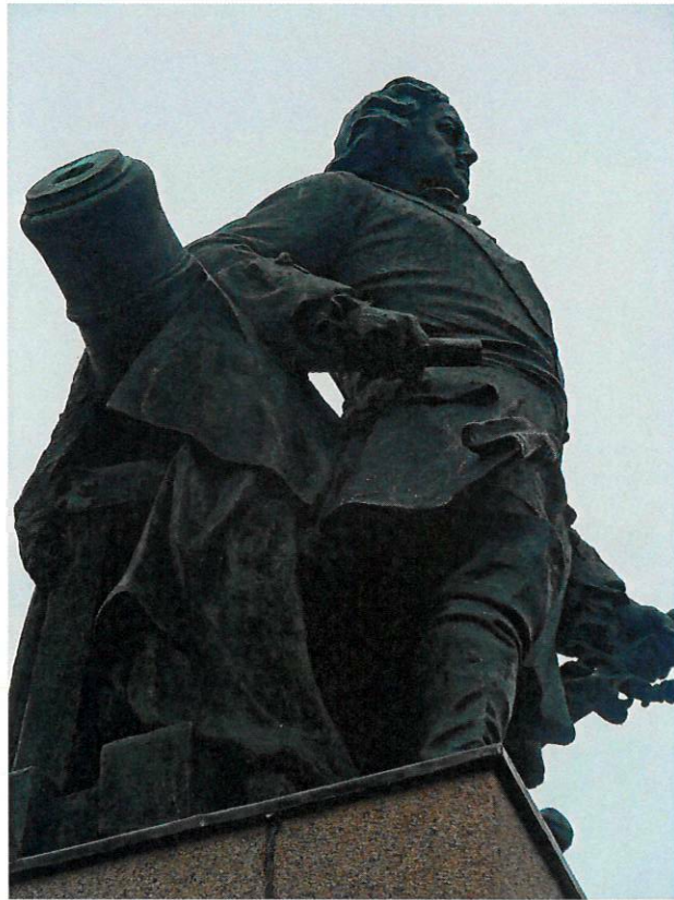
Фото 5. Крупный план фигуры сбоку (в профиль).