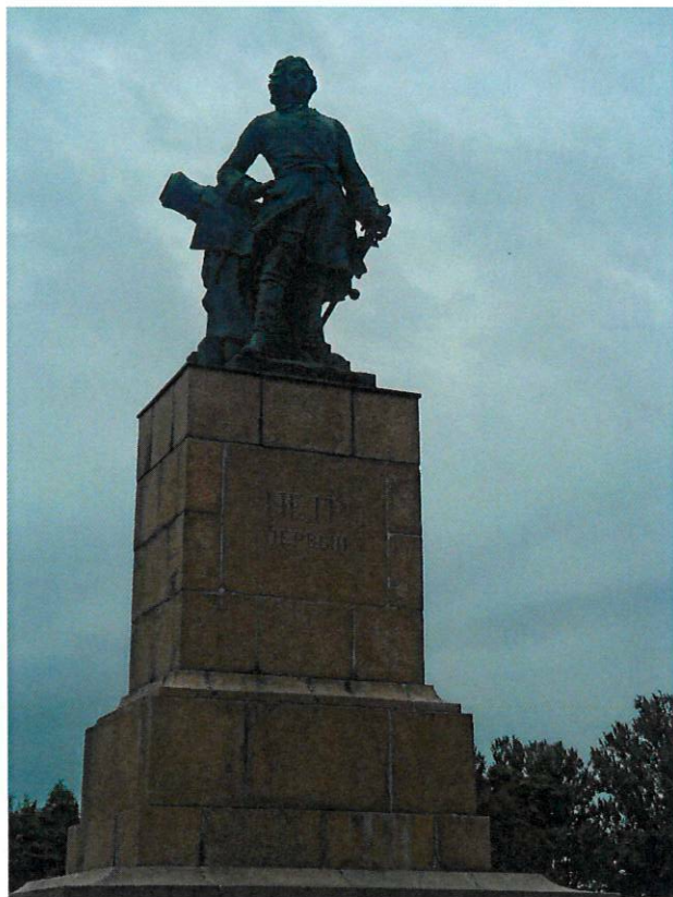
Фото 3. Общий план на передний план.