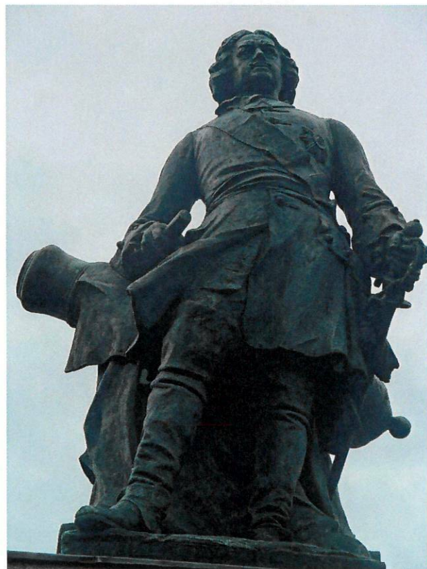
Фото 6. Крупный план фигуры с лица (в анфас)