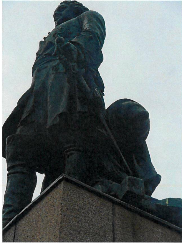
Фото 7. Крупный план фигуры с боку (в профиль)