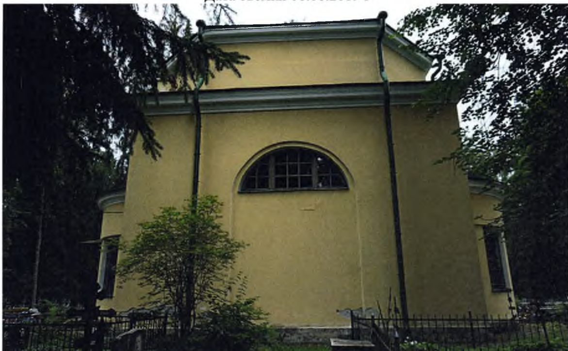
Фото 5. Западный фасад. Вход. Вид с запада Дата съемки 06.08.2019 г