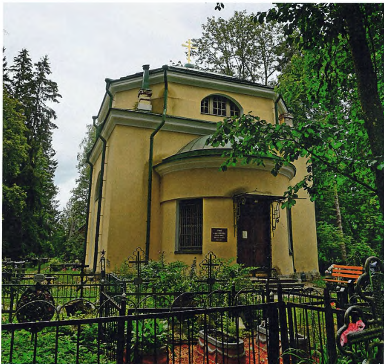
Фото 1. Общий вид церкви с северо-запада Дата съёмки 06.08.2019 г.