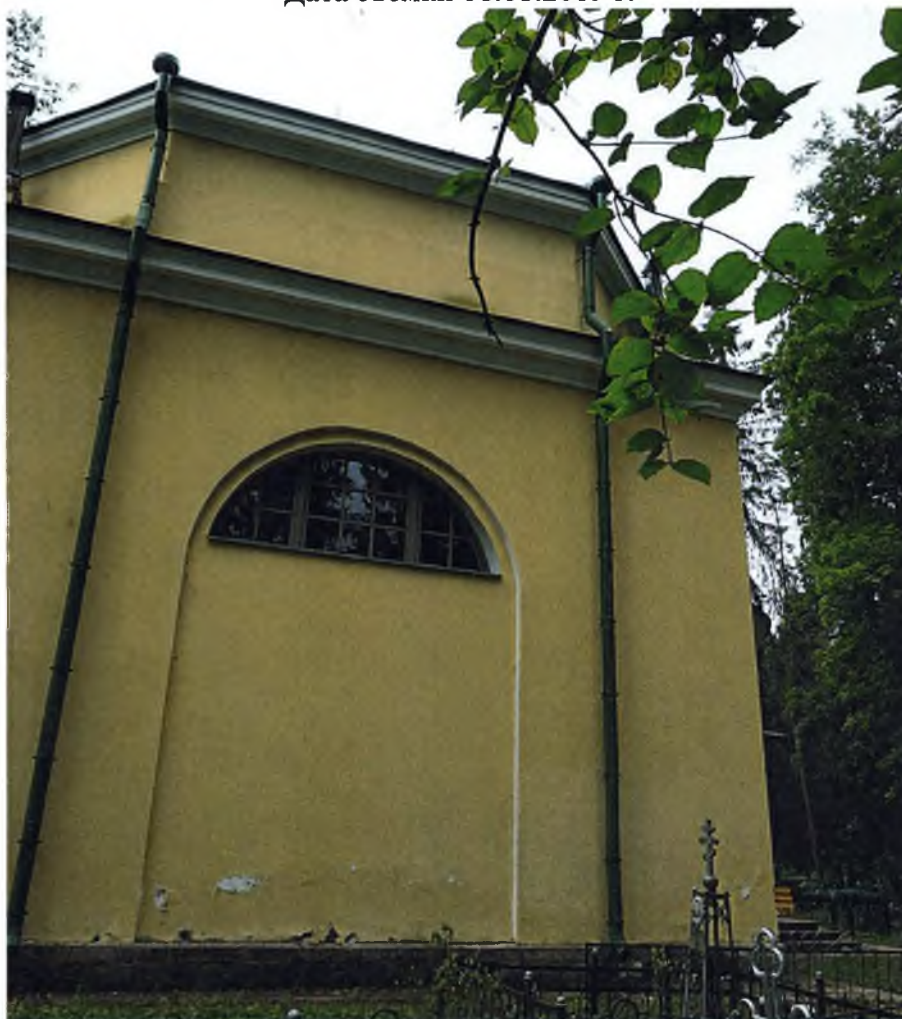
Фото 3. Вид на восточный фасад с северо-востока.