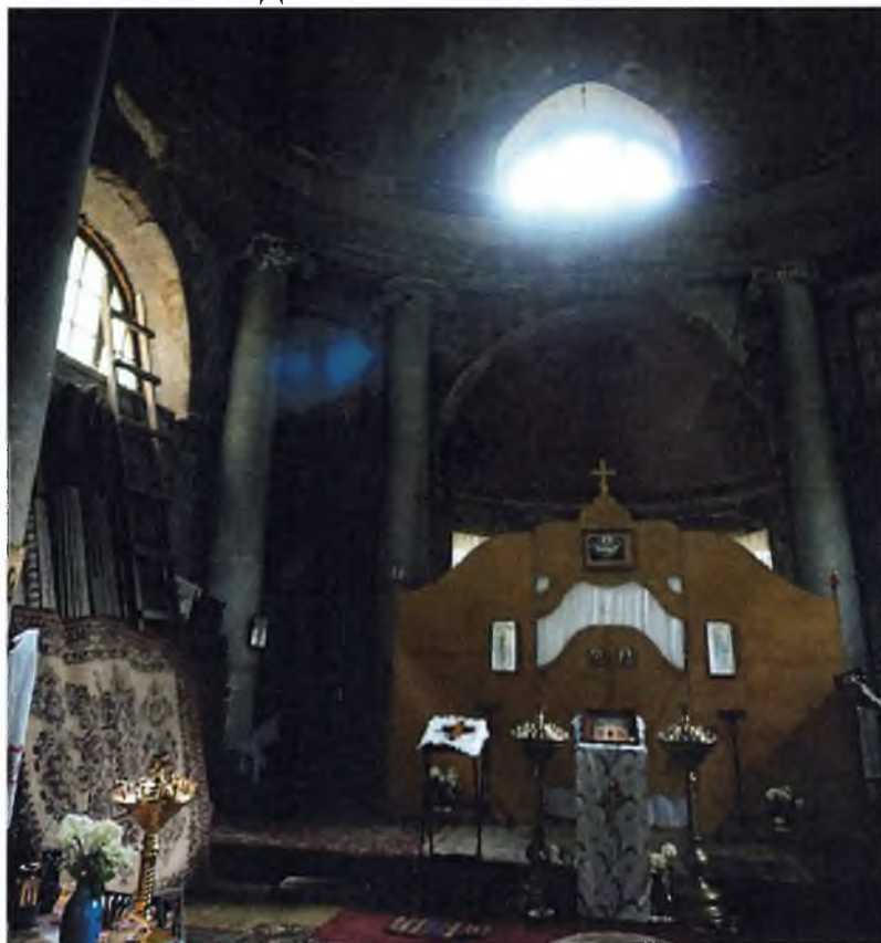
Фото 7. Помещение церкви. Вид на алтарную часть и южную стену Дата съемки 06.08.2019 г