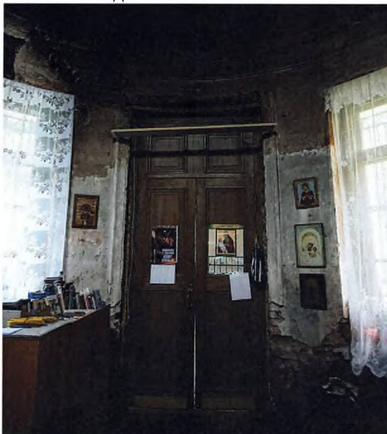
Фото 9. Сохранившиеся элементы резного иконостаса Дата съемки 06.08.2019 г