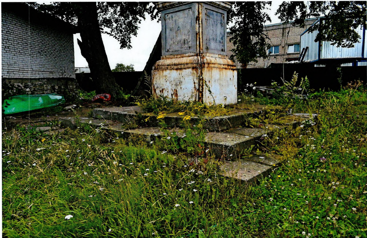
Фото 3. Обелиск, сооруженный в честь строительства Ладожского канала. Трехступенчатый стилобат. Вид с северо-востока.