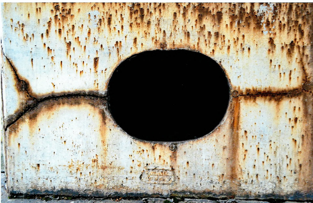
Фото 6. Обелиск, сооруженный в честь строительства Ладожского канала. Отверстие в цоколе на северном фасаде. Вид с юго-востока.