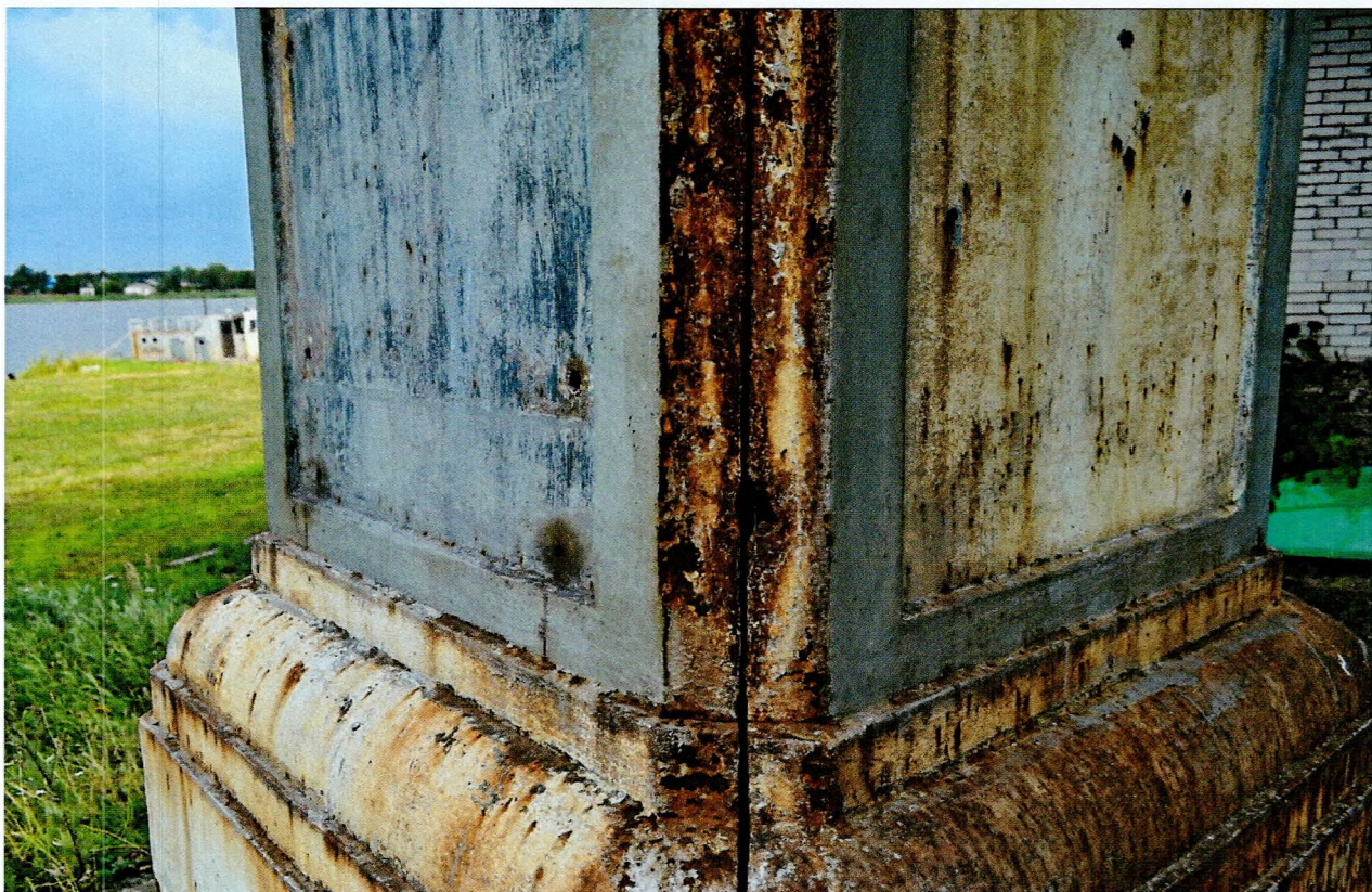
Фото 5. Обелиск, сооруженный в честь строительства Ладожского канала. Место соединения двух элементов пьедестала. Вид с запада.