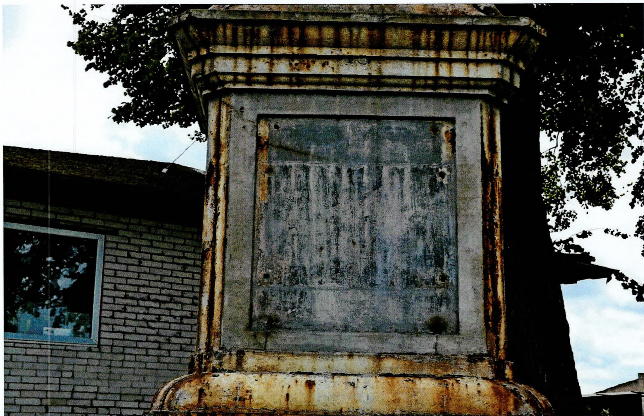
Фото 4. Обелиск, сооруженный в честь строительства Ладожского канала. Следы креплений памятной таблички. Вид с северо-запада.