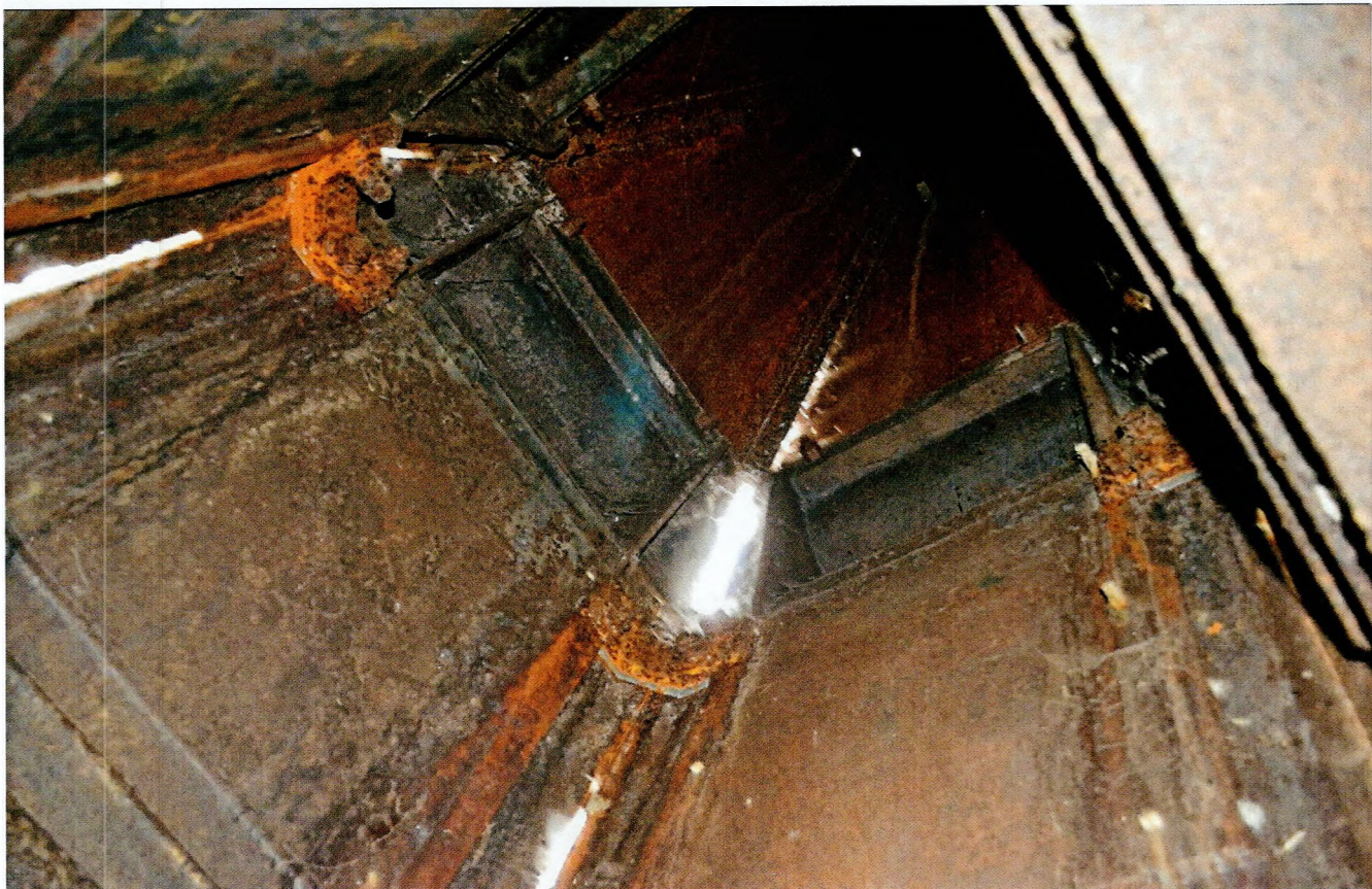
Фото 7. Обелиск, сооруженный в честь строительства Ладожского канала. Вид на крепления элементов памятника. Вид с юго-востока.