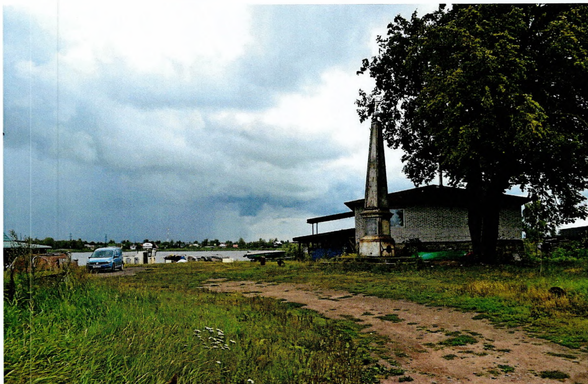
Фото 1. Левый берег реки Волхов у Ладожского канала. Обелиск, сооруженный в честь строительства Ладожского канала. Вид с северо-запада.