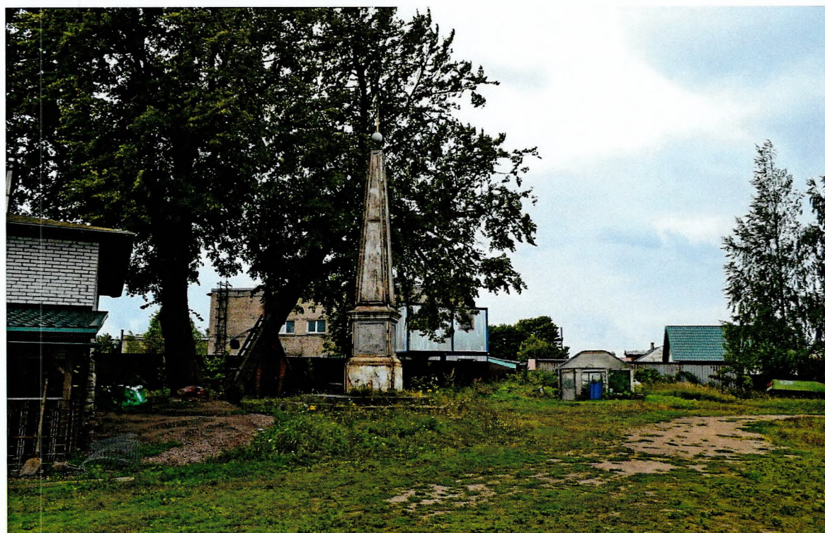
Фото 2. Левый берег реки Волхов у Ладожского канала. Обелиск, сооруженный в честь строительства Ладожского канала. Вид с востока.