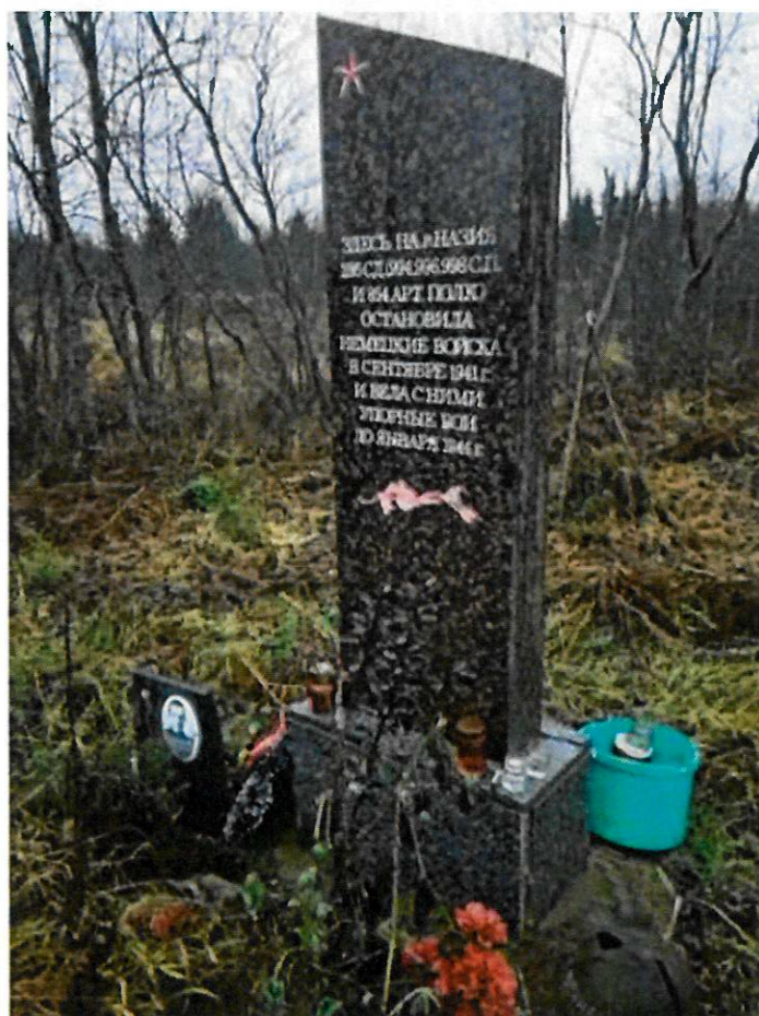
Фото 5. Гранитная стела на рубеже обороны 286-й стрелковой дивизии. Вид с запада