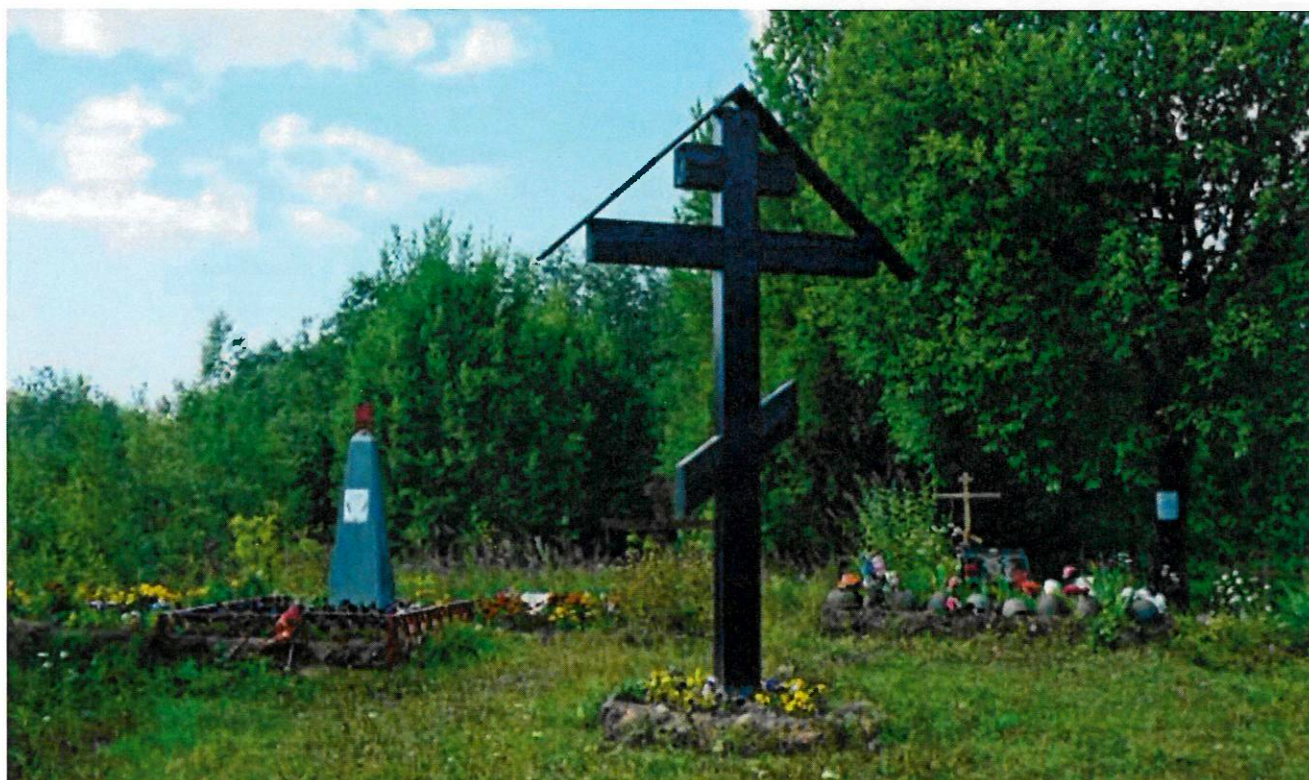
Фото 7. Вид на крест и братские могилы с юго-востока