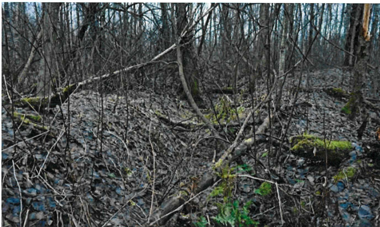
Фото 1. Траншеи в районе урочища Вороново. Вид с северо-запада

Фотографическое изображение объекта культурного наследия федерального значения «Оборонительные сооружения войск Волховского фронта в районе ожесточенных боев с немецко-фашистскими оккупантами 1943 г.» по адресу: Ленинградская область, Кировский район, в 3 км к юго-востоку от ж/д станции Апраксин, близ левого берега реки Назия, на месте бывшей деревни Вороново