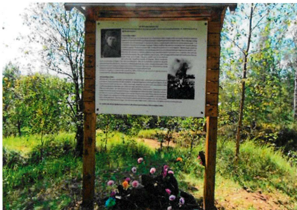
Фото 11. Деревянный информационный стенд на месте «Южного дома отдыха», немецкого опорного пункта. Вид с северо-запада