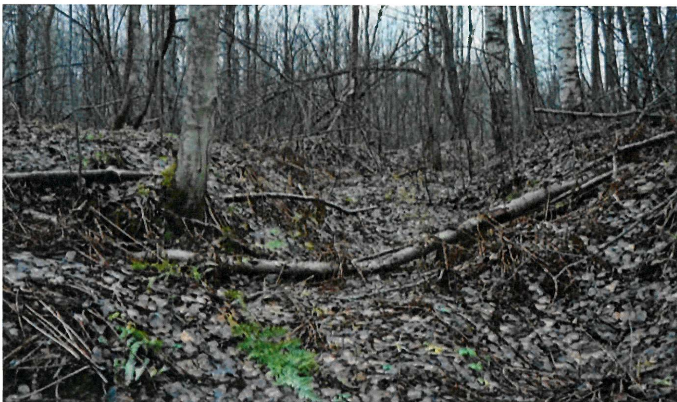
Фото 2. Траншеи в районе урочища Вороново. Вид с севера