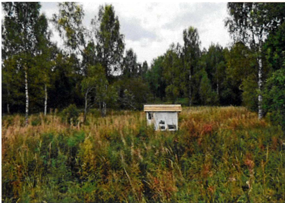
Фото 12. Высота «Лесная». Деревянный информационный стенд. Вид с юго-запада