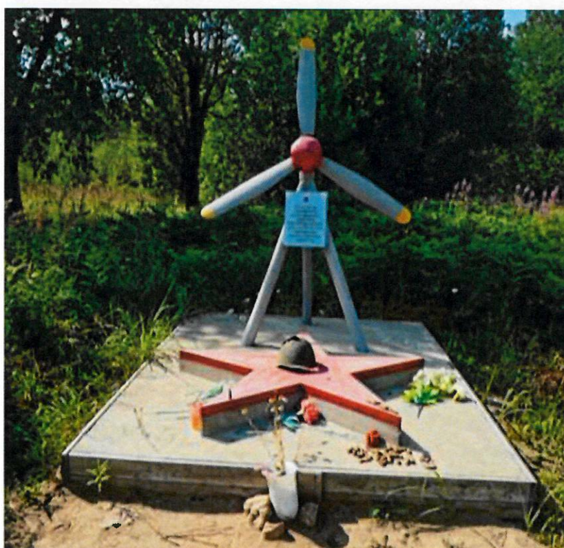
Фото 9. Памятник ИЛ-2. Вид с юго-востока