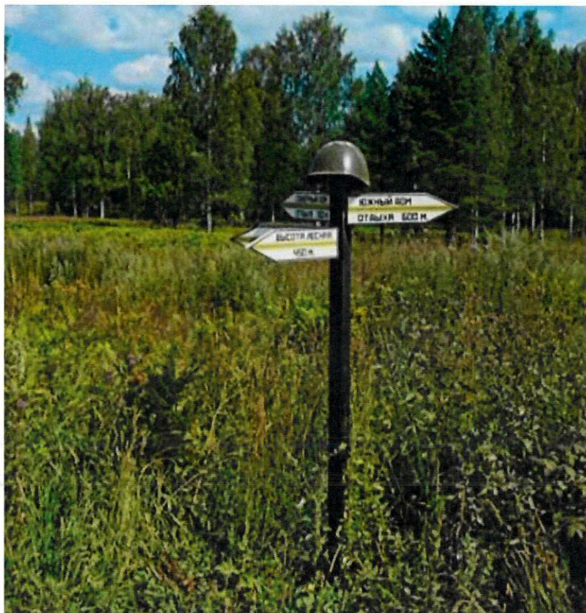
Фото 10. Указатель с направлением в стороны памятных мест. Вид с северо-запада