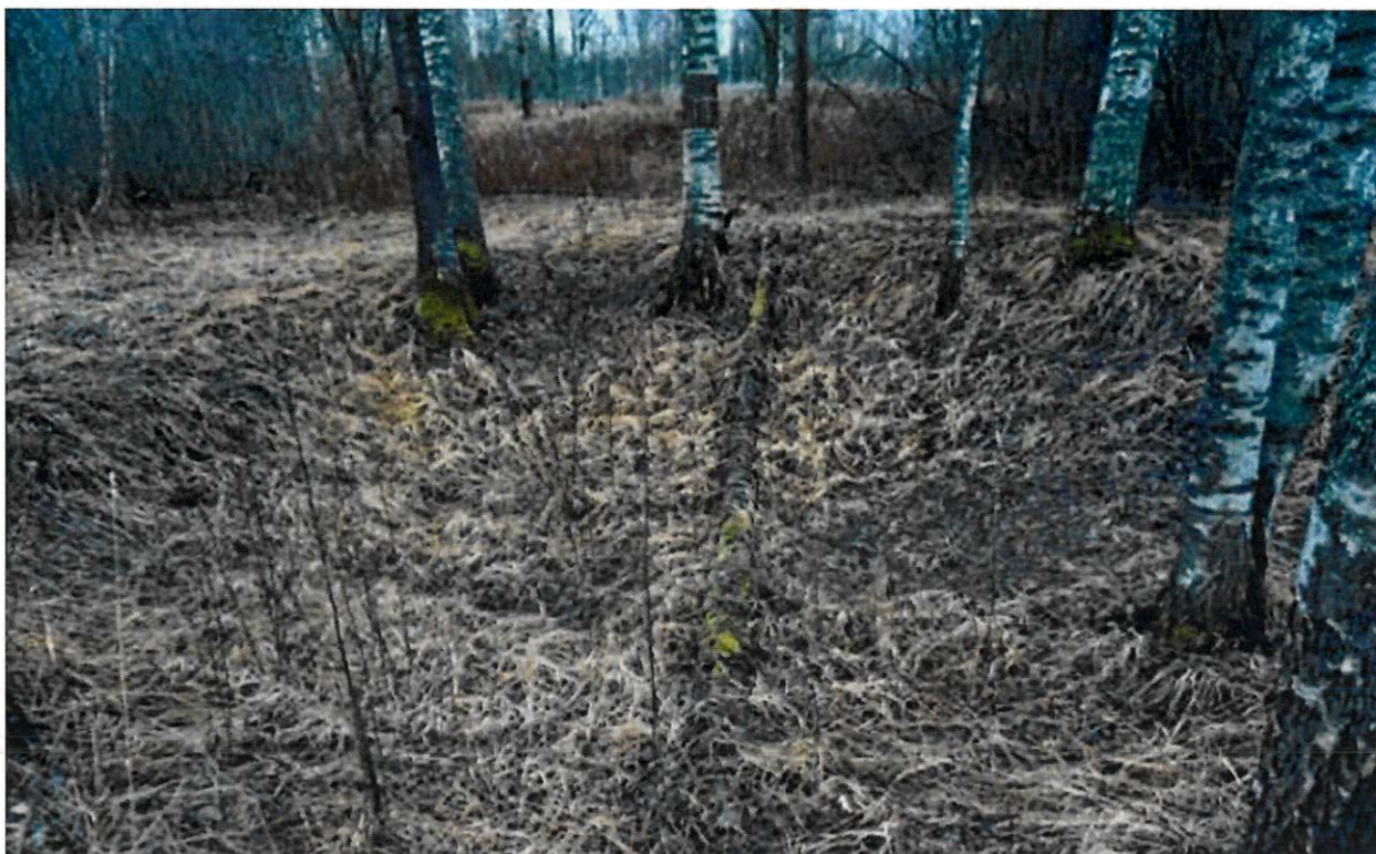
Фото 4. Воронка от взрыва снаряда. Вид с юго-востока