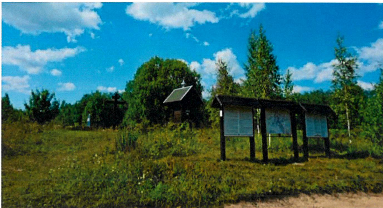
Фото 6.Общий вид на мемориальнуюзону «Каменная горка» с юго-востока