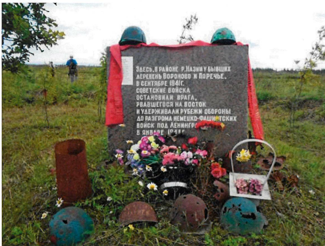
Фото 13. Гранитная стела на рубеже обороны советских войск. Вид с северо-запада