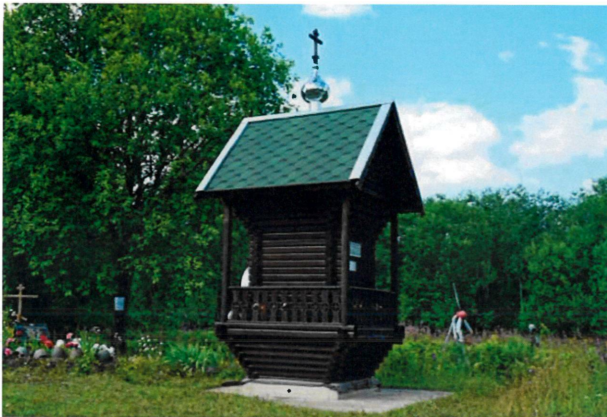
Фото 8. Вид на часовню с юга