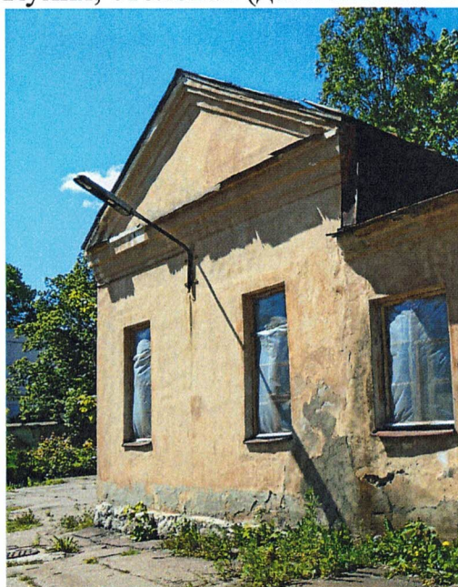
Фото 14. Кухня, столовая (дата съемки 17.06.2020)