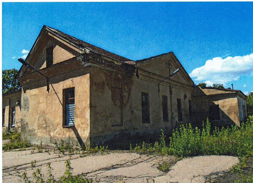
Фото 19. Казарма (дата съемки 17.06.2020)