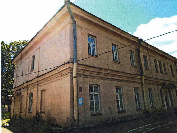
Фото 22. Казарма (дата съемки 17.06.2020)