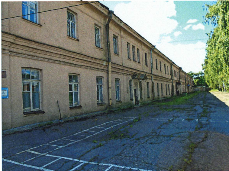
Фото 23. Казарма (дата съемки 17.06.2020)