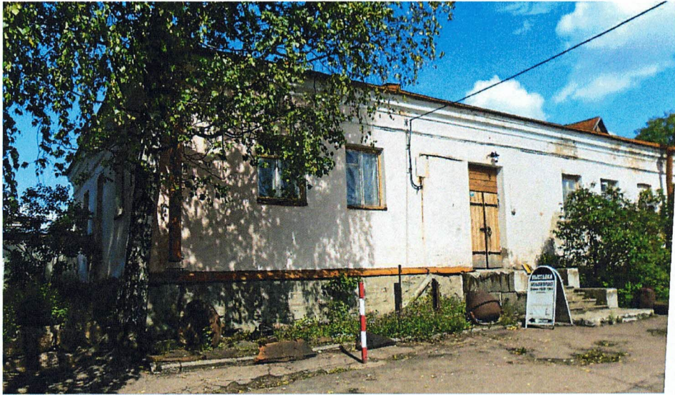
Фото 7. Погреб пороховой (дата съемки 17.06.2020)