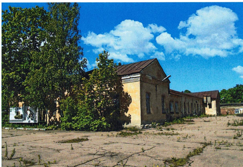
Фото 13. Кухня, столовая (дата съемки 17.06.2020)