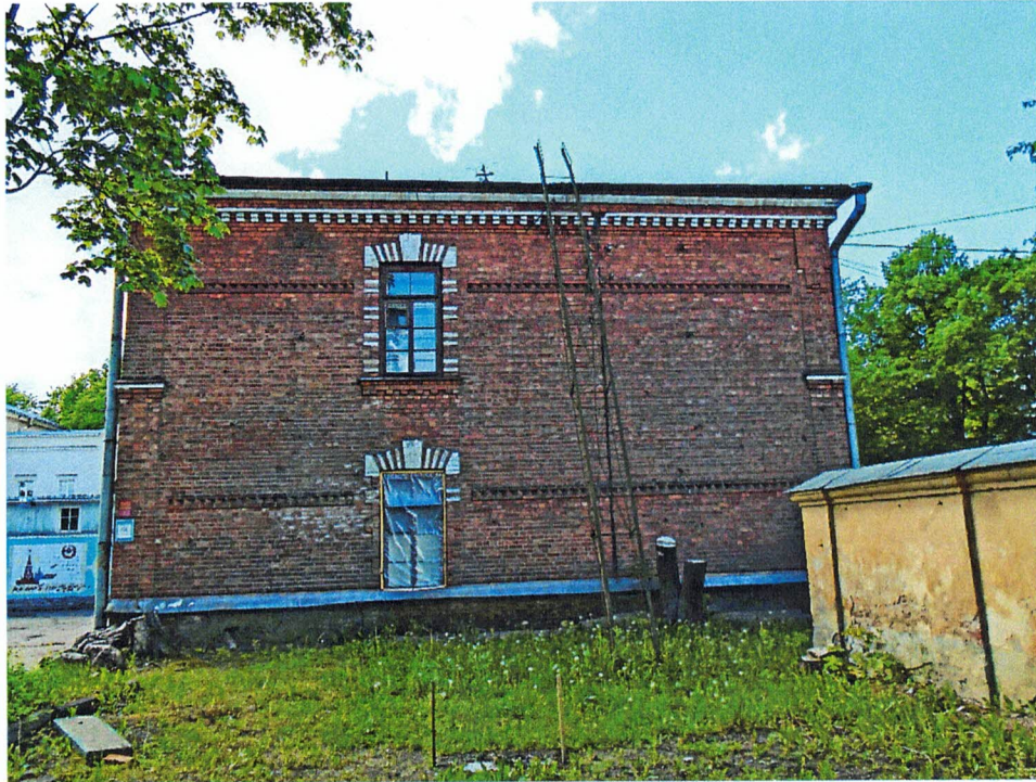
Фото 4. Мастерская (дата съемки 17.06.2020)