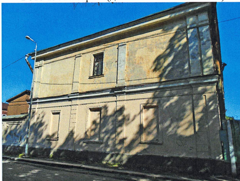
Фото 20. Казарма (дата съемки 17.06.2020)