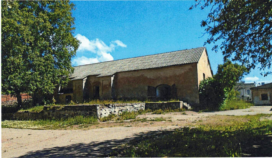
Фото 8. Погреб пороховой (дата съемки 17.06.2020)