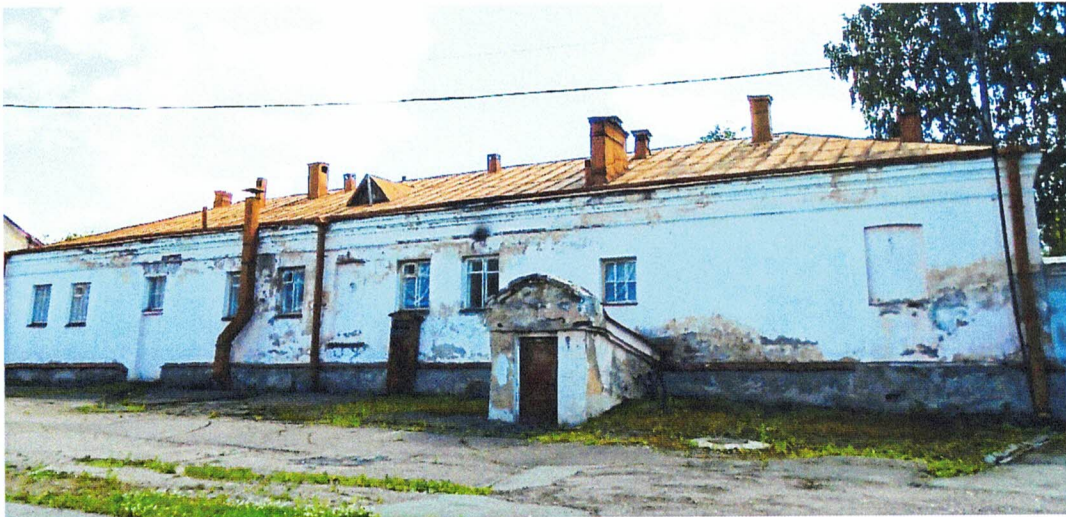
Фото 5. Мастерская (дата съемки 17.06.2020)