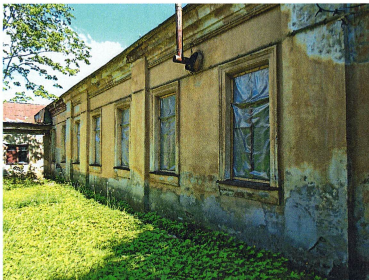
Фото 16. Кухня, столовая (дата съемки 17.06.2020)