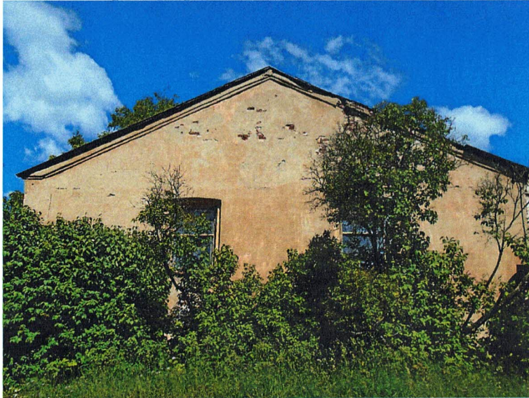
Фото 10. Погреб пороховой (дата съемки 17.06.2020)