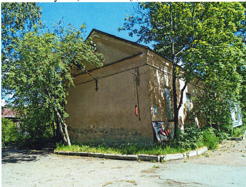
Фото 17. Кухня, столовая (дата съемки 17.06.2020)