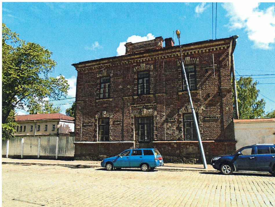
Фото 2. Здание штаба (дата съемки 17.06.2020)