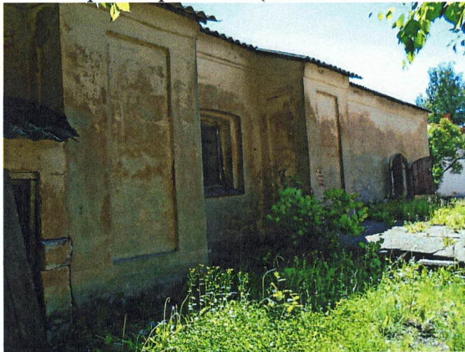
Фото 11. Погреб пороховой (дата съемки 17.06.2020)