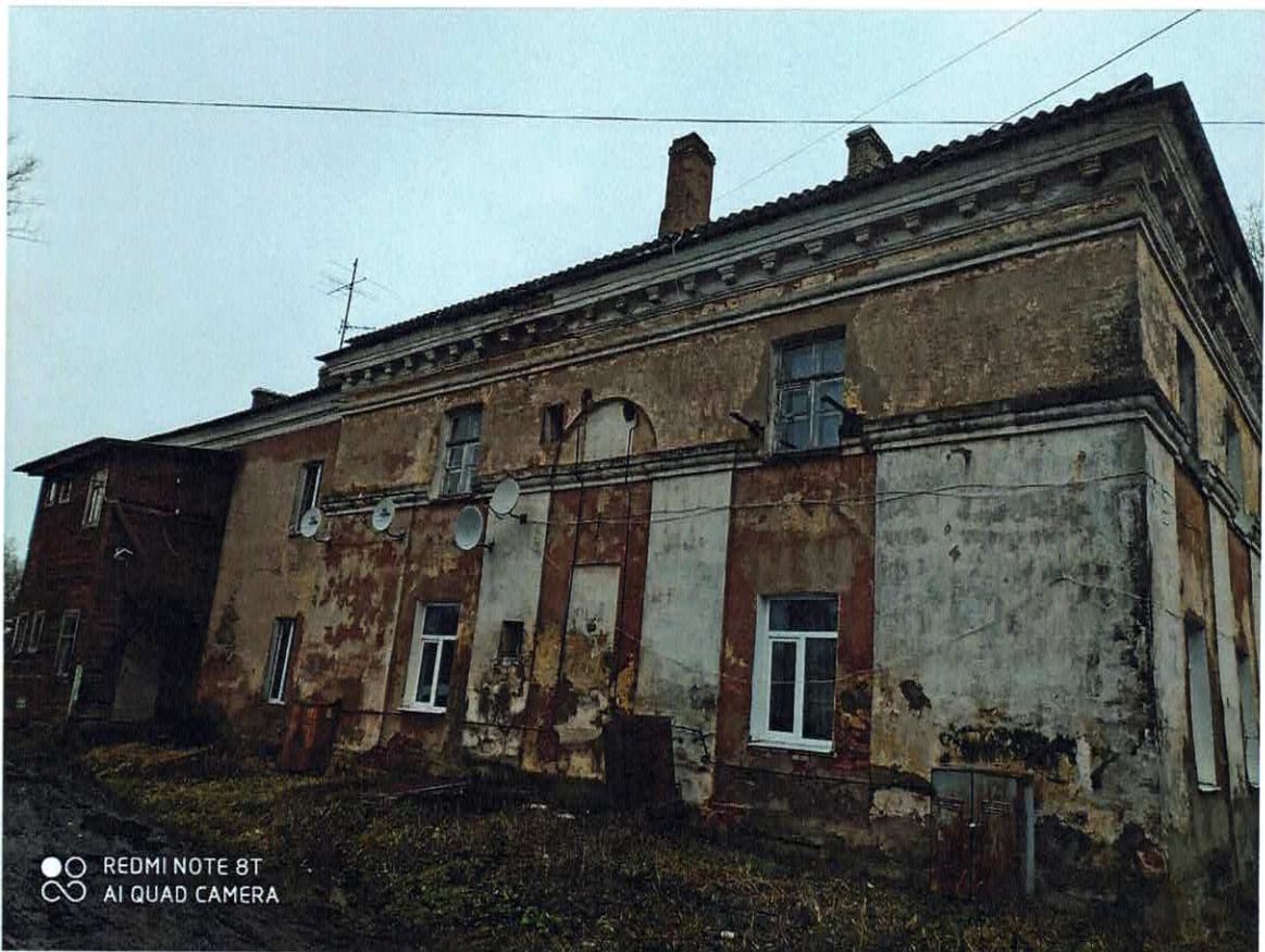
Рис. 4. Деревянная пристройка – крыльцо (южный фасад).