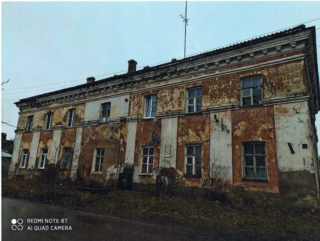
Рис. 1. Восточный фасад.