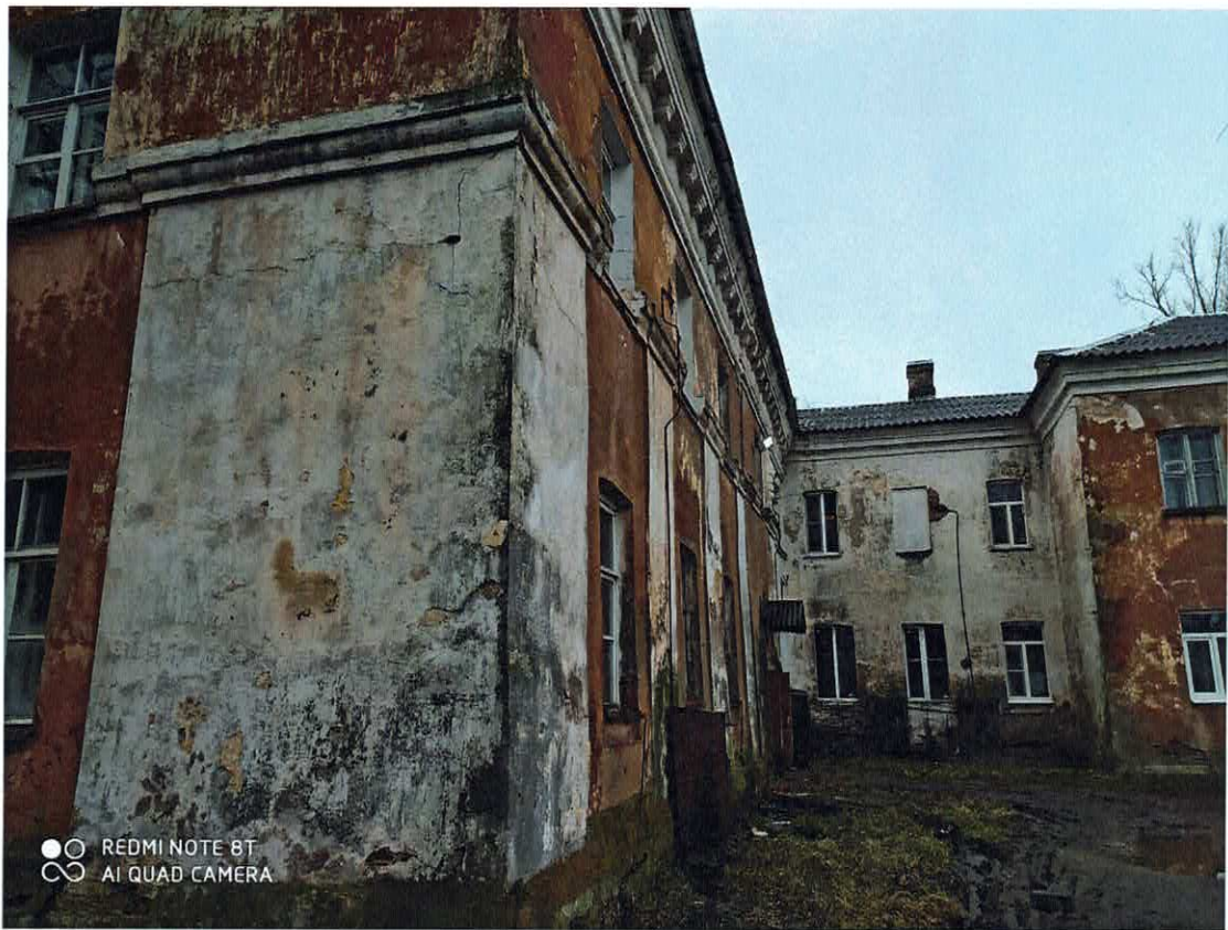
Рис. 3. Внутренний двор с запада.