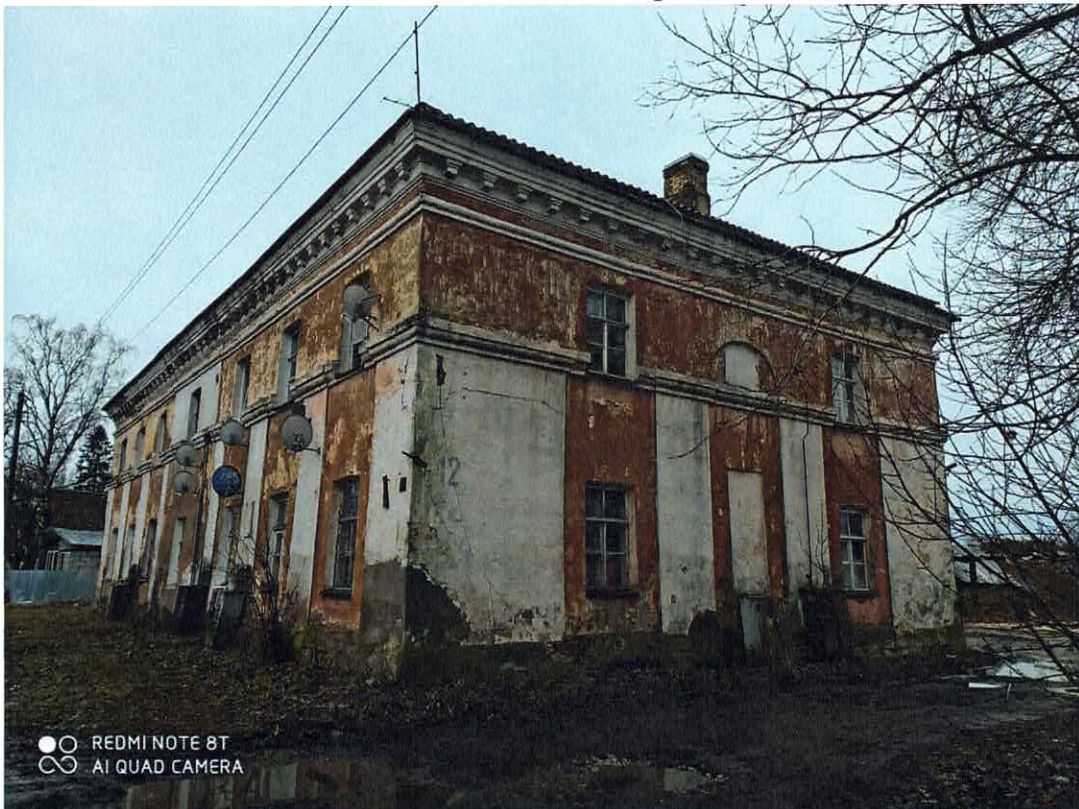
Рис. 2. Северо-восточный угол.