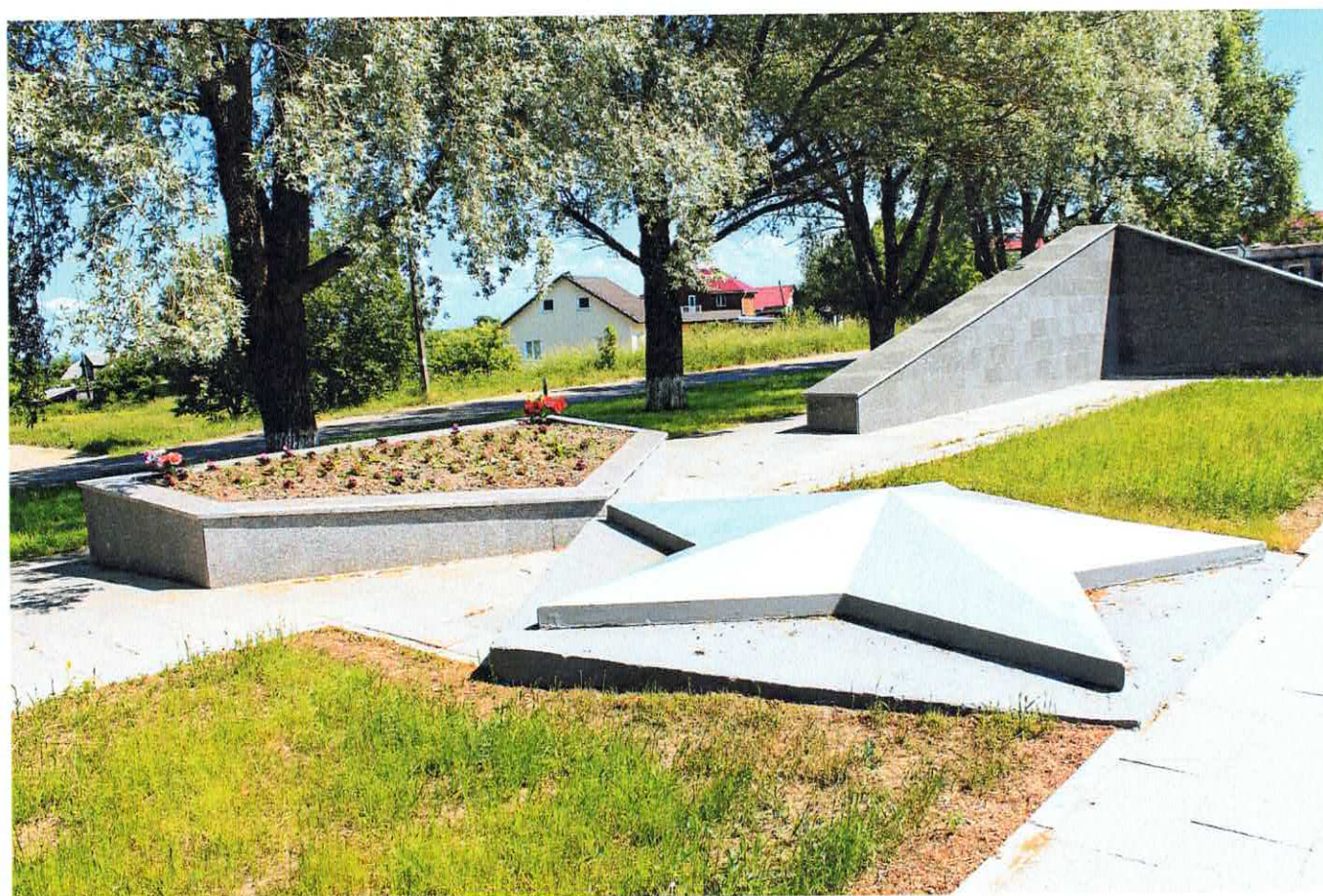
Рис. 10. Элемент «Звезда»