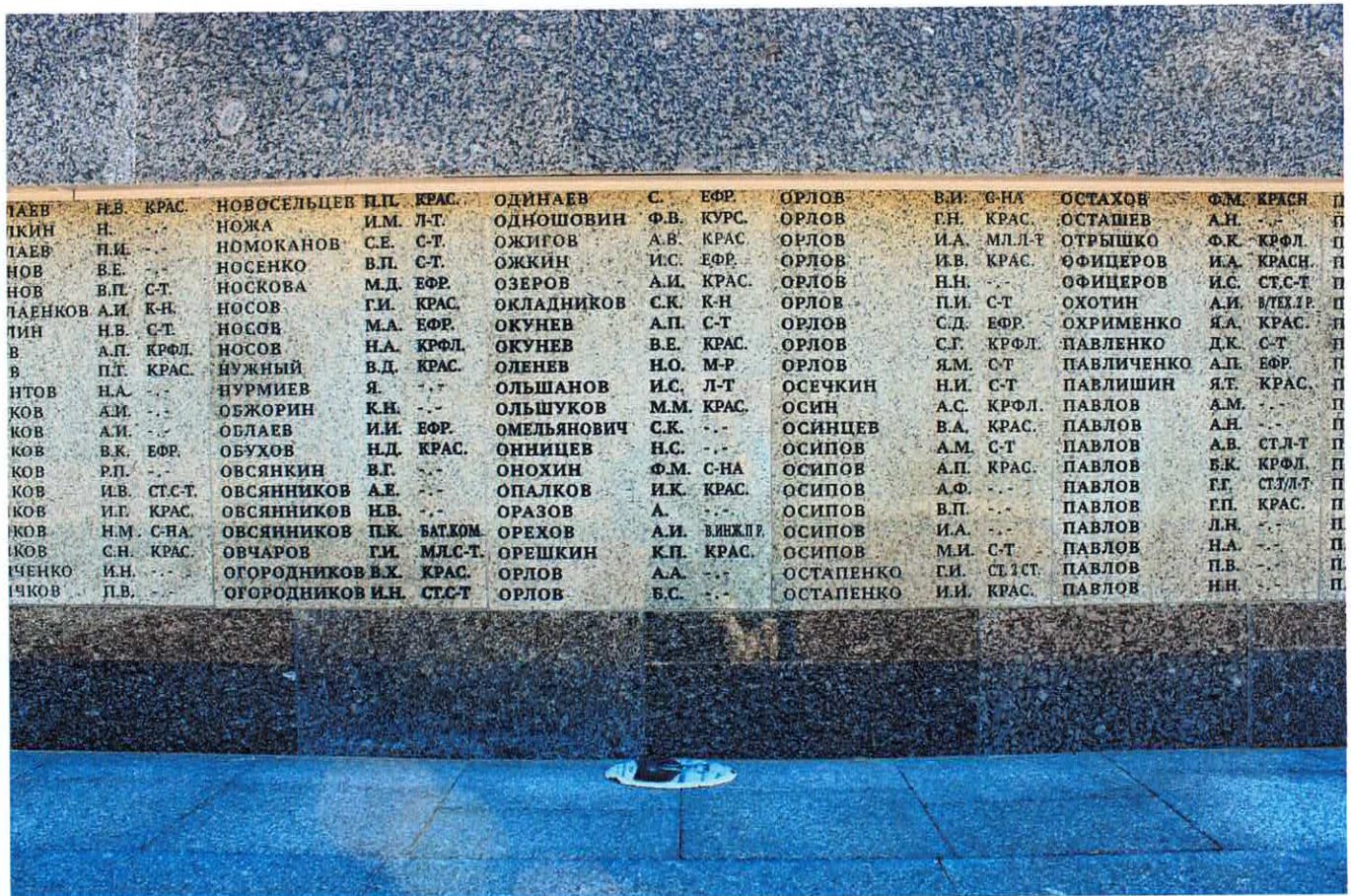
Рис. 8. Фрагмент восточной стенки с мемориальными досками