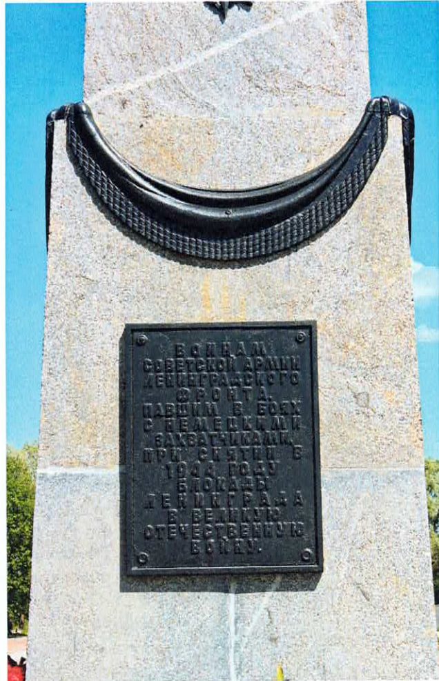
Рис. 4, 5. Фрагменты главного юго-западного фасада обелиска