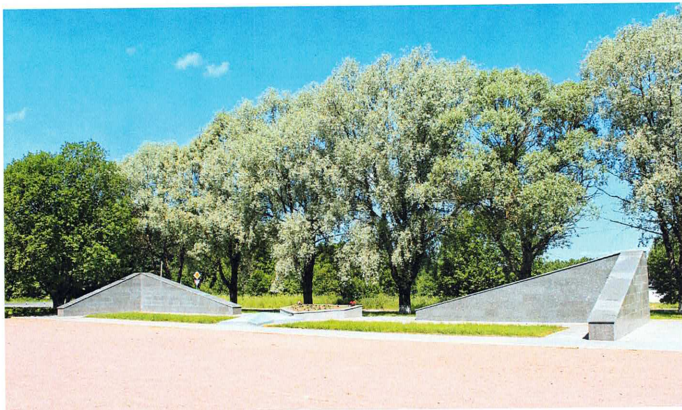
Рис. 9. Декоративные стенки с наклонными верхними гранями