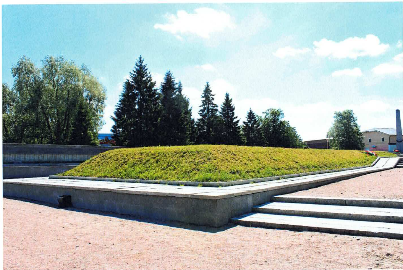
Рис. 6. Братская могила в виде искусственного холма. Вид с севера