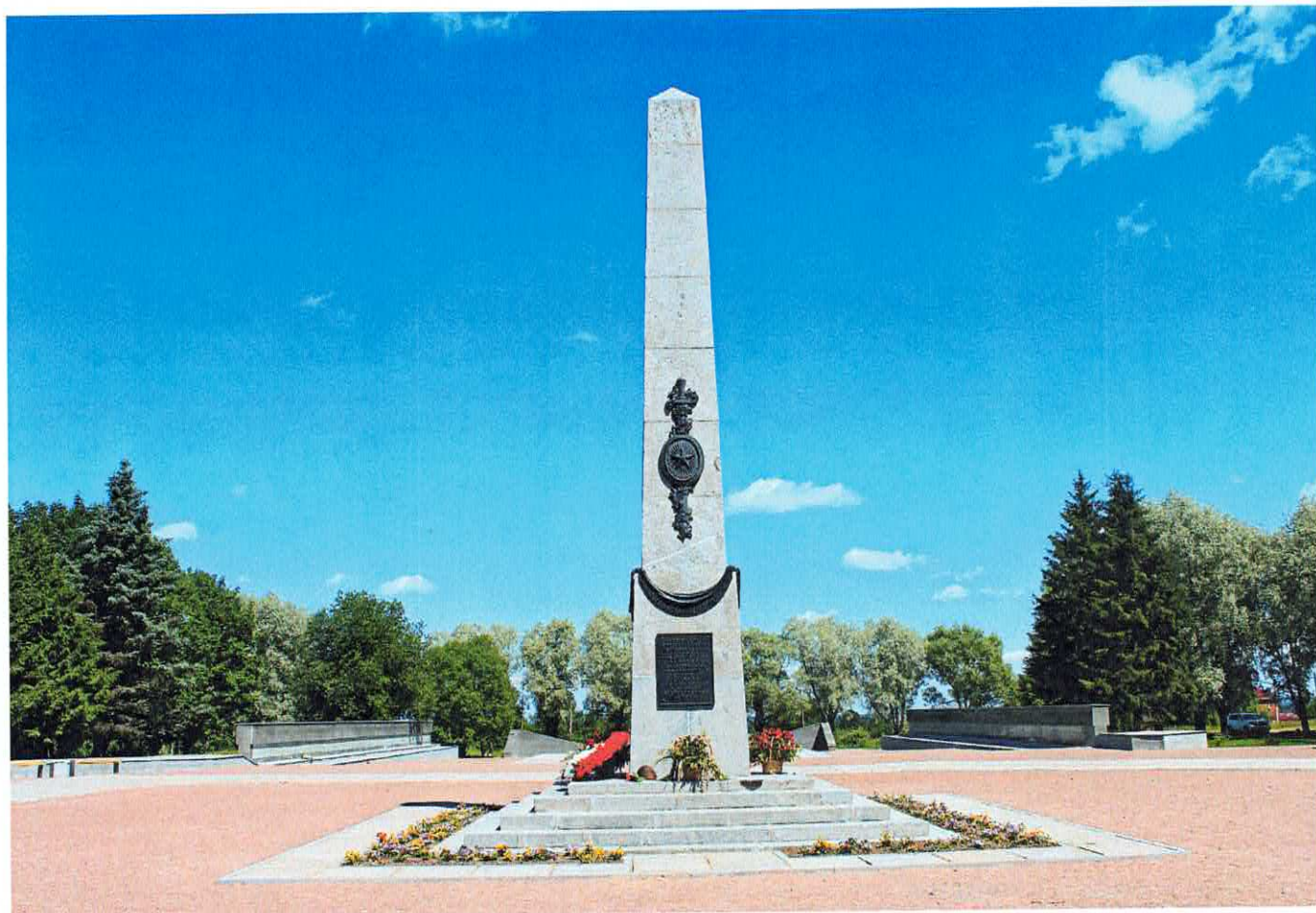
Рис. 1. Памятник «Гостилицкий». Общий вид с юго-запада