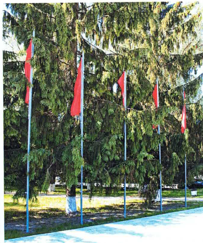
Рис. 2. Обелиск. Вид с северо-востока Рис. 3. Флагштоки на территории памятника