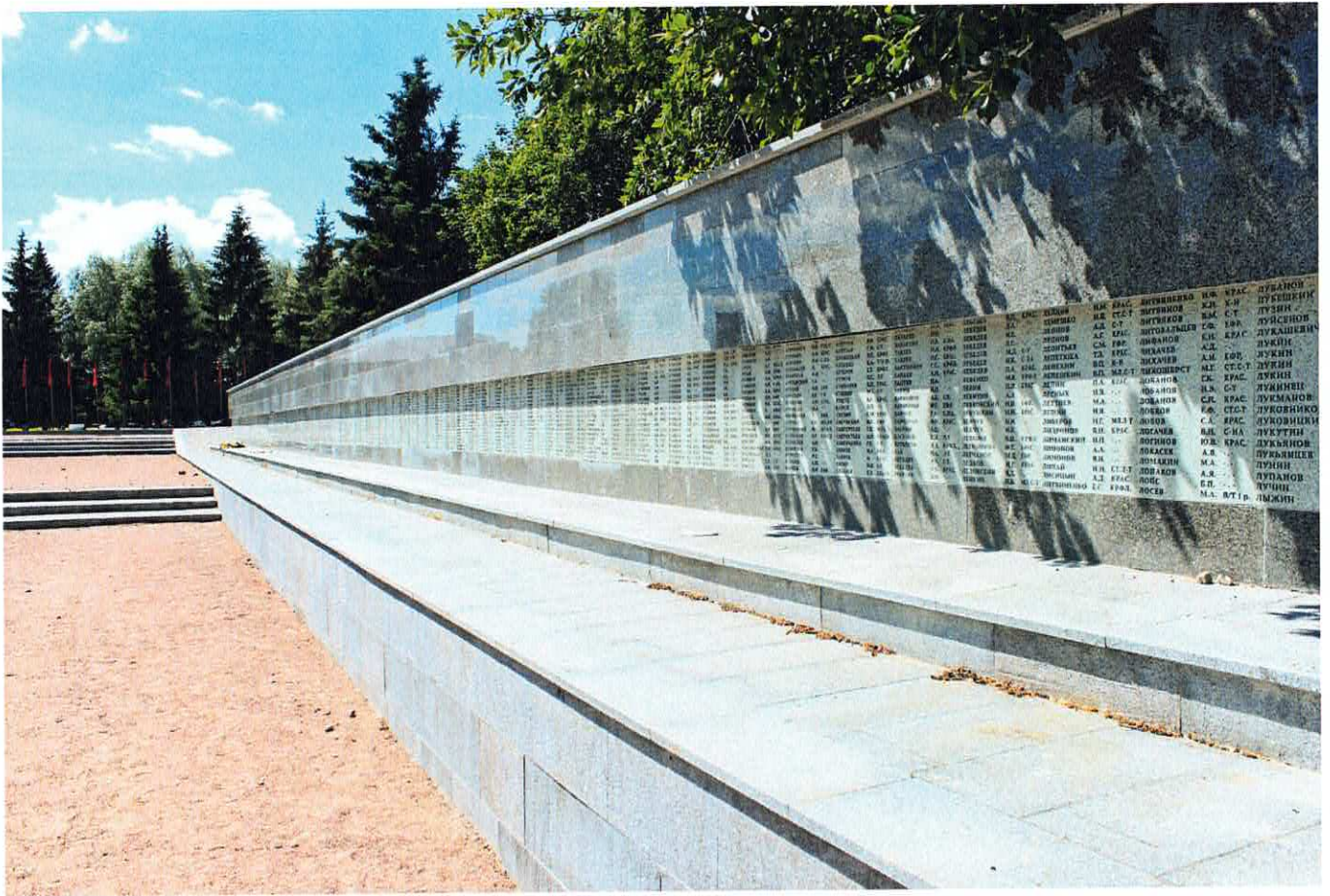
Рис. 7. Западная стенка с мемориальными досками