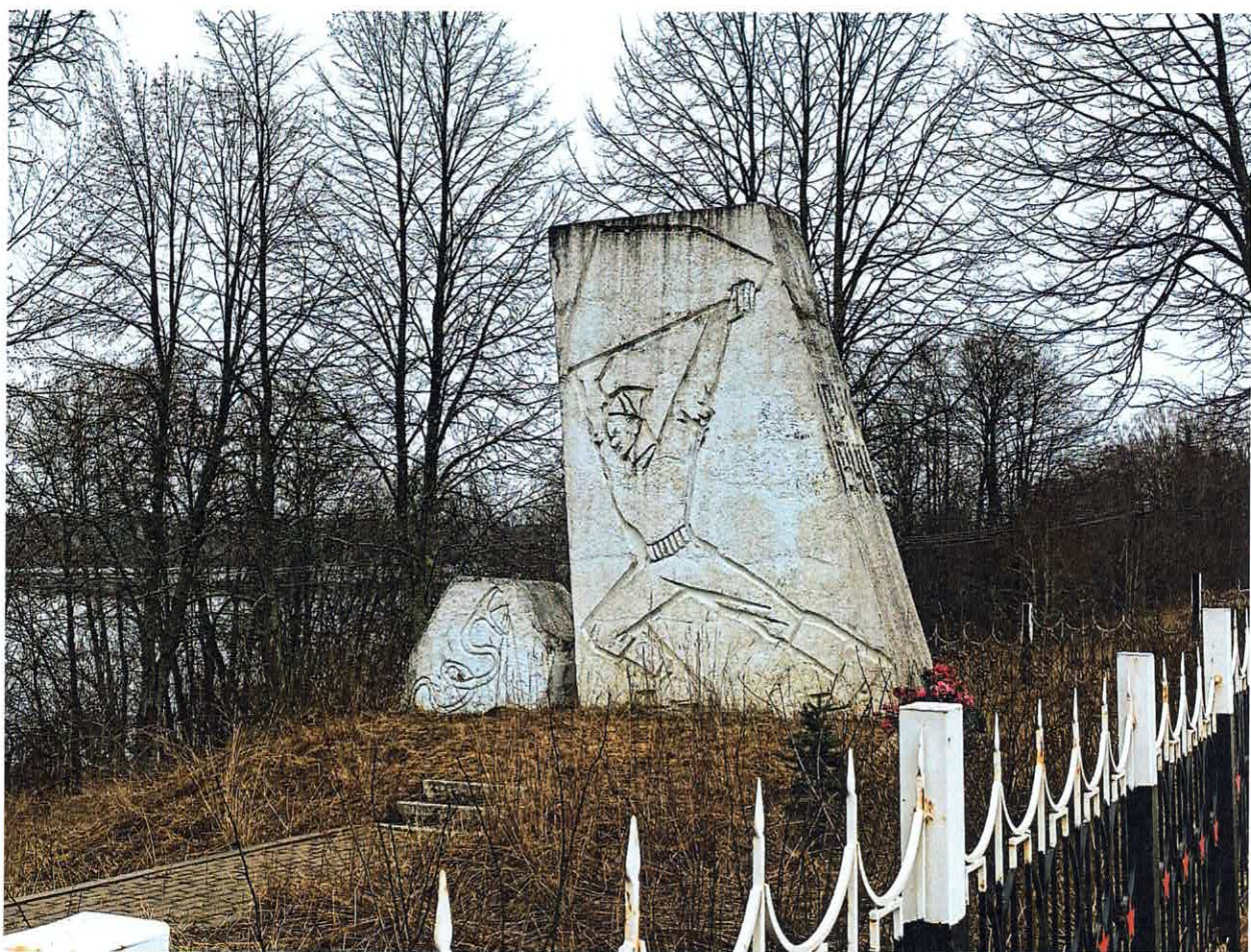
Рис. 2. Стела с изображением партизана, обрушивающего камень на змея. Вид с севера