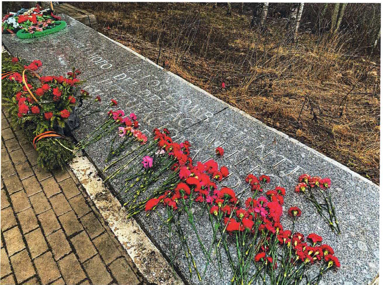
Рис. 6. Памятная плита с надписью, посвященной интернациональному отряду под командованием Эрнесто Франциско Гульбона