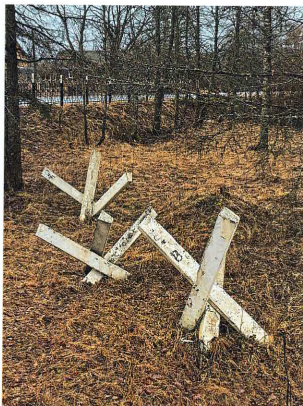
Рис. 8. Памятный камень, посвященный строителям и авторам мемориала. Рис. 9. Стилизованные бетонные противотанковые заграждения – «ежи».