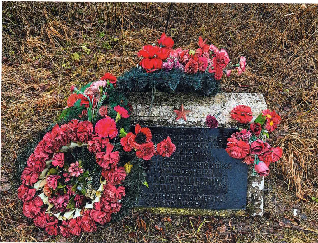
Рис. 7. Плита с надписью, посвященная партизанскому отряду под командованием Романова М.В.