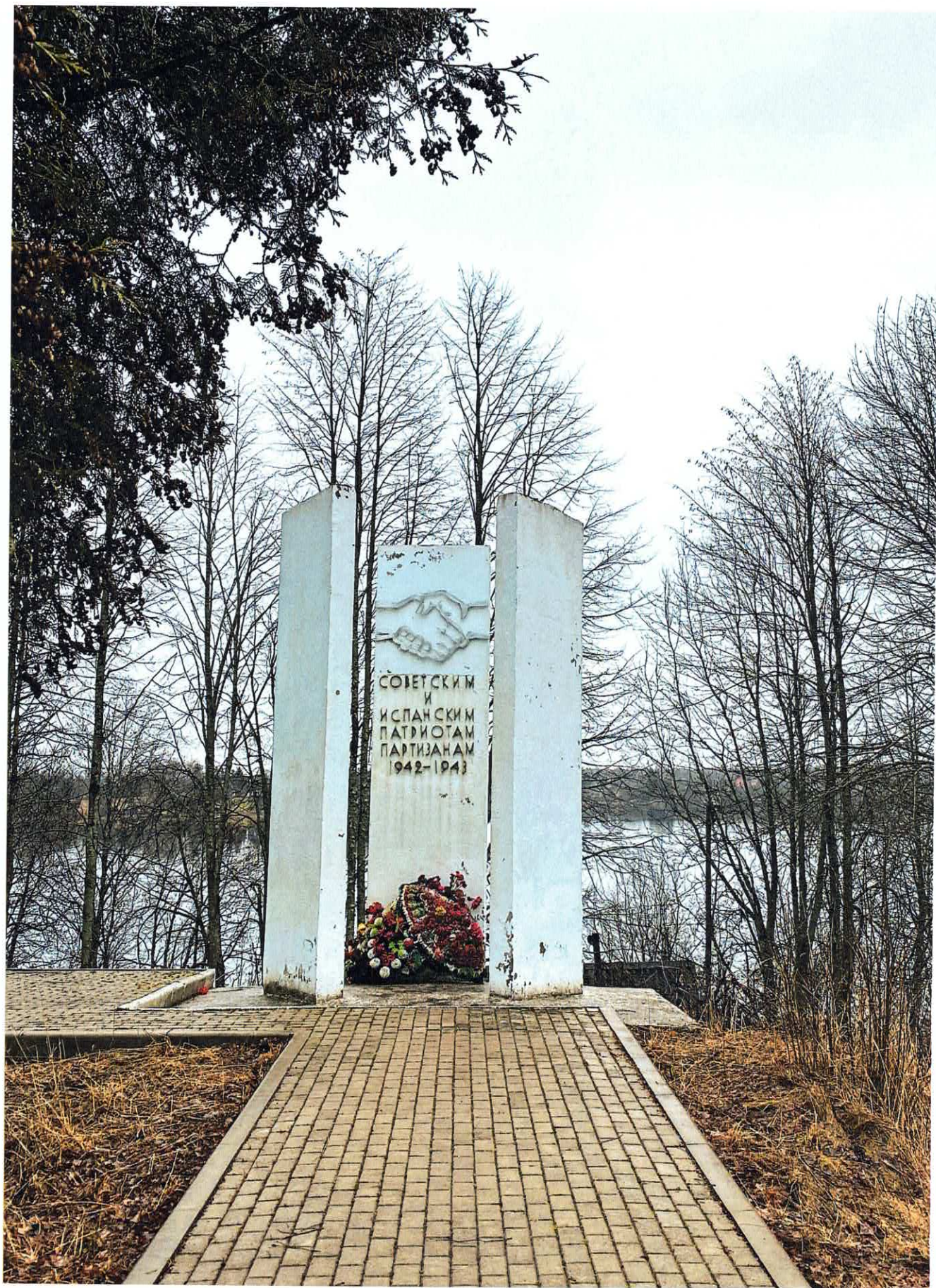
Рис. 1. Общий вид с северо-запада. Три стоящие рядом стелы