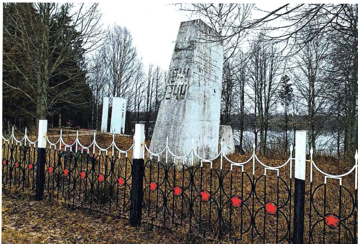
Рис. 3. Стела с изображением партизана, обрушивающего камень на змея. Вид с запада