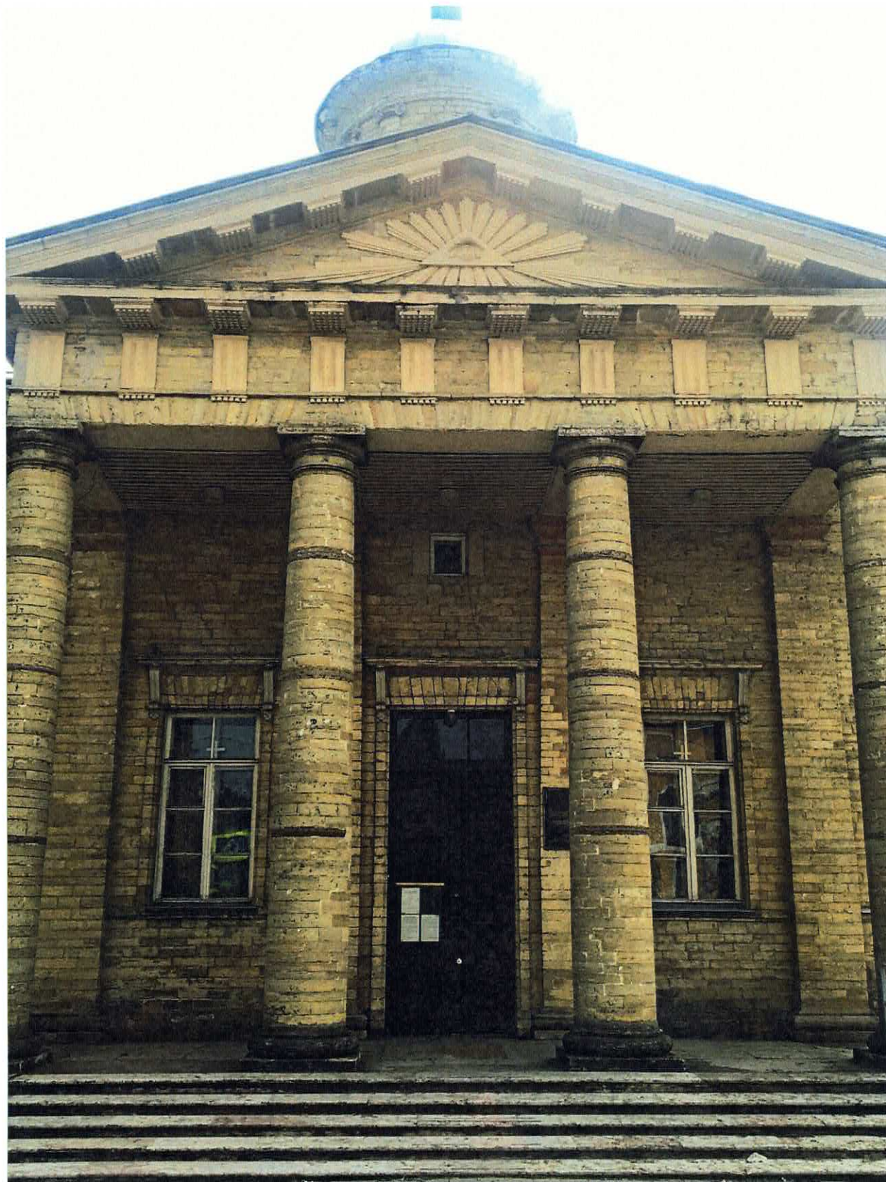
Фото 1. Николаевская кирха. Лицевой фасад. Дата съемки 16.03.2020 г.