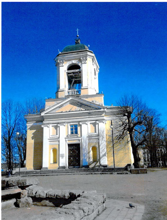
Фото № 1. Общий вид на центральный фасад.