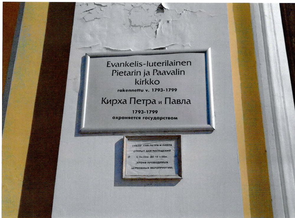
Фото № 6. Информационные надписи.