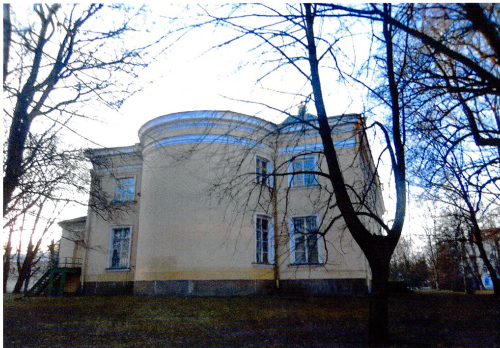
Фото № 3. Восточный фасад с полукруглой алтарной частью.