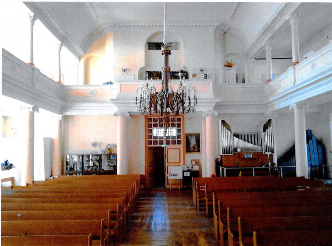
Фото № 4-5. Внутренние интерьеры.