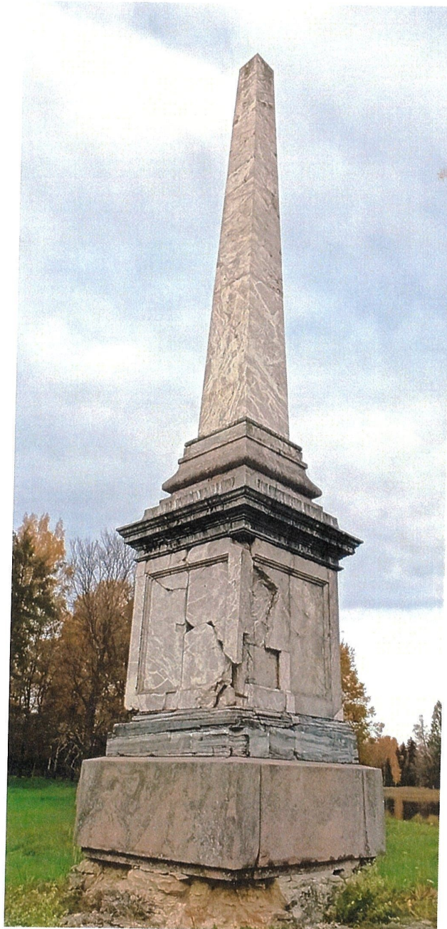
Фото 1. «Чесменский обелиск на Белом озере». Южный и восточный фасады

Фотографическое изображение объекта культурного наследия федерального значения «Чесменский обелиск на Белом озере», расположенного по адресу: Ленинградская область, Гатчинский район, г. Гатчина, Дворцовый парк, входящего в состав объекта культурного наследия федерального значения «Ансамбль Гатчинского дворца и парка» (фотофиксация выполнена 08.09.2021)