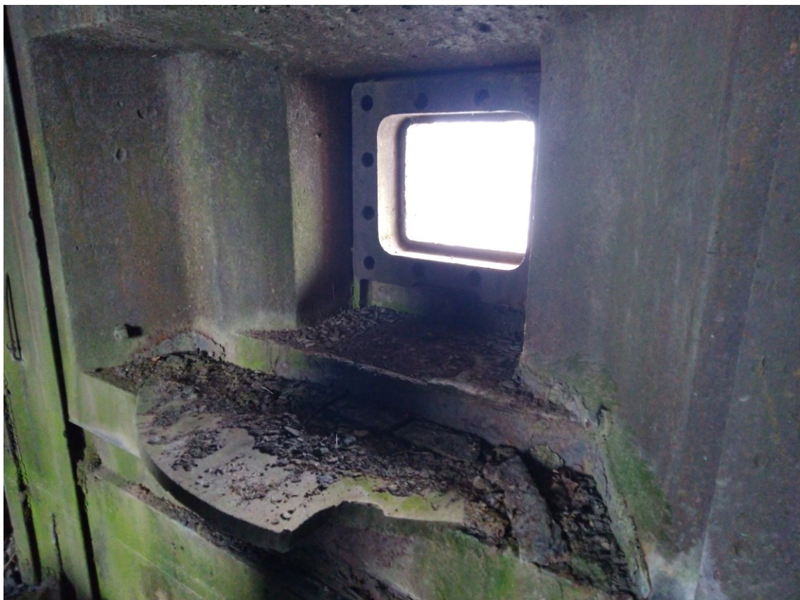
Фото 6. Амбразура ДОТа. 10.12.2021.