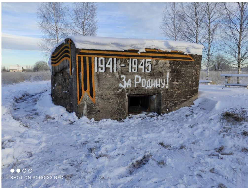
Фото 1. ДОТ с южной стороны. 10.12.2021