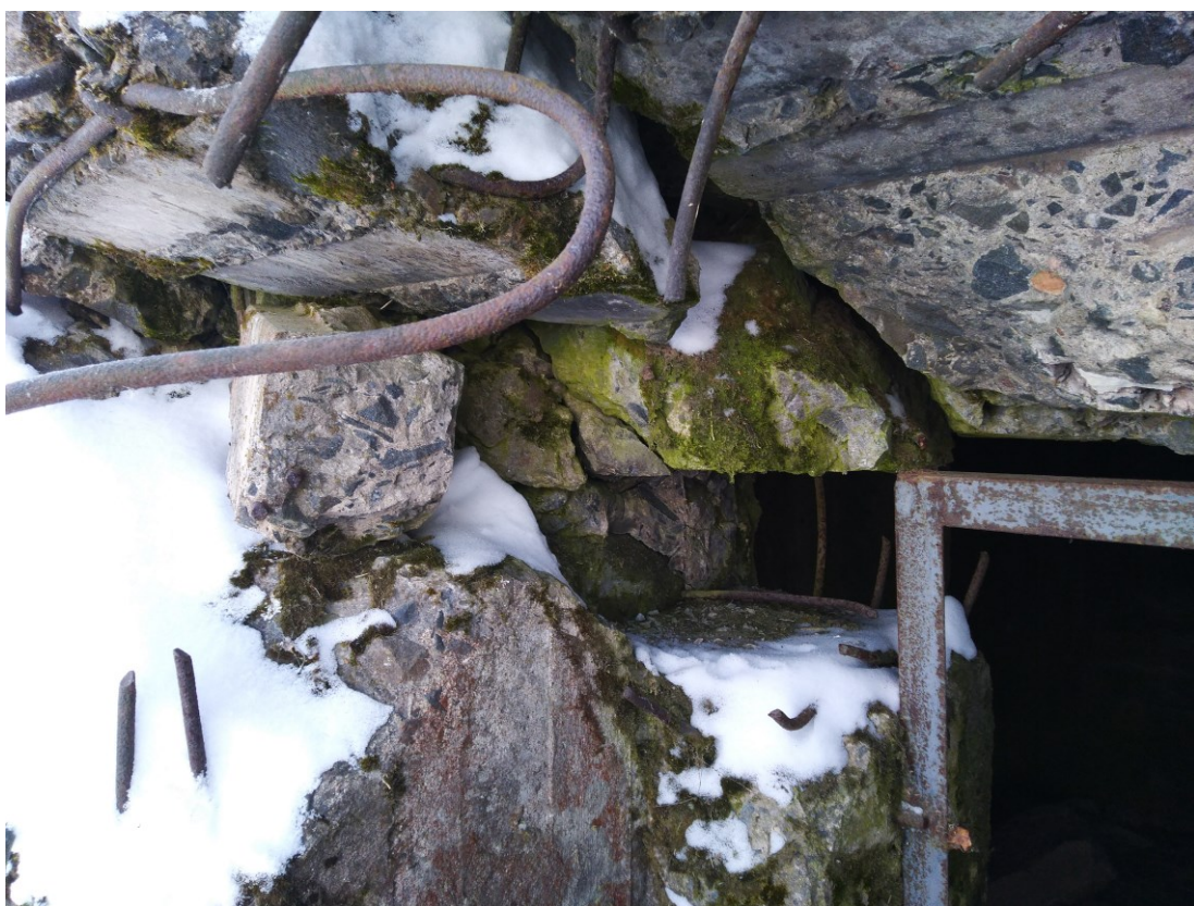
Фото 4. Трещина в стене ДОТа. 10.12.2021.