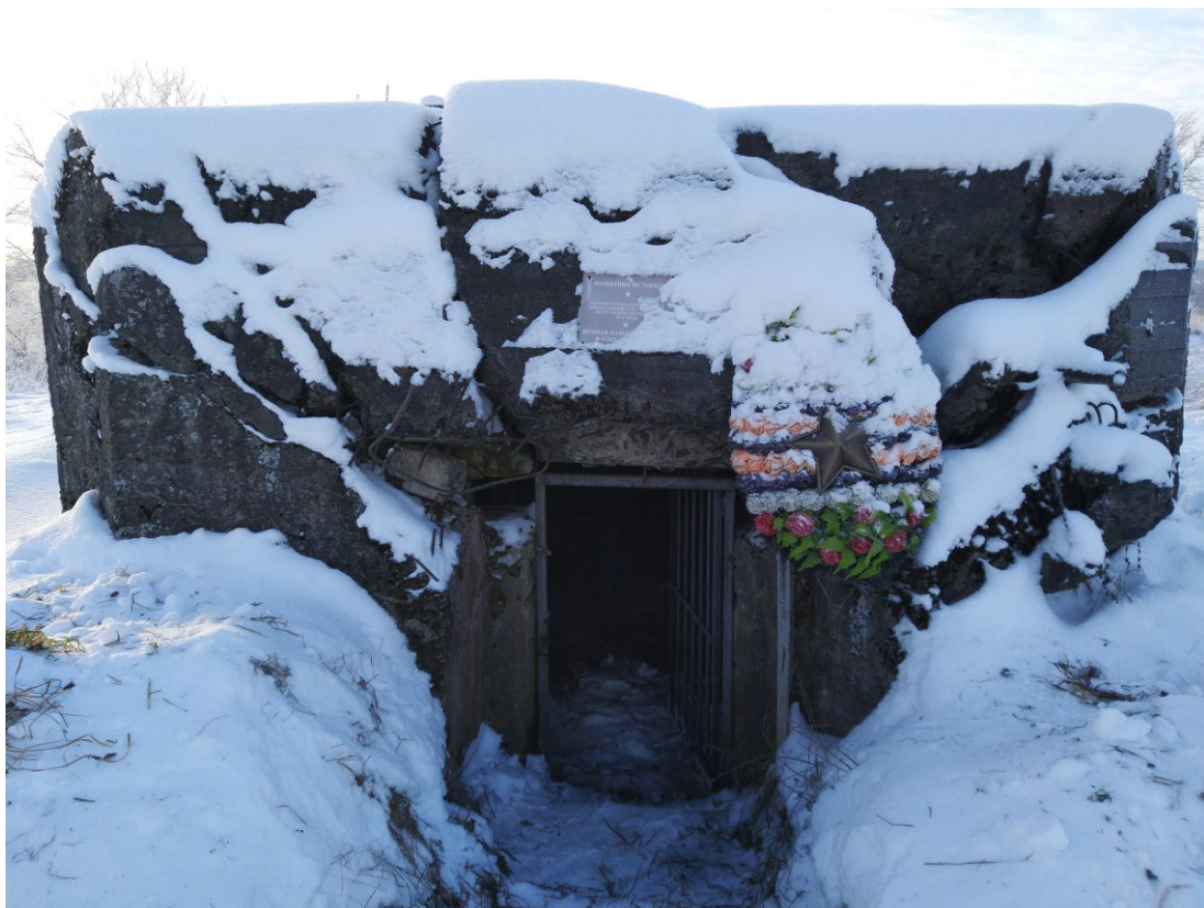
Фото 3. Северная часть ДОТа. 10.12.2021.