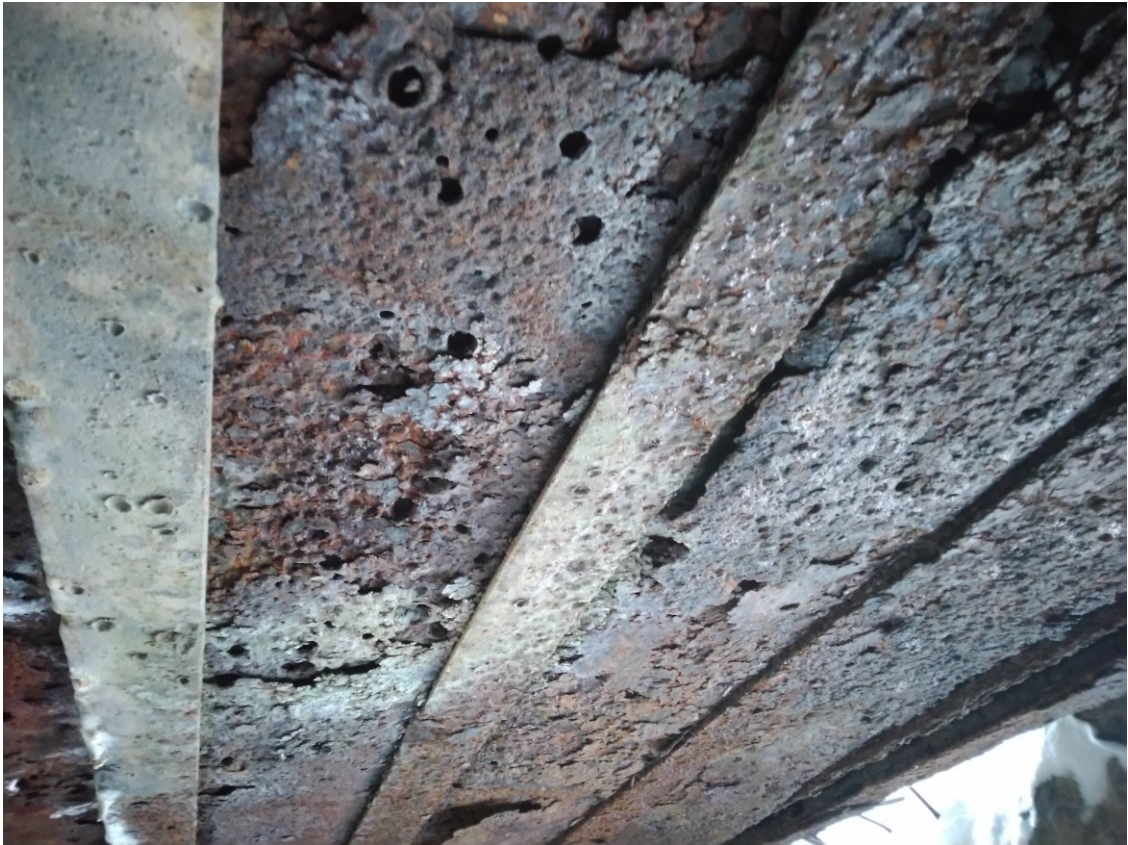
Фото 5. Перекрытие ДОТа. Металлические элементы. 10.12.2021.