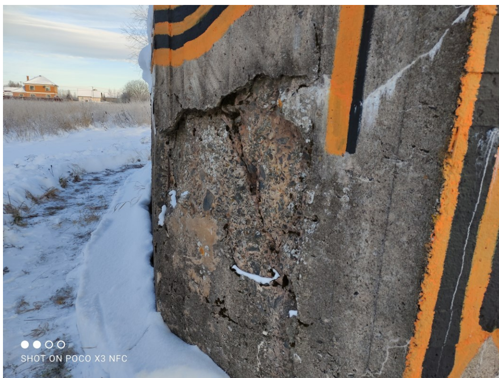
Фото 2. ДОТ с западной стороны. 10.12.2021