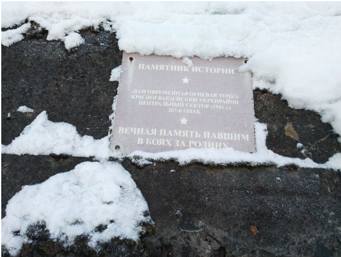
Фото 7. Памятная надпись. 10.12.2021.