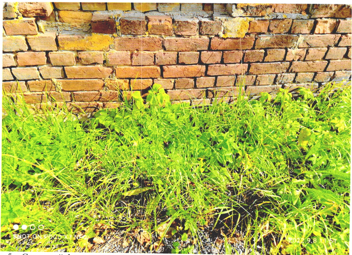
Фото 5. «Северный флигель хозяйственного корпуса» цокольный блок с северной стороны.