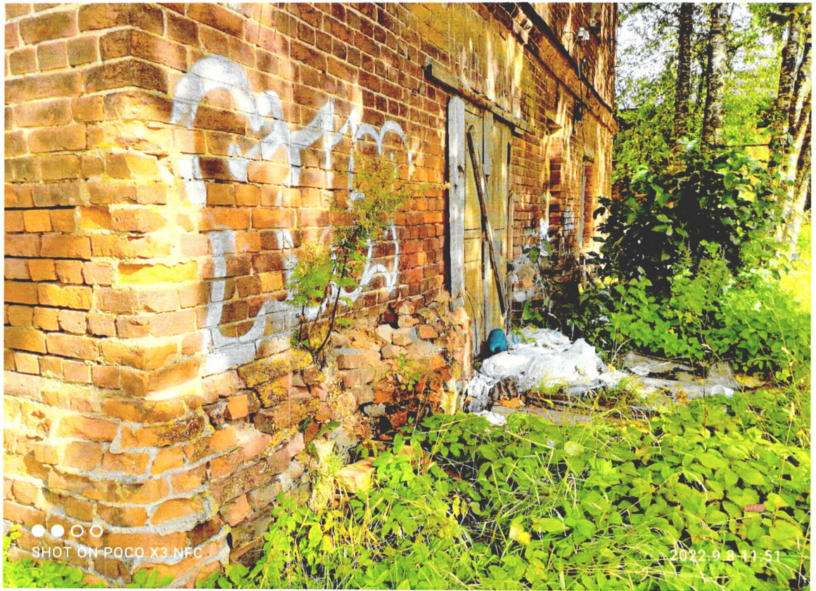
Фото 4. «Северный флигель хозяйственного корпуса» граффити на южном фасаде, на цокольном блоке наблюдается растительность.