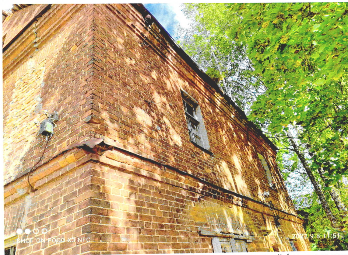
Фото 3. «Северный флигель хозяйственного корпуса» южный фасад, отсутствует водосточная труба.