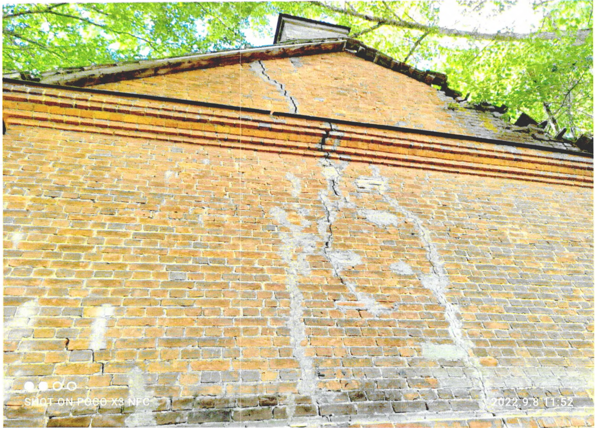
Фото 8. «Северный флигель хозяйственного корпуса» сквозная трещина на восточном фасаде, идущая от фундамента до кровли.