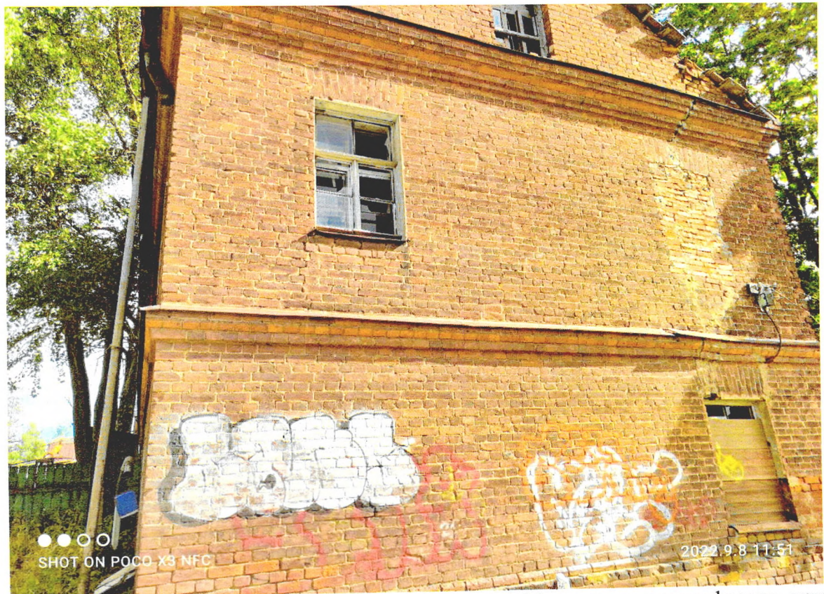
Фото 7. «Северный флигель хозяйственного корпуса» граффити на западном фасаде, сквозная трещина, идущая от фундамента до кровли.