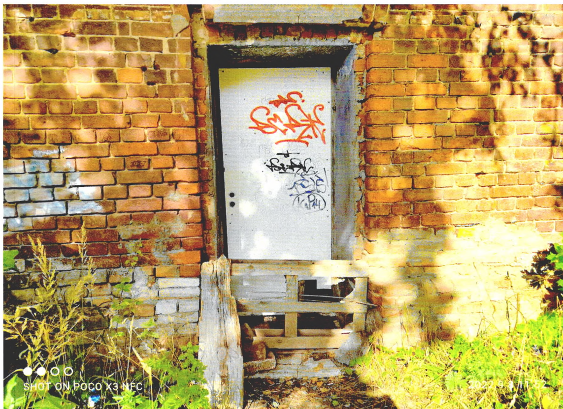
Фото 2. «Северный флигель хозяйственного корпуса», доступ в северный флигель закрыт. Наблюдаются следы некачественного ремонта цокольного блока.