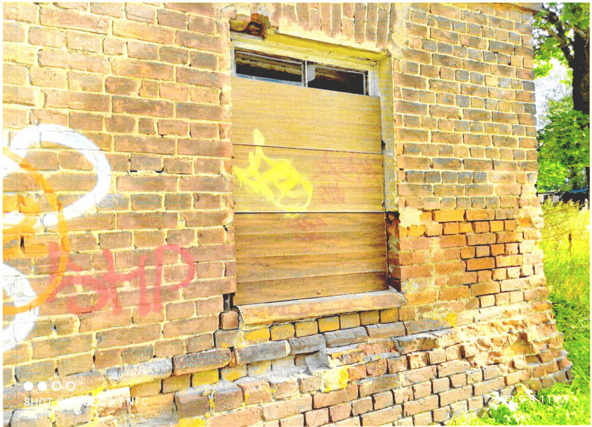
Фото 6. «Северный флигель хозяйственного корпуса» разрушенный цокольный блок на углу здания.