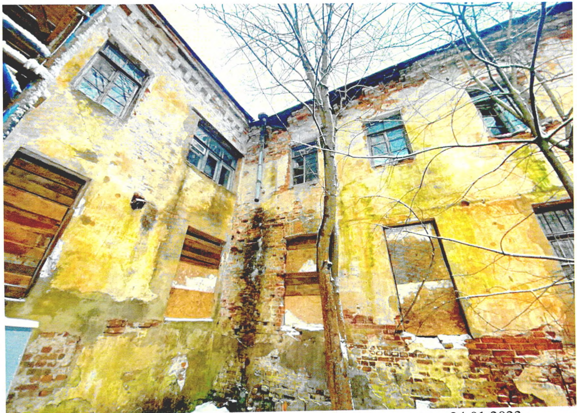
Фото 3. «Дом жилой купеческий» дворовой фасад здания 24.01.2023г.