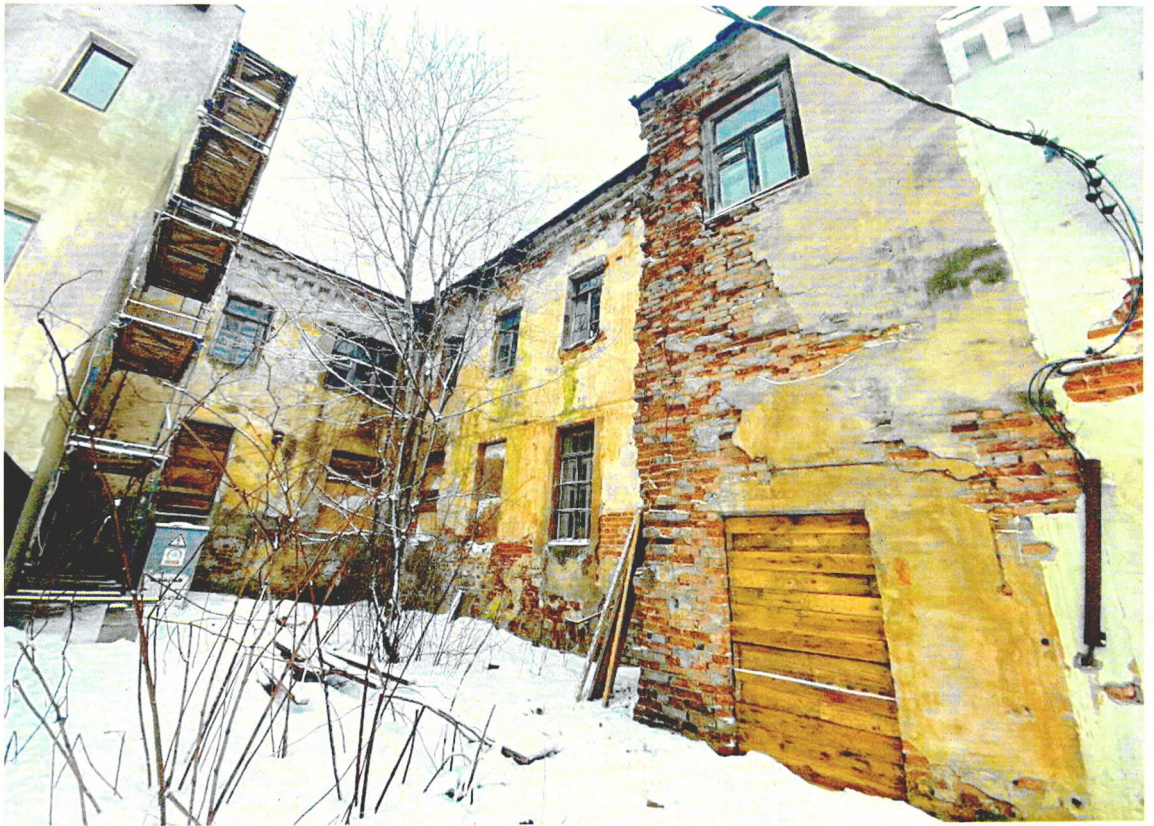
Фото 2. «Дом жилой купеческий» дворовая территория. 24.01.2023г.