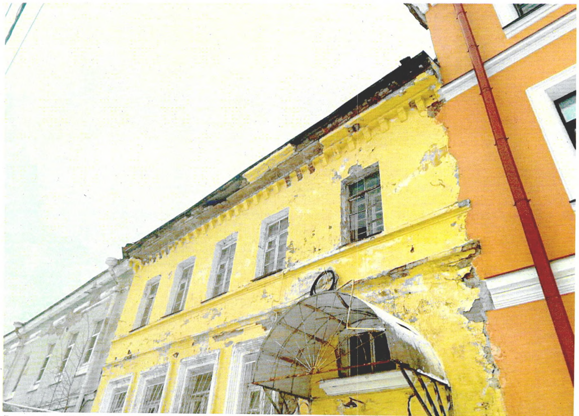
Фото 5. «Дом жилой купеческий» карнизы и межэтажные тяги со стороны Красной площади. 24.01.2023г.