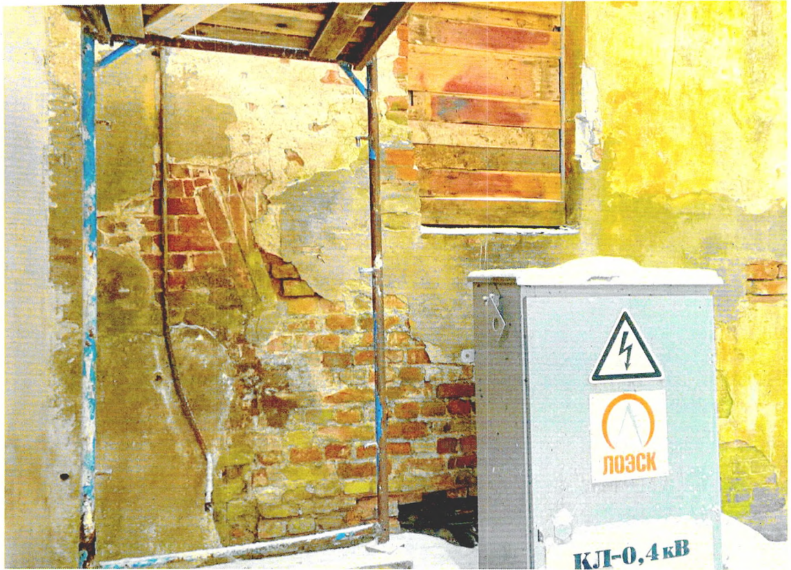
Фото 4. «Дом жилой купеческий» стена дворового фасада 24.01.2023г.