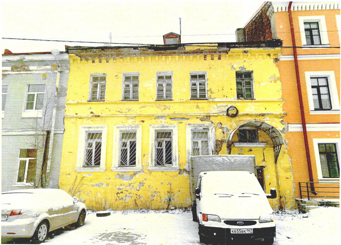
Фото 1. «Дом жилой купеческий» лицевой фасад со стороны Красной площади. 24.01.2023г.

Фотофиксация объекта культурного наследия регионального значения «Дом жилой купеческий», 2-я пол. XIX в., по адресу: Ленинградская область, Кировский район, г. Шлиссельбург, Красная пл., 2 от 24.01.2023