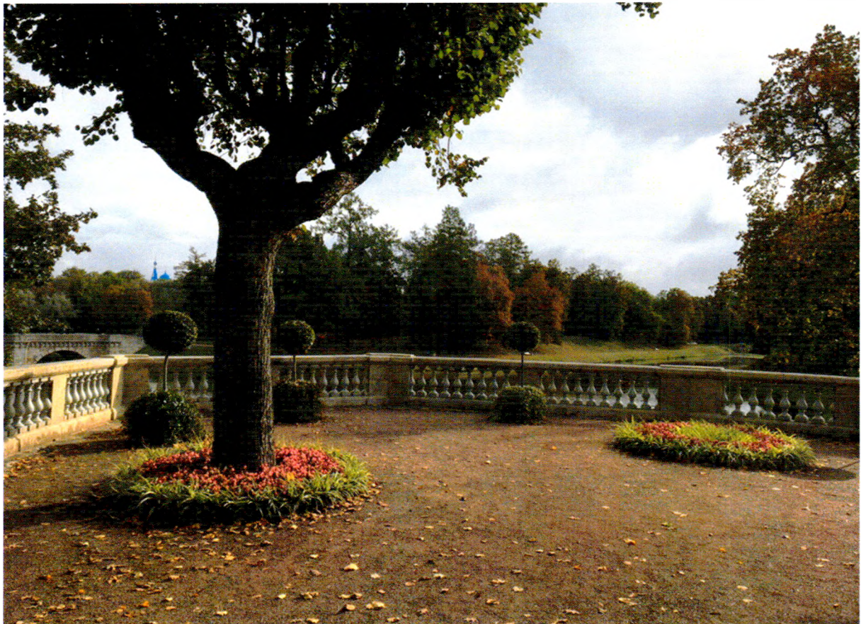
Фото 1. «Терраса Собственного садика и металлическая ограда». Общий вид верхней террасы.

Фотографическое изображение объекта культурного наследия федерального значения «Терраса Собственного садика и металлическая ограда», 1796 г., входящего в состав объекта культурного наследия федерального значения «Ансамбль Гатчинского дворца и парка», по адресу: Ленинградская область, Гатчинский муниципальный район, г. Гатчина, Дворцовый парк. (фотофиксация выполнена 23.09.2022)