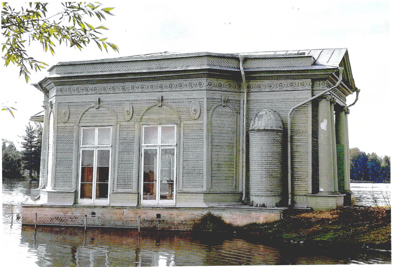
Фото 1. «Павильон Венеры». Вид с восточной стороны.

Фотографическое изображение объекта культурного наследия федерального значения «Павильон Венеры», 1792-1797 гг., входящего в состав объекта культурного наследия федерального значения «Ансамбль Гатчинского дворца и парка», по адресу: Ленинградская область, Гатчинский муниципальный район, г. Гатчина, Дворцовый парк. (фотофиксация выполнена 23.09.2022)