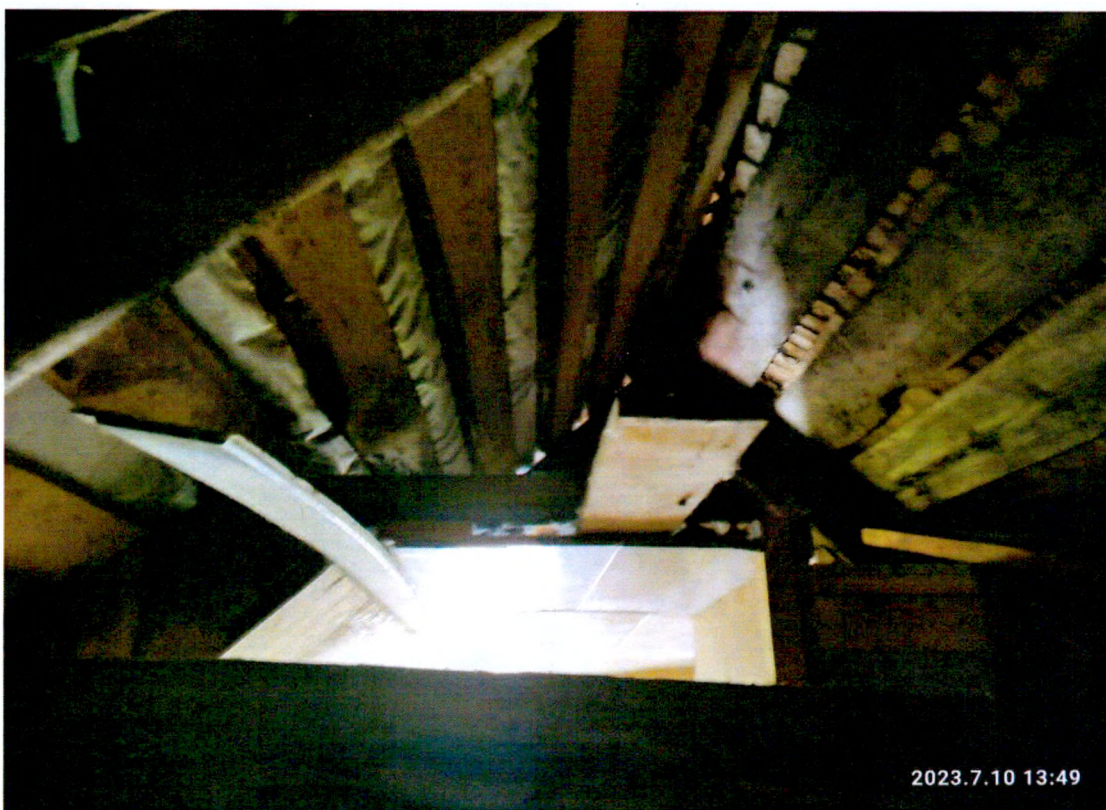
Фото 4. «Дом Т.С. Егоровой, Т.Н. Прохоровой, А.М. Раскатовой, Л.Н. Родионовой» чердачное помещение.