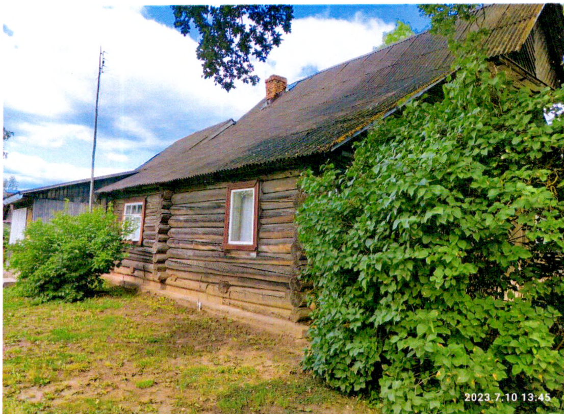
Фото 6. «Дом Т.С. Егоровой, Т.Н. Прохоровой, А.М. Раскатовой, Л.Н. Родионовой» юго-восточный фасад здания.