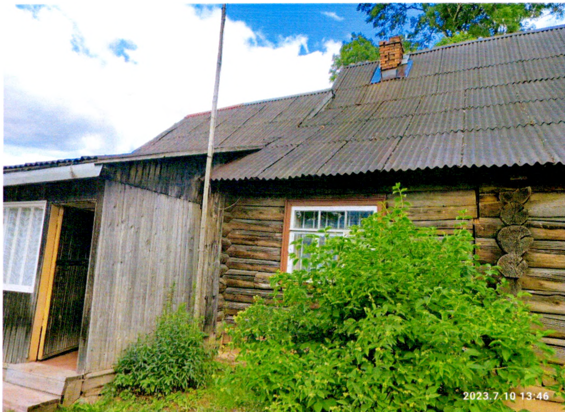
Фото 2. «Дом Т.С. Егоровой, Т.Н. Прохоровой, А.М. Раскатовой, Л.Н. Родионовой» южный фасад здания, крыльцо с тамбуром.