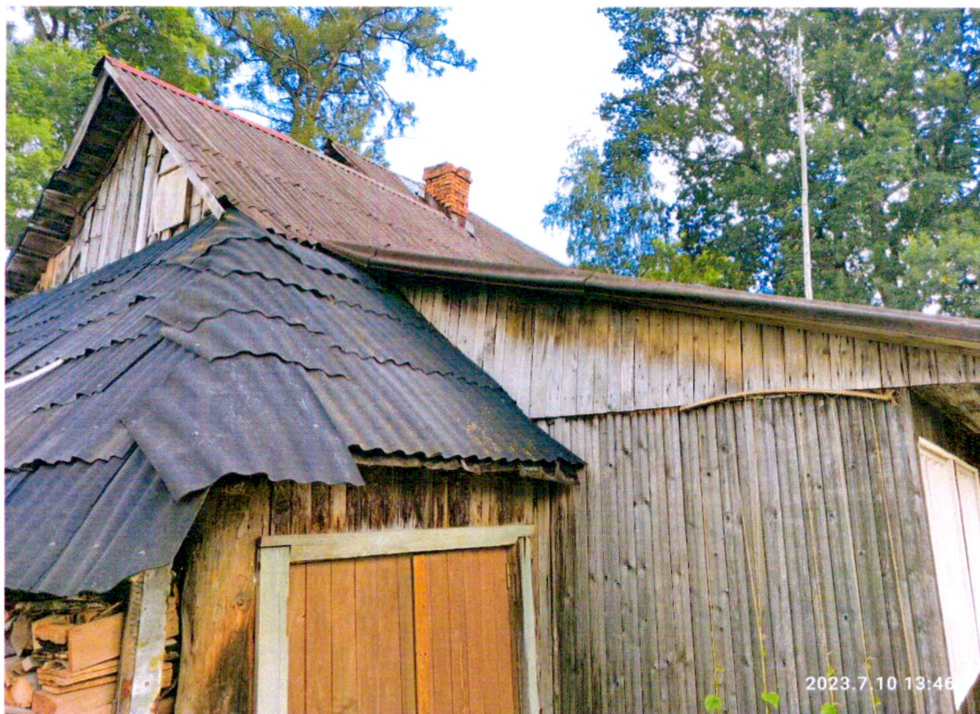
Фото 3. «Дом Т.С. Егоровой, Т.Н. Прохоровой, А.М. Раскатовой, Л.Н. Родионовой» пристройка здания.