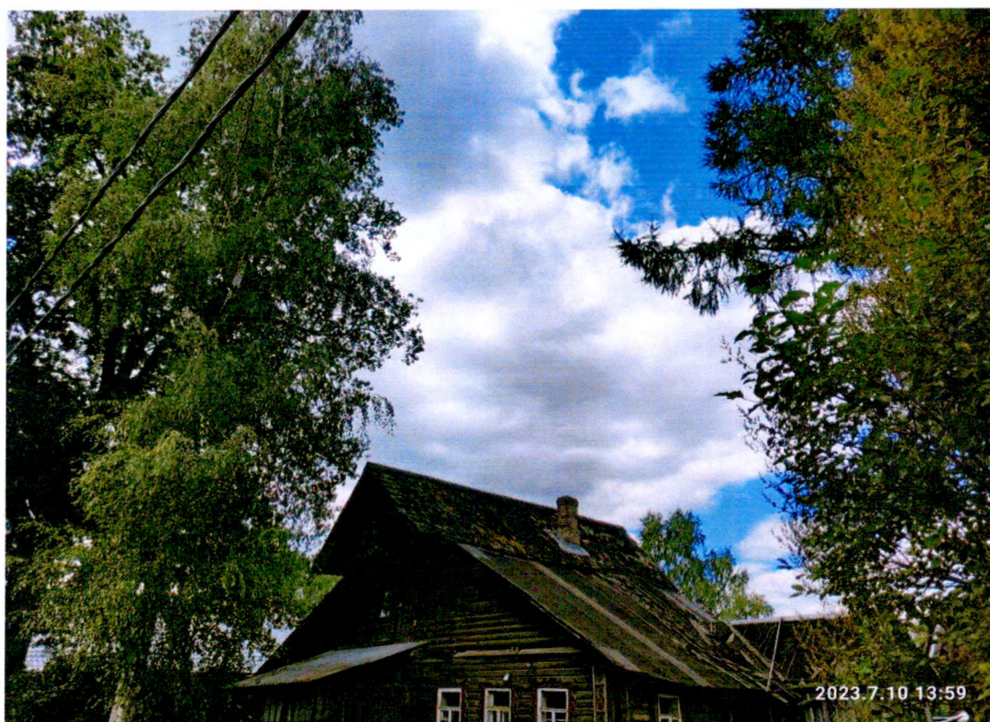
Фото 5. «Дом Т.С. Егоровой, Т.Н. Прохоровой, А.М. Раскатовой, Л.Н. Родионовой» Северо-восточный фасад, зафиксировано обрушения части кровли внутрь здания.