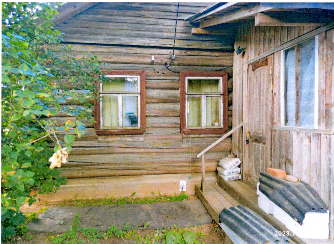
Фото 8. «Дом Т.С. Егоровой, Т.Н. Прохоровой, А.М. Раскатовой, Л.Н. Родионовой» пристройка с восточного фасада здания.