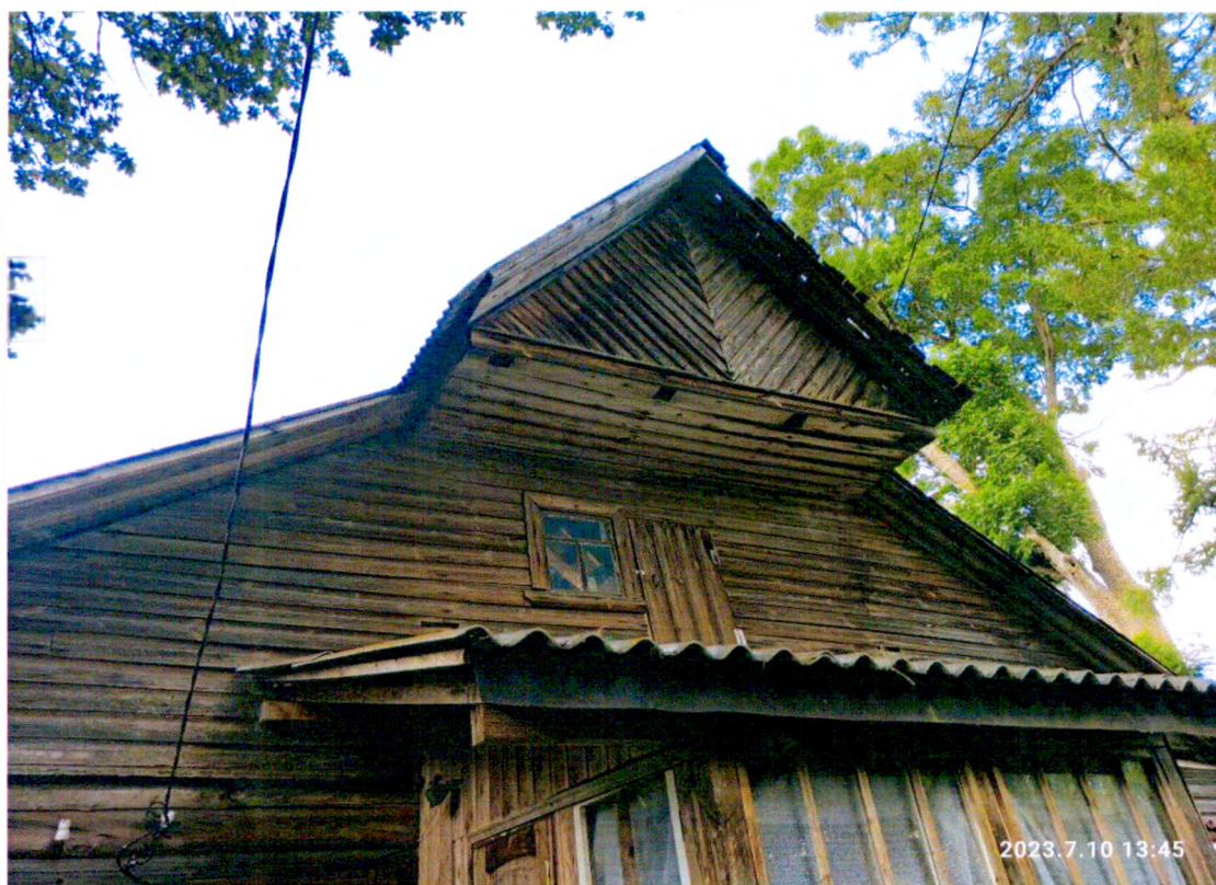
Фото 7. «Дом Т.С. Егоровой, Т.Н. Прохоровой, А.М. Раскатовой, Л.Н. Родионовой» восточный фасад здания.