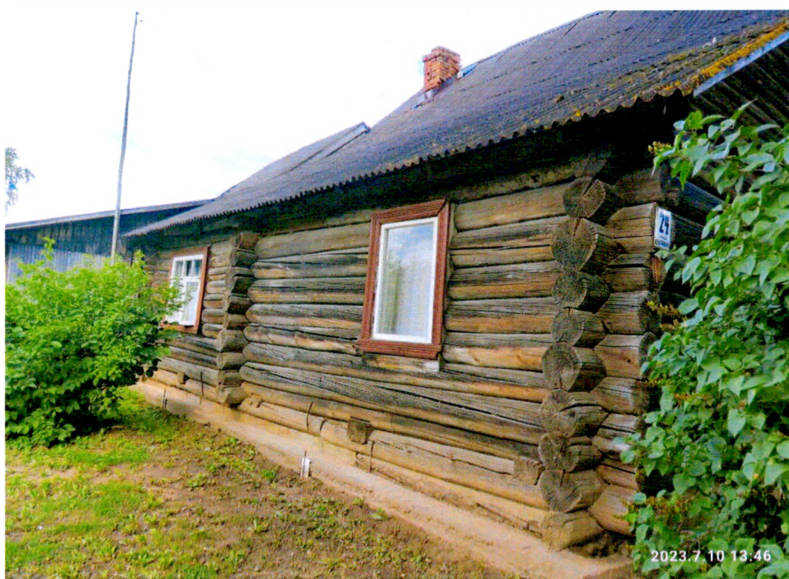
Фото 1. «Дом Т.С. Егоровой, Т.Н. Прохоровой, А.М. Раскатовой, Л.Н. Родионовой» южный фасад здания, бетонный фундамент.

Ленинградская область, Гатчинский муниципальный район, Дружнoгорское городское поселение, д.Лампово, ул. Центральная д.24. (10.07.2023)